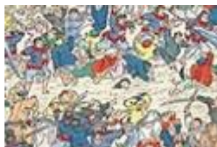
ภาพที่ 20 เครื่องแต่งกายของกองกำลังไท่ผิงเทียนกั๋วในภาพที่ 7

โดยเหตุการณ์ของการศึกภายในรูปจะเป็นดังต่อไปนี้