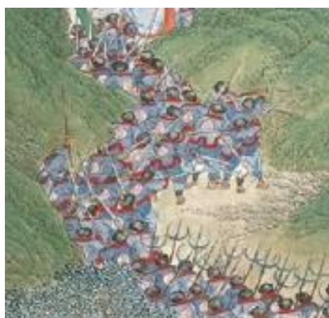
ภาพที่ 25 เครื่องแต่งกายของกองทัพชิงในภาพที่ 11

ยุทธการพิชิตนครจินหลิง จากที่เห็นในภาพจะเป็นการสู้รบบนบกบุกตีกำแพงเมือง ซึ่งเมืองมีขนาดใหญ่กินพื้นที่ส่วนมากของรูป จากการสังเกตจากทิศทางที่ปืนเป็นแม่น้ำทางด้านขวาบนของรูป แสดงให้เห็นว่าภาพนี้เป็นการรบบนเนินเขา และในขณะเดียวกันก็มีการเคลื่อนกำลังพลเสริมตามมาทางแม่น้ำ โดยในรูปแสดงให้เห็นถึงการรบที่ดุเดือดทั้งในเมืองและบนแนวปราการของเมือง โดยด้านนอกเมืองจะเห็นทหารของราชวงศ์ชิงที่ใส่เครื่องแบบสีฟ้าสลับแดงจำนวนมากกำลังเคลื่อนพลเพื่อทำการบุกเข้าเมืองจากหลายทิศทาง บางส่วนกำลังปืนข้ามกำแพงเมือง ส่วนทางด้านซ้ายของรูป ทหารของราชวงศ์ชิงกำลังบุกเข้าไปในเมืองผ่านกำแพงเมืองที่พังทลายลงมา สำหรับการต่อสู้นั้นได้ดำเนินไปอย่างดุเดือด เมื่อสังเกตจากกลุ่มควันที่อยู่ภายในเมือง โดยโทนสีหลักของรูปจะเป็นสีเขียวที่มาจาก ป่าไม้และภูเขา กับสีเทาอมฟ้าที่มาจากกำแพงเมือง ต้นไม้ และเครื่องแบบทหาร (ภาพที่ 11)