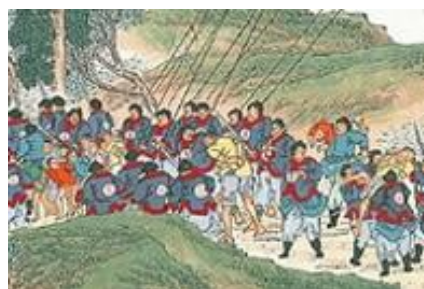
ภาพที่ 27 นักโทษหงฝูเจิน

โดยเหตุการณ์ของการศึกภายในรูปจะเป็นดังต่อไปนี้