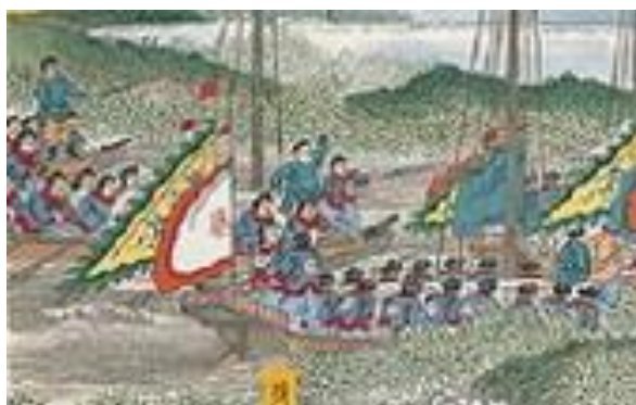
ภาพที่ 21 เครื่องแต่งกายของกองทัพชิงในภาพที่ 8

ยุทธการบุกยึดมณฑลอันชิ่งยุทธการนี้เป็นการบุกโจมตีเมืองขนาดใหญ่ โดยใช้กองเรือรบแล่นมาตามแม่น้ำที่อยู่รอบเมือง โดยสภาพของเมืองจะรายล้อมไปด้วยภูเขา มีเมืองขนาดใหญ่อยู่ตรงด้านขวากลางของรูป กองทัพของราชวงศ์ชิงบางส่วนได้บุกเข้าไปยังตัวเมืองแล้ว และทำการเผาทำลายบางส่วนของเมือง ส่วนด้านล่างของรูปจะเห็นซากศพมากมายที่กำลังลอยอยู่ในน้ำ และมุมซ้ายของรูปทั้งด้านบนและด้านล่างจะเห็นทหารของราชวงศ์ชิงที่ใส่เครื่องแบบสีฟ้าלבแดงกำลังเคลื่อนพลทางเรือเข้าสู่เมืองอยู่ (ภาพที่ 8)