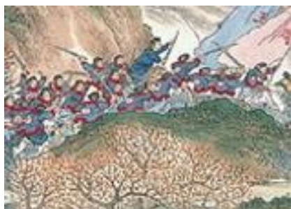
ภาพที่ 19 เครื่องแต่งกายของกองทัพซิงในภาพที่ 7

การบุกทำลายกำลังพลของกบฏในหวายและทงโดยกองพันฉู่ ยุทธการครั้งนี้จะเป็นการศึกษาที่ต่อสู้กันในหุบเขาใกล้ๆกับเมือง โดยทหารของทั้งราชวงศ์ซิงและกลุ่มกบฏต่างซุกซ่อนอยู่ในหุบเขา ดังในรูปที่จะมีการกระจายทหารไปตามหุบเขาต่างๆ และยกกำลังพลออกมาสู้กัน ดังที่เห็นในด้านขวาของรูป และระหว่างเคลื่อนกำลังพล กองทัพของราชวงศ์ซิงก็เผาทำลายเมืองที่เคลื่อนทัพผ่าน ดังที่เห็นในด้านซ้ายของรูปที่มีเปลวไฟลุกไหม้ โดยโทนสีหลักของรูปจะเป็นน้ำตาลอ่อนจากสีของหุบเขาบรรยากาศ มีสีเขียวเล็กน้อยตามบริเวณยอดเนินและภูเขา สำหรับในรูปนี้จะมีทหารของฝ่ายกบฏไท่ผิงปรากฏออกมาอย่างชัดเจน ซึ่งก็คือกลุ่มคนที่สวมชุดคลุมสีเหลืองอมส้มตรงบริเวณกลางรูป (ภาพที่ 7)