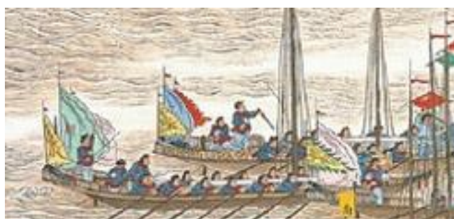
ภาพที่ 24 เครื่องแต่งกายของกองทัพซิงในภาพที่ 10

ยุทธการชิงเจียงฟูและผู้โค้วกับการพิชิตจีวู่โจว ยุทธการครั้งนี้จะเป็นการรบผ่านการเคลื่อนทัพทางแม่น้ำ ภูมิภาคประเทศจะเป็นเนินเขาสีเขียวทางด้านบนตรงกลางซึ่งมีทหารมากมายบริเวณเนินเขาและบนยอดเขา นอกจากนี้ในมุมซ้ายยังปรากฏกองทหารและธงจำนวนมากซึ่งคาดว่าน่าจะเป็นของกองทัพซิง แสดงว่าการรบได้ดำเนินไปสู่ข้างบนเรียบร้อยแล้ว สำหรับพื้นที่น้ำทางตรงกลางจะเป็นพื้นที่ส่วนใหญ่ของรูป โดยจะเห็นกองเรือของกองทัพราชวงศ์ซิงมากมายกับทหารของราชวงศ์ซิงที่กำลังสู้รบอยู่บนบก และบนยอดเขาจะเห็นเป็นแนวของกำแพงเมืองที่มีธงกองทัพโบกอยู่ ทางด้านล่างของภาพเองก็ปรากฏกองเรือกับเปลวไฟซึ่งคาดว่าก็เกิดการต่อสู้ขึ้นเช่นกัน โทนสีหลักของรูปจะมีสีน้ำตาลอ่อนที่มาจากแม่น้ำ และสีเขียวที่มาจากภูมิภาค (ภาพที่ 10)