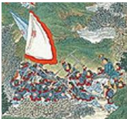
ภาพที่ 16 เครื่องแต่งกายของกองทัพชิงในภาพที่ 4

ภาพการบุกชิงเมืองทงเจิงในมณฑลหูเป่ย์ ยุทธการนี้เป็นการบุกตีล้อมเมือง สลับการส่งกำลังพลเข้าไปในกำแพงเมือง โดยผู้บุกตีคือกองทัพราชวงศ์ชิงที่ใส่ชุดสีฟ้าสลับแดงและผู้ตั้งรับคือกบฏไท่ผิงเทียนกั๋ว โดยไม่ปรากฏรูปลักษณะที่แน่ชัดภายในภาพ โทณสีหลักในรูปคือสีเขียวมาจากสภาพแวดล้อมรอบๆตัวเมือง ซึ่งมีทิวทัศน์ที่เป็นภูเขาและป่าที่สวยงาม พร้อมกับกำแพงเมืองขนาดใหญ่กับทางเข้าเมืองหลายจุด โดยในรูปจะเห็นทหารของกองทัพชิงกำลังรีบยกพลบุกเข้าสู่เมืองทั้งจากทางประตูหลักตรงกลางของรูป หรือกระหน่ำการปืนข้ามกำแพงจากมุมขวา ในด้านมุมขวา มีการต่อสู้อย่างหนักเกิดขึ้น พร้อมเพลิงไหม้กับควันไฟขนาดใหญ่ โดยรอบเมืองจะมีลำธารเล็กๆซึ่งเชื่อมไปยังแม่น้ำที่อยู่ด้านหลังเมือง โดยแม่น้ำได้ไหลตรงไปไกลถึงมุมขวาบนของภาพ พร้อมกับปรากฏหอคอยสูงณ บริเวณนั้นอีกด้วย (ภาพที่ 4)