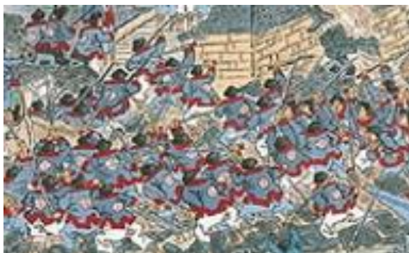
ภาพที่ 18 เครื่องแต่งกายของกองทัพชิงในภาพที่ 6

ทิวทัศน์กับสี่เทาที่มาจากใบไม้และกำแพงเมือง นอกจากนี้การต่อสู้ในรูปยังดำเนินไปอย่างดุเดือดเมื่อสังเกตจากควีน ขนาดใหญ่ตรงกลางของรูปและระเบิดอย่างรุนแรงตรงด้านมุมซ้ายของเมือง (ภาพที่ 6)