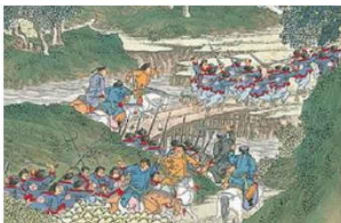
ภาพที่ 13 เครื่องแต่งกายของกองทัพชิงในภาพที่ 1

ภาพยุทธการชิงเย่วโจว เหตุการณ์ของรูปจะเป็นการศึกษายุทธนาวีระหว่างทัพราชวงศ์ชิง และขบวนการไท่ผิวเทียนกั๋ว โดยสภาพภูมิประเทศจะเป็นแม่น้ำใหญ่ที่มีเกาะ ชายฝั่ง และลำธารแยกย่อยไปทางมุมขวาของรูปมากมาย พร้อมกับภูเขาที่อยู่ไกลจากแนวรบ โดยที่ทหารของราชวงศ์ชิงซึ่งใส่ชุดสีฟ้าสลับแดงบางส่วนกำลังต่อสู้บนเรือรบตรงกลางและมุมซ้ายของรูป ซึ่งกำลังยิงจู่โจมกันอย่างหนัก ส่วนทหารของราชวงศ์ชิงทางด้านซ้ายของรูปกำลังเคลื่อนทัพทางบกมุ่งผ่านป่าและหมู่บ้านเล็กๆ โดยพุ่งเป้าหมายไปที่เมืองทางด้านมุมขวาบนของภาพ ซึ่งเป็นเมืองเย่วโจว และขอบเขตของการรบนั้นมีระยะกว้างขวาง เมื่อสังเกตจากกองเรือรบทางด้านบนของรูปที่มีมากมายอยู่ห่างออกไปในแม่น้ำ และในภาพจะเห็นเพียงการรบทางน้ำเป็นส่วนใหญ่เท่านั้น สำหรับทหารของกองทัพชิงภายในภาพจะแต่งกายด้วยเครื่องแบบสีฟ้าแดง (ภาพที่ 1)