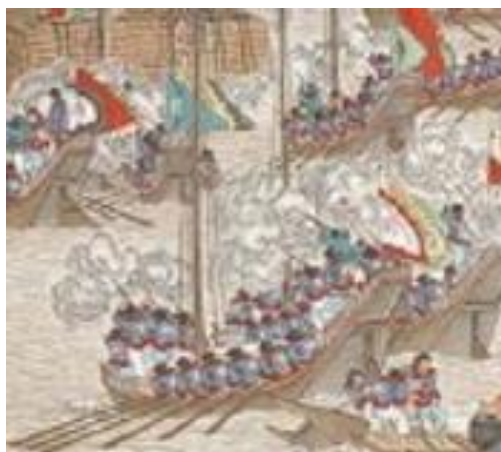
ภาพที่ 14 เครื่องแต่งกายของกองทัพชิงในภาพที่ 2

โดยเหตุการณ์ของการศึกภายในรูปจะเป็นดังต่อไปนี้