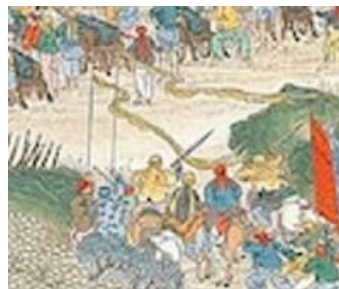
ภาพที่ 23 เครื่องแต่งกายของกองกำลังไท่ผิงเทียนกั๋วในภาพที่ 9

โดยเหตุการณ์ของการศึกภายในรูปจะเป็นดังต่อไปนี้