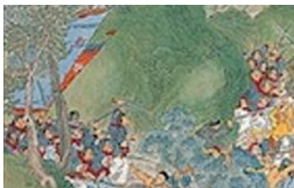
ภาพที่ 22 เครื่องแต่งกายของกองทัพชิงในภาพที่ 9

ภาพการยกระดับโอบล้อมของกองทัพ ณ เมืองจินหลิง ยุทธการครั้งนี้จะเป็นการบุกโจมตีเมืองที่ถูกกลุ่มไท่ผิงเทียนกั๋วยึดไว้โดยราชวงศ์ชิง โดยมุมมองของภาพจะเป็นการวาดภาพมุมสูงที่มองจากฝั่งของตัวเมืองไปยังฝั่งของกองทัพราชวงศ์ชิงที่กำลังทำการบุกโจมตี จะเห็นได้ว่าภูมิประเทศเป็นป่าไม้และเนินเขา และมีกลุ่มควันขาวๆตรงกลางรูปที่เกิดจากการยิงปืนใหญ่ของกองทัพไท่ผิงเทียนกั๋ว และเมื่อมองที่มุมขวาของรูปที่เป็นวิวห่างออกไป จะเห็นกองทัพกำลังเคลื่อนพลอยู่ด้วย ส่วนด้านซ้ายจะเห็นกองทัพทหารของชิงบางส่วนกำลังเคลื่อนทัพใกล้เข้ามาและปะทะกับกลุ่มกบฏจำนวนหนึ่ง บนกำแพงเมืองที่มุมขวาล่างของรูปปรากฏทหารซึ่งน่าจะเป็นผู้บัญชาการทัพของกบฏยืนสังเกตการณ์อยู่ โดยโทนสีหลักของรูปจะเป็นสีเขียวของป่าไม้ และสีเทาอ่อนกับเทาเข้มที่มาจากกำแพงเมือง ต้นไม้ และควันปืน (ภาพที่ 9)