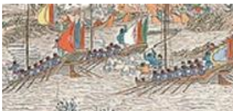
ภาพที่ 15 เครื่องแต่งกายของกองทัพชิงในภาพที่ 3

ภาพการกวาดล้างที่แม่น้ำสุ่น ยุทธการครั้งนี้ เป็นการต่อสู้ทั้งทางน้ำและทางบก โดยทางน้ำจะเป็นการต่อสู้กันด้วยเรือ และทางบกจะเป็นการยกกำลังพลขึ้นบก และต่อสู้กันตามหมู่บ้านที่อยู่ริมแม่น้ำ โดยโทนสีหลักของรูปจะเป็นสีน้ำตาล แสดงให้เห็นถึงภาวะความกดดันของสถานการณ์ในรูปได้เป็นอย่างดี เมื่อสังเกตจากสภาพภูมิประเทศในรูปจะพบว่าหมู่บ้านที่อยู่ริมฝั่ง รอบๆจะมีลักษณะเป็นหนอง บึงเล็กๆที่เชื่อมต่อกับแม่น้ำตรงกลางรูปมากมายเรียงรายกัน พร้อมกับต้นไม้ที่แห้งแล้ง หนองน้ำบางจุดมีศพลอยอยู่ด้วย สำหรับเครื่องแบบของกองทัพชิงยังคงเป็นสีฟ้าสลับแดงเช่นเดิม และไม่ปรากฏเครื่องแต่งกายของฝ่ายกำลังกบฏแต่อย่างใด (ภาพที่ 3)