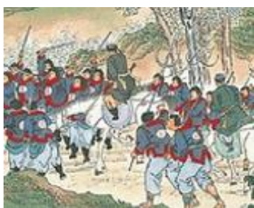
ภาพที่ 26 เครื่องแต่งกายของกองทัพชิงในภาพที่ 12

ภาพการจับกุมพระราชหงฝูเจิน จากที่เห็นในรูป รูปนี้ไม่ใช่ฉากการรบ แต่เป็นรูปวาดการกุ่มตัวและเอามือโพล่หลังอยู่ โดยขบวนนักโทษกำลังเคลื่อนผ่านประตูเมืองที่อยู่ทางด้านซ้ายของรูป เพื่อนำนักโทษขึ้นเรือที่อยู่ตรงกลาง นอกจากนี้ยังมีกองทหารมากมายที่กำลังเคลื่อนพลเข้าสู่เมือง ด้านซ้ายของรูปเช่นกัน ส่วนบริเวณหน้าประตูเมือง ปรากฏเสาสูงขนาดใหญ่ซึ่งไม่ทราบว่าเป็นอะไร โดยโทษสี่หลักของรูปจะประกอบไปด้วย สีเขียวที่มาจากต้นไม้ ภูมิภาคประเทศ ภูเขา และสีน้ำตาลอ่อนมาจากภูเขาที่อยู่ด้านบน กับ ถนนหนทาง และสีสุดท้าย สีเทาอมฟ้า มาจากตัวเมือง กำแพงเมือง แม่น้ำ ต้นไม้ และเครื่องแบบทหาร (ภาพที่ 12)