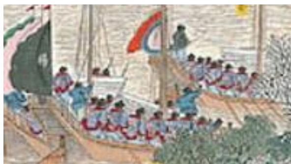
ภาพที่ 17 เครื่องแต่งกายของกองทัพชิงในภาพที่ 5

ภาพการพิชิตอุซาง ยุทธการนี้จะเป็นการบุกตัวเมืองของทัพราชวงศ์ชิงโดยใช้วิธีชนกำลังพลด้วยเรือรบมาทางแม่น้ำที่อยู่ติดกับเมือง ซึ่งตั้งอยู่ทางด้านขวาของรูป โดยทำการบุกตีทั้งสองฝั่งของแม่น้ำ ซึ่งด้านซ้ายของรูปยังมีกำแพงเมืองขนาดใหญ่ซึ่งมีการต่อสู้เกิดขึ้นทั้งบนกำแพงและด้านหน้าของกำแพง เมื่อดูจากกำแพงเมือง จะเห็นได้ว่ากองทัพของราชวงศ์ชิงบางส่วนทำการบุกเข้าไปได้แล้ว นอกจากนี้ด้านในเมืองยังปรากฏเปลวเพลิงและควันไฟขนาดใหญ่ โทนสีหลักของรูปจะเป็นสีน้ำตาลอ่อนที่มาจากแม่น้ำ และโทนสีรองคือเท่าที่มาจากบ้านเรือนและกำแพงเมืองขนาดใหญ่ แม่น้ำในรูปจะตั้งอยู่ตรงกลางของรูปและมีขนาดใหญ่ ทอดยาวไปจนถึงมุมขวาบนของรูป (ภาพที่ 5)