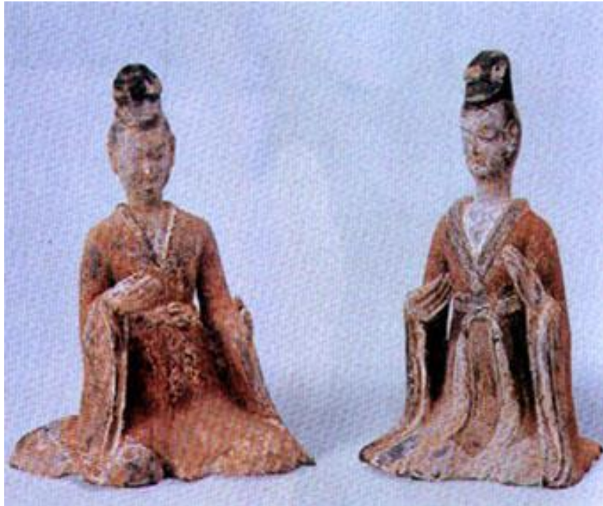
ภาพที่ 1 ประติมากรรมสตรีในยุคราชวงศ์ใต้-ราชวงศ์เหนือ (386-589). เข้าถึงเมื่อ 26 พฤศจิกายน. เข้าถึงได้จาก http://en.chinaculture.org/library/2008-01/28/content_28369.htm