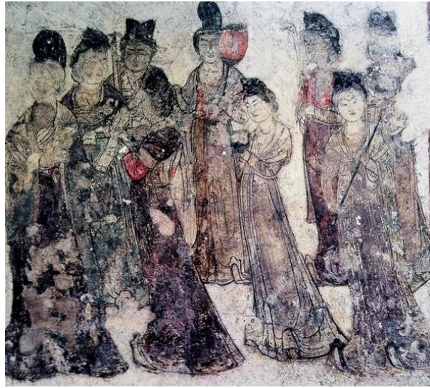
ภาพที่ 6 ภาพกลุ่มสาวรับใช้ในวังที่พบในสุสานของเจ้าหญิงหยงไถ (706)