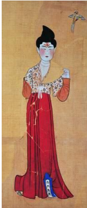
ภาพที่ 4 ภาพสตรีสวมใส่ชุดแบบหูฝู. เข้าถึงเมื่อ 26 พฤศจิกายน. เข้าถึงได้จาก http://en.chinaculture.org/library/2008-01/28/content_28369.htm