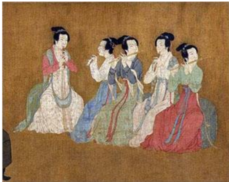
ภาพที่ 2 ภาพจิตรกรรมสตรีในยุคราชวงศ์ใต้-ราชวงศ์เหนือ. เข้าถึงเมื่อ 26 พฤศจิกายน. เข้าถึงได้จาก http://en.chinaculture.org/library/2008-01/28/content_28369.htm