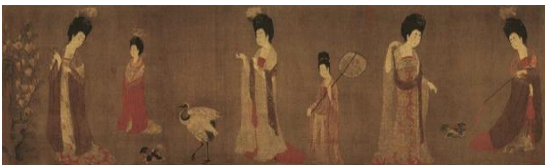
ภาพที่ 11 ผู้หญิงที่ประดับศีรษะด้วยดอกไม้

และจากภาพผู้หญิงที่ประดับศีรษะด้วยดอกไม้ของ โจว ผาง ศิลปินที่มีชื่อเสียงในยุคราชวงศ์ถังก็เป็นอีกหนึ่งภาพที่แสดงให้เห็นถึงอุดมคติที่มีต่อผู้หญิงในยุคราชวงศ์ถังผ่านรูปแบบการแต่งกายของสตรีชนชั้นสูงในพระราชวัง ผู้หญิงในภาพมีลักษณะอวบอ้วน ร่างกายท่อนบนและท่อนล่างมีความสมดุลกันและแต่งกายอย่างประณีตด้วยเสื้อผ้าแบบหู้ฉวน ออค์ประกอบของชุดประกอบไปด้วยชุดกระโปรงเกาะอกที่สวมเสื้อคลุมและผ้าคลุมที่ทำจากผ้าโปร่ง เปิดให้เห็นบริเวณเนินอก พร้อมทั้งประดับศีรษะด้วยดอกไม้ และแต่งกายอย่างทันสมัยด้วยการสวมกระโปรงสองตัว โดยสังเกตได้จากขอบกระโปรงที่สวมใส่ (ภาพที่ 11)