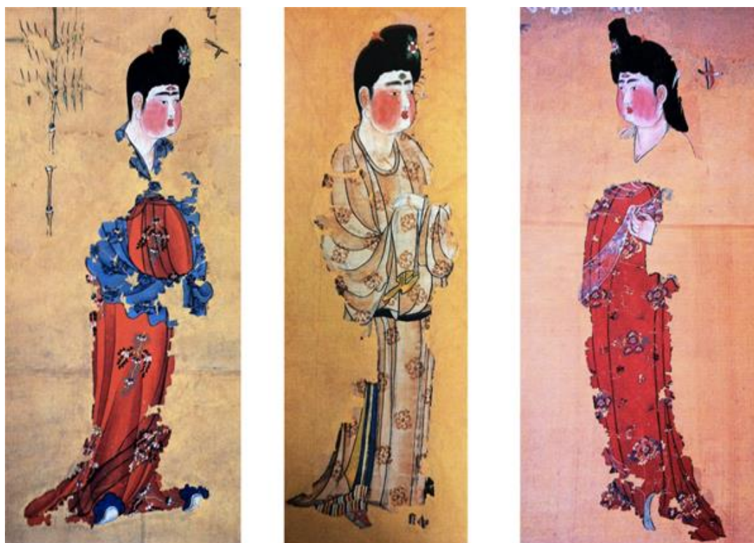
ภาพที่ 10 ผู้หญิงที่กำลังชมการเล่นหมากรุกที่พบในสุสานที่อัสตานา

ต่อมาในช่วงกลางศตวรรษที่ 8 ได้มีการสร้างอุดมคติเกี่ยวกับความงามของผู้หญิงขึ้นมาใหม่ โดยแสดงผ่านภาพจิตรกรรมแบบม้วนที่พบในสุสาน บรรยายถึงผู้หญิงที่มีร่างกายอวบอ้วนที่ห่มร่างกายด้วยผ้าไหมทั้งตัวซึ่งเป็นภาพจิตรกรรมที่มีลักษณะคล้ายกับภาพที่พบในสุสานของอัสตานาที่ตั้งอยู่ในตุรกี เช่นภาพผู้หญิงกำลังชมการเล่นหมากรุก ในภาพแสดงให้เห็นถึงการแต่งกายของผู้หญิงที่สวมชุดผ้าไหมแบบที่เรียกว่าหูฝูหรือรูปแบบเสื้อผ้าที่มาจากต่างประเทศที่ตกแต่งด้วยลายดอกไม้ที่มีสีสันสดใส ชุดเสื้อผ้าที่ใช้สีแดงเป็นหลักยังทำให้คุณค่าของผ้าไหมเพิ่มขึ้นอีกด้วย ความนิยมในการแต่งกายด้วยเสื้อผ้าแบบหูฝูแสดงให้เห็นถึงค่านิยมความงามในอุดมคติของผู้หญิงที่เปลี่ยนไป ผู้หญิงนิยมเสื้อคลุมทรงกลมที่มีแขนเสื้อซ้อนกันหลายชั้นและสวมกางเกงขากว้างไว้ข้างในซึ่งขัดกับหลักการแต่งกายของเมื่อก่อนที่ไม่อนุญาตให้ผู้หญิงสวมกางเกง (ภาพที่ 10)