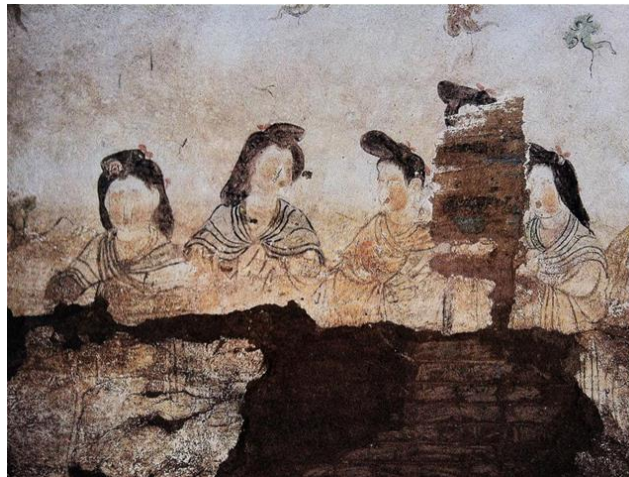
ภาพที่ 8 รูปแบบการแต่งกายท่อนบนที่คลุมผ้าผืนใหญ่และรวบรวมกันไว้ที่แขน

ในช่วงก่อนศตวรรษที่ 8 ได้ค้นพบภาพหญิงที่มีหน้าที่ให้ความสำคัญและภาพหญิงรับใช้ ที่ใช้ประดับตกแต่งผนังสุสานของเจ้าชายหลี่เซียน(742) โดยมีการตกแต่งพื้นผิวเพื่อเน้นให้เห็นถึงมวลร่างกายและรูปทรงของเอวกระโปรงที่เปลี่ยนเป็นปล้อยหลวมๆและขยับเอวให้สูงขึ้น ชายกระโปรงที่ตัวลงคลุมเท้าในลักษณะที่แผ่บานออก ท่อนบนห่มผ้าผืนใหญ่เพื่อคลุมลำตัวแล้วนำมารวมกันไว้ที่แขน (ภาพที่ 8 และ 9)