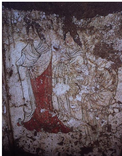
ภาพที่ 9 ชุดกระโปรงที่ถูกขยับเอวให้สูงขึ้น