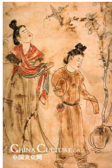
ภาพที่ 5 ภาพวาดสตรีที่แต่งกายด้วยเสื้อผ้าแบบของผู้ชาย. เข้าถึงเมื่อ 26 พฤศจิกายน. เข้าถึงได้จาก http://en.chinaculture.org/library/2008-01/28/content_28369.htm