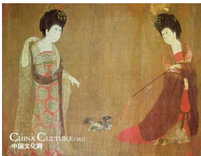
ภาพที่ 3 ภาพสตรีที่สวมชุดกระโปรงผ้าคลุมไหล่ และประดับศีรษะด้วยดอกไม้. เข้าถึงเมื่อ 26 พฤศจิกายน. เข้าถึงได้จาก http://en.chinaculture.org/library/2008-01/28/content_28369.htm

รูปแบบการแต่งกายแบบเสื้อคลุมสั้นสองชั้น ซึ่งการแต่งกายแบบหรุฉวินเป็นรูปแบบที่เป็นแบบฉบับในภาคกลาง เครื่องแต่งกายในพิธีสำคัญมีความแตกต่างจากชุดประจำวันในการใช้ ผ้าสีและการตกแต่ง แต่ส่วนประกอบของชุดที่สำคัญยังคงเหมือนเดิม ส่วนสำคัญในการแต่งกายของผู้หญิงประกอบด้วย เสื้อคลุมสั้นๆ หรือเสื้อชั้นในแบบสั้น ซ่าน (衫) หรือเสื้อมอกแบบสั้น หู่ (襦) กระโปรง ฉวิน (裙) และผ้าคลุมไหล่ ผีปอ (披帛) ส่วนประกอบหลักเหล่านี้สามารถใช้ร่วมกับเสื้อโค้ท อ่าว (袄) เสื้อคลุม ผาว (袍) หรือเสื้อมอกแขนสั้นที่ถูกครอบตัด หรือที่เรียกอีกอย่างว่า ป่านปี้ (半臂) (ภาพที่ 3)