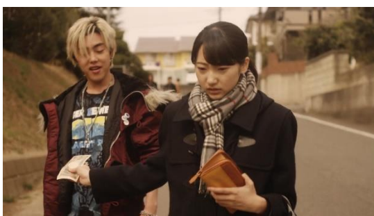
รูปที่ 4.10 มิโดริ ซุซุมุระให้เงินแก่เพื่อนเก่าตอนวัยเด็กที่คอยตามรังควาน

เด็กสาววัยมัธยมปลายที่ออกจากบ้านเด็กกำพร้าและบังเอิญถูกหวยรางวัลหนึ่งพันล้านเยนนี เป็นคนที่มีนิสัยเด็กสมกับวัย ยังอ่อนต่อโลก ขาดความยับยั้งชั่งใจจากการที่ยอมให้เงินกับเพื่อนเก่าตัวเองทุกครั้งที่มาขอ จุดนี้แสดงให้เห็นถึงความกังวลแบบ reality anxiety ความยึดติดจากความหลังที่เคยมีความสัมพันธ์อันดีต่อกัน (fixation) และซูเปอร์อีโก้ทำการควบคุมอีโก้ไม่ดีเท่าที่ควรจะเป็น