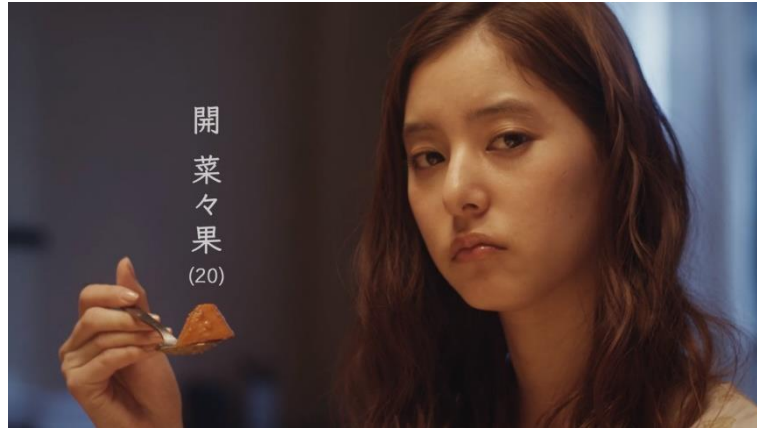
รูปที่ 4.6 นานากะ เซกิ