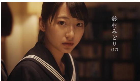
รูปที่ 4.9 มิโดริ ซุซุมุระ

นอกจากนั้น คนที่ทำอาชีพเดียวกับนานากะอย่างเซกิอย่างไอดอลสาวที่เป็นเด็กของมินามิยังทำอาชีพขายบริการทางเพศในราคาที่สูงถึง 10 ล้านบาท จากที่ดูภายนอกเป็นไอดอลสาว น่ารัก ใสซื่อ แต่เบื้องหลัง ทำอาชีพด้านมืดที่ผิดกฎหมาย สะท้อนให้เห็นถึงปัญหาสังคมของญี่ปุ่นอันดำมืด