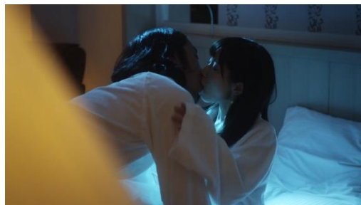
รูปที่ 4.7 และ 4.8 การขายบริการทางเพศของไอดอลสาว