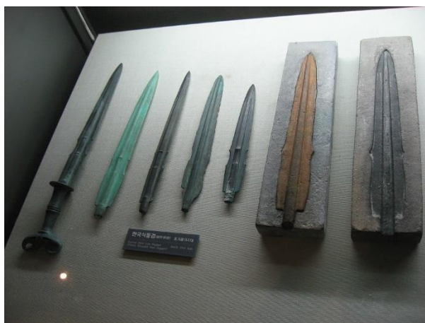
ภาพที่ 2 Early Iron Age weapons

ต่อมาในช่วงคริสต์ศตวรรษที่ 2 (ค.ศ. 101 - 200) ได้มีการจัดการเมืองเป็นครั้งแรกภายใต้การบริหารของกลุ่มความร่วมมือจินฮาน 1 ที่ได้รับอิทธิพลมาจากอาณาจักรซิลลา 2 เรียกว่า คอซิลชันกุก (거칠산국) คอซิลชัน แปลว่าภูเขาขรุขระ ส่วนกุก แปลว่า ประเทศ รวมกันจึงแปลว่าประเทศที่มีภูเขาขรุขระ เนื่องจากที่บริเวณนี้มีภูเขาฮวังย็อง (황령산) ซึ่งภูเขานี้ตั้งอยู่ใจกลางเมือง ต่อมาเป็นยุครวมอาณาจักรซิลลา 3 หนึ่งในสามอาณาจักรของเกาหลีโบราณ 4 รุ่งเรืองอำนาจมาก และในปี 735 อาณาจักรซิลลาสามารถปกครองพื้นที่บริเวณคาบสมุทรเกาหลีได้เกือบทั้งหมด ดังนั้นอาณาจักรซิลลาจึงเข้ามามีอิทธิพลในบริเวณทางตอนใต้ของประเทศเกาหลีอย่างเด็ดขาด ในปี 757 เรียกชื่อเรียกบริเวณนี้ว่า ทงแน (동래) และสร้างโรงงานกลั่นเหล็กเอาไวในเมือง ซึ่งเหล็กจากที่นี่จะถูกส่งไปยังญี่ปุ่นและส่วนอื่น ๆ ของเกาหลีโดยผ่านแม่น้ำซูยอง (Suyeonggang) มีผู้คนมาอาศัยอยู่ในเมืองเพิ่มมากขึ้นทำให้เมืองเริ่มขยายใหญ่ขึ้น การค้าเหล็กจึงมีความสำคัญอย่างมากต่อการเจริญเติบโตทางการค้าของเมืองปูซาน ปัจจุบันทงแนก็กลายมาเป็นชื่ออำเภอที่ตั้งอยู่ทางตอนเหนือของเมืองปูซาน (Taylor, 2018; Wikipedia, 2019)