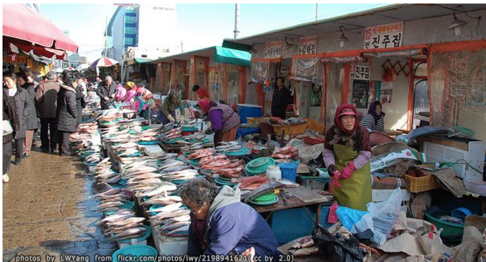
ภาพที่ 5 ตลาดปลาจัลกาชิ (Jagalchi Fish Market)

สร้างเป็นตลาดในช่วงการยึดครองของญี่ปุ่น ตลาดแห่งนี้แบ่งออกเป็นสองส่วน คือ ในร่มและกลางแจ้ง สามารถรับประทานอาหารทะเลสดๆ และมีร้านอาหารทะเลให้เลือกมากมาย จุดเด่น คือ เมื่อสั่งเมนูอาหารทะเลต่าง ๆ ก็จะมีพนักงานพาไปเลือกซื้อวัตถุดิบกันถึงในตลาด ทุก ๆ ปีช่วงประมาณ สัปดาห์ที่ 2 ของเดือนตุลาคม จะมีการจัดงานเทศกาลจากัลบชี (Busan Jagalchi Festival) ที่ตลาดแห่งนี้ด้วย จัดขึ้นประมาณปีละ 3 วัน แต่ละปีวันที่จัดจะไม่เหมือนกัน (โพสท์ทูเดย์, 2557; VIU, 2019)