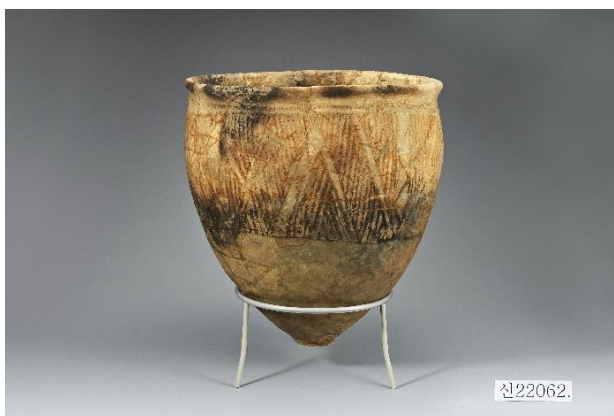
ภาพที่ 1 Pottery with Applique Decoration

เมืองปูซานเป็นเมืองที่มีความสำคัญต่อเศรษฐกิจของเกาหลี เนื่องจากเป็นเมืองท่าที่มีขนาดใหญ่ที่สุดของประเทศเกาหลีใต้ และพื้นที่ของเมืองมีขนาดใหญ่เป็นอันดับ 2 รองจากโซล ปูซานตั้งอยู่ทางตอนใต้ของประเทศเกาหลี ติดกับคาบสมุทรเกาหลี มีหลักฐานยืนยันว่าเมืองปูซานมีผู้อยู่อาศัยตั้งแต่ยุคหินใหม่ (8000 – 1400 ปีก่อนคริสตกาล) ผู้คนในยุคนี้เริ่มปรับตัวเข้ากับสภาพแวดล้อมที่เปลี่ยนแปลงไปหลังจากน้ำแข็งละลาย หลักฐานที่พบ พบจากซากปรักหักพังต่าง ๆ มีทั้งเป็นที่อยู่อาศัย สุสานที่ทำจากเปลือกหอยและซากแบบอื่น ๆ สุสานเปลือกหอยที่มีชื่อเสียง คือ สุสานเปลือกหอยดงซัมดงที่ตั้งอยู่ที่อำเภอยองโด เมืองปูซาน ภายในสุสานค้นพบเครื่องปั้นดินเผาที่ไม่มีลวดลายและภาชนะดินเผา หม้อไห ถ้วยชามต่าง ๆ ที่มีลวดลายเป็นเอกลักษณ์ จากการจำลองกลายเป็นเส้นรอบ ๆ คล้ายตัว V ด้วยการกรีดโดยใช้ของมีคม ทำลายเหมือนฟันของหิว ก่อนนำไปอบไฟ เรียกว่าเครื่องมือเครื่องใช้ลายฟันหิว หรือวัฒนธรรมลายฟันหิว นอกจากนี้ยังมีอุปกรณ์เครื่องมือที่ทำจากหินและกระดูกสัตว์อีกมากมาย (ดวงธิดา ราเมศวร์, 2556: 23-24; National Museum Of Korea, 2019)