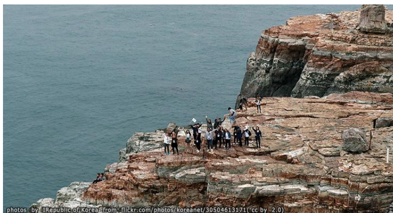
ภาพที่ 6 สวนริมทะเล แทจงดแด

มีขนาดพื้นที่ประมาณ 1,100 ไร่ ประกอบไปด้วยต้นไม้สีเขียวอย่างต้นสน และหน้าผาหินที่มีจุดชมวิวที่ความสูง 250 เมตร โดยจะมีทางเดินรอบเกาะ จึงเป็นที่ออกกำลังกาย เดินเล่น กินลมชมวิวกิจกรรมของชาวเมืองปูซาน (โพสต์ทูเดย์ , 2557; Chillout Korea, 2015; VIU, 2019) และยังมีสะพานแขวนควางอัน มีความยาวเป็นอันดับ 2 ของประเทศ รองจากสะพานอินซอน เป็นจุดท่องเที่ยวที่นิยมมาเที่ยวในตอนกลางคืน เพราะสะพานแห่งนี้จะจัดแสดงแสงสีรูปแบบต่าง ๆ ทุกต้นชั่วโมง โดยมีจุดชมที่ตีที่ที่สุด คือ หาดแฮอนแด (โพสต์ทูเดย์, 2557; Chillout Korea, 2015)