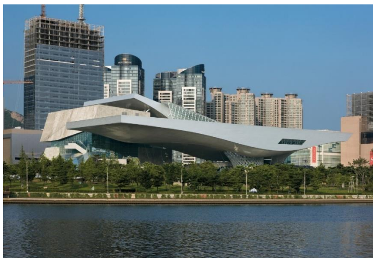
ภาพที่ 4 The Busan Cinema Center

ในปี 1999 แผนการส่งเสริมการประชาสัมพันธ์ของปูซาน (ปี 2011 เปลี่ยนชื่อเป็นแผนการตลาดเอเชีย) จัดตั้งขึ้นเพื่อเชื่อมโยงผู้กำกับรายใหม่กับแหล่งเงินทุน ในงานเทศกาลครั้งที่ 16 ปี 2011 ได้ย้ายสถานที่จัดตั้งเทศกาลไปไว้ยังที่ตั้งใหม่ถาวร สร้างเป็นศูนย์กลางโรงหนังปูซาน ปูซานซีนีมาร์เซ็นเตอร์ (The Busan Cinema Center) ให้เงินในการสร้างปูซานซีนีมาร์เซ็นเตอร์ 140 ล้านบาท สหรัฐ ออกแบบโดยใช้สถาปัตยกรรมแบบออสเทรียเป็นพื้นฐาน เป็นสถาปัตยกรรมแบบ Coop Himmelblau (Festagent, 2019)