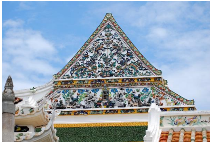
รูปภาพที่ 15 หน้าบัน วัดราชโอรสาราม