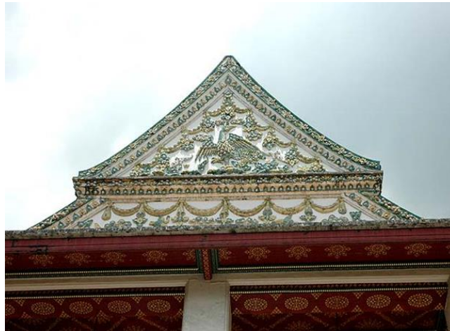
รูปภาพที่ 17 หน้าบัน วัดเทพธิดาราม