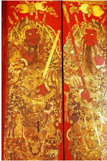
รูปภาพที่ 10 การประดับตกแต่งอาคารลวดลายแบบจีน วัดโอรสาราม

6.ผนังภายในบางแห่งเป็นภาพวรรณคดีจีนและภาพเครื่องใช้แบบจีน บางแห่งเป็นภาพแบบงานจิตรกรรมแบบไทยประเพณีผสมภาพจิตรกรรมอาคารแบบจีน