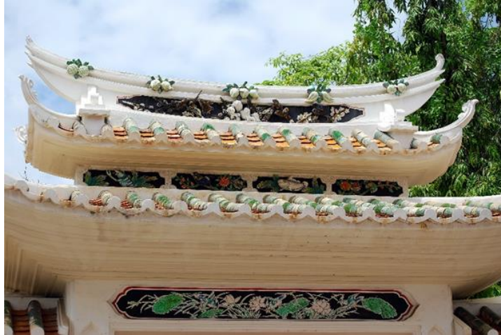
รูปภาพที่ 14 หลังคาทรงซ้อน วัดราชโอรสาราม