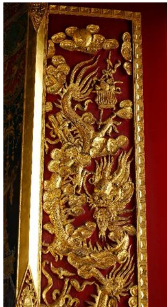
รูปภาพที่ 9 การประดับตกแต่งอาคารลวดลายแบบจีน วัดโอรสาราม