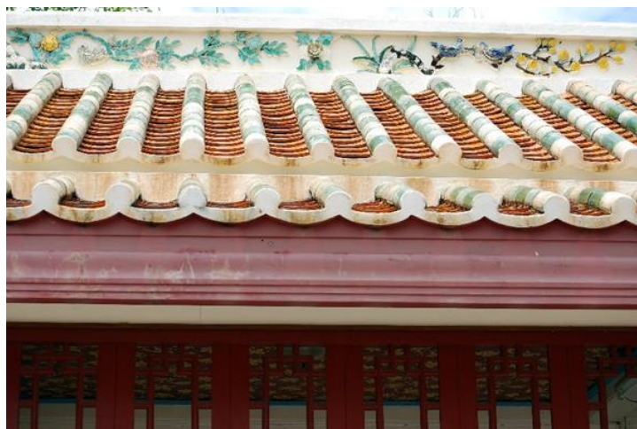
รูปภาพที่ 13 หลังคาทรงซ้อน วัดราชโอรสาราม

7. หลังคาทำเป็นแบบทรงซ้อนชั้นและชอยดัดพื้นแบ่งหลังคาออกเป็นส่วนๆ บริเวณดัดล่างของหลังคาซ้อนชั้นทำเป็นกันสาดโดยรอบ หน้าจั่วทรงสามเหลี่ยมก่ออิฐตันบางแห่งทำเป็นหน้าบันสองระดับมีลวดบัวคั่นแบ่งกลาง ฉาบปูนปั้นปูนประดับตกแต่งด้วยกระเบื้องเคลือบ ไม่มีไชราและไม่ประดับช่อฟ้า ใบระกา หางหงส์ นาคสะดุ้ง แต่จะปั้นปูนแทนเป็นหน้ากระดาน ทำเป็นหน้าบัน