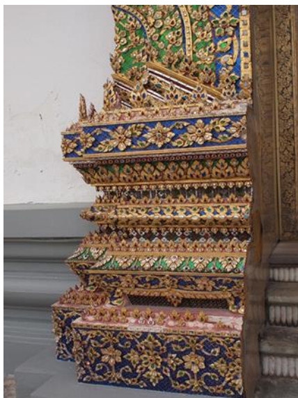
รูปภาพที่ 2 ฐานสิงห์ วัดกัลยาณมิตร