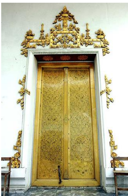
รูปภาพที่ 7 ซุ้มปูนปั้นติดผนังทรงดอกไม้ (ประตู) วัดเทพธิดาราม http://www.resource.lib.su.ac.th/web-temple/