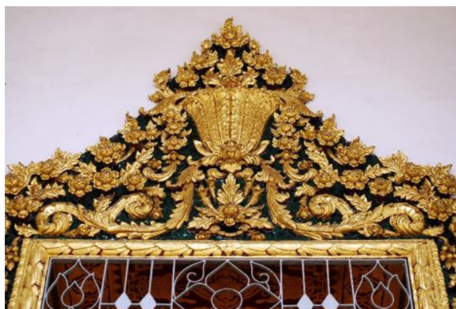
รูปภาพที่ 5 ซุ้มปูนปั้นติดผนังทรงดอกไม้ (หน้าต่าง) วัดราชโอรสาราม

4.ซุ้มประตู-หน้าต่าง ทำเป็นซุ้มปูนปั้นติดกับผนังทรงดอกไม้ ทรงมงกุฎต่อยอดบันแถลง ลวดลายแบบฝรั่งปิดทองหรือประดับกระเบื้องเคลือบ มีชื่อเฉพาะว่า “ซุ้มเรือนแก้ว” บางแห่งมีช่องประตูและหน้าต่างเป็นวงกลมหรือแปดเหลี่ยมแบบจีน