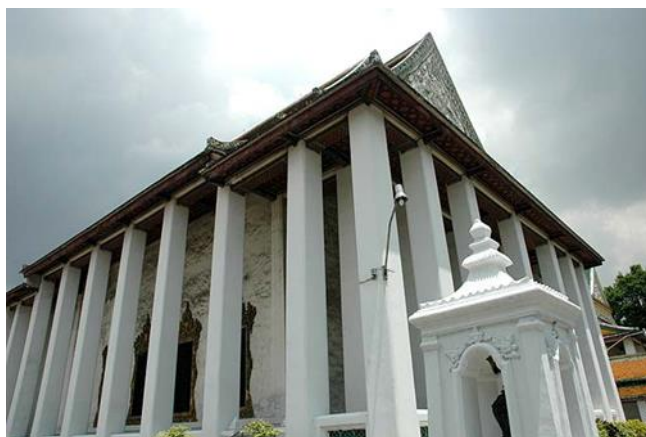
รูปภาพที่ 4 เสาแบบก่ออิฐถือปูน วัดเทพธิดาราม

3.เสาโดยทั่วไปเป็นเสาก่ออิฐถือปูน หน้าตัดของเสามีทั้งสี่เหลี่ยมจัตุรัสและสี่เหลี่ยมผืนผ้า ไม่มีบัวหัวเสา ปลายเสาจะเรียวเล็กน้อยเพื่อให้รับกับการสอบเข้าหาของผนังตามแบบประเพณีเดิมของไทย