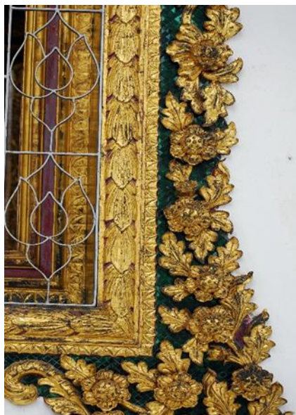
รูปภาพที่ 6 ซุ้มปูนปั้นติดผนังทรงดอกไม้ (หน้าต่าง) วัดราชโอรสาราม