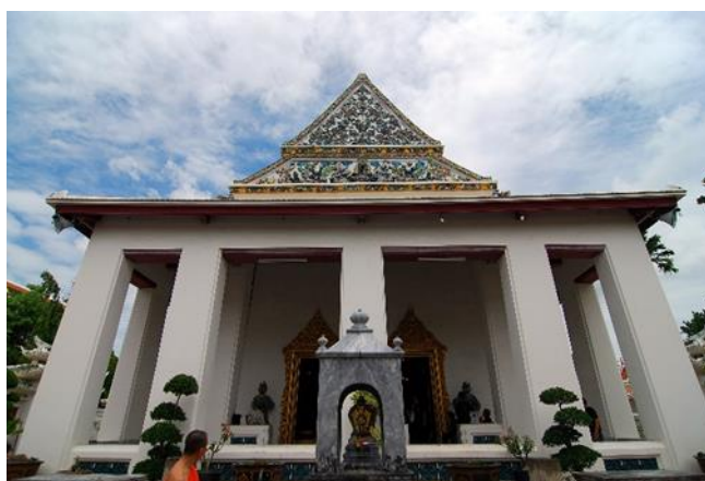
รูปภาพที่ 3 ตัวอาคารพระอุโบสถ วัดราชโอรสาราม

2. ตัวอาคารมีพื้นที่เป็นรูปสี่เหลี่ยมผืนผ้ามีระเบียงและเสาล้อมรอบหรือมีมุขหน้าหลัง หรือมีมุขข้าง ภายในประดิษฐานพระพุทธรูปตามแบบประเพณีไทย