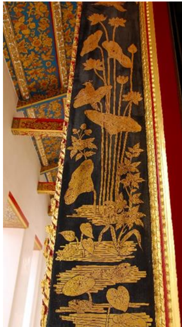
รูปภาพที่ 8 การประดับตกแต่งอาคารลวดลายแบบจีน วัดราชโอรสาราม

5.ประดับตกแต่งอาคารด้วยสัญลักษณ์ลวดลายแบบมณฑลจีน มีทั้งที่เป็นสัตว์ ลายพฤกษชาติ ธรรมชาติ เทพเจ้า และวัตถุต่าง ๆ