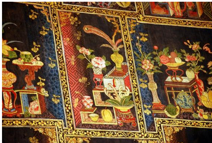
รูปภาพที่ 11 ภาพจิตรกรรมฝาผนังแบบจีน วัดราชโอรสาราม

6.ผนังภายในบางแห่งเป็นภาพวรรณคดีจีนและภาพเครื่องใช้แบบจีน บางแห่งเป็นภาพแบบงานจิตรกรรมแบบไทยประเพณีผสมภาพจิตรกรรมอาคารแบบจีน