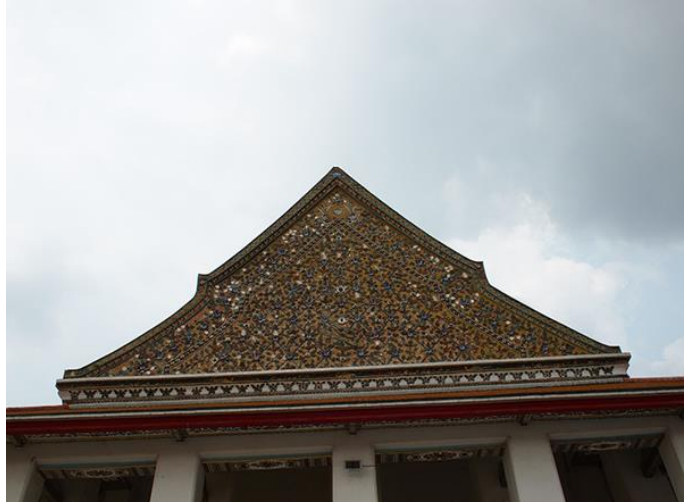
รูปภาพที่ 16 หน้าบัน วัดกัลยาณมิตร