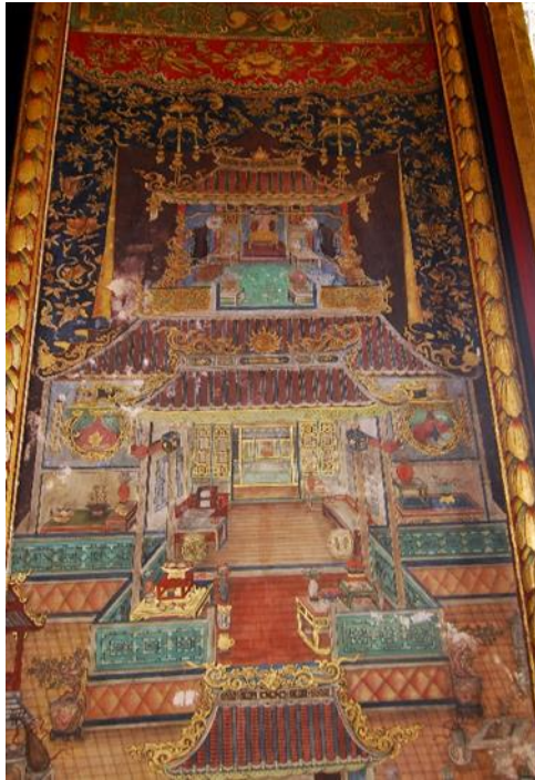
รูปภาพที่ 12 ภาพจิตรกรรมฝาผนังแบบจีน วัดราชโอรสาราม

7. หลังคาทำเป็นแบบทรงซ้อนชั้นและชอยดัดพื้นแบ่งหลังคาออกเป็นส่วนๆ บริเวณดัดล่างของหลังคาซ้อนชั้นทำเป็นกันสาดโดยรอบ หน้าจั่วทรงสามเหลี่ยมก่ออิฐตันบางแห่งทำเป็นหน้าบันสองระดับมีลวดบัวคั่นแบ่งกลาง ฉาบปูนปั้นปูนประดับตกแต่งด้วยกระเบื้องเคลือบ ไม่มีไชราและไม่ประดับช่อฟ้า ใบระกา หางหงส์ นาคสะดุ้ง แต่จะปั้นปูนแทนเป็นหน้ากระดาน ทำเป็นหน้าบัน