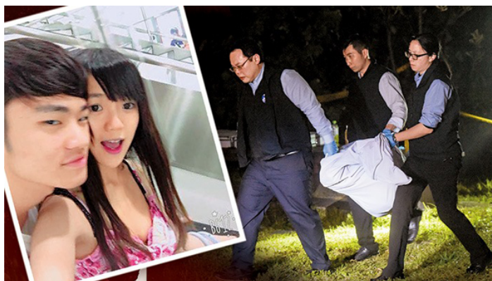
ภาพที่ 7 คดีฆาตกรรมที่เป็นชนวนเหตุในการเสนอร่างกฎหมายการส่งตัวผู้ร้ายข้ามแดน