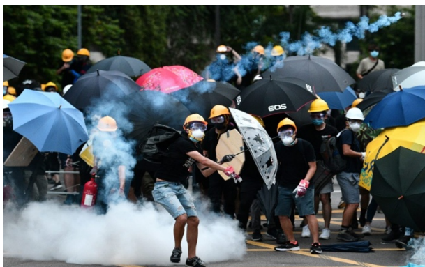
ภาพที่ 6 กลุ่มผู้ชุมนุมใช้ร่มในการป้องกันตัวจากการปล่อยแก๊สน้ำตาของเจ้าหน้าที่ตำรวจ

ราชการสำคัญหลายแห่ง ยกเว้นหน่วยงานราชการที่จำเป็น เช่น โรงพยาบาลและสำนักงานสวัสดิการ เพื่อ กีดกันให้รัฐบาลฮ่องกงแสดงความรับผิดชอบการใช้ความรุนแรงในการแก้ไขปัญหาการชุมนุม