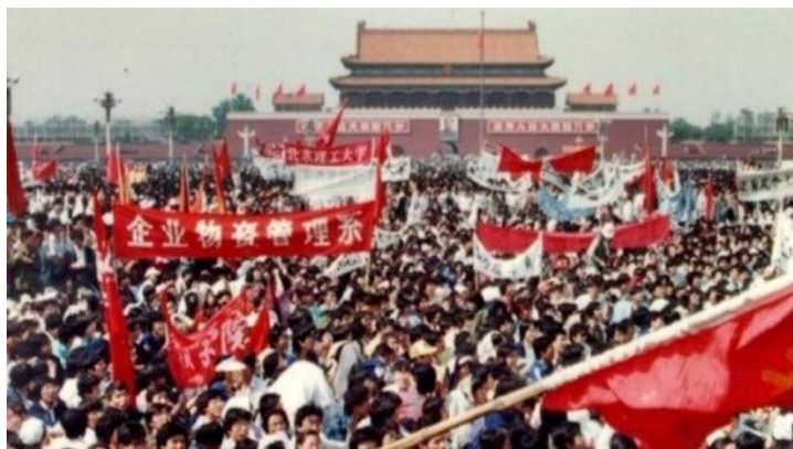
ภาพที่ 5 การชุมนุมประท้วงของกลุ่มประชาชนและนักศึกษา ณจัตุรัสเทียนอันเหมิน

ที่มา http://www.smartbomb.co.th/news/details/96409 .