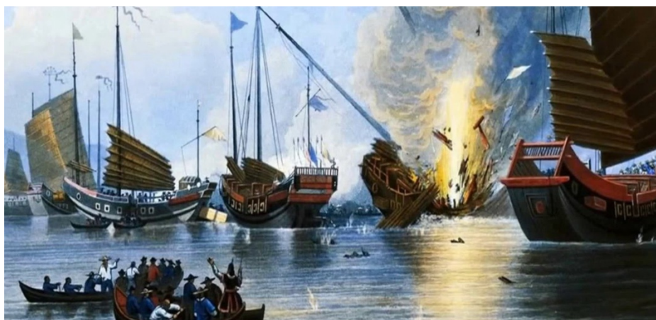
ภาพที่ 2 เรือรบของอังกฤษ โจมตีเรือของจีน

เนื่องจากกฎเกณฑ์หลายประการทางการค้าของจีน ทำให้อังกฤษประสบปัญหาขาดดุลการค้าอย่างหนัก เพราะไม่สามารถค้าขายสินค้าได้อย่างเสรี จึงลักลอบนำเข้าฝิ่นเข้ามาค้าขายในจีน ทำให้ดุลการค้าของอังกฤษดำเนินไปในทิศทางที่ดีขึ้นจากการระบาดของฝิ่นที่แผ่ขยายในทุกชนชั้นของจีน จนท้ายที่สุดอังกฤษได้พลิกผันกลายเป็นฝ่ายได้เปรียบทางการค้า แม้ว่ารัฐบาลชิงจะพยายามแก้ไขปัญหาดังกล่าว โดยประกาศห้ามนำเข้าฝิ่น ประมวลปราบกลุ่มผู้ค้าและผู้เสพ โดยการกำหนดโทษประหาร และลงโทษผู้มีส่วนเกี่ยวข้องจากการได้ประโยชน์จากฝิ่น ไม่ว่าจะเป็นชาวแมนจู ชาวจีน และชาวตะวันตก แต่ที่ว่าฝิ่นก็ยังคงหลั่งไหลเข้าแผ่นดินจีนอย่างต่อเนื่อง ทำให้จีนประสบปัญหาการขาดสภาพคล่องทางเศรษฐกิจและค่าเงินตกต่ำ รัฐบาลชิงจึงตัดสินใจทำลายฝิ่นทั้งหมดที่ยึดได้จากพ่อค้าชาวอังกฤษ การกระทำดังกล่าว สร้างความไม่พอใจให้กับรัฐบาลอังกฤษเป็นอย่างมาก จึงกลายเป็นข้ออ้างในการยกกองกำลังปิดล้อมชายฝั่งมณฑล กวางตุ้ง จนก่อให้เกิดสงครามฝิ่นในเวลาต่อมา (Zhoujiarong , 2547)