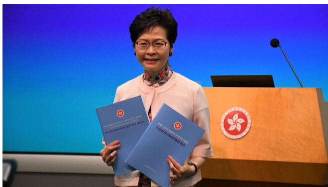
ภาพที่ 8 นางแครี่ แลม ผู้บริหารสูงสุดประจำเขตบริหารพิเศษฮ่องกงได้ประกาศถอนร่างกฎหมายการ ส่งตัวผู้ร้ายข้ามแดน โดยถาวร