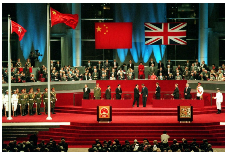
ภาพที่ 4 พิธีส่งมอบธงชาติไทยของฮ่องกงจากอังกฤษสู่จีนแผ่นดินใหญ่