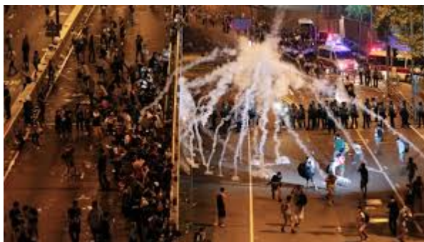
ภาพที่ 9 การใช้แก๊สน้ำตาของเจ้าหน้าที่ตำรวจเพื่อสลายการชุมนุม ใน ค.ศ.2019