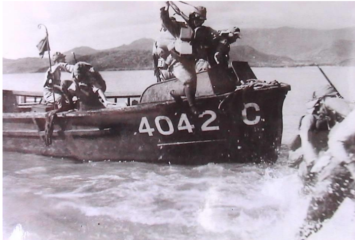
รูปที่ 3 ญี่ปุ่นยกพลขึ้นบกประเทศไทย

ที่มา https://www.thaifighterclub.com/2016/สงครามโลกครั้งที่สอง-๖/