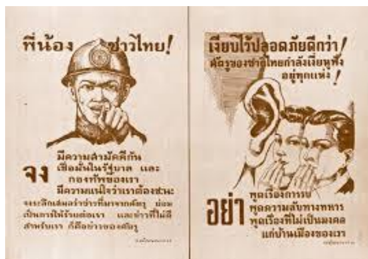
รูปที่ 10 ภาพใบประกาศสมัยสงครามโลกครั้งที่สอง

ไทยประกาศสงครามกับอังกฤษและสหรัฐอย่างเต็มตัวในวันที่ 25 มกร 2485 จากกติกาสัญญาทางทหารระหว่างไทยกับญี่ปุ่นและกติกาสัมพันธไมตรีระหว่างประเทศ และยิ่งในยุคสงครามเช่นนี้ แนวคิดชาตินิยมของจอมพล ป. ก็ปลุกฝังผ่านสื่อหลายๆ อย่างไม่ว่าจะเป็นการเปิดเพลงมาร์ชตามวิทยุกระจายเสียง การสร้างวาทกรรมว่า “เชื่อผู้นำชาติพ้นภัย” มีรูปวาดใบประกาศต่างๆ ที่ข้อความเชิงชวนเชื่อว่าไทยจะผ่านพ้นสงครามไปได้เพราะผู้นำและกองทัพ ทว่าไม่ใช่ข้าราชการชั้นสูงหรือชาวไทยทุกคนจะเห็นด้วย