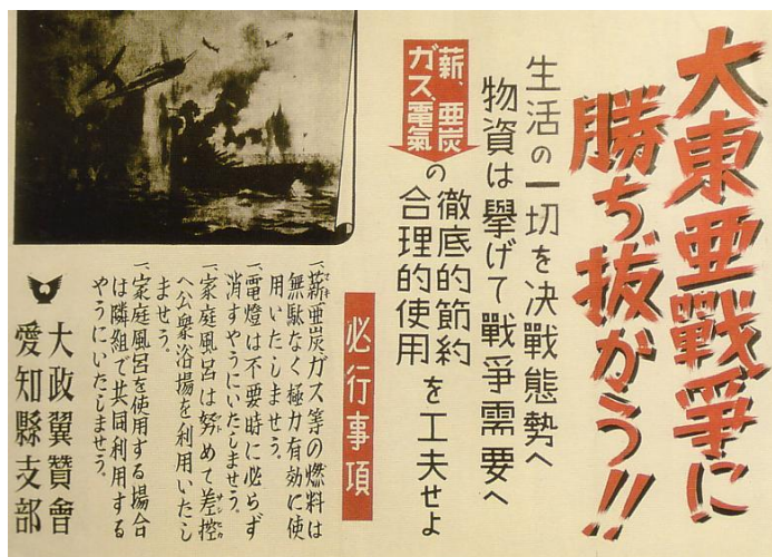
รูปที่ 1 Let's win the greater asia war

ในช่วงเวลา ค.ศ. 1939 เป็นช่วงเวลา que เริ่มเกิดการปะทะกันระหว่างฝ่ายอักษะ อันประกอบด้วยแกนนำในทวีปเอเชียคือญี่ปุ่น ทวีปยุโรปคือเยอรมัน กับฝ่ายสัมพันธมิตร อันประกอบด้วยสหรัฐอเมริกา และแกนนำในทวีปยุโรป เช่น อังกฤษ ฝรั่งเศส ซึ่งประเทศเหล่านี้จะมีบทบาทสืบเนื่องต่อไปในสงครามโลกครั้งที่สอง