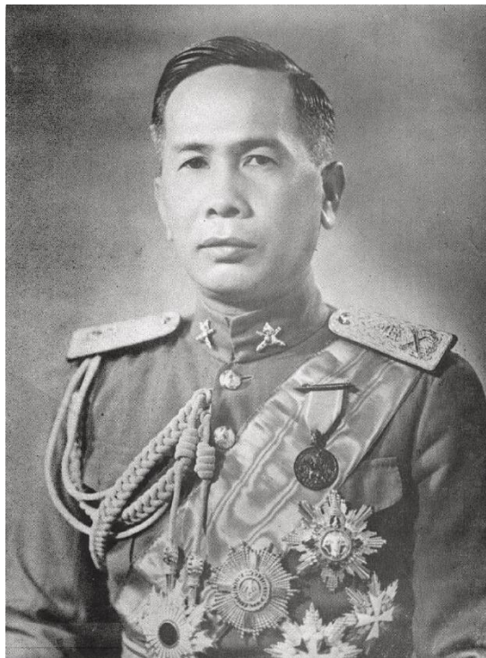
รูปที่ 6 จอมพล ป. พิบูลสงคราม

คัดค้าน ไม่เห็นด้วย แล้วแสดงออกอย่างโจ่งแจ้ง เช่น ผู้ต้องสงสัยนักหนังสือพิมพ์กลุ่มหนึ่งที่ได้ทำใบปลิวแจกเกี่ยวกับข้อกังขาของรัฐบาลจอมพล ป. ก็ถูกจับขึ้นศาลอย่างเข้มงวด ไทยตกอยู่ในช่วงปฏิวัติทางวัฒนธรรม จอมพล ป. พิบูลสงครามกุมบังเหียนการปกครองแทบทุกตำแหน่ง โดยดำรงตำแหน่งกระทรวงสำคัญในรัฐบาลหลายกระทรวง ได้แก่ กระทรวงมหาดไทย กระทรวงการต่างประเทศ กระทรวงศึกษาธิการ กระทรวงกลาโหม นอกจากนี้ จอมพล ป. ยังขึ้นดำรงตำแหน่งผู้บัญชาการทหารสูงสุดเกือบทุกเหล่าทัพ