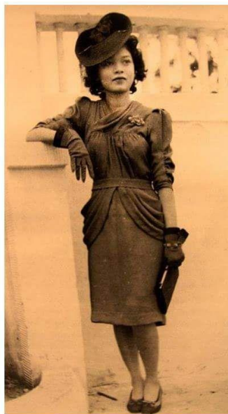
ภาพที่ 8 การประกวดแต่งกายสมัยจอมพล ป. พิบูลสงคราม

ที่มา https://scontent.fbkk6-1.fna.fbcdn.net/v/t1.0-9/fr/cp0/e15/q65/10713015_588597341250663_8761063478322542921_n.jpg?efg=eyJpljoidCJ9&oh=33d0390b1ccaf5208994195fec58af34&oe=594BDCFA