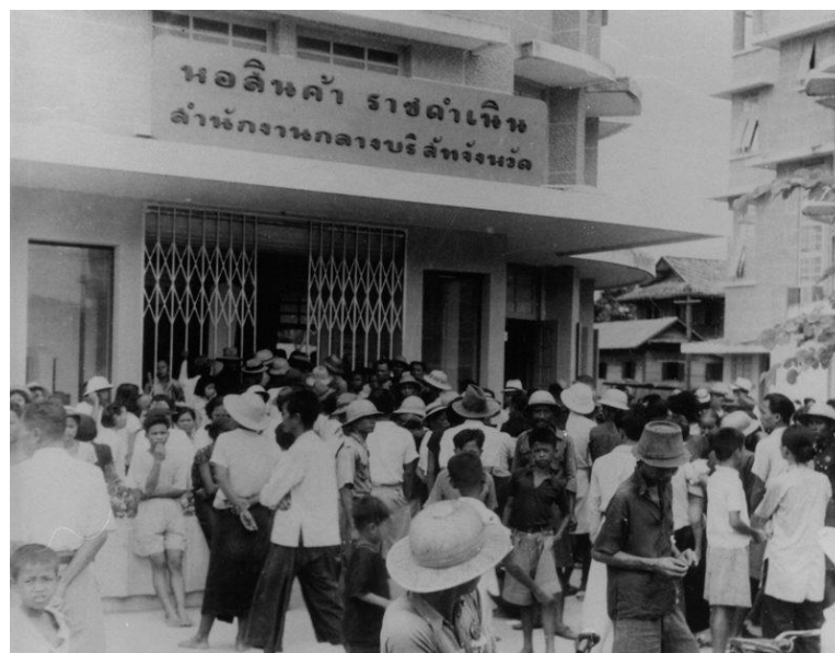
รูปที่ 12 ชาวไทยหน้าหอลิโด้ช่วงสงครามโลกครั้งที่สอง

การซื้อขายกับญี่ปุ่นก็ไม่ราบรื่นนัก เนื่องจากญี่ปุ่นก็อยู่ในภาวะขาดแคลนเช่นเดียวกัน ดังนั้นเวลาที่ไทยสั่งซื้อของจากญี่ปุ่นก็มักได้ไม่ครบตามจำนวนที่ต้องการ แม้แต่จอมพล ป. พิบูลสงคราม ก็ไม่พอใจ แต่ทำอะไรไม่ได้ รัฐบาลพยายามหาทางแก้สถานการณ์เงินเฟ้อในไทย ไม่ว่าจะเป็นการออกพันธบัตรเงินกู้ แต่ก็ไม่สามารถแก้ไขปัญหานี้ได้ในภาวะที่สงครามยังยืดเยื้ออยู่