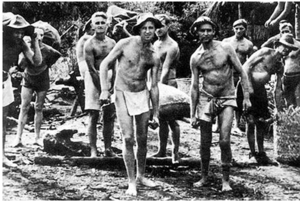
รูปที่ 5 เชลยศึกฝ่ายสัมพันธมิตรสร้างทางรถไฟ

จากข้างต้น ประเทศไทยจึงเป็นประเทศที่ญี่ปุ่นต้องการใช้เป็นพื้นที่ข้ามผ่านไปยังพม่า การยกพลขึ้นบกในไทยจึงเกิดขึ้น นอกจากนี้ญี่ปุ่นก็ยังได้แหล่งที่ตั้งกองทัพ การสร้างเส้นทางรถไฟใหม่ ทรัพยากรเพิ่มจากการกดดันให้ไทยยอมเข้าร่วมกับฝ่ายอักษะด้วย