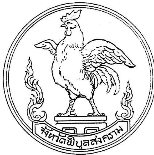
ภาพที่ 7 สัญลักษณ์ไก่ของจอมพล ป. พิบูลสงคราม

ประจวบเหมาะกับช่วงสงครามที่ญี่ปุ่นเข้ามาโฆษณาชวนเชื่อว่าจะสามารถช่วยไทย ให้ไทยได้ เป็นสหายเคียงบ่าเคียงไหล่ ทวงคือดินแดนที่เป็นของไทยกลับคืนด้วยแนวคิด “วงศ์ไพบูลย์ร่วมแห่ง เอเชียตะวันออกเฉียงใต้” หรือ “เอเชียเพื่อชาวเอเชีย” ทั้งไทยและญี่ปุ่นได้กระชับความสัมพันธ์กัน ในหลายด้าน ไม่ว่าจะเป็นด้านการศึกษา เศรษฐกิจ วัฒนธรรม โดยมีการจัดตั้งศูนย์วัฒนธรรมญี่ปุ่นใน ไทย ไทยคิดว่าเราจะสามารถยิ่งใหญ่เทียบเคียงญี่ปุ่นได้ (แถมสุข นุ่มนนท์, 2521:42) ยิ่งยามคับขัน อย่างช่วงสงครามก็ต้องเชื่อผู้นำเป็นสำคัญตั้งข้างต้น นอกจากคำขวัญปลุกใจมากมายยังมีสัญลักษณ์ รูปไก่ สีเขียว ซึ่งสิ่งเหล่านี้เป็นสัญลักษณ์ของจอมพล ป. พิบูลสงคราม ให้มีการติดรูปผู้นำไว้ที่บ้าน