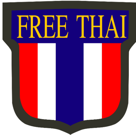
รูปที่ 11 เสรีไทย