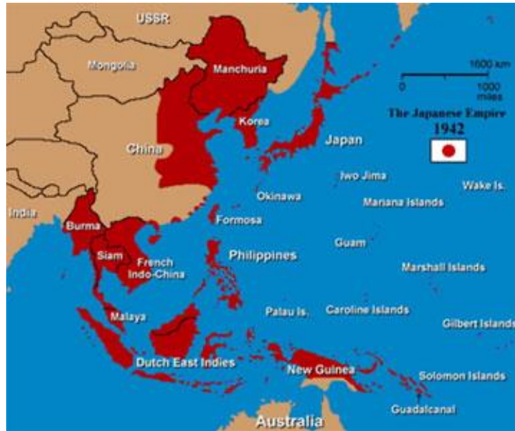
รูปที่ 2 แผนที่ The Japanese Empire