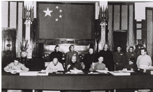
ภาพแสดงตัวแทนรัฐบาลทิเบตลงนามในสนธิสัญญาสิบเจ็ดข้อ

องค์ดาไลลามะประมุขแห่งทิเบตมีสถานะเป็นผู้นำศาสนาด้วย โดยจีนจะควบคุมด้านการต่างประเทศ และกลาโหม (THANYAWEE'S WORLD, April 11, 2008)