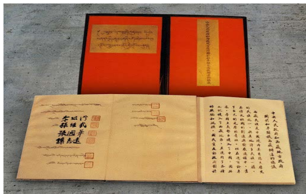
ภาพแสดงสนธิสัญญาสิบเจ็ดข้อ (Seventeen Point Agreement)