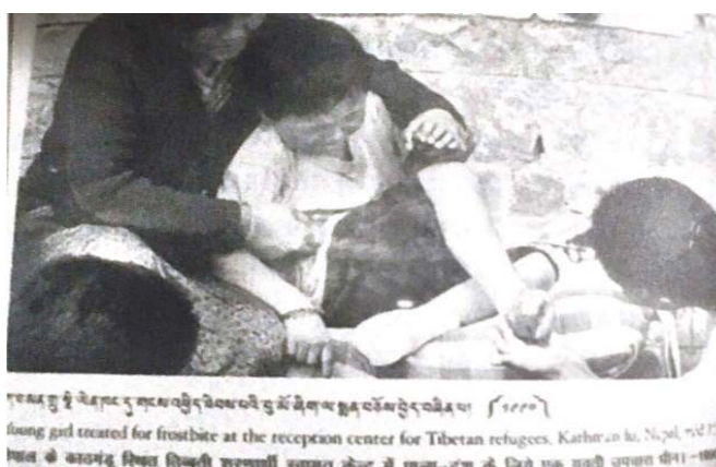
ภาพแสดงการปฐมพยาบาลให้กับชาวทิเบตที่ถูกหิมะกัดนิ้วเท้าขณะเดินทางลี้ภัยจากทิเบตไปอินเดีย