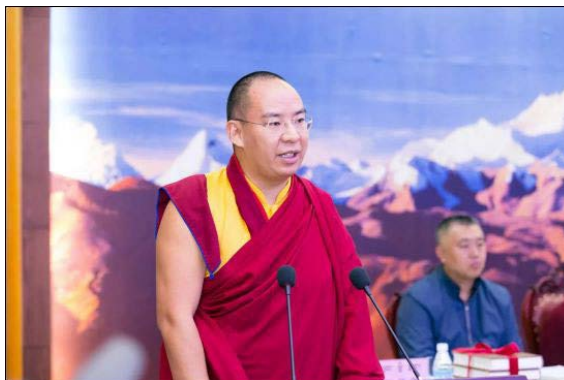
ภาพแสดงเกียลเชน นอร์บู (ปันเซนลามะองค์ที่ 11) ในปัจจุบัน