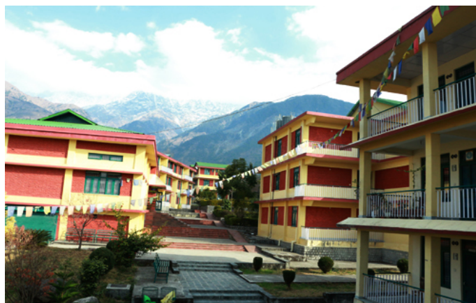
ภาพแสดงศูนย์รับรองชั่วคราวสำหรับชาวทิเบต (Reception Tibetan Center) ที่เมืองธรรมศาลา ประเทศอินเดีย