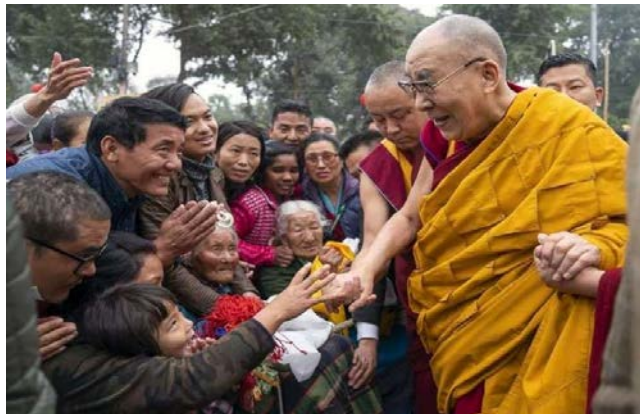
ภาพแสดงผู้อพยพชาวทิเบตเข้าเฝ้าองค์ดาไลลามะที่ 14 ณ ประเทศอินเดีย