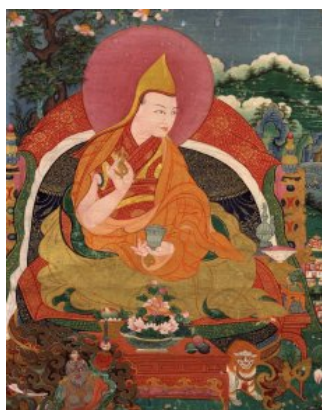
ภาพวาดสีแสดงรูปท่านโชนัม เกียโซ (Sonam Gyatso)

อัลตันข่านเป็นขุนอี่หวาง (Shunyi Wang) ฐานะเจ้าผู้ครองแคว้นมองโกล หลังจากนั้นอัลตันข่านได้ขอนิมนต์เชิญท่านโชนัม เกียโซให้เดินทางมายังมองโกเลียในค.ศ. 1577 และในครั้งนี้นี้ท่านได้ตกลงยินยอมเดินทางมาและพบกับท่านอัลตันข่านในที่สุด ผลจากการพบกันในครั้งนี้สร้างความเลื่อมใสศรัทธาในพระพุทธศาสนาให้แก่อัลตันข่านเป็นอย่างมาก พระองค์โปรดให้สร้างวัดเท็กเซ็น ซอนคอร์ (Thegchen Chonkhor Monastery) ณ สถานที่ที่ทรงพบกันครั้งแรกระหว่างท่านโชนัม เกียโซกับอัลตันข่าน ซึ่งนับเป็นวัดทางพระพุทธศาสนาแห่งแรกของมองโกเลีย (ปิยะแสง จันทรวงศ์ไพศาล, 2558 : 176)