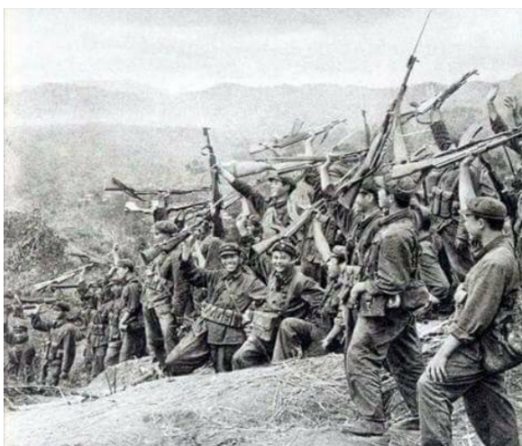
ภาพแสดงกองทัพจีนแสดงความดีใจกับชัยชนะในการทำสงครามกับอินเดีย

ลามะชั้นสูงหลายรูป อีกทั้งผู้อพยพชาวทิเบตราว 80,000 คนลี้ภัยออกจากทิเบตไปจัดตั้งรัฐบาลทิเบตพลัดถิ่นหรือสำนักบริหารงานทิเบตส่วนกลาง (Central Tibetan Administration of H.H. the Dalai Lama) ที่เมืองธรรมศาลา รัฐหิมาจัลประเทศ ซึ่งอยู่ทางตอนเหนือของประเทศอินเดีย โดยใช้เวลาประมาณ 2 สัปดาห์ ในการเดินทางถึงพรมแดนอินเดียเมื่อวันที่ 31 มีนาคม ค.ศ. 1959 ในขณะที่พื้นที่และดินแดนทิเบตเดิมได้รับการจัดตั้งขึ้นเป็นเขตการปกครองตนเองทิเบต (Tibet Autonomous Region : TAR) ภายใต้การปกครองของสาธารณรัฐประชาชนจีน อีกทั้งอินเดียเริ่มมีนโยบายจัดตั้งทหารตามแนวชายแดนรวมทั้งอีกหลายแห่งทางตอนเหนือของถนนสายแมกมาฮอน ส่วนทางทิศตะวันออกถูกควบคุมโดยจีน ซึ่งปัญหาในดินแดนพิพาทตามแนวชายแดนหิมาลัย 3,225 กิโลเมตรไม่สามารถยุติได้ กระทั่งในวันที่ 20 ตุลาคม ค.ศ. 1962 เกิดสงครามระหว่างจีนและอินเดีย สาเหตุหลักในการทำสงครามคือ ข้อพิพาทเรื่องแนวพรมแดนแมกมาฮอนที่อังกฤษได้กำหนดขึ้น โดยจีนและอินเดียทำการสู้รบตามภูเขาที่ระดับความสูงกว่า 4,000 เมตรและไม่มีกองทัพอากาศหรือกองทัพอากาศทั้งสองฝ่าย และสงครามยังเกิดขึ้นพร้อมกับช่วง 13 วันในวิกฤตการณ์ชิปนาวูธคิวบาที่สหรัฐอเมริกาและสหภาพโซเวียต เผชิญหน้ากัน อินเดียจึงไม่ได้รับความช่วยเหลือจากทั้งสองประเทศเหล่านี้ ทำให้จีนได้นำกองกำลังโจมตีพร้อมกันในลาดัคห์และทั่วทั้งถนนสายแมกมาฮอน และเข้ายึดเมืองRezang La ทางภาคตะวันตก และเมืองTawang ทางภาคตะวันออกของประเทศอินเดีย สงครามสิ้นสุดลงเมื่อจีนประกาศพักรบในวันที่ 20 พฤศจิกายน ค.ศ. 1962 และพร้อมประกาศถอนตัวออกจากพื้นที่พิพาท (THANYAWEE'S WORLD, April 11, 2008)