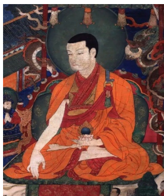
ภาพวาดสีแสดงรูปพระอาจารย์เซอเกียล พักปา (Chogyal Phagpa)