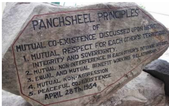
ภาพแสดงหลักปัญจศีล (Panchsheel)