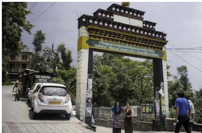
ภาพแสดงประตูทางเข้าที่ทำการรัฐบาลทิเบตพลัดถิ่น