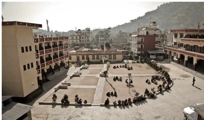
ภาพแสดงศูนย์รับรองชั่วคราวสำหรับชาวทิเบต (Reception Center in Nepal-Kathmandu) ประเทศเนปาล