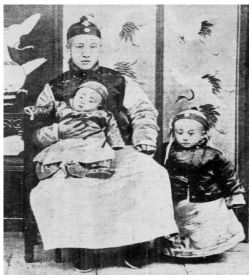
ภาพจักรพรรดิปุยี้ในวัยสามพรรษา (ทรงยืน) พร้อมองค์ชายซุนพระบิดา และพระอนุชา