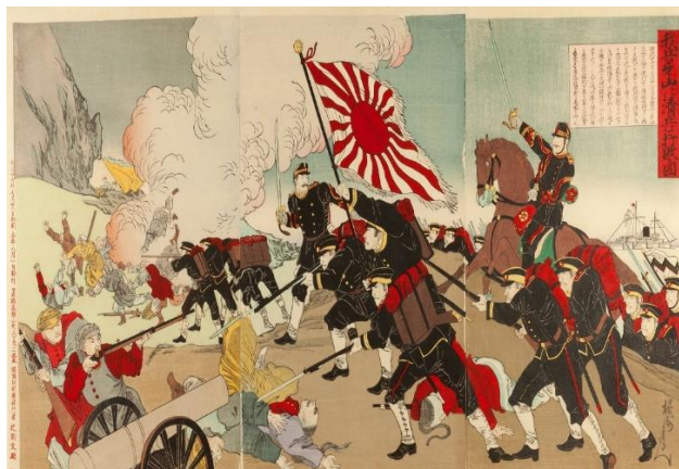
ภาพวาดกองทัพญี่ปุ่นเข้าขับไล่กองทัพจักรวรรดิต้าชิงในสงครามจีน-ญี่ปุ่น ครั้งที่หนึ่ง

สงครามจีน-ญี่ปุ่น ครั้งที่หนึ่ง เริ่มต้นขึ้นหลังการปฏิรูปเมจิในญี่ปุ่นในช่วงปลายศตวรรษที่ 19 ญี่ปุ่นเริ่มขยายอำนาจออกนอกประเทศ จึงนำกองทัพบุกยึดครองเกาหลี ซึ่งที่เมืองท่าอาซาน ประเทศเกาหลี ในขณะนั้นมีทหารจีนเข้ามาปราบปรามกบฏประจำการอยู่ พร้อมด้วยเรือรบคอยคุ้มกันจำนวนหนึ่ง เมื่อเรือรบของญี่ปุ่นและจีนมาเจอกันจึงเกิดการปะทะกันขึ้น และตามมาด้วยการสู้รบทางบกในเวลาต่อมา โดยจีนเป็นฝ่ายพ่ายแพ้ทั้งสองครั้ง จีนจึงประกาศสงครามกับญี่ปุ่นอย่างเป็นทางการในวันที่ 4 สิงหาคม ค.ศ. 1894 ญี่ปุ่นมีกองกำลังที่มีศักยภาพทางการรบมากกว่าจีน เนื่องจากรับเอาวิทยาการความรู้ทางด้านตะวันตกมาใช้ จึงเปรียบพร้อมไปด้วยยุทธโศปกรณ์ที่ทันสมัยและล้ำหน้า จึงสามารถเอาชนะกองทัพจีนได้อย่างราบคาบ ส่งผลให้ทหารจีนเสียชีวิตและได้รับบาดเจ็บจำนวนมาก จีนจึงเรียกร้องให้มีการสงบศึกและยอมทำตามข้อเรียกร้องของญี่ปุ่น การเจรจาสันติภาพของทั้งสองประเทศจึงเริ่มขึ้น โดยในวันที่ 17 เมษายน ค.ศ. 1895 ประเทศจีน โดยราชวงศ์ชิงได้ลงนามในสนธิสัญญาร่วมกับจักรวรรดิญี่ปุ่น โดยสนธิสัญญาฉบับนี้มีชื่อว่า สนธิสัญญาชิโมะโนะเซกิ เนื้อหาในสัญญาทำให้ประเทศจีนเสียเปรียบในทุกด้าน สรุปได้ว่า ประการแรก จีนต้องรับรองความเป็นอิสระอย่างสมบูรณ์ของเกาหลี ประการที่สอง จีนต้องรับรองในอำนาจอธิปไตยของจักรวรรดิญี่ปุ่นเหนือดินแดนเผิงหู ไต้หวัน รวมทั้งป้อมปราการค่ายทหาร และทรัพย์สินทั้งหมดในบริเวณดินแดนตะวันออกของคาบสมุทรเหลียวตง ประการที่สาม จีนต้องชำระค่าปฏิกรรมสงครามแก่ญี่ปุ่นเป็นจำนวนทั้งสิ้น 200 ล้านตำลึง และประการสุดท้าย จีนต้องเปิดเมืองซาชิ ฉงชิ่ง ชูโจวและหางโจวเพื่อทำการค้ากับญี่ปุ่น รวมทั้งให้ญี่ปุ่นเป็นชาติที่ได้รับอนุเคราะห์ยิ่งหรือชาติที่ได้เปรียบทางการค้า