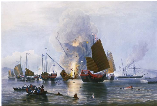
ภาพวาดการทำสงครามทางเรือระหว่างจีนกับอังกฤษในสงครามฝิ่น