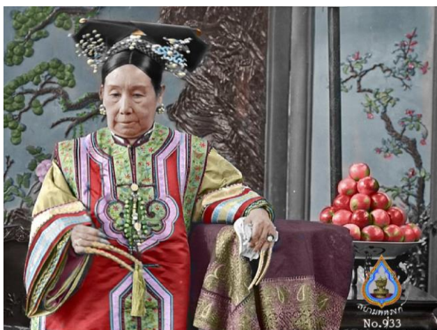
ภาพลงสีของพระนางซูสีไทเฮา

นอกจากนี้ ราชวงศ์ชิงยังต้องเผชิญกับอีกหนึ่งปัญหาสำคัญที่เกิดขึ้นภายในราชสำนัก ในช่วงปลายของราชวงศ์ตั้งแต่สมัยจักรพรรดิถงจื่อ (ค.ศ. 1861 - 1874) จักรพรรดิถงจื่อ มาจนถึงจักรพรรดิปู้ยี่ (ค.ศ. 1906 - 1967) เนื่องจากการเข้ามามีบทบาทในการแทรกแซงอำนาจทางการเมือง นั่นคือการว่าราชการหลังม่านของพระนางซูสีไทเฮา