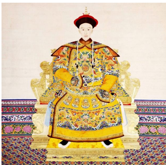
ภาพวาดสมเด็จพระจักรพรรดิ กวางสวี่