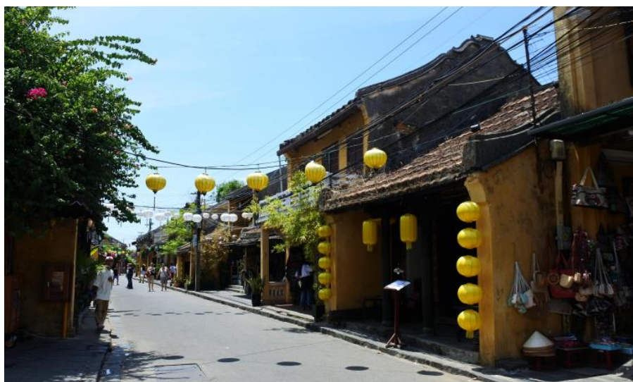
ภาพที่ 8 บ้านไม้แบบโบราณและตึกเก่าสีเหลืองสไตล์โคโลเนียล

การเป็นตัวอย่างเมืองที่สำคัญตั้งแต่ยุคแห่งเป็นเมืองท่าทางการค้าระหว่างประเทศ ที่แสดงให้เห็นถึงการผสมผสานทางวัฒนธรรม ศิลปะ และสถาปัตยกรรม ของชาติตะวันตกกับท้องถิ่นเวียดนามอย่างมีเอกลักษณ์ อยู่ท่ามกลางบรรยากาศความเป็นศูนย์กลางของชุมชน ซึ่งมีมรดกโลกเพียงไม่กี่แห่งเท่านั้นที่มีผู้คนอาศัยอยู่ถือได้ว่าเป็นเมืองมรดกโลกที่มีชีวิต และการเป็นแหล่งรวมของบ้านไม้โบราณเก่าแก่ขนาดใหญ่ของเวียดนาม ยกตัวอย่างสถานที่ท่องเที่ยวที่เป็นเอกลักษณ์เช่น สะพานญี่ปุ่น (Japanese Covered Bridge) ที่เป็นสัญลักษณ์ของเมืองฮอยอัน ได้รับการผสมผสานจากวัฒนธรรมแบบญี่ปุ่น และ บ้านเลขที่ 101 (Old House No.101) ที่มีเสน่ห์บ้านไม้แบบโบราณและตึกเก่าสีเหลืองสวีสไตล์โคโลเนียล ที่ผสมผสานจากศิลปะแบบฝรั่งเศส อาคารเหล่านี้ได้รับการอนุรักษ์เอาไว้ให้อยู่ในสภาพเดิมไว้ได้เป็นอย่างดีดังเช่นอดีต แม้ว่าจะผ่านอุทกภัยและสงครามต่าง ๆ ในช่วงกว่า 400 ปีที่ผ่านมา ทำให้นักท่องเที่ยวจำนวนมากอยากมาสัมผัสเมืองเก่าแห่งนี้