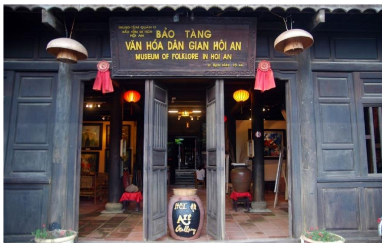
ภาพที่ 5 พิพิธภัณฑ์เซรามิก