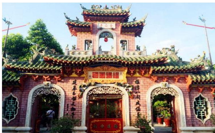
ภาพที่ 3 สมาคมฟุกเกียน