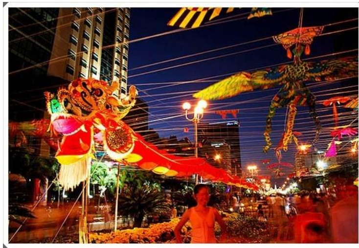
ภาพที่ 6 เทศกาลเฉลิมฉลองปีใหม่