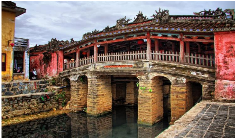
ภาพที่ 2 สะพานญี่ปุ่น