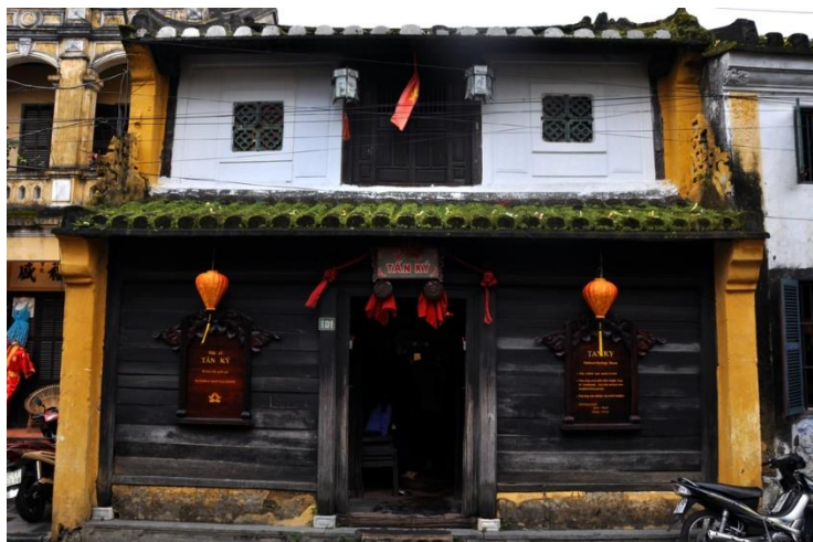
ภาพที่ 4 บ้านเลขที่ 101