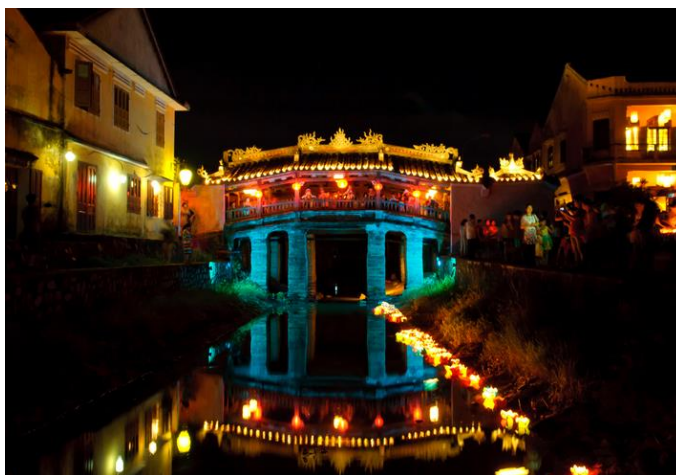
ภาพที่ 7 เทศกาลโคมไฟฮอยอัน