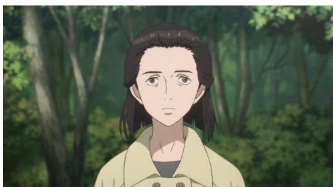
ภาพที่ 3.8 อิชิมิ โนบุโกะ