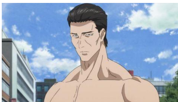
ภาพที่ 3.10 โกโต