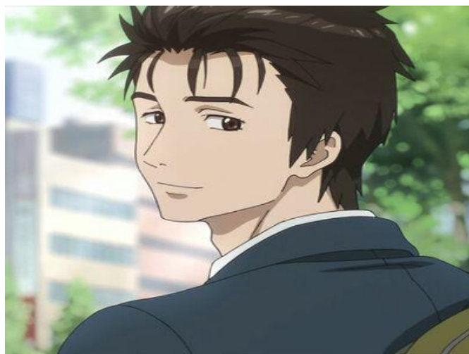
ภาพที่ 3.3 อิซุมิ ซินอิจิ