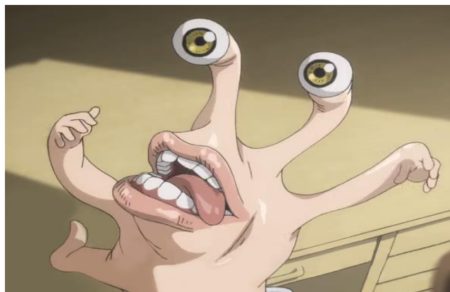
ภาพที่ 3.4 มิกิ