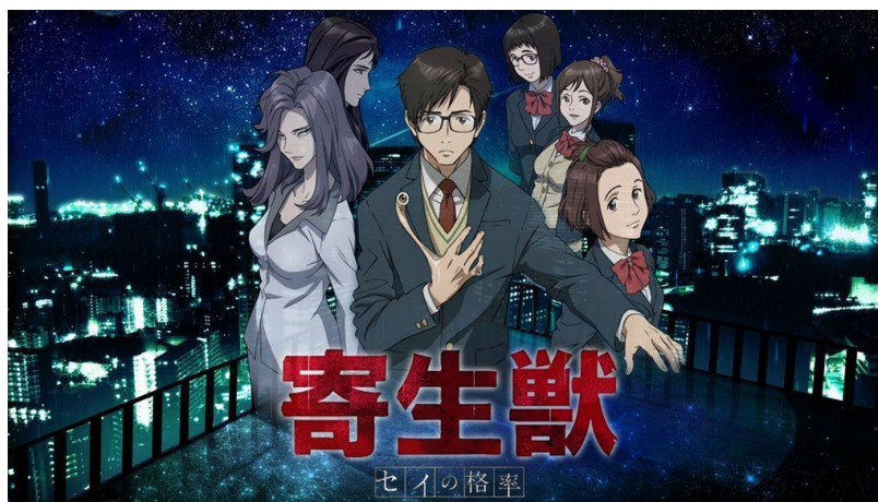
ภาพที่ 3.1 โปสเตอร์ภาพยนตร์เรื่อง Kiseijuu: Sei no Kakuritsu