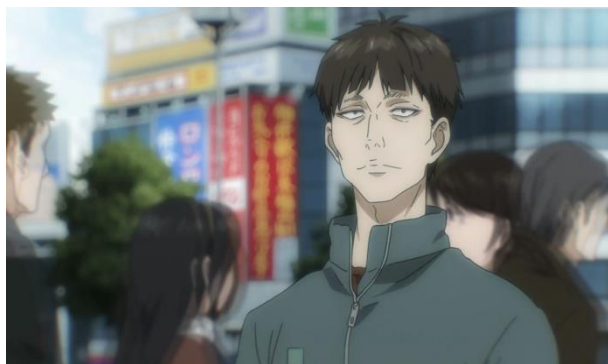
ภาพที่ 3.7 อูระกะมิ