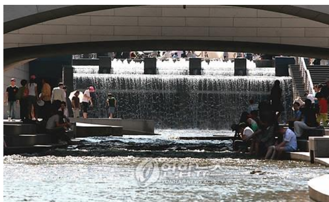
ภาพที่ 12 ภาพถ่ายบริเวณคลองของเอกชนที่พัฒนาแล้ว

จากที่สถาบันหลายแห่งได้ทำแบบสอบถามเกี่ยวกับการฟื้นฟูคลองของเอกชน ในการสำรวจที่จัดขึ้นโดยประชากรและผู้เชี่ยวชาญตั้งแต่ พ.ศ. 2538 เป็นแบบสอบถามที่จัดทำขึ้นโดยทีมนักวิจัยพัฒนาเมืองโซลเพื่อพลเมือง จากคำถามที่ว่า การฟื้นฟูคลองของเอกชนนั้นช่วยฟื้นฟูสภาพแวดล้อมระบบนิเวศนี้ได้หรือไม่ ซึ่งแบบสอบถามที่จัดทำขึ้นโดยมีเป้าหมายของกลุ่มคนในการทำแบบสอบถามคือ ผู้จัดหาพื้นที่โดยรอบคลองของเอกชนและกรุงโซล พบว่าการพัฒนาดังกล่าวได้ทำให้ผู้คนยอมรับ (อียูมี , 2553)