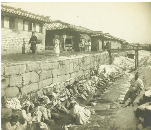
ภาพที่ 10 ภาพคลองของเกซอนในสมัยโบราณ

สุวิทย์ วงศ์จิราวาณิชย์, คลองของเกซอน รือทางด่วนพลิกน้ำทำให้เป็นแหล่งพักผ่อนกลางกรุงโซล, เข้าถึงเมื่อ 14 กุมภาพันธ์ 2563, เข้าถึงได้จาก https://www.creativemove.com/creative/cheonggyecheon/