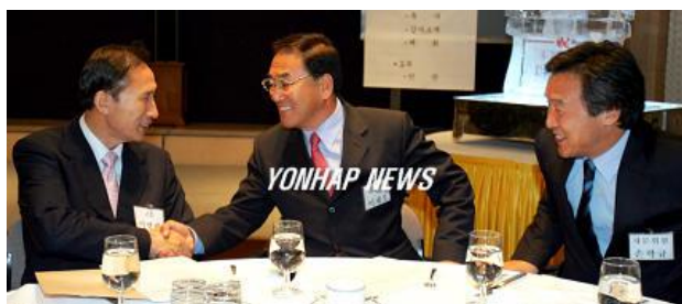
ภาพที่ 4 ภาพนายลีมียองบักกำลังเจรจาธุรกิจ

ตั้งแต่นั้นเป็นต้นมานายลียังมีอีกกลายเป็น “คนรุ่นแรกผู้บุกเบิกการปกครองระบบ ประชาธิปไตย” ( First Generation of Democratization) ประธานาธิบดีลีแต่งงานกับนางคิมยุน- ออก และมีลูกสาวด้วยกัน 3 คน และลูกชายอีก 1 คน (หนังสือพิมพ์คยองฮยง, 2550)