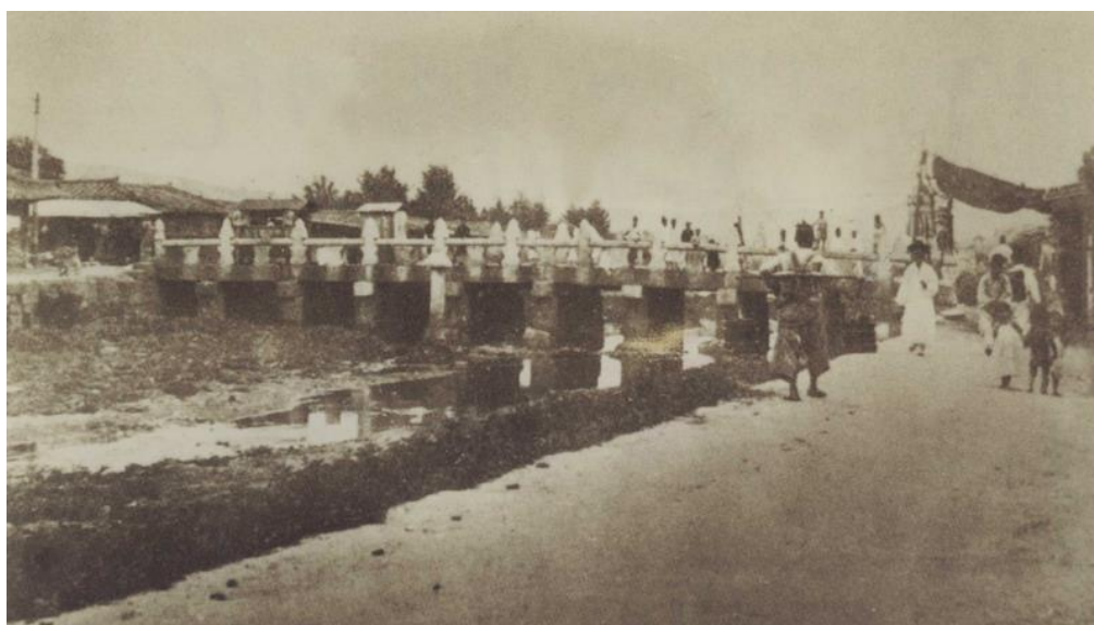
ภาพที่ 7 ภาพคลองของเอกชนในอดีต

ระยะทางกว่า 27.8 กิโลเมตร และในหกสถานีของสถานีทั้งหมด มีผู้โดยสารกว่า 1 แสนคนต่อวัน พื้นที่บริเวณดังกล่าวมีสถานีรถไฟมากขึ้น 20 สถานี แต่ด้วยสาเหตุที่ทำให้เกิดผลกระทบที่ไม่เป็นมิตรกับธรรมชาติที่มาจากการสร้างสะพานยกระดับเหนือคลองของเอกชน ทำให้เกิดปัญหาการจราจรติดขัดในบริเวณนั้นด้วย ถึงแม้สามารถใช้บริการขนส่งสาธารณะได้ แต่ในปัจจุบันตัวเลขของผู้ใช้รถโดยสารนั้นได้ลดลงอย่างรวดเร็ว แม้จะมีรถบัสถึง 18 สายในบริเวณพื้นที่คลองของเอกชน แต่จำนวนผู้โดยสารโดยเฉลี่ยของรถบัส หรือป้ายหยุดรถเหล่านั้นมีเพียง 1 คนเท่านั้น ในขณะที่เดียวกันก็มีที่จอดรถ 800 กว่าแห่งเพื่อให้รถยนต์ได้จอดกัน ไปจนถึงการจอดรถบนที่ห้ามจอดบนถนน ซึ่งเป็นสิ่งที่ผิดกฎหมายก็เป็นตัวอย่างที่บอกได้ว่าจำนวนรถภายในกรุงโซลนั้นมีจำนวนมากเกินไป ภายใต้ทางด่วนยกระดับของเอกชนก็มีที่จอดรถที่ผิดกฎหมายอยู่ได้สะพานเช่นกัน ปริมาณคนเดินเท้าภายในเมืองนั้นมีมากกว่า 2000 คนต่อวัน แม้จะมีตัวเลขผู้ใช้ทางเท้าเป็นจำนวนมาก แต่ก็ยังมีปัญหาเรื่องทางข้ามถนน และปัญหาอีกมากมาย เช่นการขับขี่มอเตอร์ไซค์บนทางเท้าที่ก่อให้เกิดอุบัติเหตุแก่คนเดินถนน (ฮวังกียอน , 2546)