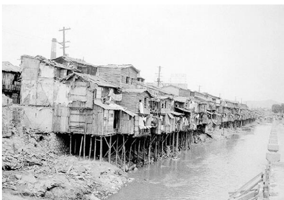
ภาพที่ 8 ภาพคลองชองเกซอนที่แออัด

ชองเกซอนเป็นเมืองหลวงของโชซอนที่เต็มไปด้วยราษฎรเกาหลีตั้งแต่ก่อน พ.ศ. 1937 เดิมทีชองเกซอนมีชื่อว่า เกซอน และตั้งอยู่ในพื้นที่ลุ่มบริเวณเนินเขาทางตะวันตกเฉียงเหนือของโซล คลองชองเกซอน มีความยาว 10.92 กิโลเมตร และมีความกว้าง 84 เมตร