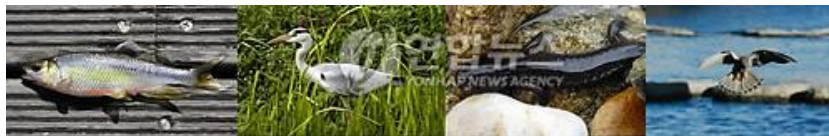
ภาพที่ 11 ภาพของสภาพสิ่งแวดล้อมหลังการพัฒนาคลอง

이유미. 청계천 생물종 복원전보다 6.4배 늘었다. Accessed February 19, 2020, available from https://news.naver.com/main/read.nhn?mode=LSD&mid=sec&sid1=102&oid=001&aid=0002516724