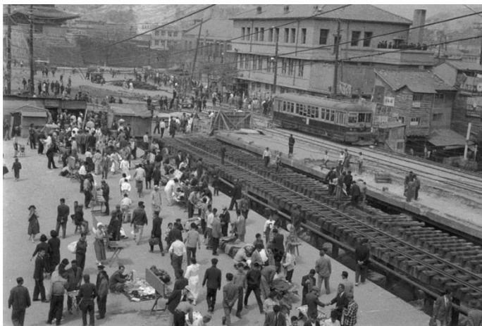
ภาพที่ 9 ภาพคลองของเกซอนที่หนาแน่นไปด้วยผู้คน

สุวิทย์ วงศ์จิราพาณิชย์, คลองของเกซอน รื้อทางด่วนพลิกน้ำมาให้เป็นแหล่งพักผ่อนกลางกรุงโซล, เข้าถึงเมื่อ 14 กุมภาพันธ์ 2563, เข้าถึงได้จาก https://www.creativemove.com/creative/cheonggyecheon/