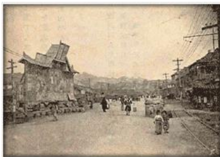
ภาพที่ 2 ภาพคลองของเกซอนจากเว็บไซต์ท้องถิ่นประจำโซล

이다일.서울 청계천 서울 시내 복원하천. accessed February 2, 2020, available from: https://terms.naver.com/entry.nhn?docId=3569110&cid=58923&categoryId=58932