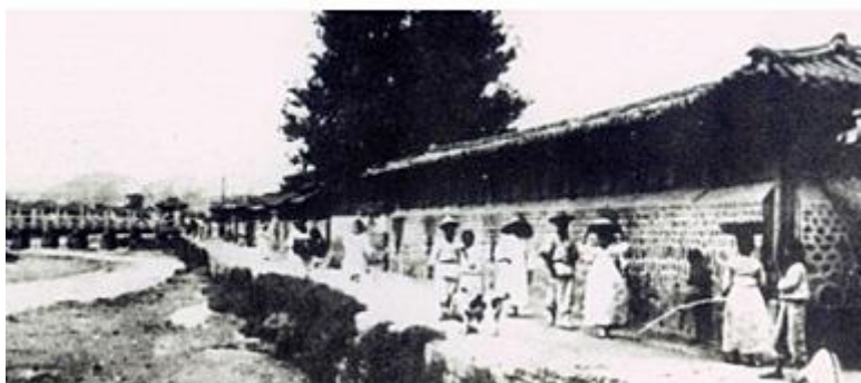
ภาพที่ 1 ภาพคลองของเกซอนก่อนการพัฒนา

คลองของเกซอนเป็นคลองที่ไหลผ่านใจกลางเมืองหลวงของสาธารณรัฐเกาหลี ความสำคัญของคลองนี้ในอดีตนั้นคือทำหน้าที่เป็นเหมือนกับที่ระบายน้ำเมื่อเมืองประสบกับอุทกภัย ในสมัยกษัตริย์แทจง (King Taejong) และในสมัยกษัตริย์ยองโซ (King Yeongso) คลองของเกซอนเกิดการตื่นขึ้น ทำให้ต้องระดมคนมาขุดคลองขยายเพื่อให้ประชาชนได้มีน้ำใช้อย่างสะอาดและปลอดภัย วิถีชีวิตของประชาชนบริเวณคลองนี้เริ่มเปลี่ยนแปลงไปช่วงสงครามญี่ปุ่นเข้ายึดประเทศเกาหลีใต้ จากเดิมที่เป็นพื้นที่ใช้ในการแสดงวัฒนธรรม เริ่มเปลี่ยนเป็นแหล่งชุมชนแออัด ทำให้คลองที่เคยใสสะอาดก็เริ่มส่งกลิ่นเหม็น รัฐบาลก็ไม่ได้ให้ความสำคัญกับการพัฒนาคลองส่วนนี้นัก จึงมีการสร้างถนนคอนกรีตปิดทับคลองของเกซอนที่ส่งกลิ่นเหม็น