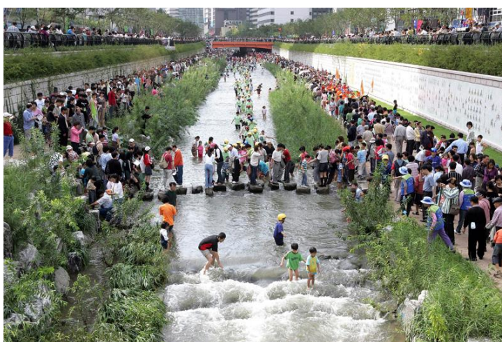
ภาพที่ 6 ภาพคลองของเกซอน

ประกอบด้วยโครงสร้างของถนน 50-80 เมตร และด้วยความยาว 5.86 กิโลเมตร กว้าง 16 เมตรของทางด่วนยกระดับของเกซอน และ 11 กิโลเมตรของการสกัดกั้นสิ่งปฏิกูลที่อยู่ภายใต้ทางยกระดับ (เกลาค่า) รถมากกว่า 168,000 คันต่อวันต่างใช้ทางตรงของเกซอนและทางยกระดับ จากการศึกษาเกี่ยวกับสังคมเมืองของสาธารณรัฐเกาหลี ปี 2000 ร้อยละ 62.5 ของรถเหล่านั้นทำให้การจราจรติดขัดเป็นอย่างมากและการแก้ไขปัญหานี้ควรแล้วเสร็จภายในเวลา 3 ปี ด้วยงบประมาณ 100 ล้านบาท เพื่อที่จะลดความขาดแคลนของถนนและทางยกระดับ และเพราะเหตุนี้จึงทำให้โครงการฟื้นฟูคลองของเกซอนได้กำหนดขึ้น (นิวส์ทาวน์ , 2563)