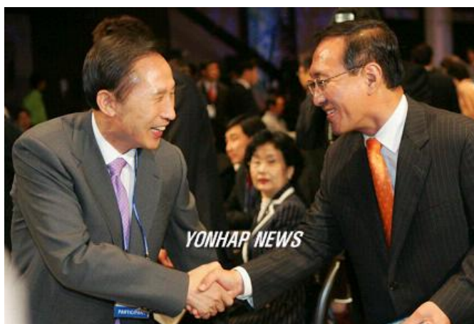
ภาพที่ 5 นายลีมย็องบักระหว่างการทำงาน

หน้าที่และงานพัฒนาของนายลีมย็องบัก นายลีมย็องบักได้เริ่มปฏิบัติหน้าที่ที่ได้รับมอบหมาย ในฐานะประธานาธิบดีเมื่อวันที่ 25 กุมภาพันธ์ พ.ศ. 2552 โดยเขาได้ให้คำมั่นสัญญาว่าจะพัฒนาและฟื้นฟูเศรษฐกิจ ไปจนถึงการกระชับความสัมพันธ์ระหว่างสาธารณรัฐเกาหลีกับสหรัฐอเมริกา รวมถึงได้กล่าวถึงการประนีประนอมต่อรองกับเกาหลีเหนือ และยิ่งไปกว่านั้น นายลีมย็องบักยังประกาศว่าจะรณรงค์เรื่องความสัมพันธ์ด้านการทูตทั่วโลก หากพิจารณาจากนโยบายด้านต่างๆ นโยบายด้านการศึกษาก็เป็นอีกสิ่งหนึ่งที่รัฐบาลของนายลีมย็องบักได้ทำผลงานไว้ เพราะในสมัยรัฐบาลของนายลี เขาได้ก่อตั้งมูลนิธิทุนการศึกษาแห่งชาติที่คอยบริการและให้คำปรึกษาเรื่องให้เงินกู้แก่นักเรียน (ทำเนียบน้ำเงินประธานาธิบดีเกาหลี , 2563 )