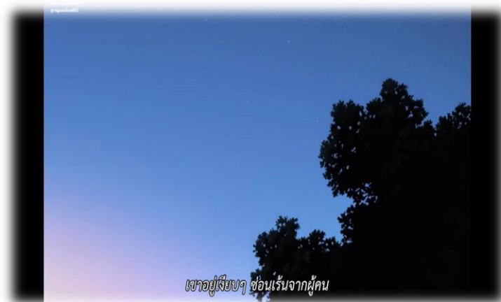
ภาพที่ 23 โอกามิเข้ามาในเมืองเพื่อซ่อนตัวจากผู้คน

5.1.1.2 โลกทัศน์ของตัวละครที่มีต่อเมือง ภาพยนตร์เรื่อง Wolf Children Ame and Yuki นั้นได้ชี้ให้เห็นว่าเมืองไม่ได้มีแต่ด้านดีเสมอไป ซึ่งสามารถแบ่งโลกทัศน์ที่ตัวละครมีต่อเมืองได้ดังนี้