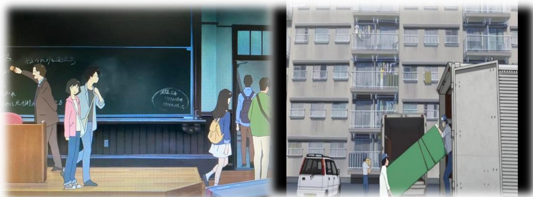
ภาพที่ 20 อาชีพครูและพนักงานรับจ้างขนของ

สื่อภาพยนตร์ปรากฏอาชีพที่หลากหลายที่แสดงให้เห็นถึงความเหลื่อมล้ำในสังคมเมือง ที่มีทั้งผู้ที่ประกอบอาชีพที่ได้ค่าตอบแทนน้อย ใช้แรงงานหนัก เช่น พนักงานขนของ คนงานขับรถบรรทุก เป็นต้น ไปจนถึงอาชีพที่มีหน้าตาในสังคมหรืออาชีพที่ได้ค่าตอบแทนสูง เช่น อาชีพหมอ อาชีพครู เป็นต้น