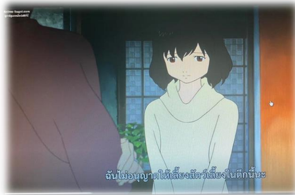
ภาพที่ 21 ห้ามเลี้ยงสัตว์ในที่พักอาศัย

การอาศัยอยู่ในเมืองยังมีความเคร่งครัด มีกฎระเบียบปรากฏอยู่ในฉาก เช่น การห้ามเลี้ยงสัตว์ภายในบริเวณที่พักอาศัย และ การมีหน่วยงานสถานสงเคราะห์ดูแลเด็กคอยดูว่าเด็กฉีควัคซีนครบหรือไม่ คอยดูแลตรวจสุขภาพเด็ก เป็นต้น เป็นกฎระเบียบที่ต้องทำตาม หากฝ่าฝืนไม่ทำตามกฎก็จะไม่สามารถอยู่ได้