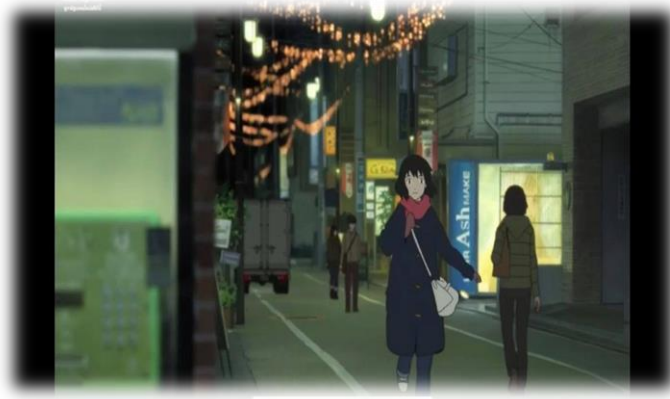
ภาพที่ 18 สภาพแวดล้อมในเมืองที่เต็มไปด้วยตึก ที่มา จากภาพยนตร์เรื่อง Wolf Children Ame and Yuli นาทีที่ 09.33