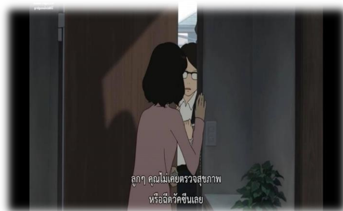
ภาพที่ 22 สถานสงเคราะห์ดูแลเด็กส่งคนมาตรวจลูกของฮานะ