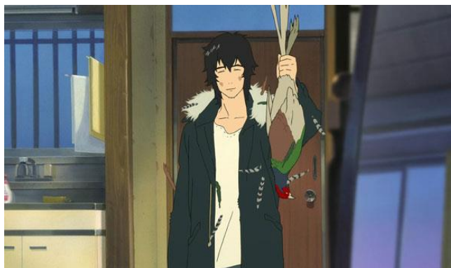
ภาพที่ 6 ตัวละครโอกามิ