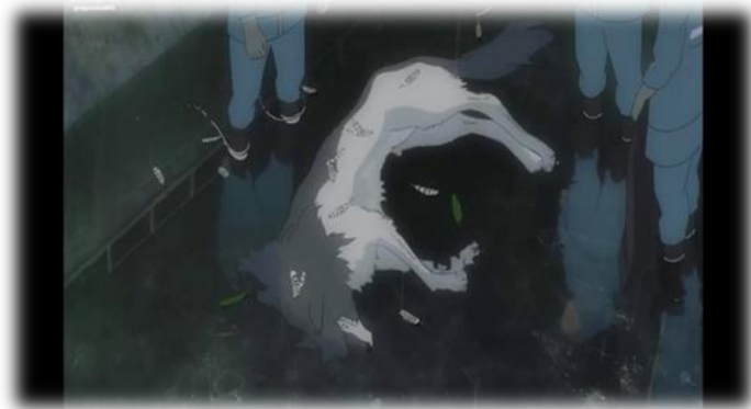
ภาพที่ 13 โอกามิเสียชีวิตในร่างหมาป่า ที่มา จากภาพยนตร์เรื่อง Wolf Children Ame and Yuki นาทีที่ 19.37