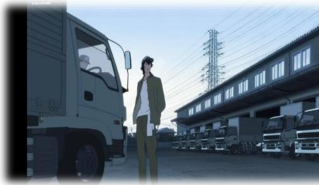
ภาพที่ 12 โอกามิทำอาชีพขับรถบรรทุก

4.2.1 ภาพแทนผู้ที่ปรับตัวไม่ได้หลังการย้ายถิ่น หมายถึง ภาพตัวแทนของผู้ที่ย้ายถิ่นฐานแล้วไม่สามารถปรับตัวให้เข้ากับพื้นที่ปลายทางได้ ซึ่งจากภาพยนตร์ ภาพแทนผู้ที่ปรับตัวไม่ได้หลังจากย้ายถิ่นถูกนำเสนอผ่าน ตัวละครโอกามิ ผู้ที่ย้ายจากชนบทไปยังเมือง ซึ่งการปรับตัวของตัวละครที่ต้องเจออุปสรรคต่าง ๆ หลังจากการย้ายถิ่น เช่น การไม่สามารถเข้ากับคนเมืองได้ หรือ การที่ต้องทำงานหนักเพื่อหาเลี้ยงครอบครัว ซึ่งไม่เพียงพอเนื่องจากค่าใช้จ่ายนั้นสูงกว่ารายรับที่ได้จากการทำงาน เป็นต้น และด้วยโอกามิมิมีลักษณะรักสงบ ไม่สูงส่งกับใคร จิตใจดี ขยัน แต่เขาก็ไม่สามารถสัมผัสความเป็นหมาป่าหรือสัญชาตญาณการใช้ชีวิตของหมาป่าได้ และด้วยต้องการหาอาหารดี ๆ ให้ครอบครัว เขาจึงออกล่าหาอาหาร จนทำให้เขาเสียชีวิตด้วยการตกน้ำในคลองตายขณะที่อยู่ในร่างหมาป่าเพื่อล่าสัตว์มากินนั่นเอง แสดงให้เห็นถึงผู้ที่ไม่สามารถปรับตัวให้เข้ากับผู้คนและสภาพแวดล้อมปลายทางที่ตนย้ายมาอยู่ได้ หรือเข้ามาอยู่ก็ลำบาก เนื่องจากไม่สามารถปรับเปลี่ยนวิถีชีวิตได้ และภาพแทนคนที่ปรับตัวไม่ได้มีลักษณะอีกอย่างหนึ่ง คือ ผู้ย้ายถิ่นที่ไม่สามารถปรับตัวได้จะคบค้ากับแค่พวกกลุ่มคนที่อยู่ในสถานะเดียวกับตนเป็นส่วนใหญ่ ซึ่งก็คือชนชั้นแรงงานเหมือนกัน เนื่องจากผู้ย้ายถิ่นจะรู้สึกแปลกแยกจากคนเมือง รู้สึกว่าตนนั้นแตกต่างไม่สามารถเข้ากันได้