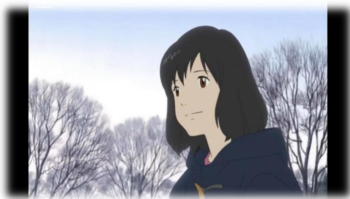
ภาพที่ 10 ฮานะตัดสินใจย้ายบ้าน ที่มา จากภาพยนตร์เรื่อง Wolf Children Ame and Yuli นาทีที่ 29.29

แต่การย้ายถิ่นในลักษณะนี้ก็ทำให้เห็นถึงภาพผู้ย้ายถิ่นจากเมืองไปชนบทว่า ผู้ย้ายถิ่นนั้นต้องพบเจอกับความลำบาก ไม่สะดวกเหมือนตอนอยู่ในเมืองแต่มีคนพื้นเมืองคอยช่วยเหลือ