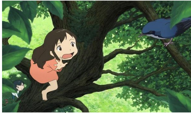
ภาพที่ 4 ตัวละครยูกิ