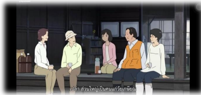
ภาพที่ 29 ชาวบ้านมาพูดคุยและนำของมาฝากฮานะและลูก ๆ