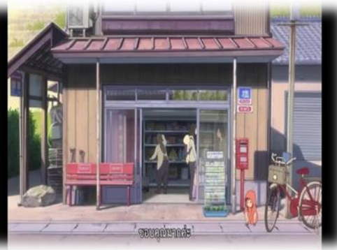
ภาพที่ 16 ฮานะซื้อของในร้านขายของชำ