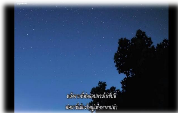
ภาพที่ 8 โลกามีตัดสินใจเข้าเมืองหลังสอบใบขับขี่ผ่าน ที่มา จากภาพยนตร์เรื่อง Wolf Children Ame and Yuli นาทีที่ 13.27

ชนบทที่ย้ายเข้ามาในเมือง มีนัยยะภาพแทนของคนจน ที่เข้ามาทำงานซึ่งคนเมืองไม่ต้องการทำ เป็นแรงงาน ชั้นล่างที่คนเมืองไม่สนใจ