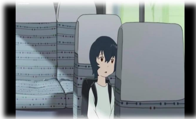
ภาพที่ 27 อะเมะนั่งรถบัสไปโรงเรียน ที่มา จากภาพยนตร์เรื่อง Wolf Children Ame and Yuli นาทีที่ 1.06.05