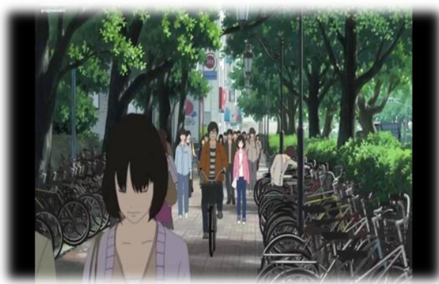
ภาพที่ 17 วิถีชีวิตตอนเช้าของผู้คนในเมือง

5.1.1.1 ลักษณะของเมืองที่ปรากฏในภาพยนตร์ มีลักษณะดังต่อไปนี้ เมืองเป็นพื้นที่ที่มีความเจริญ ไม่ว่าจะเป็นในด้านของเศรษฐกิจหรือเทคโนโลยี ด้วยเหตุผลนี้ทำให้ในเมืองมีประชากรอาศัยอยู่เยอะ ฉากในเมืองจะมีผู้คนหนาแน่น ประชากรที่ปรากฏในภาพยนตร์ฉากในเมืองส่วนใหญ่จะอยู่ในช่วงวัยรุ่นและวัยทำงาน