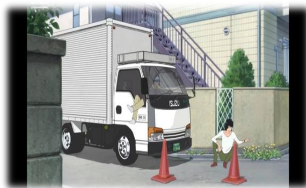
ภาพที่ 9 โลกามี ทำงานขับรถบรรทุกและขนของ ที่มา จากภาพยนตร์เรื่อง Wolf Children Ame and Yuli นาทีที่ 19.35

4.1.2 ภาพแทนการย้ายถิ่นจากเมืองไปชนบท หมายถึง ภาพตัวแทนของการย้ายถิ่นจากพื้นที่ต้นทางที่มีความเจริญมากกว่าไปยังพื้นที่ปลายทางที่มีความเจริญน้อยกว่า ที่ถูกนำเสนอผ่านภาพยนตร์เรื่อง Wolf Children Ame and Yuki ผ่านตัวละคร ชื่อฮานะที่ตัดสินใจย้ายถิ่นฐานจากโตเกียวไปยังจังหวัดทะยามะ ซึ่งเป็นชนบทที่อยู่ใกล้ชิดกับธรรมชาติแต่ห่างไกลจากเมืองหรือความเจริญ จากการย้ายถิ่นของฮานะได้ปรากฏภาพแทนการย้ายถิ่นจากชนบทไปเมือง แสดงให้เห็นถึงสภาพของผู้ที่มีปัญหาการใช้ชีวิตในเมือง เช่น ปัญหาการใช้ชีวิตของคนเมืองที่มีลักษณะเข้มงวด เป็นระเบียบ ซึ่งผู้ย้ายถิ่นจากเมืองไปยังชนบทส่วนใหญ่จะมีภาพแทนเป็นผู้ที่ต้องการหนีความวุ่นวายในเมือง ระเบียบที่เคร่งครัดของสังคมเมือง ไปใช้ชีวิตอย่างเรียบง่าย ใกล้ชิดกับธรรมชาติ และประหยัดในต่างจังหวัด ถึงแม้จะไม่สะดวกเหมือนในตัวเมือง ทั้งในเรื่องของการคมนาคมที่ไม่ได้สะดวกสบาย สถานศึกษาที่อยู่ห่างไกลจากที่อยู่อาศัย และเรื่องการเงิน ที่ไม่มีรายได้มากเท่าในเมืองแต่ก็ค่าครองชีพที่ต่ำกว่า จึงสามารถดำรงอยู่ได้โดยการประกอบอาชีพเกษตรกรรม ซึ่งเป็นอาชีพของคนท้องถิ่นส่วน นอกจากนี้ยังนำเสนอภาพของคนพื้นที่ชนบท ที่ต้อนรับ มาทำความรู้จักช่วยเหลือผู้ย้ายถิ่น ซึ่งสะท้อนให้เห็นถึงลักษณะทางสังคมที่มีความสัมพันธ์กันแบบใกล้ชิด คอยช่วยเหลือซึ่งกันและกันโดยไม่แบ่งแยกกว่าจะเป็นคนในพื้นที่หรือไม่ ซึ่งภาพแทนการย้ายถิ่นจากเมืองไปชนบท ดูไม่มีความคิดเห็นในทางลบต่อผู้ย้ายถิ่นเท่าในเมือง