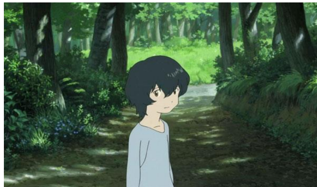
ภาพที่ 5 ตัวละครอาเมะ

ลูกชายคนเล็กของฮานะและโอกามิ เกิดในวันที่ฝนตกจึงชื่ออาเมะ ดูบอบบางและอ่อนไหวง่าย แต่กลับเลือกเติบโตเยี่ยงวิถีเช่นเดียวกับพ่อที่เป็นหมาป่า เนื่องจากมีความสามารถคุยกับเผ่าพันธุ์เดียวกันได้ และได้รู้จักกับสัตว์ที่เป็นเหมือนอาจารย์ของเขาตัวหนึ่ง