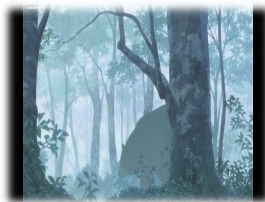
ภาพที่ 24 สถานะเจอหมูในป่า

5.1.2.1 ลักษณะของชนบทที่ปรากฏในภาพยนตร์ ภาพยนตร์เรื่อง Wolf Children Ame and Yuki มีฉากที่อยู่ในชนบทหลายฉาก แสดงให้เห็นถึงลักษณะของชนบทดังต่อไปนี้ ชนบทจะอยู่รายล้อมด้วยธรรมชาติ ฉากจะปรากฏสีที่สดและสว่าง ซึ่งส่วนใหญ่จะเป็นสีเขียว ที่มาจากต้นไม้ใบหญ้าและภูเขา และสีฟ้าของท้องฟ้า และแหล่งน้ำตามธรรมชาติ ส่วนในช่วงฤดูหนาวตามพื้นหรือภูเขาก็มักจะถูกปกคลุมไปด้วยหิมะสีขาว และแหล่งธรรมชาติที่ปรากฏในชนบท มีทั้งภูเขา ป่าไม้ น้ำตก แม่น้ำลำธาร รวมถึงสัตว์ที่ปรากฏให้เห็นหลายชนิด เช่น หมู กระต่าย งู เป็นต้น