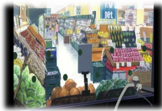
ภาพที่ 15 ฮานะซื้อของในห้างสรรพสินค้า