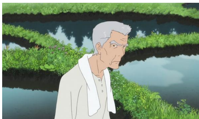
ภาพที่ 7 ตัวละครนिरาซากิ

คุณลุงเพื่อนบ้านของฮานะ หน้าตาบูดบึ้งไม่ค่อยเป็นมิตร แต่แท้จริงใจดี และประทับใจในตัวฮานะ และคอยช่วยเหลือฮานะตอนที่ฮานะพียงย้ายมาอยู่ต่างจังหวัด