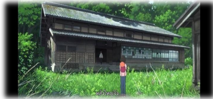
ภาพที่ 28 บ้านของฮานะ

การอาศัยอยู่ในชนบทนั้น ประชากรจะไม่หนาแน่น และอาศัยอยู่ในบ้านที่มีลักษณะเป็นบ้านชั้นเดียว มีพื้นที่กว้างโล่ง และสังคมในชนบทนั้นจะปรากฏความสัมพันธ์กันแบบเครือญาติ คอยช่วยเหลือ พึ่งพาซึ่งกันและกัน ไม่มีกฎระเบียบที่เคร่งครัด ใช้ชีวิตได้อย่างอิสระ และประชากรที่ปรากฏส่วนใหญ่จะอยู่ในช่วงวัยผู้สูงอายุ