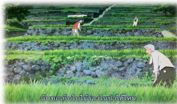
ภาพที่ 30 ชาวบ้านกำลังทำนากัน

อาชีพที่ปรากฏในภาพยนตร์ ในฉากชนบท ก็จะเป็นอาชีพทางเกษตรกรรมเป็นส่วนใหญ่ มีอาชีพอื่นปรากฏบ้างเล็กน้อย เช่น ผู้ดูแลสวนสัตว์ ไกด์ เป็นต้น แต่ส่วนใหญ่ก็จะทำสวน ทำนา ปลุกผักกินเองและนำไปแบ่งกันกับชาวบ้าน แลกเปลี่ยนผลผลิตกัน