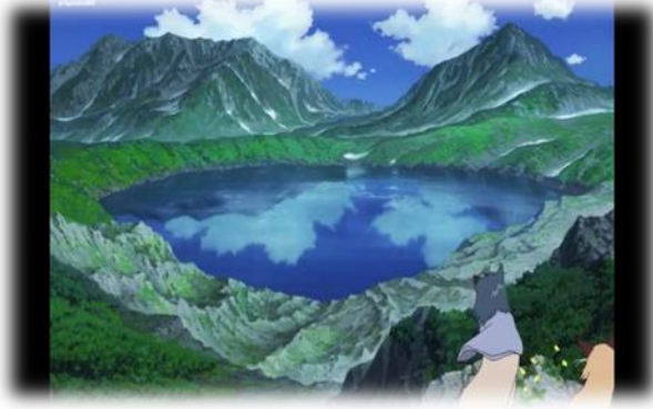
ภาพที่ 25 แหล่งน้ำและภูเขา ธรรมชาติ ที่มา จากภาพยนตร์เรื่อง Wolf Children Ame and Yuli นาทีที่ 1.21.29

ในด้านการคมนาคมนั้นมีลักษณะไม่สะดวกสบาย สถานศึกษาจะอยู่ห่างไกลจากที่พักอาศัย ทำให้ต้องเดินทางไกลแต่ถนนที่ปรากฏเป็นถนนเล็ก ๆ ที่ทำมาจากดิน สองข้างทางก็เป็นทุ่งนาปลูกพืชทางการเกษตร ซึ่งส่วนใหญ่จะใช้รถบรรทุกหรือนั่งรถบัส หรือรถยนต์ที่มีขนาดใหญ่ในการเดินทางเนื่องจากถนนที่ไม่ดีและต้องขับทางไกล ถ้าเดินทางใกล้ ๆ ก็จะใช้จักรยานในการเดินทาง