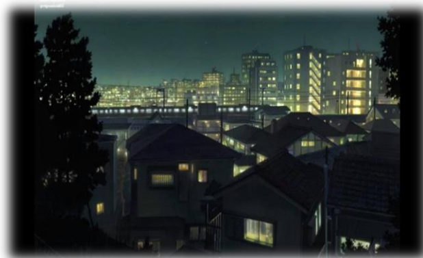
ภาพที่ 19 แสงไฟตอนกลางคืนในเมืองหลวง

สื่อภาพยนตร์ปรากฏอาชีพที่หลากหลายที่แสดงให้เห็นถึงความเหลื่อมล้ำในสังคมเมือง ที่มีทั้งผู้ที่ประกอบอาชีพที่ได้ค่าตอบแทนน้อย ใช้แรงงานหนัก เช่น พนักงานขนของ คนงานขับรถบรรทุก เป็นต้น ไปจนถึงอาชีพที่มีหน้าตาในสังคมหรืออาชีพที่ได้ค่าตอบแทนสูง เช่น อาชีพหมอ อาชีพครู เป็นต้น