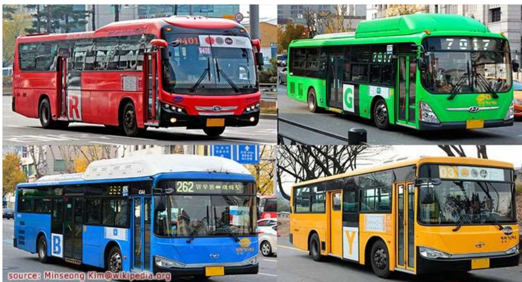
ภาพที่ 2.3 รถโดยสารประจำทางที่วิ่งบริเวณพื้นที่ในกรุงโซล