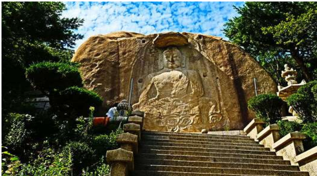
ภาพที่ 4.32 วัดซึงกาซา