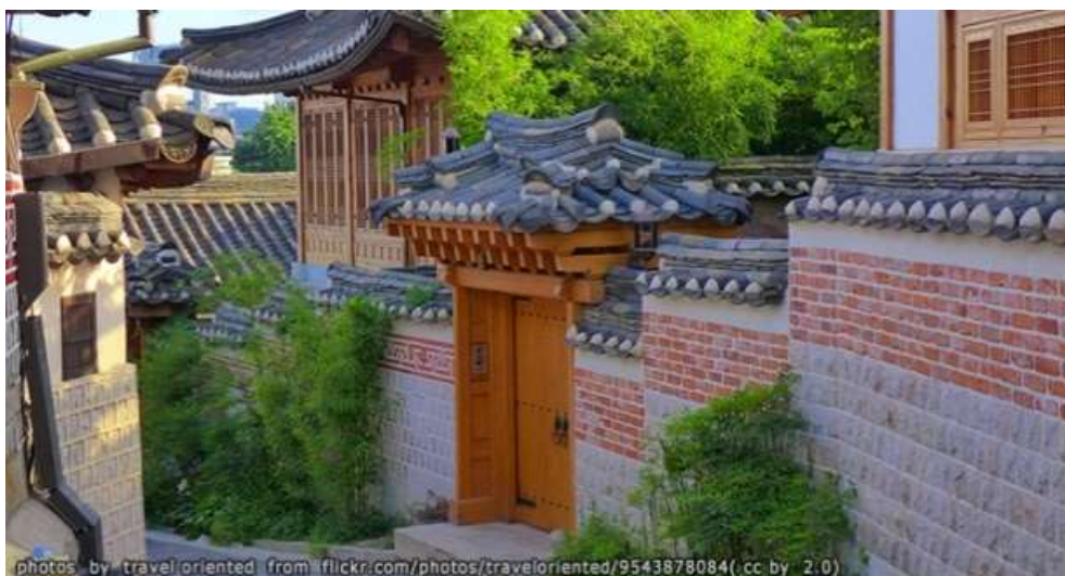
ภาพที่ 4.11 หมู่บ้านพุกชนฮันอก

หมู่บ้านพุกชนฮันอกเป็นหมู่บ้านดั้งเดิมของเกาหลีที่มีประวัติยาวนานตั้งอยู่ระหว่างพระราชวังเคียงบก พระราชวังชางด็อกและศาลเจ้าชงเมียว คำว่า “พุกชน” มีความหมายว่า “หมู่บ้านทางเหนือ” เป็นการตั้งชื่อตามตำแหน่งที่ตั้งของหมู่บ้านที่อยู่ทางทิศเหนือของคลองชองเกยซอนและย่านชงโน หมู่บ้านพุกชนฮันอกแห่งนี้เป็นชุมชนเก่าซึ่งเคยเป็นที่อยู่อาศัยของราชวงศ์และครอบครัวของเจ้าหน้าที่ระดับสูงในสมัยราชวงศ์โชซอน และเป็นที่เก็บรักษาสภาพแวดล้อมของเมืองไว้เพื่อเป็นการบอกเล่าประวัติศาสตร์ในสมัยราชวงศ์โชซอนที่มีอายุกว่า 600 ปีอีกด้วย หมู่บ้านแห่งนี้มีลักษณะเป็นซอยขนาดเล็กที่มีบ้านแบบเกาหลีดั้งเดิมกว่าร้อยหลังตลอดทางเดินจะมีกำแพงรูปแบบเดียวกันที่มีบ้านสไตล์เกาหลีโบราณตั้งอยู่ตลอดแนว บ้านแต่ละหลังยังคงมีคนอาศัยอยู่บ้างและบ้านบางส่วนก็กลายเป็นเกสต์เฮาส์สำหรับนักท่องเที่ยวที่อยากมาสัมผัสความเป็นอยู่แบบเกาหลีดั้งเดิม นอกจากนี้ยังมีพิพิธภัณฑ์คาโฮ (Gahoe Museum) ที่มีการจัดแสดงศิลปะภาพวาดแบบเกาหลี และมีการฝึกอบรมงานศิลปะเกาหลีเช่นการสอนเขียนภาพพื้นบ้านเกาหลีบนผืนผ้ากระดาษเป่าผ้าหรือพัดด้วย