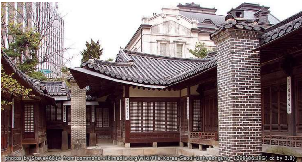
ภาพที่ 4.20 พระราชวังอินเฮียน

พระราชวังอินเฮียนเป็นพระราชวังที่มีประวัติศาสตร์อันยาวนานและเป็นพระราชวังที่เล็กที่สุดในบรรดา 5 พระราชวังในกรุงโซล ในอดีตพระราชวังแห่งนี้เคยเป็นที่ประทับของพระเจ้าโกจงตอนยังทรงพระเยาว์ต่อมาเมื่อได้ขึ้นครองราชย์เป็นกษัตริย์พระราชวังแห่งนี้ก็ยังคงใช้เป็นที่ประทับของราชวงศ์อยู่ ส่วนด้านสถาปัตยกรรมนั้นประตูด้านหน้าพระราชวังมีห้องขนาดเล็กอยู่ทางด้านขวามือเรียกว่า “ซูชิกซา” (Sujiksa) เป็นห้องของข้าราชการบริวาร นางสนมและนางกำนัล ส่วนด้านหน้าซ้ายมือเรียกว่า “โนรักดัง” (Norakdang) ซึ่งตำหนักโนรักดังนี้สามารถแบ่งห้องด้านในออกเป็น 2 ส่วนคือส่วนห้องครัวและห้องรับประทานอาหาร ส่วนภายนอกอาคารนั้นมีการตกแต่งด้วยไม้อย่างปราณีตงดงาม ตำหนักแห่งนี้ถูกใช้เป็นที่จัดงานเฉลิมฉลองเนื่องในโอกาสต่าง ๆ เช่น วันคล้ายวันพระบรมราชสมภพ พิธีอภิเษกสมรส เป็นต้น ซึ่งในวันเสาร์สุดท้ายของเดือนเมษายนและเดือนตุลาคมของทุกปีจะมีการแสดงจำลองงานพิธีอภิเษกสมรสของกษัตริย์โกจงและพระราชินีเมียงเชิงด้วย อีกทั้งยังมีการใช้ตำหนักแห่งนี้ในการจัดงานแต่งงานแบบพิธีเกาหลีดั้งเดิมอยู่ในปัจจุบัน