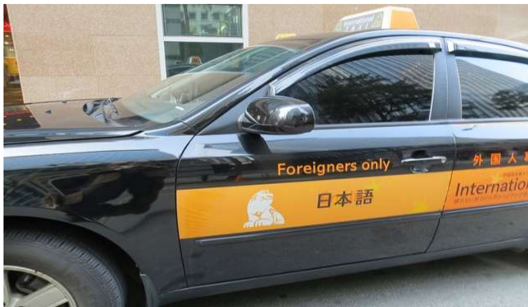
ภาพที่ 2.8 แท็กซี่นานาชาติ (International Taxi)

4.4) แท็กซี่นานาชาติ (International Taxi) ลักษณะของรถเหมือนแท็กซี่ธรรมดา (Standard Taxi) แต่มีความพิเศษตรงที่คนขับรถสามารถพูดภาษาต่างประเทศได้ เช่น ภาษาอังกฤษ ภาษาจีน และภาษาญี่ปุ่น หากต้องการใช้บริการแท็กซี่ประเภทนี้ต้องทำการจองล่วงหน้าในเว็บไซต์ http://www.intltaxi.co.kr/ หรือโทรศัพท์ไปที่เบอร์ 1644-2255