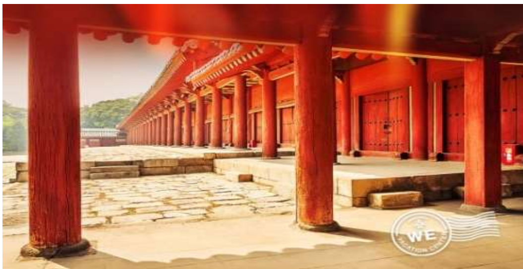
ภาพที่ 4.13 ศาลเจ้าจงมโย