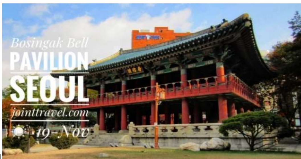
ภาพที่ 4.25 หอรระฆังโพชินกัก

หอรระฆังโพชินกักมีบริการสวมใส่ชุดฮันบกให้แก่ผู้ที่สนใจอยู่ที่บริเวณชั้น 2 ของอาคารในเวลา 11.00-12.10 น. และมีการจัดกิจกรรมจำลองพิธีการตีระฆังให้นักท่องเที่ยวได้ชมและทดลองตีในวันอังคารถึงวันอาทิตย์ เวลา 11.00-12.20 น. โดยผู้ที่สนใจจะต้องมาลงทะเบียนก่อนในเวลา 11.40 น. และปัจจุบันยังคงมีการตีระฆังอยู่แต่จะตีในวันสำคัญ 3 วันเท่านั้น ได้แก่ วันขึ้นปีใหม่ (1 มกราคม) วันชบวนการกอบกู้อิสรภาพ (1 มีนาคม) และวันฉลองอิสรภาพ (15 สิงหาคม) ของทุกปีซึ่งจะมีชบวนและการแต่งกายด้วยชุดเกาหลีโบราณในงานด้วย