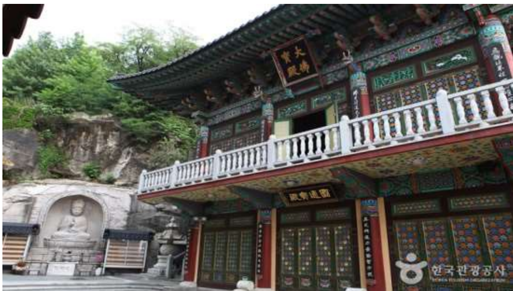
ภาพที่ 4.28 วัดมโยกักซา