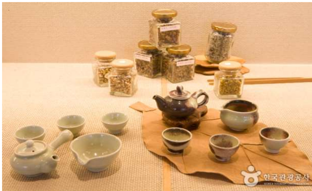
ภาพที่ 4.29 พิพิธภัณฑชาสวายนาม

ผลิตภัณฑ์เซรามิกที่ผลิตโดยศิลปินและนักเซรามิก อีกทั้งยังมีการเปิดร้านน้ำชาขนาดเล็กที่ชื่อว่าเรื่องราวของชา (Tea Story) ไว้เพื่อเปิดโอกาสให้นักท่องเที่ยวได้ชิมชาหลากหลายชนิดไม่ว่าจะเป็นชาดำ ชาดอกไม้ ชาสมุนไพร ฯลฯ นอกจากนี้ยังมีร้านจำหน่ายชา (Tea Shop) ที่นักท่องเที่ยวสามารถซื้อชากลับบ้านได้อีกด้วย