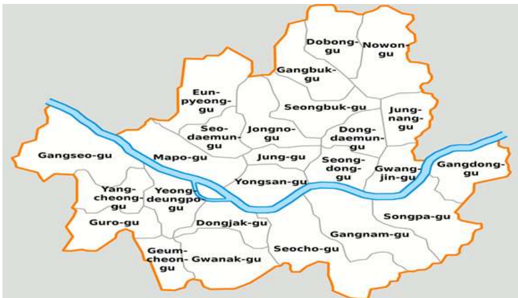
ภาพที่ 2.1 แผนที่แสดงเขตการปกครองของกรุงโซลที่แบ่งออกเป็นเหนือกับใต้ โดยใช้แม่น้ำฮัน (เส้นสีฟ้า) เป็นตัวแบ่ง

พื้นที่กรุงโซลแบ่งออกเป็นสองส่วนหลักโดยใช้แม่น้ำฮันเป็นตัวแบ่ง คือ โซลฝั่งเหนือและโซลฝั่งใต้ และยังแบ่งออกเป็น 25 เขตการปกครอง (ภาพที่ 2.1) กล่าวคือ เขตการปกครองบริเวณโซลฝั่งเหนือ ได้แก่ เขตโทบก เขตหงแดมุน เขตอินพยอง เขตคังบุก เขตควังจิน เขตชงโน เขตชุง เขตชุงนัง เขตมาโพ เขตโนวอน เขตซอแดมุน เขตซองบุก เขตซองดง และเขตยงซัน ส่วนเขตการปกครองบริเวณโซลฝั่งใต้ ได้แก่ เขตคังซอ เขตยงดิงโพ เขตยั้งซอน เขตคูโร เขตชงพา เขตคังดง เขตคังนัม เขตซอโซ เขตควานัก เขตทงจัก และเขตคิมซอน ซึ่งในแต่ละเขตจะมีย่านสำคัญหรือสถานที่ท่องเที่ยวที่แตกต่างกันออกไป