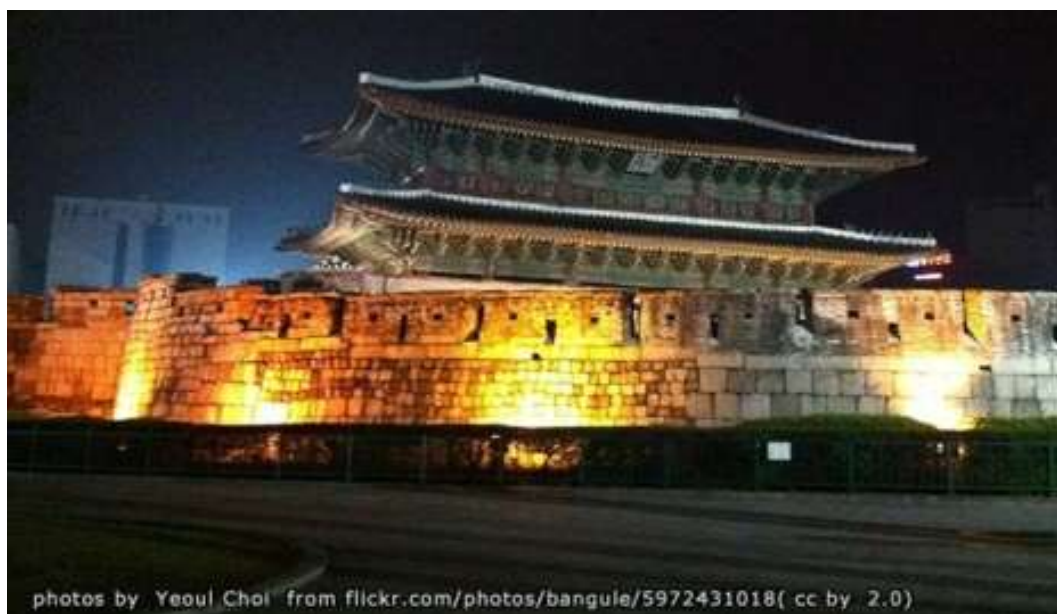
ภาพที่ 4.19 ประตูทงแดมุน

จากนั้นได้มีการบูรณะเรื่อยมาจนถึงสมัยกษัตริย์โคจงเมื่อปีค.ศ.1869 ประตูแห่งนี้จะมีลักษณะเป็นรูปครึ่งวงกลมเมื่อมองจากมุมบนและเมื่อมองประตูจากด้านหน้าจะเห็นหลังคาทรงสี่เหลี่ยมคางหมูที่มีอาคารทรงเกาหลีโบราณ 2 ชั้นเนื่องจากต้องใช้ประตูนี้เป็นสถานที่ให้ทหารยามเฝ้าประตูและใช้เป็นจุดการบัญชาการทางทหาร ในกรณีฉุกเฉินด้วยการทำอาคาร 2 ชั้นจึงทำให้ทหารสามารถมองได้ทั่วถึงขึ้น นอกจากนี้ประตูแห่งนี้ยังมีรูปแบบสถาปัตยกรรมที่มีเอกลักษณ์โดดเด่นแตกต่างจากประตูอื่นในกรุงโซลคือเป็นเพียงประตูเดียวในกรุงโซลที่มีเมืองซอง (Ongseong) หรือป้อมปราการของประตู กล่าวคือมีการสร้างกำแพงด้านนอกด้วยอิฐและไม้ล้อมรอบประตูในลักษณะครึ่งวงกลมหรือรูปพระจันทร์ครึ่งเสี้ยวเพื่อใช้ป้องกันศัตรู