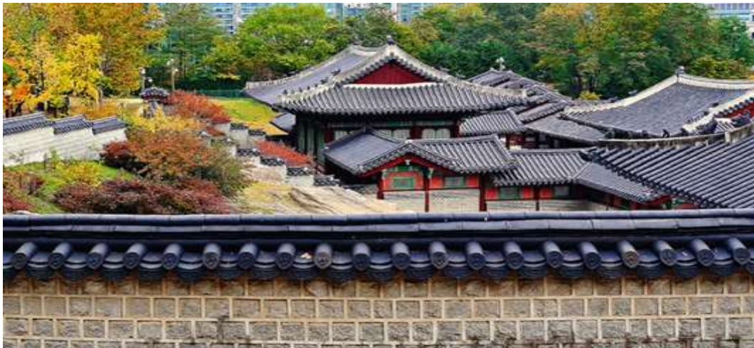
ภาพที่ 4.22 พระราชวังเคียงฮุย

พระราชวังเคียงฮุยถูกสร้างขึ้นในปีค.ศ.1617 ถือเป็น 1 ใน 5 ของพระราชวังแห่งราชวงศ์โชซอน เดิมทีพระราชวังแห่งนี้มีชื่อว่า “ซีอกโว” (Seogwol) หมายถึง พระราชวังตะวันตก เนื่องจากพระราชวังนี้ตั้งอยู่ทางตะวันตกของกรุงโซลอยู่ในบริเวณที่มีภูเขาล้อมรอบผู้เข้าชมพระราชวังแห่งนี้จึงสามารถเห็นฉากหลังเป็นภูเขาอย่างสวยงาม พระราชวังแห่งนี้เคยถูกใช้เป็นสถานที่สถาปนากษัตริย์ จัดงานเลี้ยงในพระราชวังต้อนรับแขกบ้านแขกเมืองและเคยใช้เป็นที่หลบภัยสงครามต่าง ๆ ของกษัตริย์และเชื้อพระวงศ์ในราชวงศ์โชซอนในสมัยที่ถูกญี่ปุ่นยึดครอง ส่วนด้านสถาปัตยกรรมนั้นภายในอาคารประกอบไปด้วยตำหนักทั้ง 4 หลังที่เห็นได้ถึงความงามของสถาปัตยกรรมแบบเกาหลีคือ ตำหนักซุงจองจอน (Sungjeongjeon) ตำหนักจาจองจอน (Jajeongjeon) ตำหนักยุงบกจอน (Yungbokjeon) และฮอเวซังจอน (Hoesangjeon) นอกเหนือจากนี้จะเป็นอาคารเล็ก ๆ อีกประมาณ 100 หลังตั้งเรียงกันอยู่ตามเนินเขา