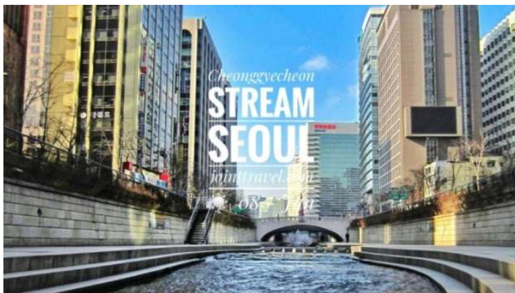
ภาพที่ 4.7 คลองชองเกยซอน

ธารแห่งนี้ถูกเปลี่ยนชื่อจากลำธารแคซอนเป็น “คลองชองเกยซอน” (Cheonggyecheon Stream) และใช้ชื่อนี้มาจนถึงปัจจุบัน ต่อมาในช่วงปีค.ศ.1957-1977 ที่แห่งนี้ได้ถูกสร้างทางยกระดับคร่อมเหนือคลองจนเกิดชุมชนตั้งอยู่อย่างหนาแน่นในบริเวณนี้ส่งผลให้น้ำในคลองเริ่มน้ำเสียและสภาพแวดล้อมเริ่มเสื่อมลง หลังจากนั้นคลองแห่งนี้ได้รับการบูรณะขึ้นใหม่ในปีค.ศ.2003โดยรัฐบาลได้สร้างโครงการพัฒนาและบูรณะคลองชองเกยซอนให้มีภูมิทัศน์ที่สวยงามโดยมีการรื้อทางยกระดับออกและคืนที่ดินแหล่งชุมชนที่อยู่ติดกับคลองแห่งนี้จนทำให้กลายเป็นคลองที่มีภูมิทัศน์ที่ร่มรื่นและสวยงามกลายเป็นแหล่งพักผ่อนหย่อนใจตามที่เห็นในปัจจุบัน