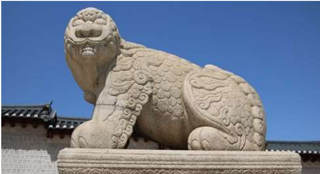
ภาพที่ 4.15 รูปปั้นแฮแท หรือแฮซี