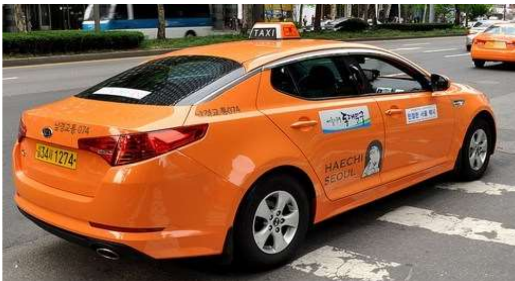
ภาพที่ 2.5 แท็กซี่ธรรมดา (Standard Taxi)

4.1) แท็กซี่ธรรมดา (Standard Taxi) เป็นรถยนต์ส่วนบุคคล 4 ล้อ มีทั้งหมด 3 สี คือ สีเทา สีเงิน และสีส้ม สามารถพบเห็นได้เยอะที่สุดและมีราคาถูกที่สุด ซึ่งค่าโดยสารเริ่มต้นที่ 2,800 - 3,800 วอน ขึ้นอยู่กับพื้นที่ให้บริการ ส่วนค่าบริการในรอบดึก (เวลา 00.00 - 04.00 น.) จะเพิ่มขึ้น 20% จากค่าบริการพื้นฐาน