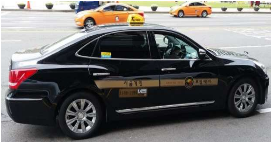
ภาพที่ 2.6 แท็กซี่หรู (Deluxe Taxi)