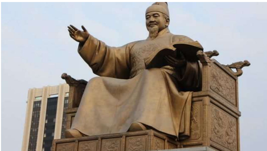
ภาพที่ 4.16 พระบรมรูปกษัตริย์เซจงมหาราช

3) Korea Main Plaza เป็นบริเวณของพระบรมรูปกษัตริย์เซจงมหาราช (Statue of King Sejong) ซึ่งได้รับการขนานนามว่าเป็นรูปปั้นที่โดดเด่นที่สุดของเกาหลีใต้ กษัตริย์เซจงมหาราช (Sejong the Great) เป็นกษัตริย์องค์ที่ 4 ของราชวงศ์โชซอนแห่งเกาหลีและทรงเป็นกษัตริย์ที่มีชื่อเสียงที่สุดของเกาหลี