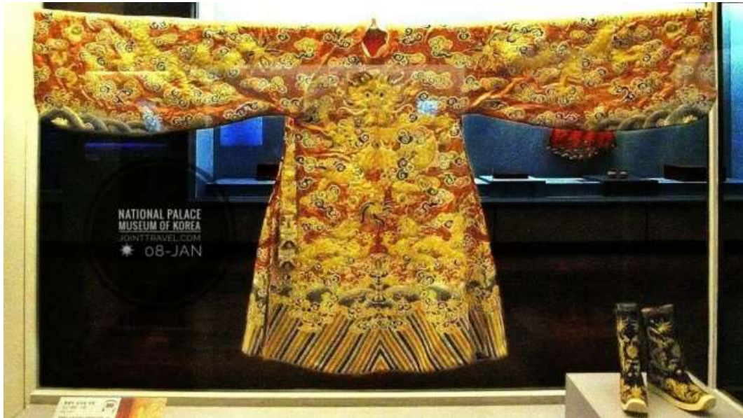
ภาพที่ 4.8 พิพิธภัณฑ์พระราชวังแห่งชาติเกาหลี