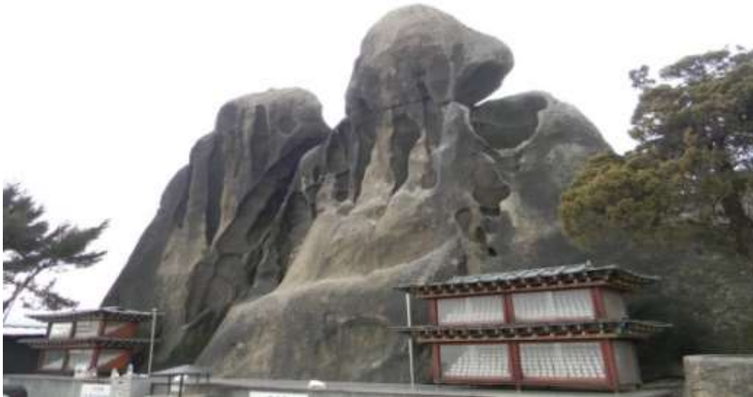
ภาพที่ 4.18 วัดอินวังซา