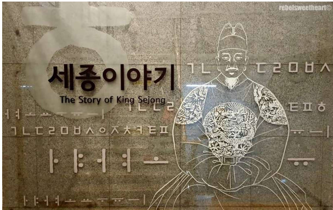
ภาพที่ 4.23 พิพิธภัณฑท์กษัตริย์เซจงมหาราช