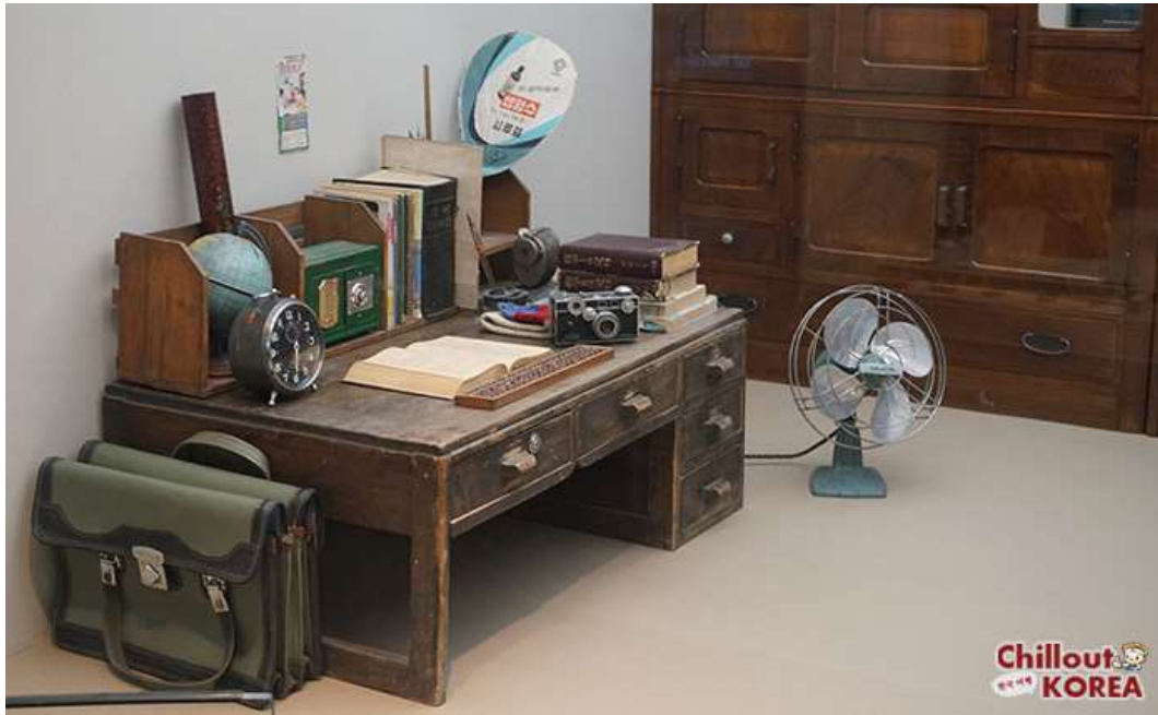
ภาพที่ 4.30 พิพิธภัณฑ์พื้นบ้านเกาหลี