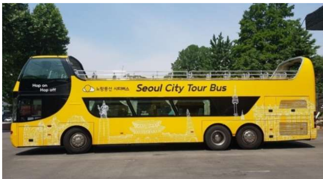
ภาพที่ 2.4 รถบัสนำเที่ยว