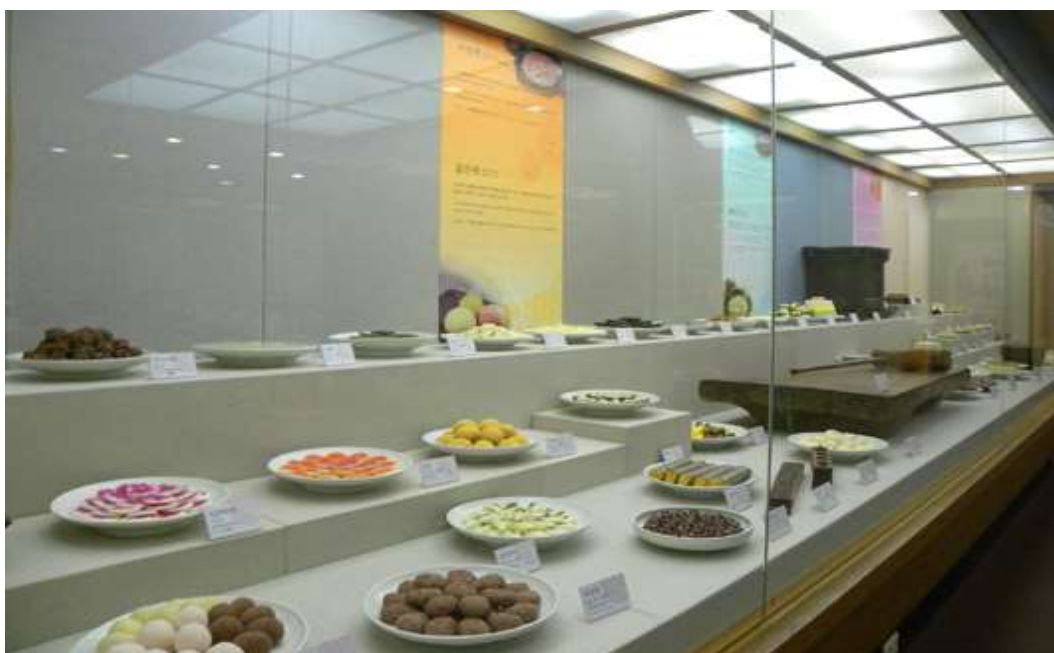
ภาพที่ 4.31 พิพิธภัณฑ์แป้งต็อก

พิพิธภัณฑ์แป้งต็อกแห่งนี้ได้ทำการจัดแสดงนิทรรศการเกี่ยวกับพิธีกรรมในชีวิตมนุษย์ อาหารในแต่ละยุคสมัย เครื่องครัวแบบดั้งเดิมของคนเกาหลีโบราณที่หาดูได้ยาก เช่น อุปกรณ์ที่ใช้ทำแป้งต็อก และข้อมูลต่าง ๆ เกี่ยวกับแป้งต็อกหรือเค้กข้าว นอกจากนี้พิพิธภัณฑ์แห่งนี้ยังมีการจัดกิจกรรมที่เปิดประสบการณ์ใหม่ ๆ ให้แก่ผู้เข้าชมได้เข้าร่วมอีกด้วย ยกตัวอย่างเช่น กิจกรรมที่ให้ผู้เข้าชมฝึกทำแป้งต็อกและทานแป้งต็อกที่ตนได้มีส่วนร่วมในการทำ เป็นต้น