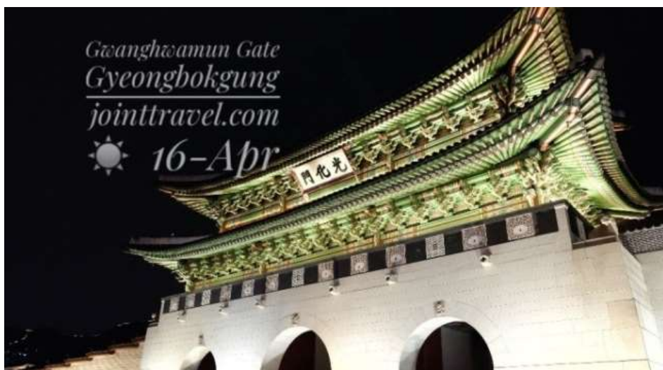
ภาพที่ 4.10 ประตูควางฮวามุน

คูแลเมืองโดยบริเวณสองฝั่งของประตูนั้นจะมีรูปปั้นแฮตหรือรู้จักกันในชื่อของแฮซีซึ่งเป็นสัตว์ในตำนานรูปลิงโตตั้งอยู่