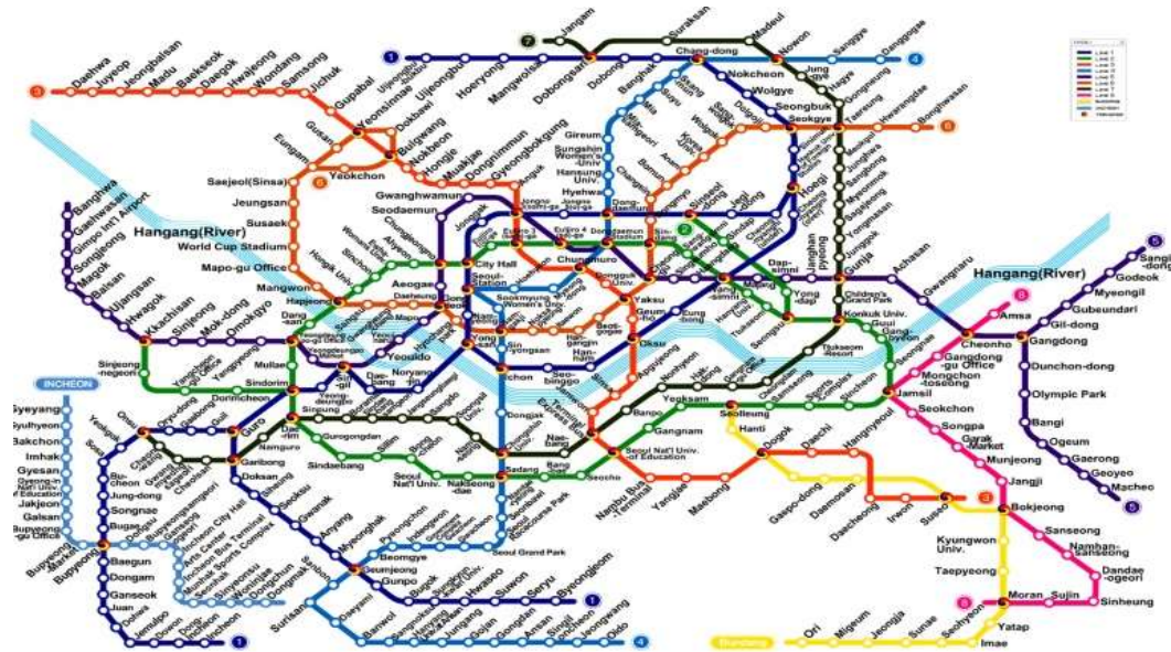
ภาพที่ 2.2 แผนผังแสดงเส้นทางกรวางของรถไฟฟ้าใต้ดินสายต่าง ๆ ที่วังโซล