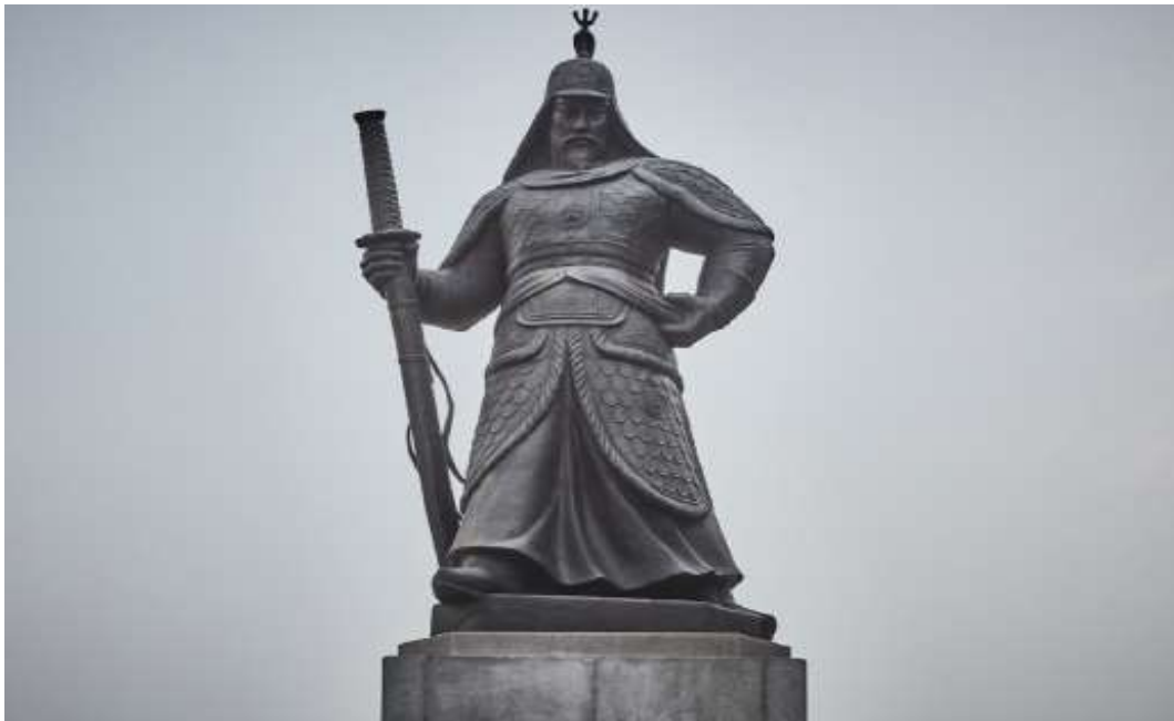
ภาพที่ 4.17 อนุสาวรีย์ของพลเรือเอกอีซุนชิน

4) Downtown Plaza ตั้งอยู่ใกล้กับอนุสาวรีย์ของพลเรือเอกอีซุนชิน (Statue of Admiral Yi Sun-Shin) รูปปั้นถูกสร้างขึ้นในวันที่ 27 เมษายน ค.ศ.1968เพื่อระลึกถึงความกล้าหาญในการต่อสู้กับญี่ปุ่น บริเวณด้านหน้าของรูปปั้นเป็นแบบจำลองของเรือเต่าหรือคอบุกซอนซึ่งเป็นเรือที่พลเรือเอกอีซุนชินเป็นผู้ประดิษฐ์ขึ้นและเอาชนะกองทัพญี่ปุ่นได้ในที่สุด อีกทั้งยังมีลานน้ำพุชื่อว่า “น้ำพุ 12.23” ที่สร้างขึ้นเพื่อเฉลิมฉลองให้กับความสำเร็จของพลเรือเอกอีซุนชินและรำลึกถึงชัยชนะในสงครามครั้งที่ 23 จากการรุกรานของญี่ปุ่นด้วย