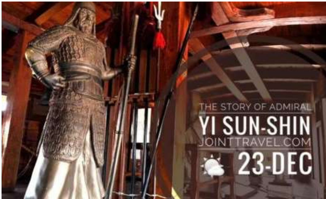
ภาพที่ 4.24 นิทรรศการเรื่องราวของอียุนชิน