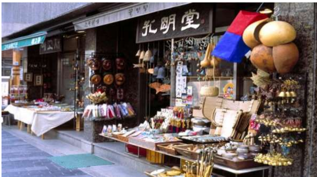
ภาพที่ 4.9 ย่านวัฒนธรรมอินซาดง

ย่านวัฒนธรรมอินซาดงเป็นหนึ่งในถนนที่มีประวัติความเป็นมายาวนานกว่า 600 ปีและเป็นศูนย์กลางของวัฒนธรรมมาตั้งแต่สมัยราชวงศ์โชซอน ถนนเส้นนี้เรียงรายไปด้วยร้านค้าต่าง ๆ ที่มีรูปแบบทางสถาปัตยกรรมสวยงามในสไตล์สมัยใหม่แปลกตาที่ผสมผสานกับวัฒนธรรมแบบดั้งเดิมได้อย่างลงตัว ย่านนี้ประกอบด้วยถนนหลักอินซาดงและมีตรอกซอกซอยแยกออกไปทั้งสองข้างทาง ภายในตรอกเป็นร้านอาหารแบบดั้งเดิม ร้านน้ำชาตามแบบเกาหลีดั้งเดิม ร้านขายเครื่องแกะสลักแบบพื้นเมืองและแกลลอรี่ นอกจากนี้ยังเป็นแหล่งรวมแกลลอรี่ต่าง ๆ กว่า 100 แห่งนักท่องเที่ยวสามารถชมงานศิลปะภาพวาดและประติมากรรมแบบดั้งเดิมของเกาหลี โดยแกลลอรี่ที่มีชื่อเสียงมากที่สุดได้แก่ ศูนย์กลางศิลปะพื้นบ้าน (Hakgojae Gallery) หอส่งเสริมศิลปะ (Gana Art Gallery) เป็นต้น สถานที่แห่งนี้จึงเป็นสถานที่ที่นักท่องเที่ยวสามารถสัมผัสกับวัฒนธรรมเกาหลีแบบดั้งเดิมได้