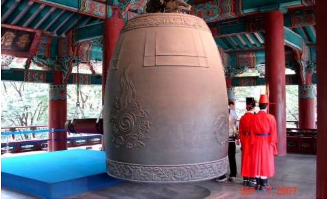
ภาพที่ 4.26 ระฆังที่หอระฆังโพชินกัก