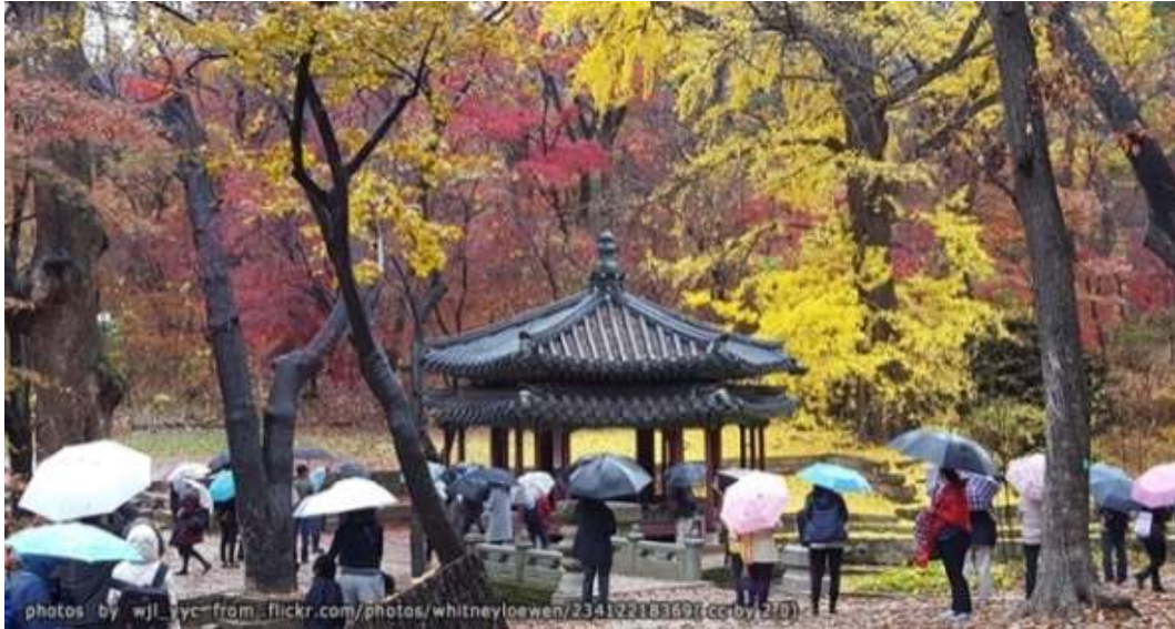
ภาพที่ 4.3 สวนฮูวอน