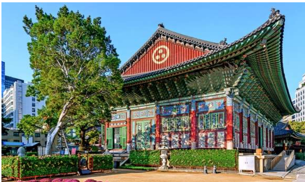
ภาพที่ 4.4 วัดโซเกซา

กิจกรรมในโปรแกรมนี้ ได้แก่ การพาทัวร์วัด การเข้าร่วมพิธีตีฆ้อง การนั่งสมาธิแบบเซน การหมอบกราบแบบเกาหลีและการทำโคมรูปบัว