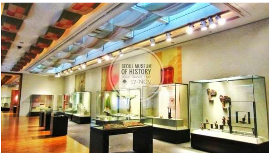
ภาพที่ 4.6 พิพิธภัณฑ์ประวัติศาสตร์โซล

พิพิธภัณฑ์ประวัติศาสตร์โซลเป็นสถานที่สำคัญที่จัดแสดงเกี่ยวกับประวัติศาสตร์และวัฒนธรรมของกรุงโซลในยุคก่อนประวัติศาสตร์จนถึงปัจจุบัน โดยมีจุดมุ่งหมายคือเพื่อรักษาวัฒนธรรมดั้งเดิมของเมืองให้คนรุ่นหลังได้ศึกษาประวัติความเป็นมาให้เป็นเอกลักษณ์ทางวัฒนธรรมและเป็นการรักษามรดกทางวัฒนธรรมเพื่อให้ประชาชนได้เข้าใจลึกซึ้งมากยิ่งขึ้น อีกทั้งยังมีโปรแกรมการศึกษาและฝึกอบรมศิลปะแบบดั้งเดิมด้วย พิพิธภัณฑ์แห่งนี้ได้รับการบูรณะและปรับปรุงให้ทันสมัยบนอาคาร 3 ชั้นบริเวณชั้นที่ 3 จะจัดแสดงเกี่ยวกับราชวงศ์โซลซอน ชั้นที่ 2 จัดแสดงเกี่ยวกับวิถีชีวิตของชาวเกาหลีรวมถึงภาพถ่ายของสถานที่สำคัญของกรุงโซลในอดีตจนถึงปัจจุบัน และชั้นที่ 1 ประกอบไปด้วยสิ่งอำนวยความสะดวกต่าง ๆ อันได้แก่ ร้านขายของที่ระลึก สินค้าทางวัฒนธรรม ร้านอาหาร ร้านกาแฟ เป็นต้น