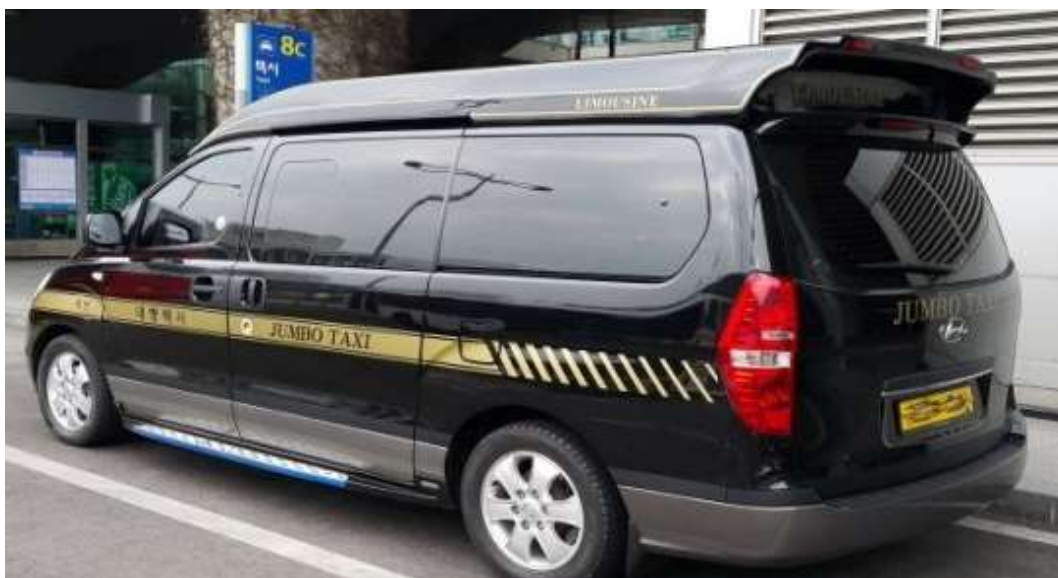
ภาพที่ 2.7 แท็กซี่ขนาดใหญ่ (Jumbo Taxi)

4.3) แท็กซี่ขนาดใหญ่ (Jumbo Taxi) เป็นรถตู้ เหมาะกับผู้โดยสารหรือผู้ที่เดินทางเป็นกลุ่ม มีทั้งหมด 9 ที่นั่ง แถบด้านข้างรถจะมีคำว่า Jumbo Taxi ติดอยู่ ส่วนราคาค่าโดยสารจะใกล้เคียงกับแท็กซี่หรู (Deluxe taxi)