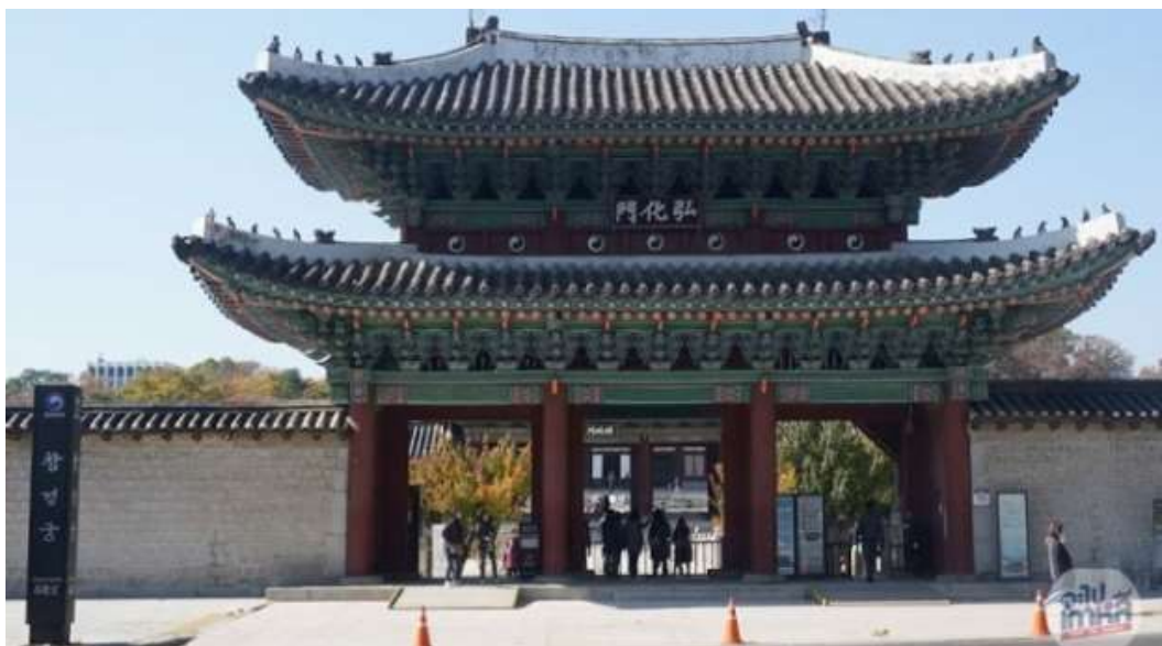
ภาพที่ 4.5 พระราชวังชางคยอง

พระราชวังชางคยองเป็นพระราชวังที่มีการสร้างในสมัยราชวงศ์โชซอนเพื่อใช้เป็นที่พักของพระบรมวงศ์ศานุวงศ์ ถือเป็นพระราชวังที่ติดอันดับ 1 ใน 5 พระราชวังที่สำคัญที่สุดในเกาหลีเนื่องจากเป็นที่ประทับในช่วงปลายรัชสมัยของกษัตริย์เกาหลีถึง 10 รัชกาลและเป็นพระราชวังเพียงแห่งเดียวของพระราชวังหลวงทั้งห้าแห่งกรุงโซลที่หันหน้าไปยังทิศตะวันออกและไม่หันไปทางทิศใต้ พระราชวังชางคยองแห่งนี้มีความงดงามตามรูปแบบสถาปัตยกรรมเกาหลีแท้ที่ถูกสร้างขึ้นเป็นลำดับที่ 3 ต่อจากพระราชวังเคียงบกและพระราชวังชางด็อก พระเจ้าเซจงมหาราชได้บูรณะและมอบพระราชวังแห่งนี้ให้เป็นที่ประทับของพระเจ้าแทจงพระราชบิดาในปีค.ศ.1418 ต่อมาได้ขยายบริเวณอาณาเขตของพระราชวังในช่วงปีค.ศ.1483-1484 และเปลี่ยนชื่อพระราชวังมาเป็น “พระราชวังชางคยอง” ในปีค.ศ.1592และใช้ชื่อนี้มาจนถึงปัจจุบัน