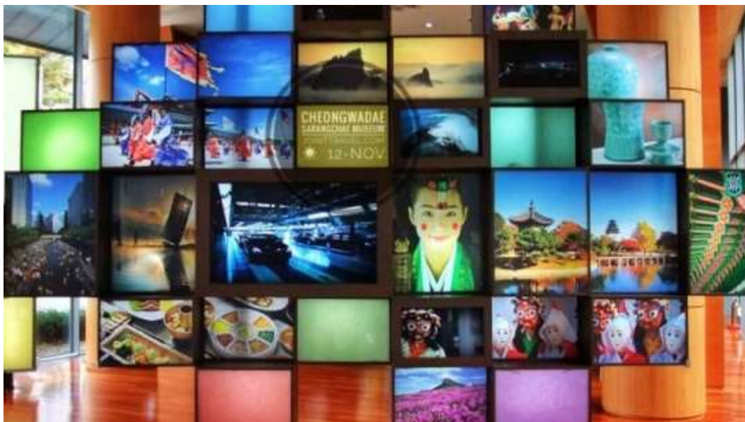
ภาพที่ 4.21 พิพิธภัณฑ์ซ็องวาแดซารางแช