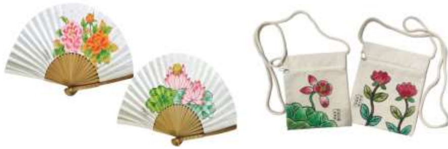
ภาพที่ 4.12 ผลงานการเขียนภาพพื้นบ้านเกาหลี

(ที่มา: http://www.gahoemuseum.org/new/education/permanent )