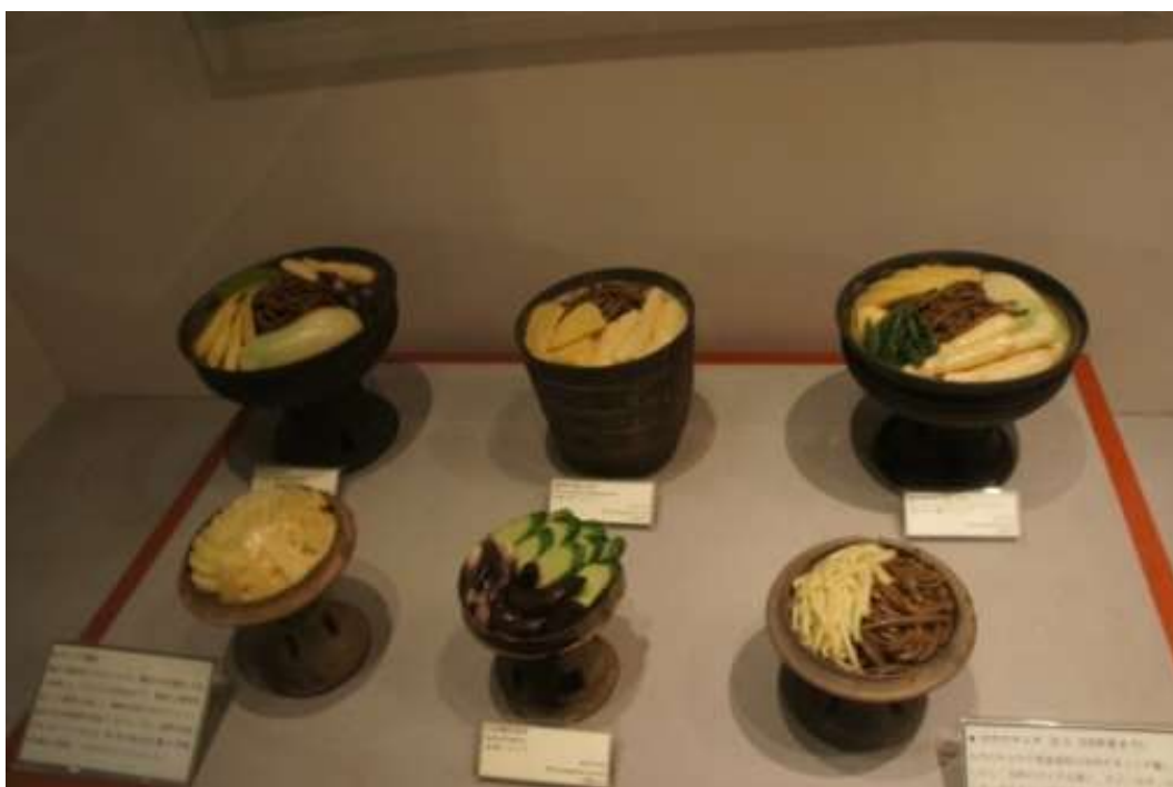
ภาพที่ 4.27 พิพิธภัณฑ์กิมจิ

รองรับจำนวนนักท่องเที่ยวที่จะมางานโอลิมปิกในปีค.ศ.1998 หลังจากนั้นพิพิธภัณฑ์ก็ถูกย้ายไปที่ COEX เพื่อเผยแพร่ความเป็นมาของกิมจิให้ชาวต่างชาติได้รู้จักกันมากขึ้นก่อนจะถูกย้ายมาที่กรุงโซลอีกครั้งในปีค.ศ.2000 แม้พิพิธภัณฑ์กิมจิจะเป็นพิพิธภัณฑ์ขนาดเล็กแต่สามารถรวบรวมข้อมูลเกี่ยวกับกิมจิไว้ได้อย่างครบถ้วน กล่าวคือมีการแสดงข้อมูลเกี่ยวกับประวัติความเป็นมาของกิมจิ ประเภทของกิมจิ ความแตกต่างของกิมจิในแต่ละฤดูกาลแต่ละภูมิภาค วิธีจัดเก็บกิมจิ วิธีการทำอาหารจากกิมจิและคุณสมบัติต่าง ๆ ของกิมจิ อีกทั้งทางพิพิธภัณฑ์แห่งนี้ยังมีการจัดกิจกรรมทำกิมจิให้แก่ผู้เข้าชมได้เข้าร่วมอีกด้วยซึ่งผู้ที่เข้าร่วมกิจกรรมนี้สามารถนำกิมจิที่ตนเองทำกลับบ้านไปด้วยได้