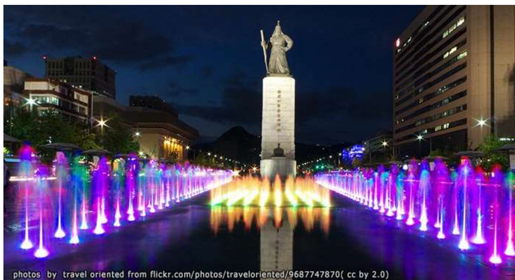
ภาพที่ 4.14 จัตุรัสควางฮวามุน

2) Reenacting Yukjo Street Plaza เป็นถนนที่ได้รับการบูรณะขึ้นมาใหม่ เดิมเป็นถนนสายหลักของเมืองฮันยาง ปัจจุบันถนนยุคใหม่ตั้งอยู่ใกล้กับสวนสาธารณะเซจงโน