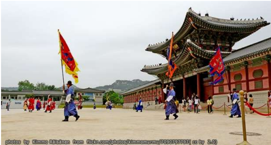
ภาพที่ 4.2 พระราชวังเคียงบก

กับวัฒนธรรมวิถีชีวิตของชาวเกาหลีมากยิ่งขึ้น อีกทั้งในเดือนมีนาคม-เมษายนพระราชวังแห่งนี้ยังเป็นจุดชมดอกไม้และดอกซากุระที่สวยงาม