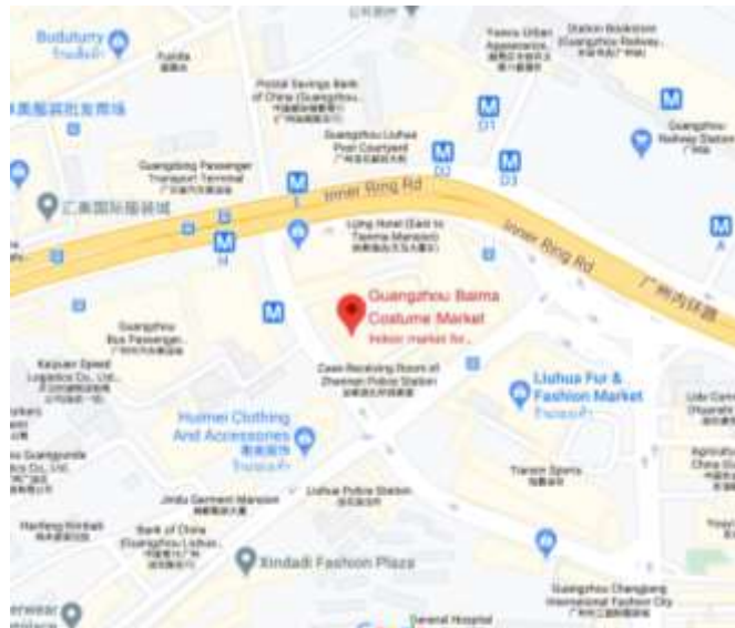
รูปที่ 4.9 : แผนที่ตั้งของตลาดไ่หม่า

ตลาดไ่หม่ามีที่ตั้งอยู่ที่ เลขที่ 16 ถนนจ้านหนาน เขตเยว่จิว ซึ่งอยู่ติดถนนใหญ่และอยู่ใกล้กับรถไฟฟ้าใต้ดินสถานีกวางโจว ดังแสดงในรูปที่ 4.9 อีกทั้งยังมีรถบัสหลายสายที่สัญจรผ่านไปมาทำให้เส้นทางบริเวณนี้เต็มไปด้วยผู้คนและรถประจำทางจำนวนมาก ด้วยเหตุนี้จึงเป็นอีกหนึ่งปัจจัยสำคัญที่ทำให้ผู้ประกอบการหรือผู้บริโภคเดินทางมาซื้อเสื้อผ้ากันเป็นจำนวนมาก ไม่ว่าจะเป็นผู้ประกอบการหรือผู้บริโภคชาวต่างชาติ หรือแม้กระทั่งชาวจีนเองเนื่องจากสะดวกต่อการเดินทาง โดยสามารถแบ่งการเดินทางได้เป็น 2 แบบ ดังนี้