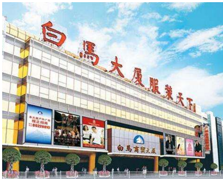
รูปที่ 4.1 : ตลาดไป๋หม่า

จากการรวบรวมข้อมูลจากเว็บไซต์ ตลาดที่เป็นที่นิยมที่สุดในเมืองกวางโจว คือ ตลาดไป๋หม่า ดังแสดงในรูปที่ 4.1 โดยได้ถูกจัดอันดับให้เป็นตลาดค้าส่งเสื้อผ้าอันดับ 3 ในประเทศจีนจากเว็บไซต์ chinabrands ในปี 2561 ดังแสดงในรูปที่ 4.2 ที่ตั้งของตลาดไป๋หม่า : เลขที่ 16 ถนนจ้านหนาน เมืองกวางโจว (ตรงข้ามกับสถานีรถไฟหลักกวางโจว) ตลาดไป๋หม่าหรือติกไป๋หม่าเป็นตลาดเสื้อผ้าคุณภาพระดับกลางจนถึงระดับดีมากที่สุดที่มีขนาดใหญ่ที่สุด การตกแต่งดีที่สุดในแง่ของสิ่งแวดล้อมและการจัดการที่ได้มาตรฐานที่สุดในกวางโจว ตลาดมีผู้ประกอบการในเครือมากกว่า 2,000 แห่ง รวมถึงบริษัทผลิตและขายเสื้อผ้าในเขตสามเหลี่ยมปากแม่น้ำเพิร์ล เขตเจ้อเจียง เขตฝูเจี้ยน ตลาดไป๋หม่าไม่ได้เป็นเพียงศูนย์ค้าส่งและค้าปลีกสำหรับเสื้อผ้าคุณภาพระดับกลางจนถึงระดับดีเท่านั้น แต่ยังเป็นศูนย์กลางแฟชั่นไฮสเปคสำหรับแบรนด์เสื้อผ้าอีกด้วย มีผู้ประกอบการจำนวนมากที่มาสั่งซื้อเสื้อผ้าจากที่นี่ เช่น กวางโจว หนิงโป เซียงไฮ้ เหวินโจว เป็นต้น ในขณะที่เดียวกันผู้ประกอบการยังมาจากเซินเจิ้น อี้หู่และฮ่องกง รวมไปถึงเกาหลีใต้และญี่ปุ่น เรียกได้ว่าตลาดไป๋หม่านั้นเป็นที่นิยมมาก ผู้ซื้อจากต่างประเทศหลายล้านคนนิยมมาซื้อเสื้อผ้าแฟชั่นที่นี่ (Shangjin, 2562)