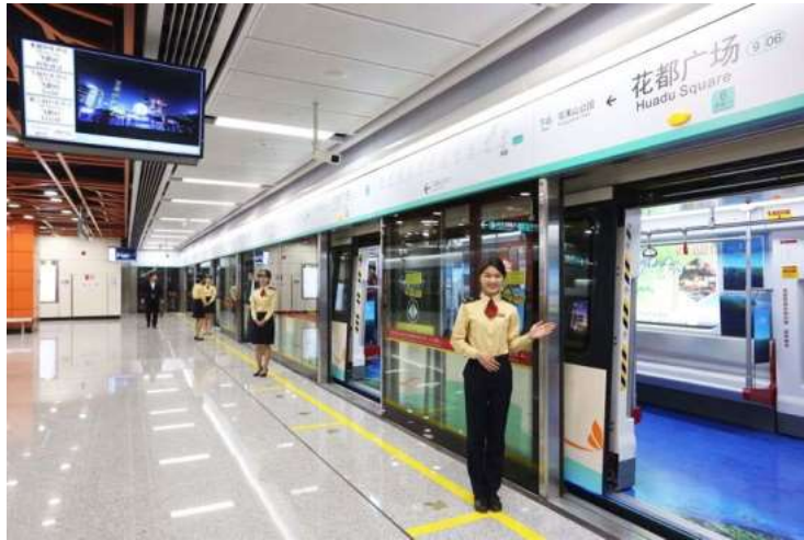
รูปที่ 4.10 : ภายในรถไฟใต้ดิน สถานีกว้างโจว