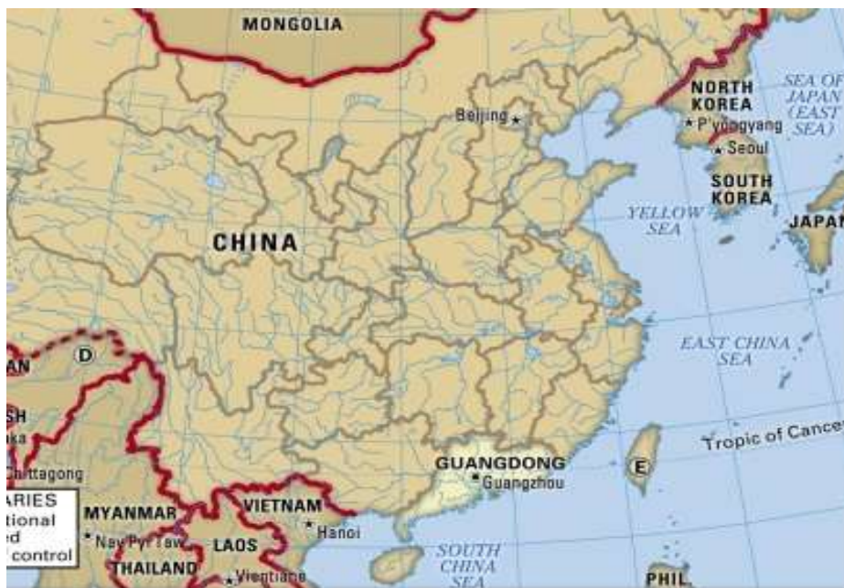
รูปที่ 2.2 : เส้น Tropic of Cancer ลากผ่านกวางโจว

กวางโจวตั้งอยู่ปากแม่น้ำจูเจียงซึ่งตั้งอยู่ใกล้กับมาเก๊าและฮ่องกง และเป็นจุดศูนย์กลางทางด้าน เศรษฐกิจที่ได้รับการขนานนามว่า “ประตูค้า” ที่สำคัญของจีนตอนใต้ โดยได้สร้างความเจริญรุ่งเรืองอย่างรวดเร็วในฐานะ 1 ใน 3 เมืองท่าที่มีความสำคัญมากของประเทศ กวางโจวเป็นพื้นที่ที่เป็นเนินเขาสูงทาง ตะวันออกเฉียงเหนือ ส่วนทางตะวันตกเฉียงใต้มีลักษณะต่ำ มีภูเขาหินและหันหน้าออกสู่ทะเลแม่น้ำเพิร์ล และลำน้ำสาขาหลายสายไหลผ่านเมือง เส้น Tropic of Cancer ลากผ่านกวางโจวจากทางใต้ตอนกลางทำให้ของภูมิอากาศแบบมรสุมกึ่งเขตร้อนทางทะเล ดังแสดงในรูปที่ 2.2 ลักษณะภูมิอากาศที่อบอุ่นและมีฝนตก แสงและความร้อน ฤดูร้อนและฤดูหนาวที่สั้นเป็นปัจจัยที่ดีสำหรับการเจริญเติบโตของพืชพรรณไม้ (people's government of Guangzhou province, )