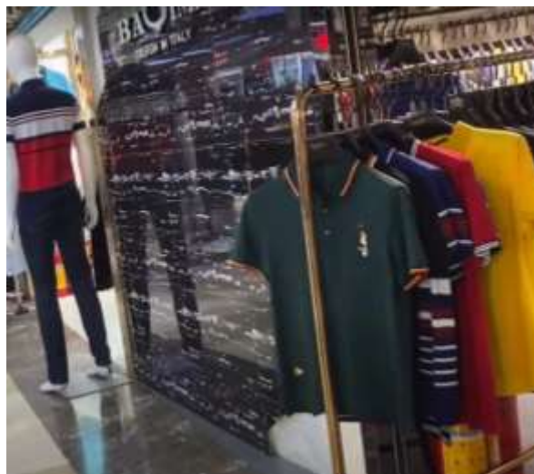
รูปที่ 4.8 : เสื้อผ้าผู้ชาย แบรนด์ “Baima”