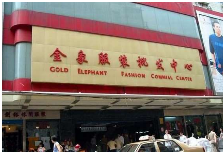
รูปที่ 2.9 : ตลาดจีนเซียง