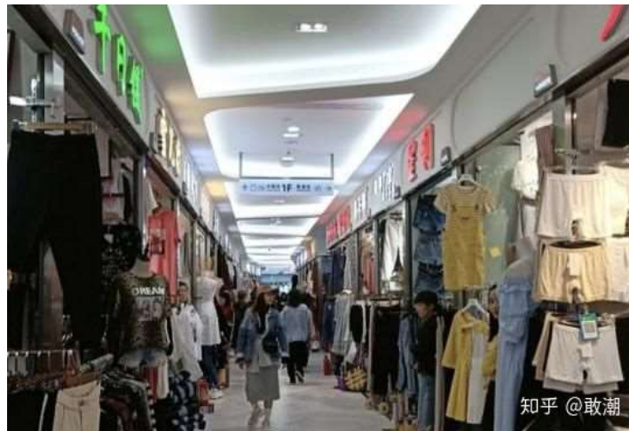
รูปที่ 2.7 : ภายในอาคารของตลาดซือซานหาง