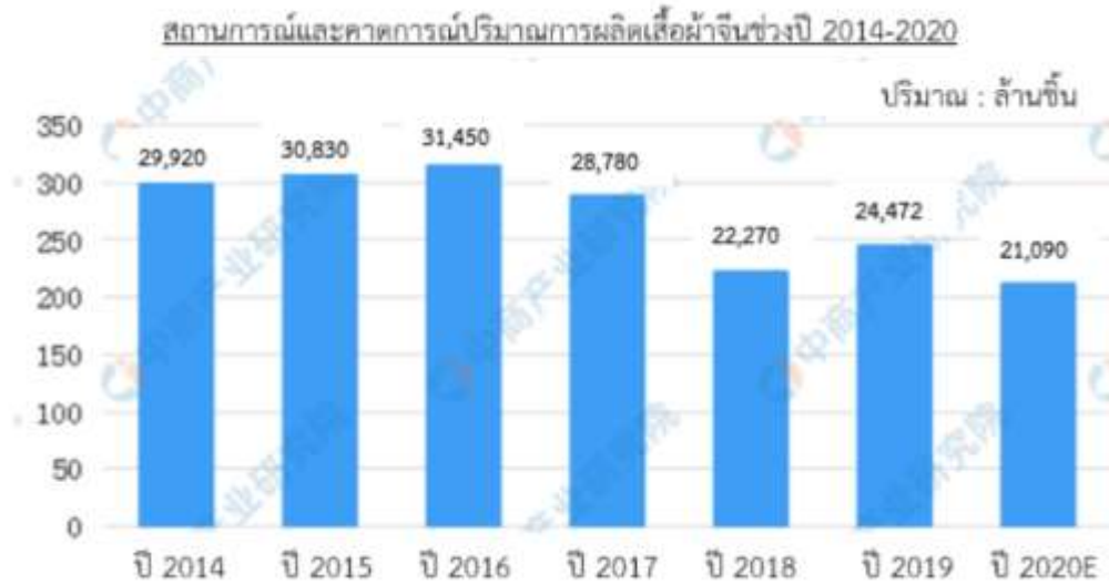
รูปที่ 2.5 : สถานการณ์และคาดการณ์ปริมาณการผลิตเสื้อผ้าจีนช่วงปี 2557-2563

ที่มา : https://www.ditptouch.com/uploads/editor-pick/18/708d5551-893c-b4c6-a77c-b190b67a4b89.pdf