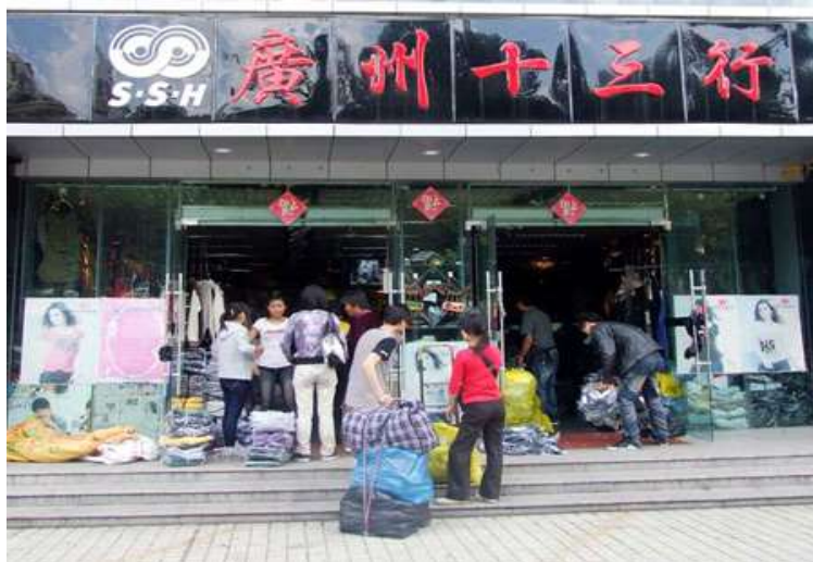
รูปที่ 2.6 : ตลาดซือซานหาง

ห้าง” ตึกนี้ไม่ได้มีสิบสามตึกแต่เกิดจากการเรียกเพี้ยนมาจากคำว่า “ตึกสี่ชั้นห้าง” โดยแต่ละชั้นอัดแน่นไปด้วยผู้คนและร้านค้าเสื้อผ้าราคาส่ง ผู้คนทั่วประเทศจีน นิยมมาซื้อเสื้อผ้าที่นี่ไปขายตามภูมิภาค