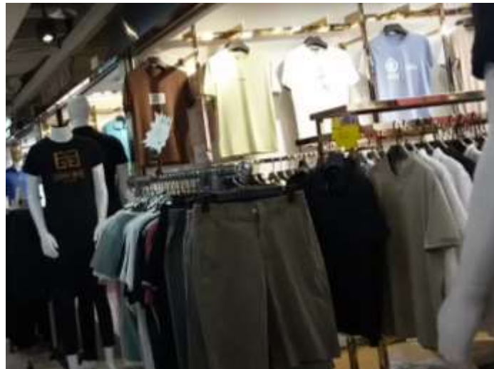
รูปที่ : 4.6 เสื้อผ้าผู้ชายลดราคา