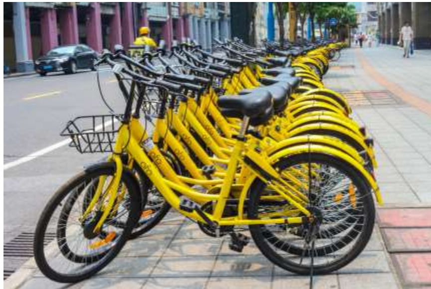
รูปที่ 2.4 : รถจักรยานเช่ายี่ห้อ ofo