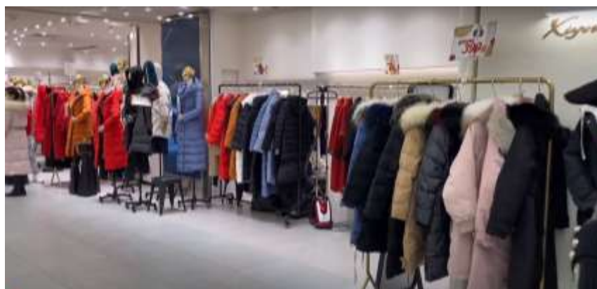
รูปที่ : 4.4 เสื้อผ้าในช่วงฤดูหนาว

เมื่อถึงฤดูหนาวรูปแบบเสื้อผ้าที่นำมาวางขายได้เปลี่ยนไปตามฤดูกาล ดังแสดงในรูปที่ 4.4