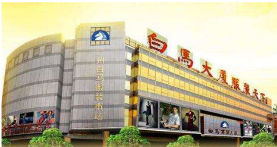
รูปที่ 2.8 : ตลาดไปหมา

- ตลาดไปหมา ดังแสดงรูปที่ 2.8 เป็นตลาดค้าส่งเสื้อผ้ายอดนิยมของผู้ประกอบการชาวไทยที่มักซื้อเสื้อผ้าราคาส่งมาขายยังตึกแพลตตินั่ม ประตูน้ำ ตลาดไปหมามีทั้งหมด 8 ชั้นซึ่งแต่ละชั้นจะมีร้านขายเสื้อผ้าสตรีเป็นจำนวนมาก โดยจะมีเสื้อผ้าแบบใหม่เข้ามาทุกวัน และแต่ละร้านจะมีพนักงานผู้หญิงใส่เสื้อผ้าคอลเลคชันของร้านเพื่อนำเสนอแบบเสื้อผ้าให้กับลูกค้าได้เลือกชม คุณภาพสินค้าที่นี้อยู่ในระดับกลางจนถึงดีมาก ราคาไม่แพงจนเกินไป มีทั้งเสื้อผ้าผู้หญิง เสื้อผ้าผู้ชาย ชุดลำลอง ชุดราตรี ซึ่งจะมีแบบให้เลือกมากมาย ลูกค้าที่เน้นคุณภาพเทียบเท่าของแท้มักจะเลือกตลาดนี้เป็นอันดับต้นๆ การเดินทางมาที่นี้สะดวกสบายเนื่องจากใกล้แหล่งรถไฟฟ้าที่ใหญ่ที่สุดในกวังโจว ใกล้ศูนย์รวมรถบัสที่เดินทางมาจากทั่วประเทศ และติดกับสถานีรถไฟใต้ดินที่ใหญ่ที่สุดแห่งหนึ่งในกวังโจว จึงเป็นที่นิยมของผู้ประกอบการจำหน่ายเสื้อผ้า