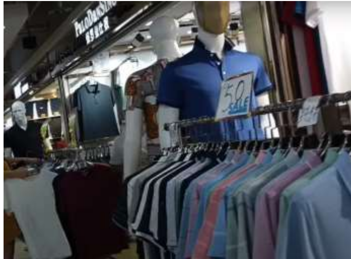
รูปที่ : 4.5 เสื้อผ้าผู้ชายลดราคา

เสื้อผ้าที่ราคาถูกส่วนใหญ่จะอยู่ที่ชั้น 2 ของอาคาร ชั้นนี้มักจะลดราคาจากราคาเต็ม 100 หยวน (ประมาณ 463 บาท) เหลือ 50 หยวน (ประมาณ 233 บาท) และมักเป็นเสื้อผ้าผู้ชาย ดังแสดงในรูปที่ 4.5 และ 4.6