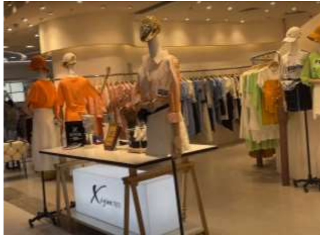
รูปที่ 4.7 : เสื้อผ้าผู้หญิง แบรนด์ “Xiyue”

เสื้อผ้าที่มีราคาแพงในตลาดไปหมา คือ เสื้อผ้าติดแบรนด์ โดยเฉพาะเสื้อผ้าผู้ชายมักมีราคา 1,000 หยวนขึ้นไป (ประมาณ 4,625 บาท) ดังแสดงในรูปที่ 4.7 และ 4.8