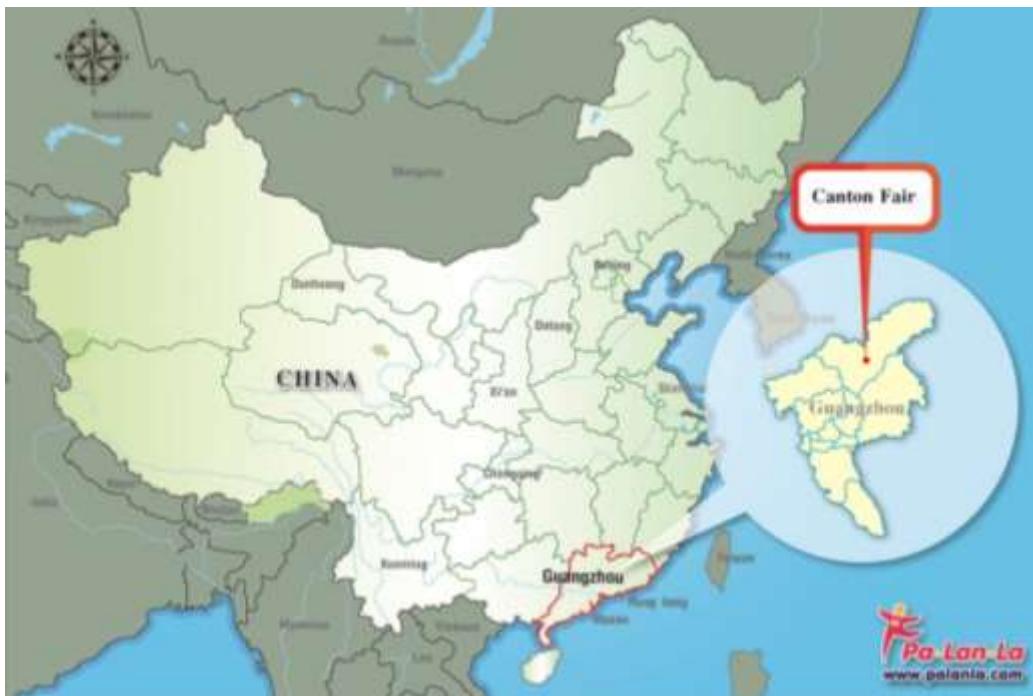
รูปที่ 2.1 : แผนที่เมืองกวางโจว

เมืองกวางโจวเป็นเมืองที่มีประวัติศาสตร์ยาวนาน ถูกก่อตั้งขึ้นเมื่อ 214 ปีก่อนคริสตกาล โดยมีชื่อว่า “เหรินเสี่ยวเฉิง” เป็นชื่อแรก ต่อมาถูกเรียกว่า "หนานเยว" "ร้อยเยว" "หนานไห่" และ "จื่อถิง" กระทั่งมีชื่ออย่างเป็นทางการว่า "กวางโจว" ในปีคริสต์ศักราช 226 เมืองกวางโจวมีพื้นที่ 7,434 ตารางกิโลเมตร ตั้งอยู่ทางตอนใต้ของประเทศจีนโดยมีพรมแดนติดต่อกับฮ่องกงและมาเก๊า ดังแสดงในรูปที่ 2.1 มีประชากรรวมกว่า 12.7 ล้านคน เป็นเมืองเอกและเมืองที่ใหญ่ที่สุดในมณฑลกวางตุ้งและทางตอนใต้ของประเทศจีน และเป็นเมืองที่จัดงาน China Import and Export Fair (Canton Fair) งานแสดงสินค้านานาชาติที่ใหญ่ที่สุดของประเทศจีนที่จัดขึ้นทุกปี