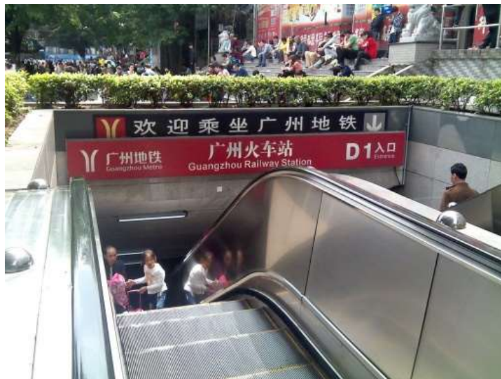
รูปที่ 4.11 : สถานีรถไฟใต้ดินกว้างโจว ทางออก D1