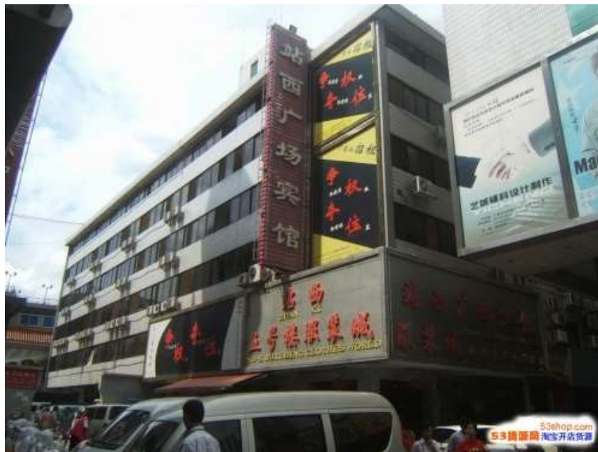
รูปที่ 2.10 : ตลาดจ่านซีลู่

- ตลาดจ่านซีลู่ ดังแสดงในรูปที่ 2.10 เป็นแหล่งรวมตลาดค้าส่ง 3 ประเภทหลักๆ ได้แก่ ตลาดเสื้อผ้าแฟชั่น ตลาดนาฬิกา และตลาดรองเท้า ตลาดค้าส่งเสื้อผ้าที่น่าสนใจอยู่ที่ตึกฮุยเหมย (Hui Mei International Panxin Fashion City) หรือที่คนไทยรู้จักกันในชื่อ “ตึกเกาหลี” โดยเสื้อผ้าที่ตึกนี้เน้นการออกแบบสไตล์เกาหลี ไม่ว่าจะเป็นเสื้อผ้าแฟชั่น ชุดสูท ชุดราตรี ซึ่งคล้ายกับตลาดแพลตตินัมของประเทศไทย สินค้าที่จำหน่ายทั้งราคาปลีกและส่ง คุณภาพค่อนข้างดี ราคาจึงแพงกว่าตลาดเสื้อผ้าอื่นๆ บางร้านเป็นสินค้าที่ถูกส่งตรงมาจากเกาหลี แต่ส่วนใหญ่เป็นสินค้าของประเทศจีนแต่คุณภาพดี นอกจากนี้ยังมีตึกใกล้เคียงกัน อีกทั้งตามซอยถนนหลังตึกฮุยเหมยยังมีห้างร้านและร้านค้าที่ขายสินค้าเสื้อผ้า รองเท้า เสื้อผ้าก็อปแบรนด์ หากใครมีตัวอย่างเสื้อผ้าแบรนด์เนมก็สามารถนำไปให้ทางร้านแกะแบบสั่งตัดเป็นล็อตใหญ่ๆได้ด้วย