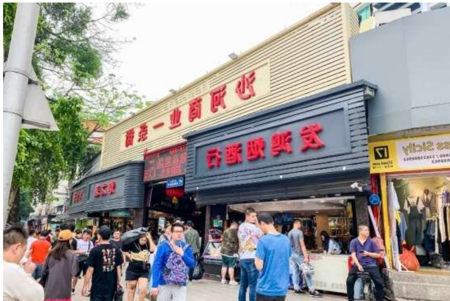
รูปที่ 2.11 : ตลาดซาเหอ