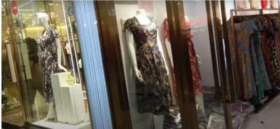
รูปที่ 4.3 : ชุดเตรส ของตลาดไปหามา ชั้น 3

ชั้น 8 เป็นเสื้อผ้าแฟชั่นผู้หญิงสไตล์ยุโรปและเกาหลี และผู้ผลิตหรือร้านค้าจำนวนมากมีตราสินค้าของตัวเอง