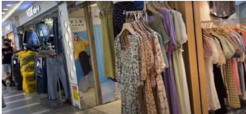
รูปที่ : 4.3 เสื้อผ้าในช่วงฤดูกาลปกติ

เสื้อผ้าในช่วงฤดูกาลปกติจะมีเสื้อผ้าที่มีรูปแบบหลากหลาย เช่น เดรสยาว กางเกงยีนส์ เสื้อยืด กางเกงขาสั้น เป็นต้น ดังแสดงในรูปที่ 4.3