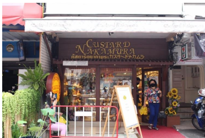
ร้านเบเกอรี่ญี่ปุ่นในซอยสุขุมวิท 33/1