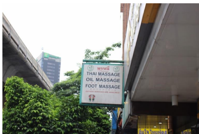
ป้ายร้านนวดแผนไทยในย่านพร้อมพงษ์ที่มีภาษาญี่ปุ่นและภาษาอังกฤษประกอบ