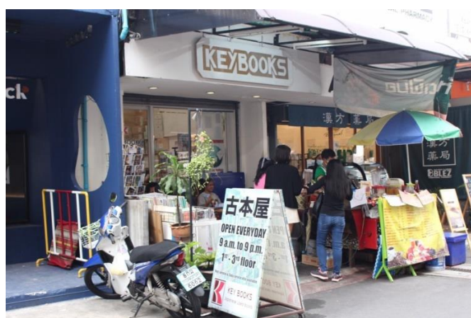
ร้านหนังสือญี่ปุ่นในซอยสุขุมวิท 33/1