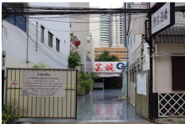
ร้านคาราโอเกะในซอยสุขุมวิท 31