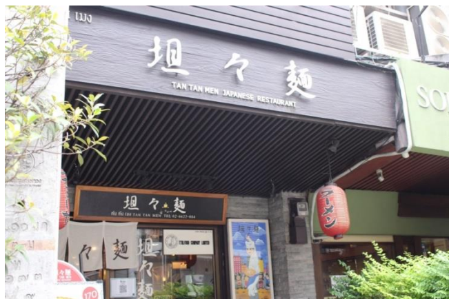
ร้านอาหารญี่ปุ่นในซอยสุขุมวิท 33/1