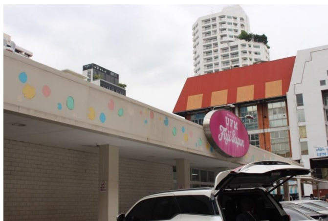
ซูเปอร์มาร์เก็ตญี่ปุ่นในซอยสุขุมวิท 33/1