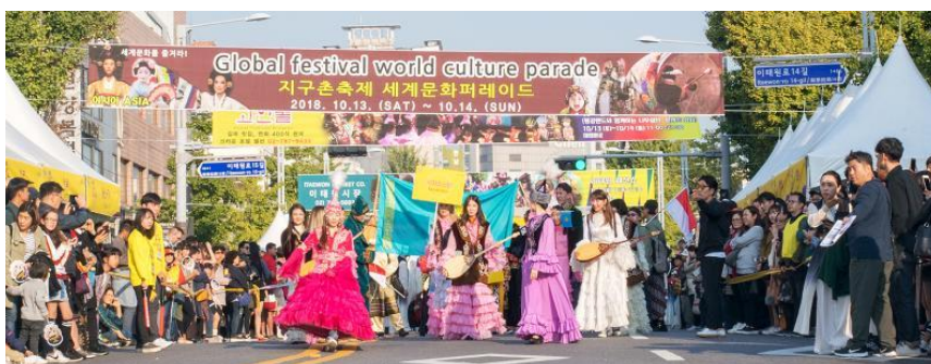
ภาพที่ 6 ITAEWON GLOBAL VILLAGE FESTIVAL