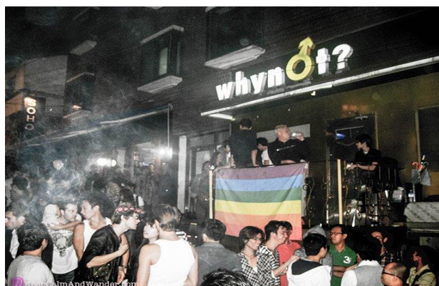
ภาพที่ 5 สถานบันเทิงใน Homo hill

เขียงซานและรัฐบาลของโซล โดยมีจุดประสงค์เพื่อส่งเสริมการสื่อสารระหว่างเชื้อชาติในสังคมที่มีความหลากหลายทางวัฒนธรรม ผ่านการแสดงและอาหารดั้งเดิมของแต่ละชาติ เทศกาลนี้ถูกจัดขึ้นทุกเดือนตุลาคม ในย่านอิแทวอน ซึ่งเป็นย่านมีความโดดเด่นในด้านความหลากหลายวัฒนธรรม เป็นที่ที่ชาวต่างชาติสามารถอยู่อาศัยและประกอบอาชีพรวมกันกับชาวเกาหลีได้ แม้จะมีการจัดสรรพื้นที่แบ่งส่วนตาม ชนชั้น เพศ ศาสนา และรสนิยมทางวัฒนธรรมอย่างชัดเจน เพื่อรักษาความสงบ แต่ความหลากหลายทั้งหมดนี้อยู่รวมกันในย่านอิแทวอน และยังเป็นแหล่งท่องเที่ยวที่สำคัญของโซล จึงทำให้เหมาะสำหรับการจัดงานเทศกาล อีกทั้งยังเป็นการเผยแพร่ภาพลักษณ์ความแตกต่างของย่านอิแทวอนให้เป็นที่รู้จักมากขึ้น เน้นส่งเสริมวิสัยทัศน์ของย่านอิแทวอนในรูปแบบ เมืองในอนาคต การเป็นศูนย์กลางของโลก หรือความเป็นเมืองระดับโลกในเกาหลี รวมถึงสร้างภาพลักษณ์การเป็นเจ้าบ้านที่ดีไปพร้อมๆ กัน เทศกาลในอิแทวอนจึงมีความหลากหลายมากขึ้น อย่างเช่น มีการจัดเทศกาลฮาโลวีนที่เป็นวัฒนธรรมตะวันตกอย่างยิ่งใหญ่ ซึ่งเป็นสิ่งที่หาพบได้ยากในพื้นที่อื่นของเกาหลี (Ka-Eul Yoo ,2012 : 56-59)