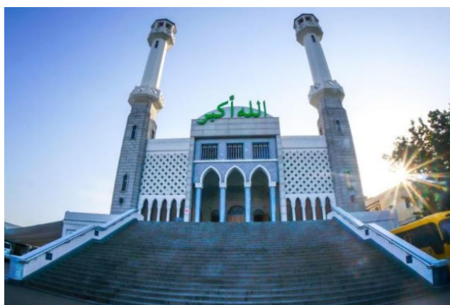
ภาพที่ 3 มัสยิดที่อิแทวอน

อิสลาม ส่งผลให้ต้องมีการปรับตัวทางวัฒนธรรมทั้งการผสมผสาน แบ่งจัดสรรพื้นที่รักษาระยะห่าง รวมถึงการหลีกเลี่ยงหรือการรับมือการต่อต้านของชาวเกาหลี ในบริเวณพื้นที่ที่ใกล้ชิดกับมัสยิด จึงเป็นที่น่าสนใจสำหรับนักธุรกิจชาวมุสลิมจำนวนมาก เนื่องจากสามารถประกอบพิธีกรรมทางศาสนาได้ และสามารถดึงดูดลูกค้าชาวมุสลิมจากร้านอาหารฮาลาล และร้านค้าอิสลามที่หลากหลาย มีบรรยากาศที่เป็นมิตรกับชาวต่างชาติ และมีปัจจัยที่เอื้อต่อเศรษฐกิจ ทั้งด้านทำเลที่ตั้งที่อยู่ใจกลางโซลและด้านการคมนาคม ที่มีระบบขนส่งสาธารณะ อย่างรถไฟฟ้ามหานครและรถบัสหลายสาย ที่สามารถเดินทางมาอิแทวอนได้สะดวกรวดเร็ว ทำให้ถนนมุสลิมและมัสยิดกลายเป็นอีกสถานที่ท่องเที่ยวชื่อดังในย่านอิแทวอน (Doyoung Song, 2014 : 425-428)