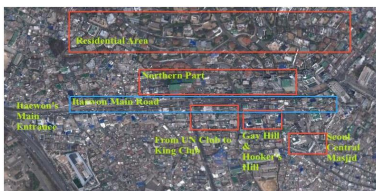
ภาพที่ 4 พื้นที่ย่านอิแทวอน