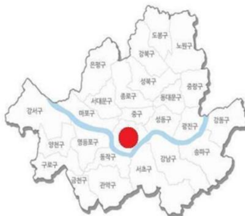
ภาพที่ 2 แผนที่โซล