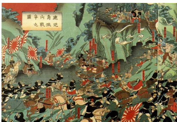
รูปวาดการปะทะในยุทธการเขาชิโรยามะ

กบฏซัตสึมะ เริ่มต้นจากการที่เกิดความวุ่นวายของซามูไรในหลายแคว้นทั่วประเทศโดยเฉพาะโชชู ทำให้รัฐบาลจัดการยึดอาวุธต่างๆ ของเหล่าซามูไรไปเก็บไว้ แต่สุดท้ายเหล่าซามูไรจากแคว้นซัตสึมะก็ลอบเข้าไปขโมยอาวุธกลับมาได้ โดยอ้างว่าจะมีการลอบสังหารไซโง ทาคาโมริผู้นำคนสำคัญในตอนนั้น และเมื่อเกิดความวุ่นวายในแคว้นซันไซโงที่เคยอยู่ในกลุ่มบริหารรัฐบาลเมจิในช่วงแรกตัดสินใจพากองกำลังเดินทางไปโตเกียวเพื่อเจรจาทางออก แต่กลับถูกต่อต้านจากกองกำลังทหารที่เมืองคุมะโมะโตะ การปะทะยาวนานเป็นเวลา 6 เดือน สุดท้ายกองทัพซัตสึมะและไซโง ทาคาโมริต้องยอมถอยทัพออกจากปราสาทคุมะโมะโตะ กองกำลังส่วนหนึ่งได้ทำการเข้มปุกุ (การคว้านท้องตัวเอง) ระหว่างทาง ส่วนไซโงและบริวารอีกจำนวนไม่มากถอยร่นไปที่ภูเขาชิโรยามะ ก่อนที่ไซโงที่คาดการณ์ว่ากองกำลังตนเองจะพ่ายแพ้ จึงตัดสินใจทำเข้มปุกุตัวเองแทนการถูกสังหาร ซึ่งการกระทำนี้ได้รับการยกย่องว่าเป็นการตายอย่างวิเศษซามูไร และได้รับการขนานนามให้เป็นซามูไรคนสุดท้ายของญี่ปุ่นอีกด้วย