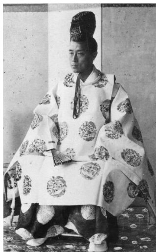
รูปภาพโชกุนโยชิโนบุ