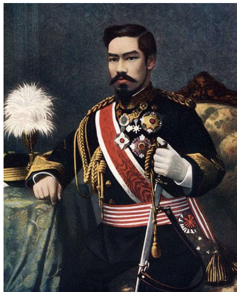
ภาพวาดจักรพรรดิเมจิ

ออกพระราชบัญญัติกฤษฎีกาการริบทรัพย์สินโชกุนและล้มสถาบันโชกุน โดยการเคลื่อนไหวในครั้งนี้เรียกกันว่า การฟื้นฟูพระราชอำนาจสมัยเมจิ โดยตั้งคำขวัญไว้ว่า “ฟุโกกุ เคียวเฮ” ซึ่งหมายถึงการสร้างชาติที่มั่นคงทาง เศรษฐกิจและความเข้มแข็งทางทหาร (ปัญญา วิวัฒนาการ 2557 : 224)