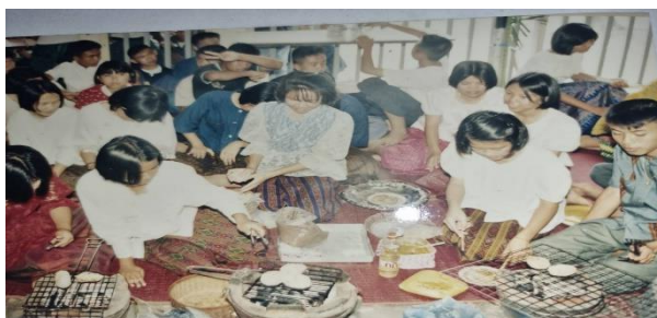
ภาพที่ 4 การสาธิตการทำข้าวจีของนักเรียนโรงเรียนบ้านหมี่วิทยา

ประเพณีก่าฟ้าของชาวไทยพวนนี้ ถือปฏิบัติกันมามากกว่า 200 ปีเศษแล้ว โดยมักจะจัดขึ้นระหว่างเดือน 3 ขึ้น 3 ค่ำ ของทุกปี ก่อนถึงวันงาน ผู้ใหญ่ในครอบครัวจะบอกให้ลูกหลานทราบล่วงหน้า เพื่อเตรียมอาหาร น้ำดื่ม น้ำใช้ ข้าวสาร อาหารแห้ง ให้พร้อม เนื่องจากเมื่อถึงวันก่าฟ้าแล้ว สิ่งที่คนไทยพวนถือ คือ จะต้องหยุดทำงานการทุกอย่าง ไม่ดำข้าว ไม่ตักน้ำ ไม่ผ่าฟืน ไม่ซักผ้า เป็นเวลาประมาณ 3 ถึง 5 วัน ในงานพิธีก่าฟ้าชาวไทยพวนจะทำข้าวจีไปถวายพระที่วัด ปัจจุบันมีทั้งข้าวจีและข้าวหลาม ซึ่งได้มีการพัฒนาไปตามกาลเวลาตามที่ผู้ทำจะเห็นสมควร เช่น การทำข้าวจีใส่ไข่ การทอดข้าวเหนียวด้วยน้ำมันแทนการบั้งจันเตาไฟ