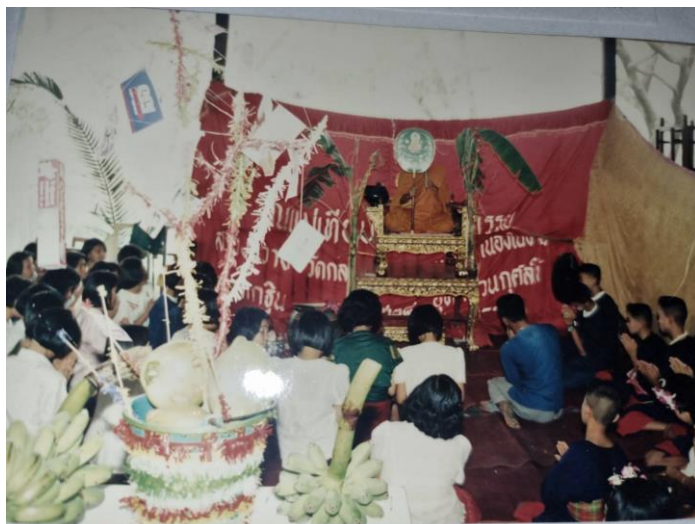
ภาพที่ 3 งานบุญพระเวสหรือบุญมหาชาติที่ทำพร้อมกับพิธีใส่กระจาด

ใส่กระจาด เป็นงานพิธีทำบุญที่จัดขึ้นในเดือนสิบสองของทุกปี ทำพร้อมกับบุญพระเวสหรือบุญมหาชาติ เพื่อรวบรวมอาหารและสิ่งของต่างๆ ก่อนจะนำไปถวายพระสงฆ์ และฟังเทศน์มหาชาติทั้งสิบสามกัณฑ์ โดยมีความเชื่อว่าจะได้รับอานิสงส์มากและส่งผลให้ผู้นั้นได้จุติกับศาสนาแห่งองค์พระศรีอาริยมตไตรย์อีกด้วย