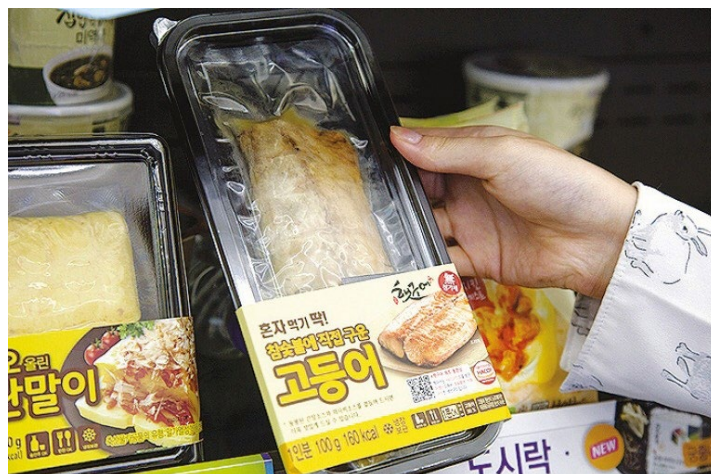
ภาพที่ 2 : ผลิตภัณฑ์อาหารที่ปรับปรุงใหม่ด้วยกระแสวัฒนธรรมฮนจก