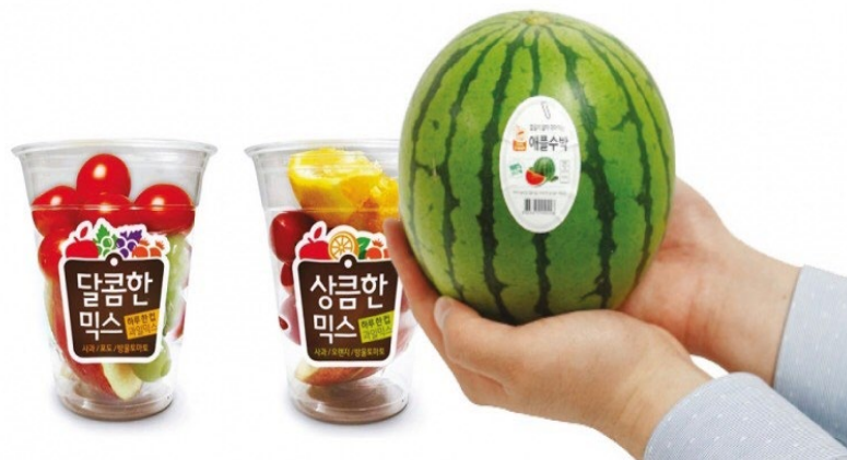
ภาพที่ 1 : ผลิตภัณฑ์อาหารที่ปรับปรุงใหม่ด้วยกระแสวัฒนธรรมฮนจก

ปรับตัวให้ทันกระแสดังกล่าว ดังเช่นมีโปรโมชันสำหรับผู้เดินทางท่องเที่ยวคนเดียว การปรับเปลี่ยนของอุตสาหกรรมอาหารที่ปรับเปลี่ยนรูปแบบไปให้เหมาะกับผู้ใช้ชีวิตคนเดียว เช่น อาหารในร้านสะดวกซื้อที่เป็นที่นิยมมากที่สุดสำหรับคนที่นิยมใช้ชีวิตแบบฮนจก ก็เปลี่ยนแปลงรูปแบบและปริมาณให้เหมาะสมเพื่อรองรับกระแสนิยมของวัฒนธรรมดังกล่าว