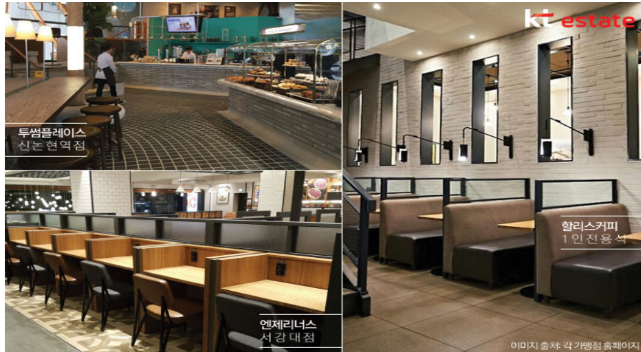
ภาพที่ 3 : ร้านอาหารสำหรับผู้มารับประทานคนเดียว