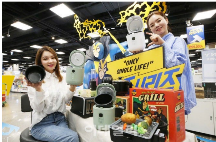
ภาพที่ 5 : เครื่องใช้ไฟฟ้าสำหรับผู้นิยมใช้ชีวิตแบบฮนจก

นอกจากธุรกิจอาหาร ธุรกิจอื่นๆ ก็สร้างสรรค์ผลิตภัณฑ์ออกมา เพื่อตอบสนองผู้คนจำนวนมากที่นิยมในวัฒนธรรมฮนจกเช่นกัน ทั้งเครื่องใช้ไฟฟ้า เฟอร์นิเจอร์ สิ่งอำนวยความสะดวก