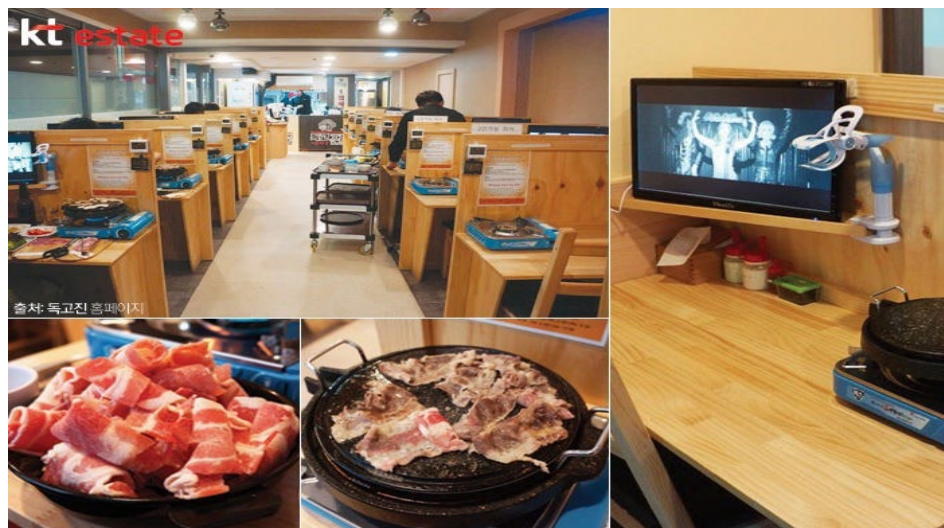
ภาพที่ 4 : ร้านอาหารสำหรับผู้มารับประทานคนเดียว