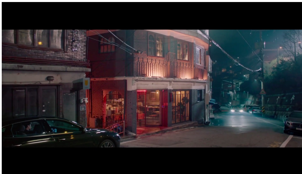
ภาพที่ 9 ร้าน Oriole ที่ถูกใช้เป็นร้านอาหารทันสมัยในเรื่อง Itaewon Class ( https://koreandramaland.com/listings/oriole/ )