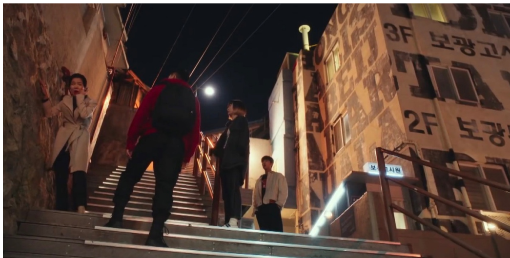
ภาพที่ 7 บริเวณ G guest house ในละครเรื่อง Itaewon Class