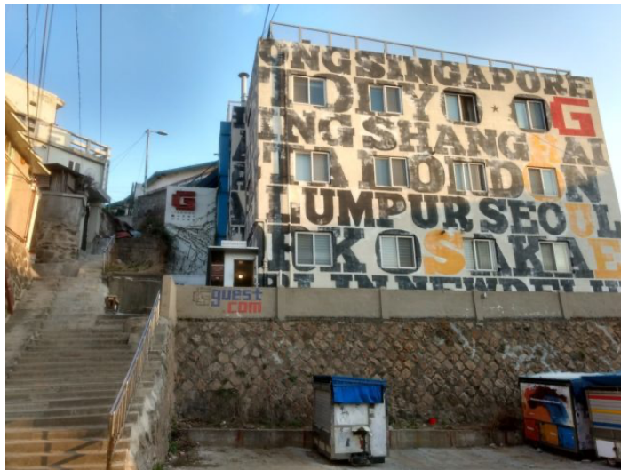
ภาพที่ 6 อาคารของ G guest house

G guest house เป็นสมาชิกของ CESCO MemberZone ซึ่งเป็นบริษัทกำจัดแมลงชั้นนำในประเทศเกาหลีใต้ซึ่งให้บริการเฉพาะในโรงแรมชั้นนำและร้านอาหารชั้นดีในประเทศเท่านั้น G guest house แห่งนี้มีเจ้าของเป็นคนท้องถิ่นที่เป็นมิตรและหลงใหลในการเดินทางอย่างมาก ตั้งอยู่ที่ 131-11 ย่านอิแทวอน เขตยงชาน เมืองโซล สะดวกต่อการเดินทางเนื่องจากระบบขนส่งสาธารณะ รูปแบบอาคารมีความโดดเด่น ออกแบบอาคารในรูปแบบอินดัสเทรียลเพื่อดึงดูดนักท่องเที่ยวภายในมีระบบรักษาความปลอดภัยตลอด 24 ชั่วโมงและมีสิ่งอำนวยความสะดวกต่อนักท่องเที่ยวและนักเดินทาง เป็นสถานที่ในการพบเจอกับผู้อื่น