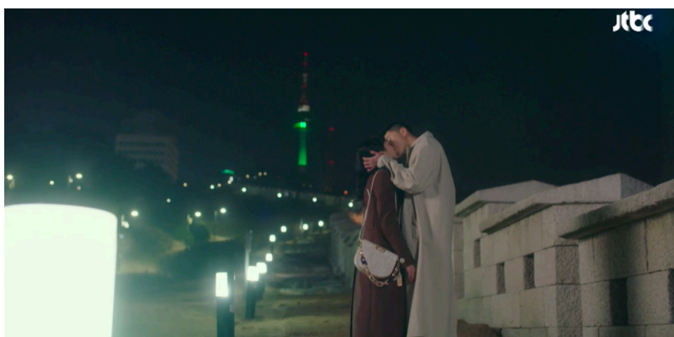
ภาพที่ 5 บริเวณกำแพงของจตุรัสนัมซานแบคคอมที่ปรากฏในเรื่อง Itaewon Class

( https://english.visitseoul.net/tours/Hidden-Night-Spots-for-Seoul-Travelers_/31618?curPage=1 )