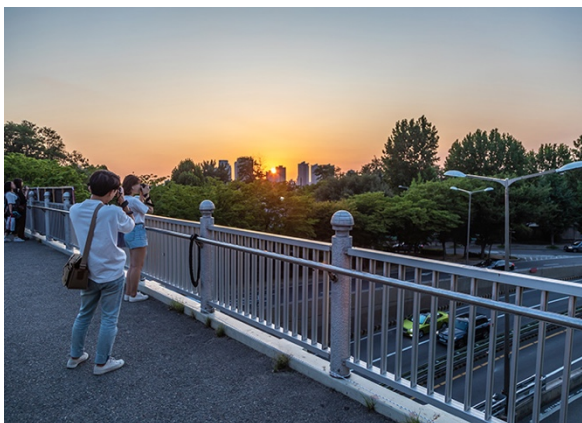
ภาพที่ 2 บริเวณบนสะพานลอยนกอชาพยอง

สะพานลอยนกอชาพยองเป็นจุดที่รู้จักดีในหมู่นักเดินทางและนักท่องเที่ยวสำหรับการชมภูเขาันมซานและหอคอยเอ็นโซลได้ ตั้งอยู่ใกล้สวนสาธารณะันมซาน เป็นสถานที่ที่เหมาะสมกับการเยี่ยมชมในระหว่างการเดินทาง สะพานลอยแห่งนี้เป็นจุดชมวิวที่เหมาะสมที่สุดในช่วงพระอาทิตย์ตก รวมถึงบริเวณสะพานลอยแห่งนี้ถูกใช้เป็นสถานที่ถ่ายทำละครโทรทัศน์ของเกาหลีได้อีกหลายเรื่อง จึงเป็นสถานที่ที่ดึงดูดนักท่องเที่ยวเป็นจำนวนมาก ทำให้เศรษฐกิจอิแทวอนมีความเคลื่อนไหวอยู่ตลอดเวลา