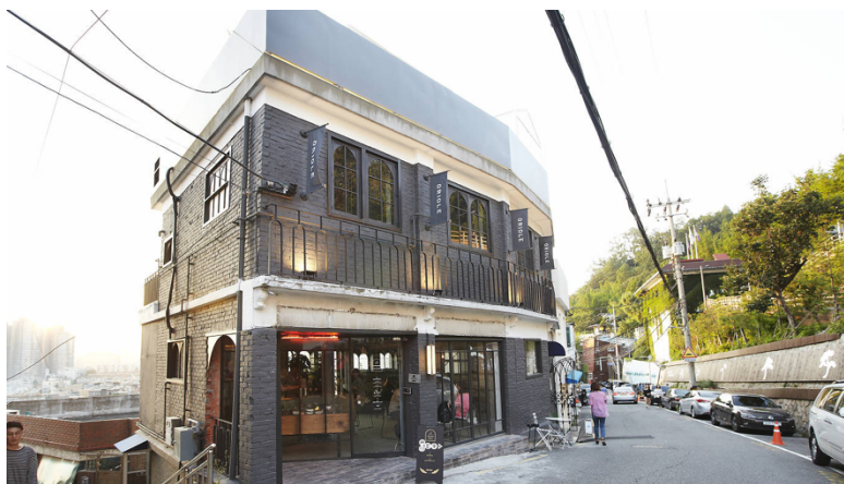
ภาพที่ 8 ร้านคาเฟ่ Oriole ในย่านอิแทวอน ( https://www.timeout.com/seoul/bars/oriole )

Oriole ตั้งอยู่บริเวณตีนเขาของภูเขาซัมซาน เป็นคาเฟ่บนชั้นดาดฟ้าที่มีชื่อเสียงในกรุงโซล ซึ่งสามารถมองเห็นทิวทัศน์ของย่านแอบังซอน ย่านอิแทวอน และ Namsan Seoul Tower เปิดดำเนินการโดยนักร้องชาวเกาหลี จองยอบ เปิดให้บริการเป็นคาเฟ่ในช่วงกลางวัน และเปลี่ยนเป็นพื้นที่รับประทานอาหารและบาร์ในเวลา 18 นาฬิกา นอกจากนี้ Oriole ยังมีโซนภาพถ่ายสำหรับรองรับความต้องการของนักท่องเที่ยว จึงเป็นสถานที่นิยมของนักท่องเที่ยวและคนในท้องถิ่น