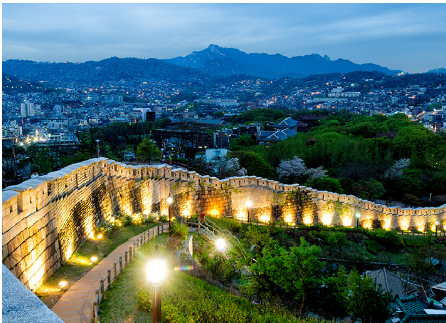
ภาพที่ 4 บริเวณกำแพงขอบจตุรัสนัมซานแบคคอม

จตุรัสนัมซานแบคคอมตั้งอยู่กลางภูเขา ระหว่างทางขึ้นสวนสาธารณะ Hoehyeon Dongnamsan ในเขตจุงกู มีรูปปั้นที่ก่อตั้งขึ้นเพื่อรำลึกถึงนักเคลื่อนไหวเพื่อเอกราชของนักศึกษา และการเคลื่อนไหวช่วยเหลือต่อต้านญี่ปุ่นของนักการเมืองชื่อคิมกูและจิตวิญญาณของความรักชาติที่ทำงานเพื่อสร้างรัฐที่เป็นปึกแผ่น ด้านหน้ามีรูปปั้นตั้งอยู่บนสนามหญ้ากว้างและมีทางเดินไปยังภูเขานัมซาน