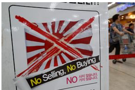
ภาพที่ 4.2 : ภาพของนโยบาย “No Selling No Buying” แคมเปญรณรงค์ไม่ซื้อสินค้าจากญี่ปุ่นในเกาหลีใต้