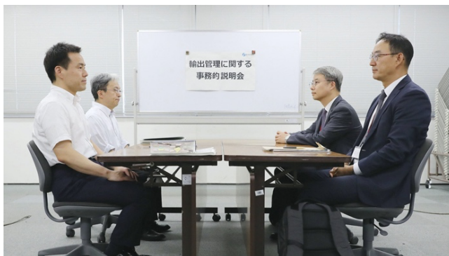
ภาพที่ 4.1 : ภาพของญี่ปุ่น(ซ้าย) และเกาหลีใต้(ขวา) ร่วมเจรจาทางออกเกี่ยวกับมาตรการการจำกัดการส่งออกในวันที่ 12 กรกฎาคม พ.ศ. 2562

ทางออกเกี่ยวกับปัญหาที่เกิดขึ้น แต่ก็ไม่ประสบผลสำเร็จ ต่อมาในวันที่ 23 กรกฎาคม ค.ศ. 2020 เกาหลีใต้ได้ร้องเรียนต่อองค์การการค้าโลก (World Trade Organization: WTO) ว่าญี่ปุ่นได้กีดกันการค้าต่อเกาหลีใต้อย่างไม่เป็นธรรม ในด้านของญี่ปุ่นก็ได้ออกมาตอบโต้ว่าการดำเนินมาตรการดังกล่าวเป็นสิ่งที่ต้องทำ เนื่องจากเป็นเรื่องของความมั่นคง