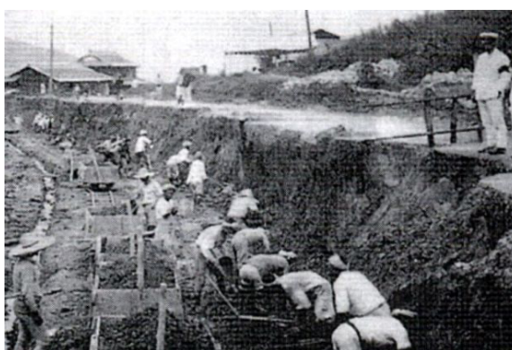
ภาพที่ 3.1 : แรงงานชาวเกาหลีที่ถูกบังคับใช้แรงงานช่วงสงคราม

ประเทศเกาหลีและญี่ปุ่นเป็นประเทศที่มีความสัมพันธ์ทางประวัติศาสตร์มาอย่างยาวนาน เนื่องจากทั้งสองประเทศมีที่ตั้งทางภูมิศาสตร์ที่ใกล้กัน อีกสาเหตุหนึ่งคือคาบสมุทรเกาหลีถือว่าเป็นจุดยุทธศาสตร์ที่มีความสำคัญต่อความมั่นคงของญี่ปุ่น ดังนั้นญี่ปุ่นจึงจำเป็นต้องดำเนินวิธีการต่าง ๆ เพื่อที่จะได้มาสู่การมีอิทธิพลเหนือคาบสมุทรเกาหลี เพื่อที่จะเป็นเจ้าแห่งอาณานิคมญี่ปุ่นจึงได้เริ่มทำสงครามกับประเทศต่าง ๆ จนในที่สุด ญี่ปุ่นสามารถยึดครองเกาหลีได้สำเร็จ ในช่วงค.ศ. 1910 - 1945 เกาหลีได้ตกเป็นอาณานิคมของญี่ปุ่น ในระหว่างช่วงที่เกาหลีถูกญี่ปุ่นปกครอง ญี่ปุ่นได้ทำการเอารัดเอาเปรียบชาวเกาหลีทั้งในเรื่องการบริโภค การศึกษา รวมถึงได้พยายามปลุกฝังความเป็นญี่ปุ่นให้แก่คนเกาหลีเพื่อที่คนเหล่านั้นจะได้เติบโตไปเป็นแรงงานของประเทศญี่ปุ่น รวมทั้งยังมีการเกณฑ์ผู้หญิงชาวเกาหลีไปเป็นนางบำเรอให้แก่ทหารญี่ปุ่นในช่วงสงคราม อีกทั้งยังมีการเกณฑ์แรงงานชายเกาหลีไปใช้เป็นแรงงานในภาคการผลิตของญี่ปุ่นด้วย 26