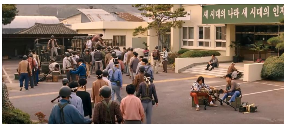
ภาพที่ 16 : การจับอาวุธขึ้นตอบโต้ทหารของชาวเมือง

10. การจับอาวุธขึ้นตอบโต้ทหารของชาวเมือง ภาพยนตร์ได้นำเสนอฉากจากการเป็นฝ่ายตั้งรับของประชาชน มาเป็นฝ่ายบุกโจมตีทหารบ้างแล้ว จากเหตุการณ์นองเลือด ณ ถนนกินนัม ได้สร้างความโกรธแค้นของประชาชนจนถึงขีดสุด จึงเริ่มจัดตั้งกองกำลังป้องกันตนเองขึ้นมาจำนวนหนึ่ง โดยฉากที่ยกมามีความคล้ายคลึงกับเหตุการณ์จริงที่เกิดขึ้นในประวัติศาสตร์ คือ ทันทีหลังเหตุการณ์สังหารหมู่ในวันเดียวกัน ประชาชนก็เร่งรีบหาอาวุธให้กับตัวเองและพวกพ้อง และเพราะพวกเขาต้องการอาวุธปืน จึงเข้าปล้นชิงอาวุธต่าง ๆ รอบเมือง เหมือนฉากในภาพยนตร์ที่ควังมินวู ออกปล้นอาวุธปืนที่คลังเก็บอาวุธแห่งหนึ่ง หลังจากนั้นก็ใช้ศาลาประชาคมที่สวนสาธารณะกวางจูเป็นศูนย์บัญชาการ (The May 18 History Compilation Committee of Gwangju, 2015 : 101)