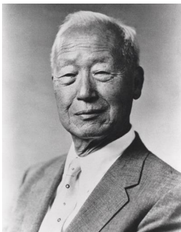
ภาพที่ 1 : อี ซึงมัน

หลังการใช้อำนาจแบบเผด็จการและเศรษฐกิจอันย่ำแย่ในประเทศ ประชาชนก็ไม่อาจอดทนต่อการบริหารประเทศของผู้นำรัฐบาลเช่นนี้ได้อีก จึงเกิดการลุกฮือออกมาชุมนุมแสดงความไม่พอใจ และเกิดความรุนแรง ทั้งยังเกิดการสังหารหมู่กับฝ่ายผู้ต่อต้านรัฐบาลขึ้นอีกหลายต่อหลายครั้ง แต่ในท้ายที่สุดก็สามารถขับไล่ประธานาธิบดีอี ซึงมัน ให้ลาออกจากตำแหน่งได้สำเร็จในเดือนเมษายน ค.ศ. 1960 เมื่อกองทัพปฏิเสธคำสั่งของผู้นำรัฐบาล ที่ต้องการใช้ความรุนแรงในการสลายการชุมนุม เป็นการสิ้นสุดยุครัฐบาลของอี ซึงมัน หลังจากดำรงอยู่ในตำแหน่งนานถึง 12 ปี และกำลังจะขึ้นเป็นประธานาธิบดีสมัยที่ 4