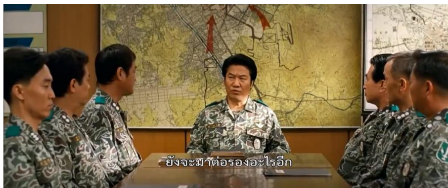
ภาพที่ 19 : คณะกรรมการฝ่ายต่อสู้ของพลเมือง ได้ยื่นข้อเสนอเรียกร้องถึงรัฐบาล

14. การฟื้นฟูระเบียบบ้านเมือง ภาพยนตร์ได้นำเสนอฉากที่พลเมืองชาวกวางจูต่างพากันออกมาทำความสะอาดพื้นที่รอบเมือง พร้อมกับมีรถพยาบาลคันหนึ่งออกมาประกาศขอรับบริจาคเลือด มีอาสาสมัครมากมายต่างช่วยกันทำกับข้าวแจกจ่ายผู้คนในเมือง โดยฉากที่ยกมานี้มีความคล้ายคลึงกับเหตุการณ์จริงที่เกิดขึ้นในประวัติศาสตร์ คือ ภายหลังจากเข้ายึดพื้นที่ของประชาชนกลับมาได้สำเร็จ เมืองกวางจูก็กลับคืนสู่สภาวะปกติได้ช่วงหนึ่ง โดยพ่อค้า แม่ค้าสามารถทำการเปิดร้านตามปกติได้อีกครั้ง และถึงแม้ทรัพยากรจะมีใช้อย่างจำกัดในช่วงนี้ แต่ด้วยสำนึกความเป็นอันหนึ่งอันเดียวกันของผู้คนในเมือง จึงทำให้ทรัพยากรต่าง ๆ มีใช้อย่างเพียงพอ ทั้งอาชญากรรมก็ยังมีอัตราที่ต่ำกว่าช่วงเวลาปกติมากที่สุด (The May 18 History Compilation Committee of Gwangju, 2015 : 107-108)