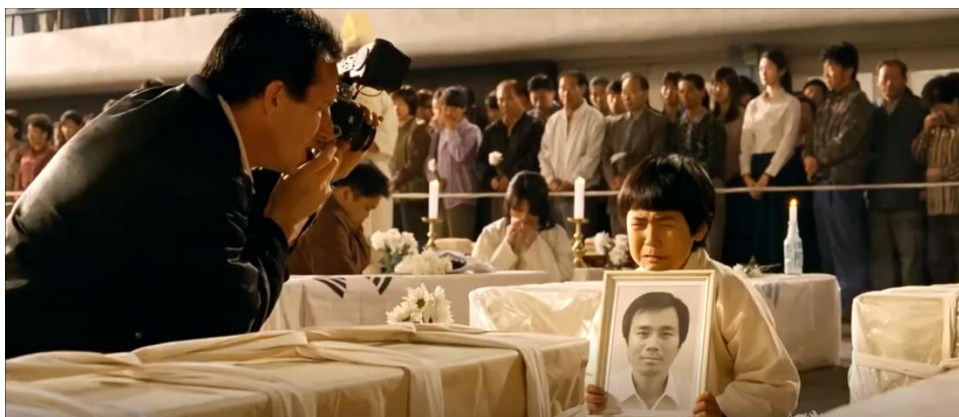
ภาพที่ 18 : สื่อจากต่างประเทศเข้ามาทำข่าว