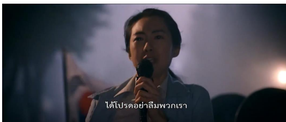
ภาพที่ 23 : การกระจายเสียงไปทั่วเมืองถึงวีรกรรมของพี่น้องชาวกวางจู

17. การกระจายเสียงไปทั่วเมืองถึงวีรกรรมของพี่น้องชาวกวางจู ภาพยนตร์ได้นำเสนอฉากเมื่อพักชินเอได้ทราบข่าวทุกคนถูกทหารสังหารตายหมดแล้ว เธอจึงได้ประกาศคำร้องขอต่อพี่น้องชาวกวางจูทุกคนขณะที่รถขับไปรอบเมืองว่า “พี่น้องกวางจู ได้โปรดอย่าลืมพวกเรา โปรดจดจำพวกเราไว้” โดยฉากที่ยกมานี้มีความคล้ายคลึงกับเหตุการณ์จริงที่เกิดขึ้นในประวัติศาสตร์ คือ พัก ยิง ซุน (Park Yeong Soon) หนึ่งในผู้ชุมนุมสตรีท่านหนึ่งที่ได้ร่วมอยู่ในวันสุดท้ายของเหตุการณ์สังหารหมู่ในกวางจู ก็ได้ประกาศข่าวเป็นครั้งสุดท้ายในห้องกระจายเสียง ซึ่งดังกังวานไปทั่วเมืองกวางจู โดยมีใจความว่า “เพื่อนพลเมืองของเรา ขณะนี้กองทัพได้เข้ามาเมืองมาแล้ว พี่น้องชายหญิงที่รักยิ่งของพวกเรา กำลังจะถูกสังหารด้วยปืนและดาบปลายปืน เราจะสู้กับกองทัพจนคนสุดท้าย จงร่วมต่อสู้จนถึงที่สุด พวกเราจะปกป้องกวางจูจนถึงวาระสุดท้าย กรุณาระลึกถึงพวกเราด้วย...!” ซึ่งเป็นคำร้องขอที่ประชาชนชาวเมืองกวางจูในเวลานั้นยังคงจดจำได้ (The May 18 History Compilation Committee of Gwangju, 2015 : 113)