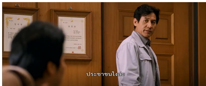
ภาพที่ 14 : ย้ำเตือนการกระทำ