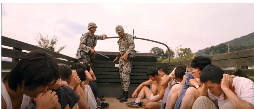
ภาพที่ 12 : ขณะถูกควบคุมตัว

7. ผู้บาดเจ็บจำนวนมากเต็มโรงพยาบาล ภาพยนตร์ได้นำเสนอฉากโรงพยาบาลที่เต็มไปด้วยผู้บาดเจ็บสาหัสจำนวนมาก เกินกว่าที่โรงพยาบาลจะรับมือไหว โดยฉากที่ยกมานี้มีความคล้ายคลึงกับเหตุการณ์จริงที่เกิดขึ้นในประวัติศาสตร์ คือ ผู้บาดเจ็บหลายรายที่หนีการจับกุมออกมาได้ ต่างไปเข้าแถวรอรับการรักษาที่โรงพยาบาล (The May 18 History Compilation Committee of Gwangju, 2015 : 91) ด้วยผู้บาดเจ็บจำนวนมากมายขนาดนี้ การกระทำของทหารจึงเสมือนทำไปเพื่อสังหารหมู่ผู้คนทั่วทั้งเมือง ซึ่งเหตุการณ์ในวันนี้ก็มีความคล้ายคลึงกับสถานการณ์เมื่อวันที่ 18 พฤษภาคมที่ผ่านมา