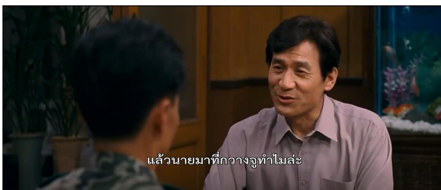
ภาพที่ 6 : สาเหตุที่เหล่าทหารลงมายังเมืองกวางจู

2. สาเหตุที่เหล่าทหารลงมายังเมืองกวางจู ภาพยนตร์ได้นำเสนอฉากที่ร้อยโทคิม เข้ามาเยี่ยมเยียนและพูดคุยกับพัคฮึงซู ซึ่งอดีตเคยเป็นเหล่าทหารนายพลใหญ่มาก่อน พักฮึงซู ถามถึงสาเหตุที่ร้อยโทคิมลงมาที่เมืองกวางจูว่าเพราะอะไร ร้อยโทคิมบอกว่า “ผมกำลังปฏิบัติภารกิจอยู่ครับ” แล้วพัคฮึงซูก็ถามว่า “ภารกิจอะไร ถึงขนาดใช้หน่วยปฏิบัติการพิเศษ” ร้อยโทคิม บอกว่า “ได้รับคำสั่งให้ลงมากระจายกำลังไว้ตามมหาวิทยาลัยที่สำคัญทั่วประเทศ” โดยฉากที่ยกมานี้มีความคล้ายคลึงกับเหตุการณ์จริงที่เกิดขึ้นในประวัติศาสตร์ คือ ศูนย์บัญชาการกองทัพออกคำสั่งให้ศูนย์บัญชาการเหล่าทหารที่ 2 เริ่มปฏิบัติการซุงจิงในเวลา 00:01 น. ของวันที่ 18 พฤษภาคม โดยให้ทำการยึดมหาวิทยาลัยทั่วประเทศให้สำเร็จ ก่อนเวลาตี 04:00 น. (The May 18 History Compilation Committee of Gwangju, 2015 : 82) และการลงมาปฏิบัติหน้าที่ในรูปแบบนี้จึงทำให้ประชาชนมองออกมาว่าพวกกลุ่มอำนาจกองทัพใหม่ต้องการรวบอำนาจทางการเมืองทั้งหมดไว้ที่ตัวเอง