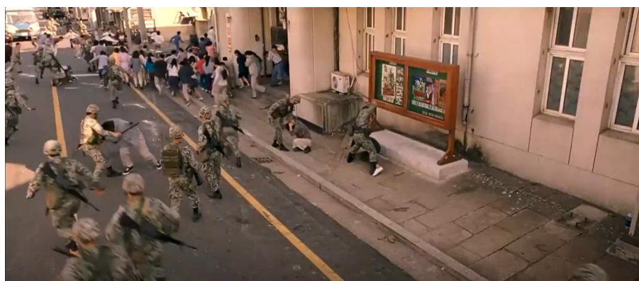
ภาพที่ 8 : ทหารไล่จู่โจมประชาชนที่ออกมาเรียกร้องอย่างไม่เลือกหน้า

4. ทหารไล่จู่โจมประชาชนที่ออกมาเรียกร้อง ภาพยนตร์ได้นำเสนอฉากที่ทหารวิ่งจู่โจมเข้ามาทบตีประชาชนอย่างไม่เลือกหน้าในวันเดียวกันกับที่นักศึกษาออกมาชุมนุมประท้วงในวันที่ 18 พฤษภาคม หลังจากยืนประท้วงได้ไม่นาน โดยฉากที่ยกมามีความคล้ายคลึงกับเหตุการณ์จริงที่เกิดขึ้นในประวัติศาสตร์ คือ หน้าประตูใหญ่ของวิทยาลัยเซินนม มีกลุ่มนักศึกษามารวมตัวกันร้องเพลงและตะโกนคำขวัญ กลับทำให้ทหารไม่พอใจจากนั้นจึงส่งเสียงให้จู่โจมและมุ่งหน้าไปสู่ผู้ชุมนุม และไล่ทบตีนักศึกษาที่ไม่มีอาวุธและผลักดันให้ถอยออกไป (The May 18 History Compilation Committee of Gwangju, 2015 : 86)