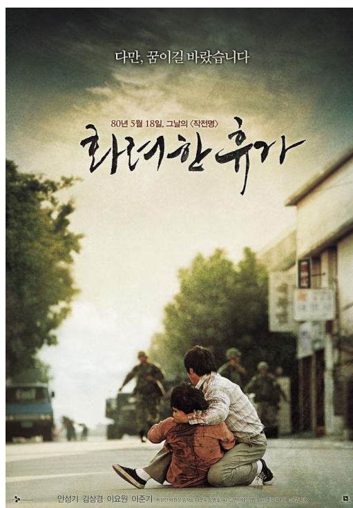
ภาพที่ 4 : โปสเตอร์หนังเรื่อง May 18

May 18 เป็นภาพยนตร์สะท้อนประวัติศาสตร์ของประเทศเกาหลีใต้ มีชื่อเรื่องเป็นภาษาเกาหลีว่า “화려한 휴가” แปลเป็นภาษาไทยว่า วันหยุดพักผ่อนแสนวิเศษ ซึ่งเป็นชื่อของกองกำลังปราบปรามเฉพาะกิจที่ถูกส่งให้ไปจัดการกับผู้ชุมนุมประท้วงต่อต้านรัฐบาลในเหตุการณ์สังหารหมู่ที่ 광주 จริง ๆ หรือที่ชื่อไทยเรียกว่า “18 พฤษภาคมอนาถชาติเกาหลี” โดยชื่อเรื่องมีที่มาจากวันและเดือนจากเหตุการณ์ที่เกิดขึ้นจริงในวันที่ 18 พฤษภาคม ปี ค.ศ. 1980