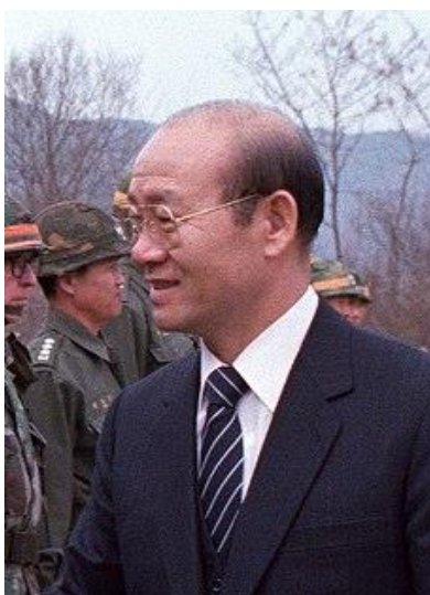
ภาพที่ 3 : ชอน ดูฮวาน

แต่ถึงแม้รัฐบาลของประธานาธิบดีชอน ดูฮวานจะใช้วิธีต่าง ๆ ในการปกปิดการรับรู้ของประชาชน และปราบปรามผู้เรียกร้องประชาธิปไตยเท่าใด ก็ไม่อาจรับมือกับการเรียกร้องที่เกิดขึ้นอย่างต่อเนื่องอย่างเข้มแข็งของประชาชนได้ และจากบาดแผลที่รัฐบาลใช้ความรุนแรงในการขัดขวางและเข้าสลายการชุมนุม จนทำให้มีผู้เสียชีวิตบาดเจ็บ และถูกจับกุมเป็นจำนวนมากนั้น ได้กลายเป็นการปลุกเร้าให้ประชาชนยิ่งออกมาชุมนุม จนกลายเป็นการชุมนุมใหญ่ทั่วประเทศในปี ค.ศ. 1987 (วิเชียร อินทะสี, 2556) จนสามารถจัดตั้งรัฐบาลพลเรือนที่มาจากเสียงของประชาชน และนำบรรดาบุคคลที่มีส่วนเกี่ยวข้องกับเหตุการณ์สังหารหมู่เข้าสู่กระบวนการพิจารณาคดีได้สำเร็จ (คิม ดอง วอน, 2015)