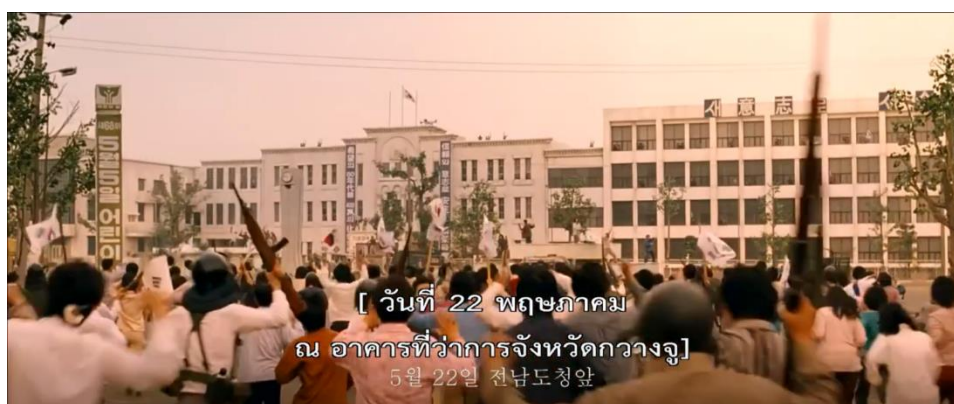
ภาพที่ 17 : กองกำลังพลเมือง ทำให้กองกำลังทหารถอนกำลังออกไปได้สำเร็จ

แต่ในขณะเดียวกันกองทัพก็สามารถปิดล้อมทั้งเมืองได้สำเร็จ โดยปิดทุกเส้นทางการเข้าออกของเมืองจู และหากมีใครพยายามใช้เส้นทางนั้นก็จะถูกทหารยิงใส่จากเนินเขาที่อยู่โดยรอบ กวางจูในขณะนี้จึงเหมือนถูกทิ้ง และถูกตัดขาดจากโลกภายนอกไปด้วยความจงใจ ทั้งที่ได้รับชัยชนะจากการเข้ายึดที่ทำการของทหารแล้วแท้ ๆ