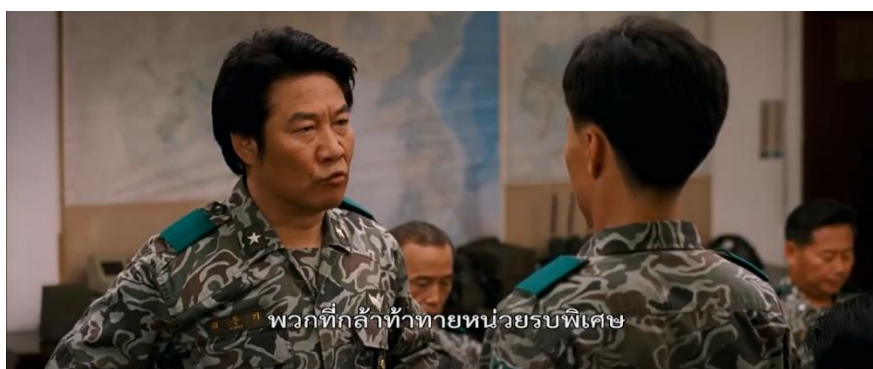
ภาพที่ 10 : ขณะที่นายทหารคนหนึ่งถูกต่อว่า

จากเหตุการณ์ในประวัติศาสตร์ข้างต้น จะเห็นได้ว่าเหล่าทหารยศสูง ๆ ไม่มีความปราณีหรือถอนกำลังออก ตามคำเรียกร้องของประชาชน และยังตัดสินใจส่งกองกำลังเสริมเข้ามาลงพื้นที่เพิ่มเพื่อปราบปรามผู้ชุมนุม ขณะเดียวกันเหตุการณ์ในภาพยนตร์ ได้สร้างตัวละครหนึ่งในหมู่ทหารที่แตกต่างออกไป คือ การเห็นต่างกับการ กระทำที่เกิดขึ้นของทหาร ที่รอยโทคม โดนตบหน้า จากหัวหน้าบัญชาการ ขณะรายงานความเป็นไปต่อการเข้า ควบคุมสถานการณ์ “ว่าการเข้าโจมตีโดยไม่สนใจว่าเป็นกบฏหรือประชาชนผู้บริสุทธิ์ ทำแบบนั้นแล้ว...” แสดงให้ เห็นว่า ยังมีทหารบางคนที่ไม่เห็นด้วยต่อการปราบปรามประชาชนอย่างไม่เลือกหน้า ซึ่งแตกต่างกับภาพใน ประวัติศาสตร์ที่ทหารทุกคนต่างทำตามคำสั่งและเข้าปราบปรามประชาชนด้วยความรุนแรงอย่างไร้มนุษยธรรม