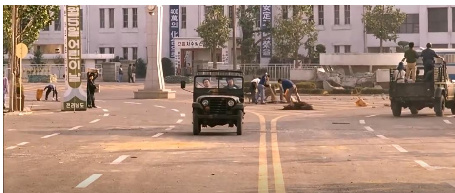
ภาพที่ 20 : การฟื้นฟูระเบียบบ้านเมือง

14. การฟื้นฟูระเบียบบ้านเมือง ภาพยนตร์ได้นำเสนอฉากที่พลเมืองชาวกวางจูต่างพากันออกมาทำความสะอาดพื้นที่รอบเมือง พร้อมกับมีรถพยาบาลคันหนึ่งออกมาประกาศขอรับบริจาคเลือด มีอาสาสมัครมากมายต่างช่วยกันทำกับข้าวแจกจ่ายผู้คนในเมือง โดยฉากที่ยกมานี้มีความคล้ายคลึงกับเหตุการณ์จริงที่เกิดขึ้นในประวัติศาสตร์ คือ ภายหลังจากเข้ายึดพื้นที่ของประชาชนกลับมาได้สำเร็จ เมืองกวางจูก็กลับคืนสู่สภาวะปกติได้ช่วงหนึ่ง โดยพ่อค้า แม่ค้าสามารถทำการเปิดร้านตามปกติได้อีกครั้ง และถึงแม้ทรัพยากรจะมีใช้อย่างจำกัดในช่วงนี้ แต่ด้วยสำนึกความเป็นอันหนึ่งอันเดียวกันของผู้คนในเมือง จึงทำให้ทรัพยากรต่าง ๆ มีใช้อย่างเพียงพอ ทั้งอาชญากรรมก็ยังมีอัตราที่ต่ำกว่าช่วงเวลาปกติมากที่สุด (The May 18 History Compilation Committee of Gwangju, 2015 : 107-108)