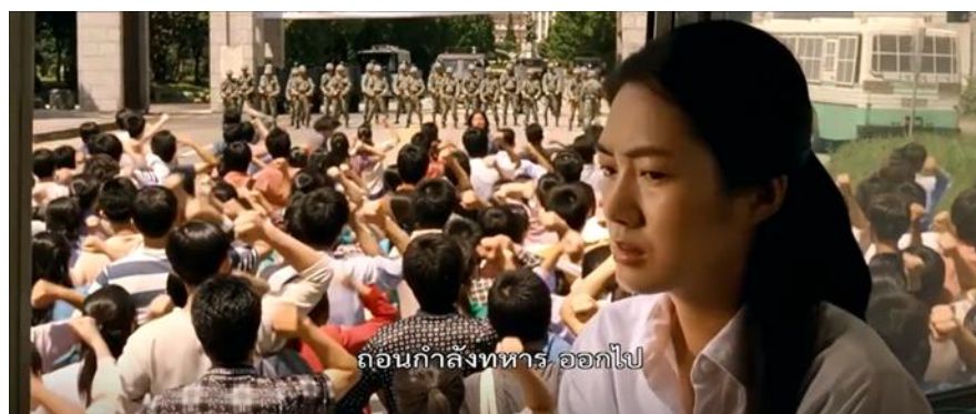
ภาพที่ 7 : วันแรกของการชุมนุมประท้วง

4. ทหารไล่จู่โจมประชาชนที่ออกมาเรียกร้อง ภาพยนตร์ได้นำเสนอฉากที่ทหารวิ่งจู่โจมเข้ามาทบตีประชาชนอย่างไม่เลือกหน้าในวันเดียวกันกับที่นักศึกษาออกมาชุมนุมประท้วงในวันที่ 18 พฤษภาคม หลังจากยืนประท้วงได้ไม่นาน โดยฉากที่ยกมามีความคล้ายคลึงกับเหตุการณ์จริงที่เกิดขึ้นในประวัติศาสตร์ คือ หน้าประตูใหญ่ของวิทยาลัยเซินนม มีกลุ่มนักศึกษามารวมตัวกันร้องเพลงและตะโกนคำขวัญ กลับทำให้ทหารไม่พอใจจากนั้นจึงส่งเสียงให้จู่โจมและมุ่งหน้าไปสู่ผู้ชุมนุม และไล่ทบตีนักศึกษาที่ไม่มีอาวุธและผลักดันให้ถอยออกไป (The May 18 History Compilation Committee of Gwangju, 2015 : 86)