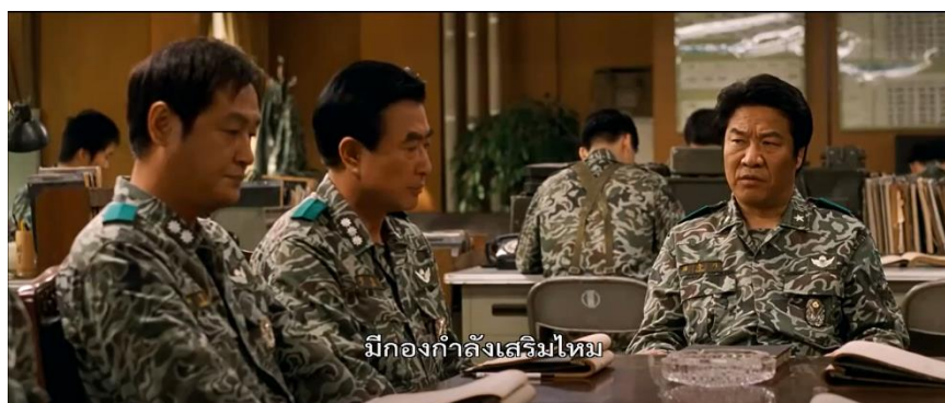
ภาพที่ 9 : การประชุมของกองทัพ

5. การประชุมของกองทัพ ภาพยนตร์ได้นำเสนอฉากการพูดคุยถึงเรื่องการเพิ่มกองกำลังเสริมลงมาที่เมือง กวางจู เพราะสถานการณ์ที่ถนนกินนัมไม่สู้ดีนัก โดยฉากที่ยกมานี้มีความคล้ายคลึงกับเหตุการณ์จริงที่เกิดขึ้นใน ประวัติศาสตร์ คือ หัวหน้ายุทธการของศูนย์บัญชาการกองทัพต้องการส่งกองพลน้อยหน่วยรบทหารพิเศษที่ 3 ไป เสริม เพราะมีตัวชี้วัดว่าสถานการณ์ในกวางจูอาจเลวร้ายลง (The May 18 History Compilation Committee of Gwangju, 2015 : 88)