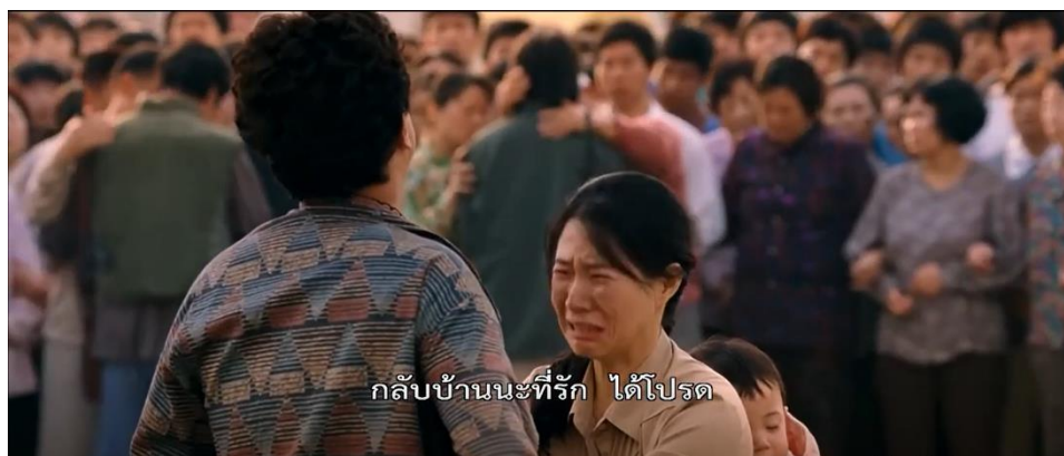
ภาพที่ 21 : กองกำลังทหารกำลังเคลื่อนพลบุกอาคารที่ว่าการจังหวัดกวังจู

ในคืนนั้น เมื่อรู้ว่ากองกำลังทหารกำลังจะเดินทางมาถึงจากข้อมูลในประวัติศาสตร์ คนจำนวนมากจึงหลบออกจากศาลากลางจังหวัด แต่ผู้นำของฝ่ายพลเรือนก็ไม่ได้พยายามยับยั้งพวกเขาแต่อย่างใด เพราะได้ประกาศไปแล้วว่า ขอให้ผู้ที่พร้อมจะสู้เท่านั้นอยู่ต่อ แต่ก็มีคนจำนวนหนึ่งเดินทางมาที่ศาลากลางจังหวัดเพื่อมาสมทบกับฝ่ายพลเรือน ซึ่งก็มีทั้งคนที่ได้รับการฝึกอาวุธ และเด็กมัธยมศึกษา ที่ไม่ผ่านการฝึกทหาร รวมทั้งผู้หญิงอีก 10 คน (The May 18 History Compilation Committee of Gwangju, 2015 : 109)