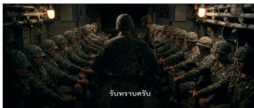
ภาพที่ 5 : สั่งการ

1. สั่งการ ภาพยนตร์ได้นำเสนอฉากกองกำลังทหารที่ได้รับคำสั่งให้ไปปราบปรามพวกคอมมิวนิสต์ โดยที่กองกำลังทหารเหล่านั้นไม่รู้ด้วยซ้ำว่ากำลังจะลงไปปฏิบัติภารกิจที่ไหน เพราะผู้บังคับบัญชาบอกเพียงว่า สถานที่ที่เป็นความลับสุดยอด จะทราบได้เมื่อไปถึง โดยฉากที่ยกมานี้มีความคล้ายคลึงกับเหตุการณ์จริงที่เกิดขึ้นในประวัติศาสตร์ คือ เรื่องความเคลื่อนไหวของหน่วยซุงจุงในวันที่ 17 พฤษภาคม ที่ได้รับคำสั่งให้กองทัพเคลื่อนกำลังพล ซึ่งเป็นแผนการขั้นที่สองและขั้นสุดท้ายในการทำรัฐประหารของกลุ่มอำนาจกองทัพใหม่ ภายหลังการถูกลอบสังหารของประธานาธิบดีปัก จองฮี (The May 18 History Compilation Committee of Gwangju, 2015 : 81)