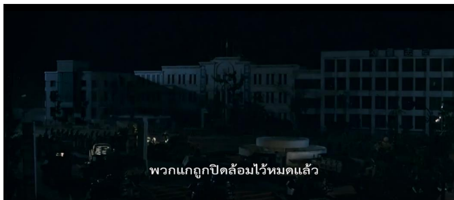
ภาพที่ 22 : การจู่โจมครั้งสุดท้ายของกองทัพทหาร

17. การกระจายเสียงไปทั่วเมืองถึงวีรกรรมของพี่น้องชาวกวางจู ภาพยนตร์ได้นำเสนอฉากเมื่อพักชินเอได้ทราบข่าวทุกคนถูกทหารสังหารตายหมดแล้ว เธอจึงได้ประกาศคำร้องขอต่อพี่น้องชาวกวางจูทุกคนขณะที่รถขับไปรอบเมืองว่า “พี่น้องกวางจู ได้โปรดอย่าลืมพวกเรา โปรดจดจำพวกเราไว้” โดยฉากที่ยกมานี้มีความคล้ายคลึงกับเหตุการณ์จริงที่เกิดขึ้นในประวัติศาสตร์ คือ พัก ยิง ซุน (Park Yeong Soon) หนึ่งในผู้ชุมนุมสตรีท่านหนึ่งที่ได้ร่วมอยู่ในวันสุดท้ายของเหตุการณ์สังหารหมู่ในกวางจู ก็ได้ประกาศข่าวเป็นครั้งสุดท้ายในห้องกระจายเสียง ซึ่งดังกังวานไปทั่วเมืองกวางจู โดยมีใจความว่า “เพื่อนพลเมืองของเรา ขณะนี้กองทัพได้เข้ามาเมืองมาแล้ว พี่น้องชายหญิงที่รักยิ่งของพวกเรา กำลังจะถูกสังหารด้วยปืนและดาบปลายปืน เราจะสู้กับกองทัพจนคนสุดท้าย จงร่วมต่อสู้จนถึงที่สุด พวกเราจะปกป้องกวางจูจนถึงวาระสุดท้าย กรุณาระลึกถึงพวกเราด้วย...!” ซึ่งเป็นคำร้องขอที่ประชาชนชาวเมืองกวางจูในเวลานั้นยังคงจดจำได้ (The May 18 History Compilation Committee of Gwangju, 2015 : 113)