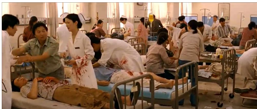
ภาพที่ 13 : ผู้บาดเจ็บจำนวนมากเต็มโรงพยาบาล

8. ย้ำเตือนการกระทำ ภาพยนตร์ได้นำเสนอฉากที่พัคฮึงซู ขึ้นมาเจรจากับนายพลชเวซึงกิ ถึงเรื่องการกระทำที่เข้าสลายการชุมนุมด้วยความรุนแรงขนาดนี้ว่าตั้งใจจะฆ่าล้างผ่านพลเมืองชาวกวางจูหรืออย่างไร ฉากนี้ถึงแม้ว่าจะไม่ได้ปรากฏอยู่ในประวัติศาสตร์จริง ๆ แต่ผู้สร้างภาพยนตร์ได้สร้างฉากนี้ผ่านคำพูดของพัคฮึงซูที่พูดกับนายพลชเวซึงกิว่า “รู้ไหมอะไรที่มีพลังมากกว่าปืน ประชาชนไงล่ะ” ซึ่งเป็นประโยคที่สามารถสื่อสารและให้ความรู้สึกกินใจกับผู้ที่ได้รับชมเป็นอย่างดี