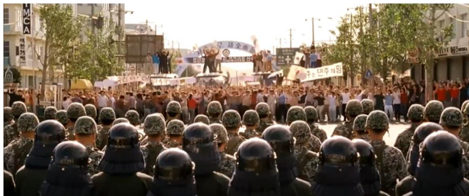
ภาพที่ 15 : การประจันหน้ากันระหว่างฝ่ายประชาชนกับฝ่ายทหาร

ผู้เสียชีวิตที่กลาดเกลื่อนเต็มถนน (The May 18 History Compilation Committee of Gwangju, 2015 : 99) สถานการณ์ซึ่งตอนแรกก็ดูจะเลวร้ายมากอยู่แล้ว แต่การชุมนุมสังหารพลเมืองในครั้งนี้กลับเลวร้ายและสร้างความตื่นตระหนกตกใจให้กับประชาชนถึงขีดสุด