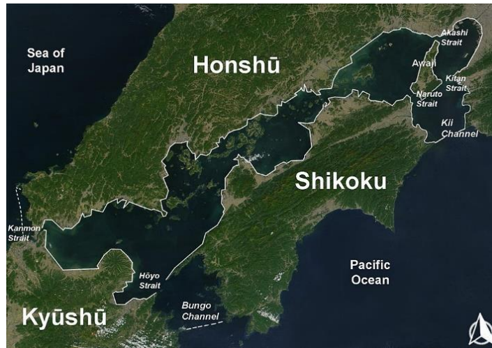
ภาพทะเลเซโตะใน