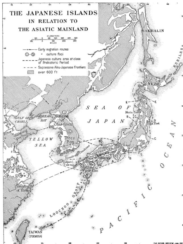
ภาพแผนที่ญี่ปุ่นในสมัยก่อน

มีเส้นที่แสดงให้เห็นทางการอพยพเข้ามาของเกาหลี จีน และชาวไอนุ