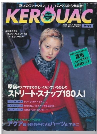
ภาพที่ 6 นิตยสาร Kerouac