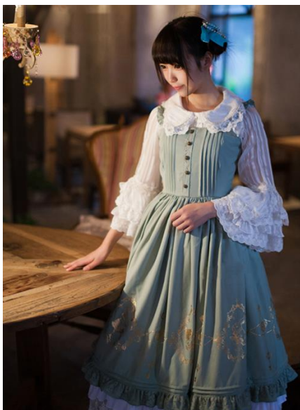
ภาพที่ 9 Alice in Wonderland Series JSK Classic Lolita Sling Dress