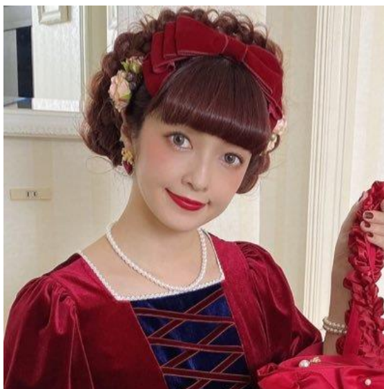
ภาพที่ 12 Misako Aoki

ด้วยรูปแบบของแฟชั่นโลลิต้าที่ผสมผสานกันอย่างลงตัวระหว่างศิลปะแบบยุโรปกับวัฒนธรรมสาวน้อยและควาวอี้ที่เป็นค่านิยมแบบญี่ปุ่น สะท้อนให้เห็นความนิยมตะวันตกของชาวญี่ปุ่นอันเป็นผลมาจากวาทกรรมการพัฒนา (Modernization) ที่สหรัฐอเมริกาใช้เป็นเครื่องมือครอบงำประเทศต่าง ๆ รวมถึงญี่ปุ่นในช่วงสงครามเย็น (Cold War ค.ศ. 1945-1991) จุดนี้จึงเป็นจุดแข็งที่ทำให้ชาวต่างชาติยอมรับได้อย่างง่ายดาย ทำให้สังคมของผู้สวมใส่ชุดโลลิต้าทั่วโลกขยายใหญ่มากขึ้น ธุรกิจแฟชั่นในประเทศญี่ปุ่นจึงเติบโตมากขึ้น ห้างเสื้อไม่ว่าจะขนาดเล็กหรือใหญ่ก็หันมาจัดทำเว็บไซต์เป็นภาษาอังกฤษเพื่อรองรับลูกค้าชาวต่างชาติ