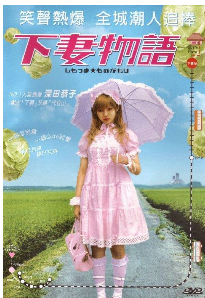
ภาพที่ 7 ปกดีวีดีของภาพยนตร์เรื่อง Shimotsuma Monogatari