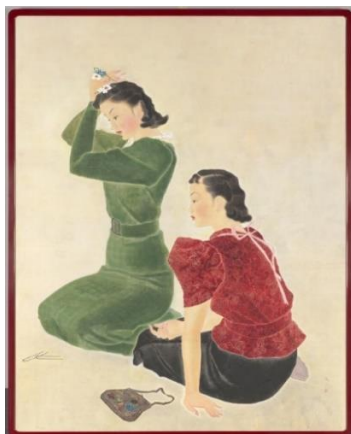
ภาพที่ 1 Modern girls