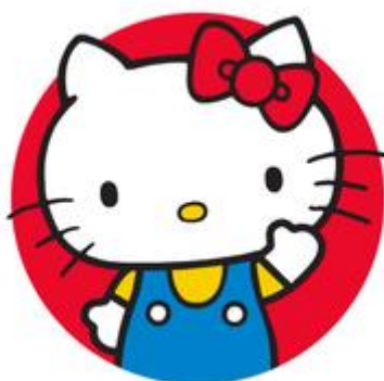
ภาพที่ 2 Hello Kitty

ต่อมา หลังสงครามโลกครั้งที่ 2 เป็นช่วงที่สังคมกลับมาสงบสุข ผู้คนผ่อนคลายความตึงเครียด และมีค่านิยมมีลูกเยอะ เพราะพวกเขา ๆ จะเป็นกำลังสำคัญสำคัญในการฟื้นฟูเศรษฐกิจ ญี่ปุ่นพยายามฟื้นฟูเศรษฐกิจอย่างแข็งขันจนเศรษฐกิจภายในประเทศเติบโตขึ้นอย่างรวดเร็วในค.ศ. 1951-1973 ช่วงเวลานี้เป็นช่วงเวลาของบริษัทต่าง ๆ ทำการตลาดโดยเน้นกลุ่มเป้าหมายคือกลุ่มวัยรุ่นที่เกิด ค.ศ. 1947-1949 ซึ่งเป็นเด็กที่เกิดในช่วงแรกของยุค Baby Boom วัฒนธรรมย่อยใหม่ ๆ จึงเกิดขึ้น เช่น วัฒนธรรม ‘คาวาอี้’ (Kawaii : 可愛い) แปลว่า ‘น่ารัก’ ในภาษาญี่ปุ่น ซึ่งเป็นวัฒนธรรมที่ให้ความสำคัญกับสุนทรียะที่ประกอบไปด้วยความไร้เดียงสาแบบเด็กและความเรียบริ้วอ่อนหวาน นิยามของคำว่า “สาวน้อย” จึงถูกนำมาตีความให้เข้ากับบริบทสังคมใหม่และวัฒนธรรมคาวาอี้ เห็นได้จากตัวละครชื่อดังจากบริษัท Sanrio อย่าง Hello Kitty ที่เป็นเสมือนตัวแทนของวัฒนธรรมนี้