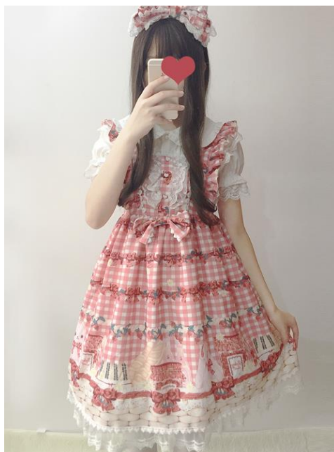
ภาพที่ 11 Plaid Strawberry Picnic Rabbit Series Sweet Lolita Sling Dress