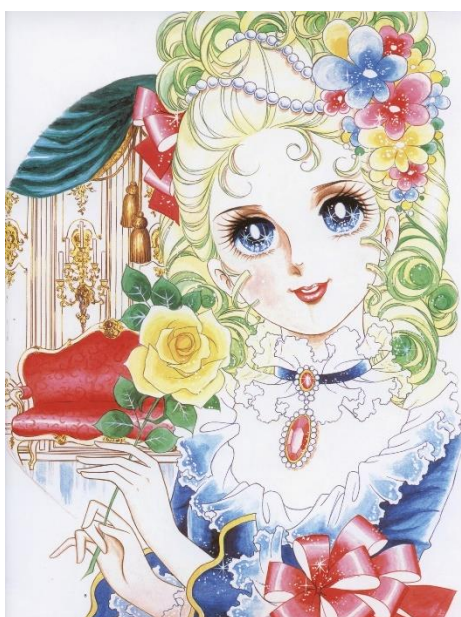
ภาพที่ 3 Rose of Versailles: Marie Antoinette

วัฒนธรรมคาวอี้เริ่มได้รับความนิยมในช่วงต้นทศวรรษ 1970 ซึ่งเป็นช่วงเวลาเดียวกับยุครุ่งเรืองของการตุ๊กตญี่ปุ่น การตุ๊กตญี่ปุ่นประเภทโซโจหรือการตุ๊กตาสาวน้อยเองก็ได้รับความนิยมมากในกลุ่มเด็กผู้หญิง เช่น การตุ๊กต “Rose of Versailles” (berusaiyu no bara) เป็นเรื่องราวที่ได้รับแรงบันดาลใจมาจากประวัติศาสตร์ฝรั่งเศสก่อนและหลังการปฏิวัติฝรั่งเศส ค.ศ.1789 ซึ่งการตุ๊กตเรื่องนี้จุดประกายความคลั่งไคล้ของเด็กสาวในทศวรรษ 1970 ต่อสิ่งใดก็ตามที่เกี่ยวข้องกับหนังสือการ์ตูนหรือฝรั่งเศส เนื่องจากมีสุนทรียะของวัฒนธรรมสาวน้อยคือ เครื่องแต่งกายสง่างาม ความช่างฝันของตัวละครและดวงตากลมโต