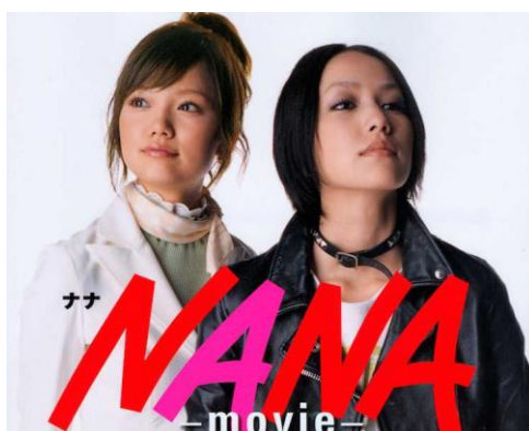
ภาพที่ 8 ภาพยนตร์เรื่อง NANA

นอกจากนี้ ช่วงครึ่งหลังของทศวรรษนี้ การ์ตูนและภาพยนตร์ชื่อ NANA ทำให้กระแสความนิยมของ Lolipunk หรือการผสมผสานระหว่างแฟชั่นโลลิต้ากับแฟชั่นพังค์แพร่หลายมากขึ้นอีก โดยการเลียนแบบตัวละครหลักที่ชื่นชอบในแบรนด์สัญชาติอังกฤษ Vivienne Westwood ซึ่งเป็นแบรนด์ที่รู้จักกันดีในกลุ่มแฟชั่นที่สะท้อนกระแสพังค์และมีแนวคิดขบถสังคมเช่นเดียวกับแฟชั่นโลลิต้า ด้วยยุคโลกาภิวัตน์ อินเทอร์เน็ตทำให้เราสามารถเข้าถึงวัฒนธรรมญี่ปุ่นได้ง่ายขึ้น ทั้งการ์ตูน เพลง ภาพยนตร์ รวมไปถึงแฟชั่นโลลิต้า จึงทำให้เกิดกลุ่มคนรักแฟชั่นโลลิต้าทั่วโลก