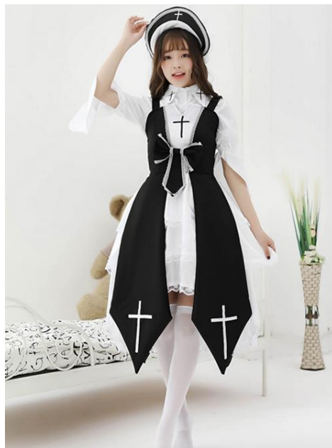
ภาพที่ 10 Cross Witch Gothic Lolita Black Or Red Dress And Shirt And Hat Set (ที่มา : Lolitian, 2022)