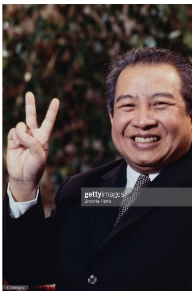
ภาพที่ 4 เจ้านโรดม สีหนุ

การดำเนินนโยบายความเป็นกลางของพระองค์ เนื่องมาจากกัมพูชาเป็นประเทศเล็กที่ตั้งอยู่ในจุดยุทธศาสตร์ที่มีความขัดแย้งสูง เป็นปัจจัยสำคัญที่ทำให้เจ้านโรดม สีหนุต้องเลือกดำเนินนโยบายให้กัมพูชาเป็นกลาง เพราะพระองค์ต้องการที่จะรักษาอธิปไตยของประเทศนี้ให้รอดพ้นจากการถูกคุกคามโดยต่างชาติ ทั้งที่เป็นประเทศเพื่อนบ้าน เช่น เวียดนามเหนือ เวียดนามใต้ และชาติมหาอำนาจอย่างสหรัฐอเมริกา อย่างไรก็ตาม การที่สงครามเวียดนามขยายตัวมากขึ้น ตั้งแต่ปี 1966 ได้ส่งผลกระทบต่อนโยบายของเจ้านโรดม สีหนุไปด้วย เพราะนโยบายนี้ถูกต่อต้านโดยสหรัฐอเมริกาอย่างหนัก ดังนั้นการรัฐประหารยึดอำนาจโดยคณะบุคคลที่มีนโยบายเป็นมิตรกับสหรัฐอเมริกาในปี 1970 จึงเป็นสิ่งที่หลีกเลี่ยงไม่ได้ (เพ็ญญา จันทรแดง, 2562 หน้า 58)