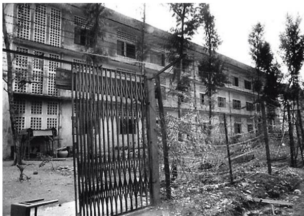
ภาพที่ 9 คุกโตลสเลง หรือ S-21