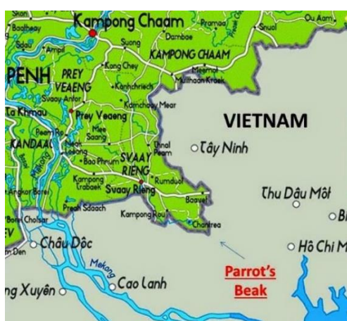
รูปที่ 10 แผนที่บริเวณปากนกแก้ว (Parrot's Beak)

ในขณะที่เดียวกันก็ใช้ป้องกันไม่ให้กัมพูชาใช้บริเวณนี้เพื่อแทรกซึมเข้าไปติดต่อกับชาวกัมพูชาในเวียดนามใต้ เนื่องจากเวียดนามเหนือกำลังสร้างเขตเศรษฐกิจใหม่ขึ้นในแถบสามเหลี่ยมปากแม่น้ำโขงและบริเวณใกล้เคียง เพื่อจัดระบบชุมชนแบบสังคมนิยมพร้อมทั้งให้การศึกษาทางการเมืองแก่ประชาชนทางเวียดนามใต้ ถ้ากัมพูชาแทรกซึมเข้าไปติดต่อกับชาวกัมพูชาได้ ก็อาจจะสร้างปัญหาให้แก่การสร้างระบบสังคมนิยมขึ้นได้ (เมธา พร้อมเทพ, 2523 หน้า145)