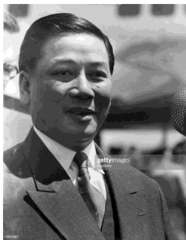
ภาพที่ 1 นายโงดinhเดียม (Ngo Dinh Diem)

การปกครองของโงดinhเดียมในเวียดนามใต้อาศัยการปกครองรวมศูนย์อำนาจไว้ที่ตนเองและสร้างเครือข่ายผ่านระบบอุปถัมภ์และเครือญาติทำให้ โงดinhนู (Ngo Dinh Nhu) น้องชายของเดียมและภรรยาของนู มาตามนุกกลายเป็นบุคคลสำคัญทางการเมืองของรัฐบาลที่จัดตั้งโดยเดียมในเวียดนามใต้ นูได้จัดตั้งองค์กรทางการเมืองชื่อ พรรคเก็นลาว (Can Lao) และจัดตั้งแนวร่วมแห่งชาติ (Nation Revolutionary Movement) เพื่อให้เป็นองค์กรที่ควบคุมการเมืองในเวียดนามใต้และตัวนูเองกลายเป็นผู้ควบคุมการเคลื่อนไหวทางการเมืองเวียดนามใต้ทั้งหมด(นิชฐนาถ นิลดี, 2555 หน้า113)