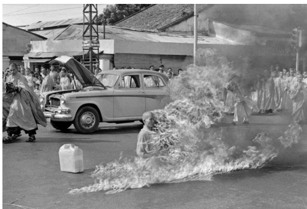
ภาพที่ 2 พระกวางดึกขณะกำลังจุดไฟเผาตัวเองเพื่อเรียกร้องความเป็นธรรมให้พระพุทศาสนาในเวียดนามใต้

เมื่อชาวพุทธถูกกดขี่หนักขึ้นได้รวมตัวกันลุกฮือทั่วเวียดนามใต้ในวันที่ 8 พฤษภาคม ค.ศ 1963 รัฐบาล เวียดนามใต้ใช้วิธีการปราบปรามประชาชนอย่างรุนแรงแต่ไม่สามารถยุติการลุกฮือของประชาชนได้ เหตุการณ์กลับ เลวร้ายมากขึ้นเมื่อพระกวางดึก (Quang Duc) ใช้น้ำมันรถและจุดไฟเผาตัวเองจนเสียชีวิตเมื่อวันที่ 11 มิถุนายน ค.ศ 1963 นอกจากนี้ยังได้จับกุมนักเรียน นักศึกษาที่เข้าร่วมประท้วงด้วย ซึ่งการกระทำของรัฐบาลดังกล่าวได้สร้าง ความไม่พอใจให้กับประชาชน นายทหารและข้าราชการทั่วไปจำนวนมาก (นิษฐานถ นิลดี, 2555 หน้า116)