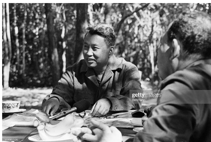
ภาพที่ 6 ซาลอตซาร์ (Saloth Sar) หรือ พอล พต (Pol Pot)

อำนาจภายใต้การบริหารงานของรัฐบาลกัมพูชาประชาธิปไตย (1975-1979) ไม่แตกต่างจากทัศนคติและการกระทำของรัฐบาลและผู้นำที่ผ่านมา (สุวัฒน์ ทาสุคนธ์, 2558 หน้า113)