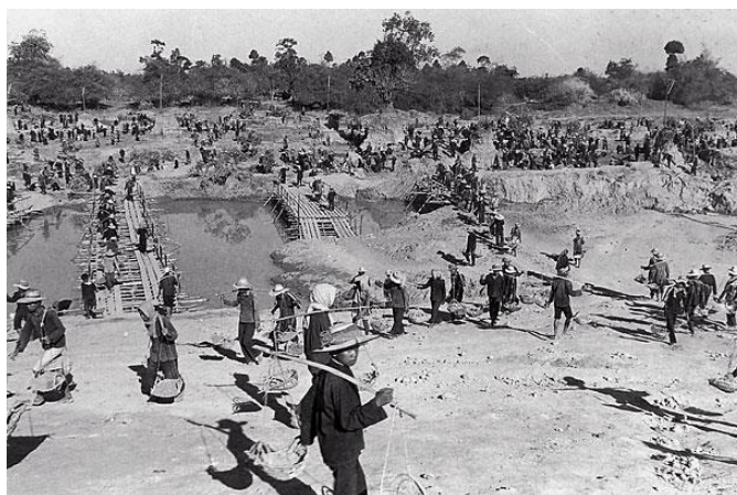
ภาพที่ 8 ภาพการทำงานรวมของประชาชนชาวกัมพูชา

จุดมุ่งหมายของการพัฒนาการเกษตรคือเพิ่มปริมาณผลผลิตข้าวตามคำขวัญที่มุ่งผลิตข้าวให้ ได้สามตันต่อหนึ่งเฮกตาร์ในระบบสหกรณ์ผลิตเพื่อการบริโภคภายในประเทศและเพื่อการส่งออกนารายได้กลับมา พัฒนาประเทศ โดยเริ่มการยึดที่ดินทั้งหมดให้เป็นของรัฐพร้อมจัดตั้งสหกรณ์รวมมวลชนทั้งประชาชนเก่าและ ประชาชนใหม่เพื่อเร่งเพิ่มผลผลิต ขยายพื้นที่เพาะปลูก สร้างระบบชลประทานขนาดใหญ่ซึ่งความสำเร็จเป็นเรื่อง ยาก เพราะกัมพูชาขณะนั้นขาดนักวิชาการเกษตรเครื่องจักร เมล็ดพันธุ์พืช ปุ๋ย ยาฆ่าแมลง ขณะที่ระบบชล ประธานล้มเหลว อีกทั้งพื้นที่การเกษตรได้ถูกทำลายเพราะสงคราม จากเครื่องบินทิ้งระเบิดและกัระเบิดที่ถูกฝัง ไว้จำนวนมากทั่วประเทศส่วนแรงงานจากประชาชนใหม่ จากเมืองก็ไม่มีควมคุ้นเคยกับการใช้ชีวิตในชนบทและไม่ มีความชำนาญในการทำการเกษตร ซึ่งการเกณฑ์แรงงานสู่ชนบทเป็นหนึ่งในเหตุผลที่ทำให้ประชาชนเสียชีวิตจำนวน มาก เช่นการสร้างเขื่อนด้วยมือเปล่า การส่งคนไปบุกเบิกพื้นที่ทุรกันดารที่ชุกชุมด้วยไข้มาเลเรีย เช่นในจังหวัด โปธิสัตว์ผนวกกับระบบสาธารณสุขไม่มีคุณภาพ ความล้มเหลวในการจัดการการเกษตร ถูกรัฐบาลเขมรแดงอ้างว่า เป็นเพราะศัตรูภายในของพรรคคอมมิวนิสต์ โดยเฉพาะจากกลุ่มเขมรแดงที่นิยมเรียคนามว่าเป็นผู้ขัดขวาง จึงต้อง นำนโยบายการกวาดล้างไล่ล่าศัตรูทางการเมืองในช่วงปี 1977-1978 นำไปสู่ข้อกล่าวหาในความผิดของการฆ่าล้าง เผ่าพันธุ์ชาวเขมรด้วยกัน(สุวัฒน์ ทาสุคนธ์, 2558 หน้า126)