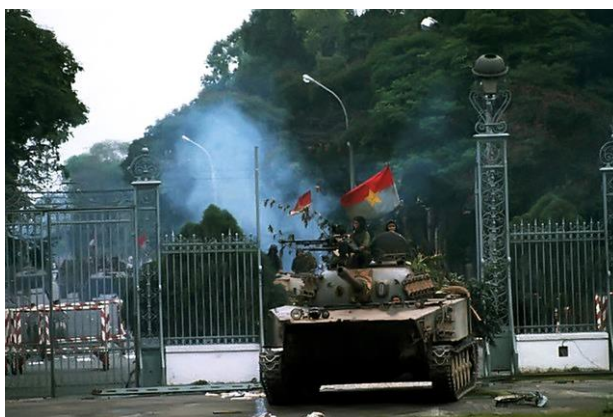
ภาพที่ 3 กองทัพเวียดนามเหนือบุกยึดกรุงไซ่ง่อนได้สำเร็จ

วันที่ 30 เมษายน ค.ศ 1975 เป็นวันที่เวียดนามสามารถขับไล่อิทธิพลของสหรัฐอเมริกาไปจากแผ่นดินของตนได้สำเร็จ สงครามที่ดำเนินยาวนานตั้งแต่ ค.ศ 1964 ปิดฉากลงด้วยชัยชนะของเวียดนาม และการรวประเทศก็ได้เกิดขึ้นเป็นผลสำเร็จ (สุนันทา สิงห์เทพ, 2547 หน้า 62)