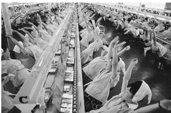
(ภาพจาก Flash back เป็นภาพพักเบรกของพนักงานหญิงจากอุตสาหกรรมอิเล็กทรอนิกส์ sony ใน ปี 1960)

ในช่วงหลังสงครามญี่ปุ่นให้ความสำคัญเกี่ยวกับอุตสาหกรรมมากขึ้นเนื่องจากการพ่ายแพ้ในสงครามโลกครั้งที่ 2 ทำให้ญี่ปุ่นรับรู้ว่าย้ายตนยังไม่สามารถเท่าทันเทคโนโลยีจากฝ่ายตะวันตกได้ญี่ปุ่นจึงต้องการลดความแตกต่างด้านอุตสาหกรรมเพื่อก้าวให้ทันฝ่ายตะวันตกและสามารถขึ้นเป็นมหาอำนาจเนื่องจากความต้องการดังกล่าวทำให้ญี่ปุ่นมุ่งเน้นลงทุนอุตสาหกรรมด้านพลังงานไฟฟ้า ถ่านหิน เหล็ก และ สารเคมี ในช่วงปี ค.ศ. 1950 ญี่ปุ่นสามารถกลับมาเท่าเทียมช่วงก่อนสงคราม ซึ่งถือว่าญี่ปุ่นสามารถฟื้นฟูเศรษฐกิจหลังจากการพ่ายแพ้สงครามโลกครั้งที่ 2 ได้อย่างรวดเร็ว ไม่ใช่เพียงเพราะการเข้ามาช่วยเหลือของสหรัฐอเมริกาเท่านั้น แต่สภาพสังคมและวัฒนธรรมของคนญี่ปุ่นแต่เดิมก็มีส่วนเพราะคนญี่ปุ่นเองมีความสามัคคี มีระเบียบวินัย ทั้งยังขยันขันแข็ง จึงส่งผลให้ญี่ปุ่นสามารถฟื้นตัวจากที่ได้ชื่อว่าเป็นประเทศแพ้สงครามได้กลับยืนจุดเดิมก่อนพ่ายแพ้ได้ในเวลาไม่กี่สิบปีหรือเรียกได้ว่าไม่เกินสองทศวรรษด้วยซ้ำ ไม่เพียงเท่านั้นญี่ปุ่นสามารถพัฒนาเศรษฐกิจของประเทศได้ก้าวหน้าขึ้นไปอีก ในปี ค.ศ. 1960 ญี่ปุ่นได้ก้าวเข้าสู่สังคมแบบทุนนิยมอย่างเต็มตัว โดยเฉพาะการลงทุนอุตสาหกรรมยานยนต์ เครื่องใช้ไฟฟ้า อิเล็กทรอนิกส์และปิโตรเคมีคัล ส่งผลต่อการเพิ่มสัดส่วนในการทำงานส่งผลให้ต้องเพิ่มกลุ่มแรงงานในอุตสาหกรรมต่างๆเช่นกัน