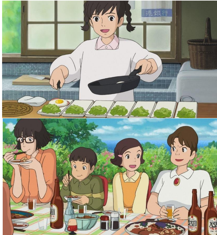
(ภาพที่12-13:ภาพฉากในแอนิเมชันที่แสดงถึงอิทธิพลตะวันตก)

ในด้านการเข้ามาของตะวันตกและส่งผลกระทบต่อวัฒนธรรมของญี่ปุ่นในเรื่องของการแต่งกายและอาหารที่เห็นได้จากแอนิเมชันนั้นสามารถเห็นได้จากการแต่งตัวที่ตัวละครนั้นมีการแต่งตัวของตะวันตกมากกว่าการแต่งกายด้วยชุดกิโมโนแบบญี่ปุ่น รวมถึงอาหารประกอบฉากที่มีการผสมผสานระหว่างวัฒนธรรมญี่ปุ่นกับตะวันตกอย่างกินไข่ดาวแสมกับซูปมิโสะในมือเข้ากันกินซูชิกับเบียร์ในฉากงานเลี้ยงล้วนเป็นการนำเสนอถึงการเข้ามาของวัฒนธรรมตะวันตกที่เห็นได้อย่างชัดเจน