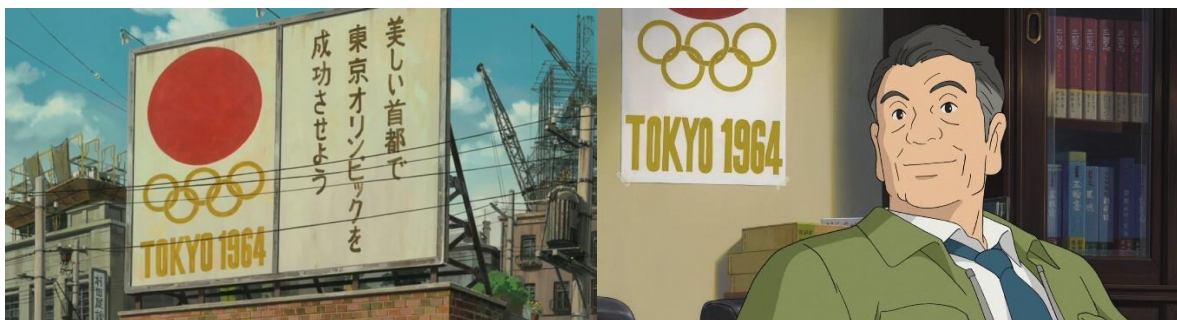
(ภาพที่14-15:ฉากในแอนิเมชันที่เกี่ยวกับโอลิมปิกปี1964)