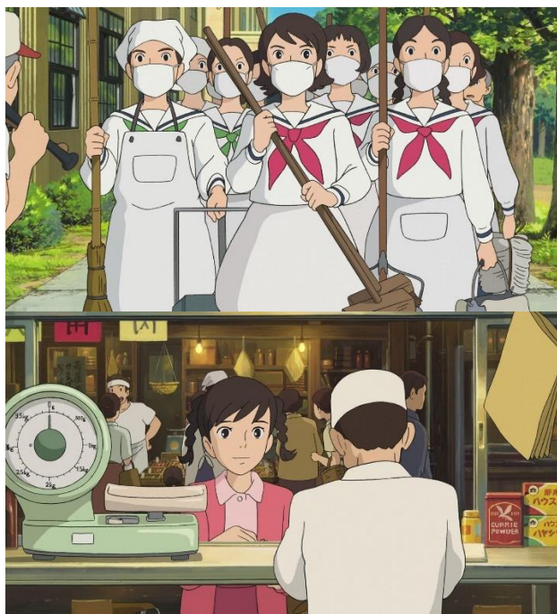
(ภาพที่7-8:ภาพฉากในแอนิเมชันที่สื่อถึงหน้าที่ของผู้หญิง)

จากตะวันตกในเรื่องของความเสมอภาค เปิดโอกาสให้ผู้หญิงมีความเสมอภาคเท่าเทียมกันกับผู้ชายและมีการออกกฎหมายที่เกี่ยวกับแรงงานสตรีขึ้นถึงอย่างนั้นแม้ว่าผู้หญิงจะเริ่มมีโอกาสและบทบาททางด้านการเมืองที่มีสิทธิเท่าเทียมกับผู้ชายแต่ด้วยค่านิยมแต่ดั้งเดิมของญี่ปุ่นเพศหญิงก็มีสิทธิมีเสียงน้อยกว่าผู้ชายอยู่ดี เห็นได้จากซีนในแอนิเมชันเรื่องนี้ที่มีแต่เพศชายเท่านั้นที่มารวมตัวแสดงความคิดเห็นว่าจะทุบหรือทำลายตึก Quartier Latin ที่มีส่วนสำคัญในเรื่องนี้เอง ทุกคนมาให้ความสำคัญกับสิทธิและเสียงของผู้หญิงในภายหลังโดยใช้การทำความสะอาดเป็นตัวเรียกคะแนนเสียงถึงแม้จะเป็นคำแนะนำของนางเอกเองแต่ก็ถือเป็นค่านิยมอย่างหนึ่งว่าการดูแลรักษาความสะอาดเป็นส่วนหนึ่งของผู้หญิง ในส่วนบทบาททางสังคมของผู้หญิงแม้ว่าตั้งแต่ช่วงภาวะขาดแรงงานจะเปิดโอกาสให้ผู้หญิงทำงานประจำมากขึ้นแต่เมื่อต้องแต่งงานมีลูกก็ต้องลาออกมาดูแลลูกและให้ผู้ชายเป็นฝ่ายทำงานเพื่อครอบครัวคนเดียวตามความเชื่อที่สืบทอดกันมา เห็นได้จากฉากสังสรรค์ในเรื่องที่ตัวละครเลี้ยงอ่าลากก็มีการพูดถึงให้ตัวละครแต่งงานและเปิดคลินิกในเมืองนี้แทนความก้าวหน้าหรือความเชื่อให้หาสามีที่ดีเพื่อเป็นภรรยาที่ดีในบทสนธนามากดังกล่าว