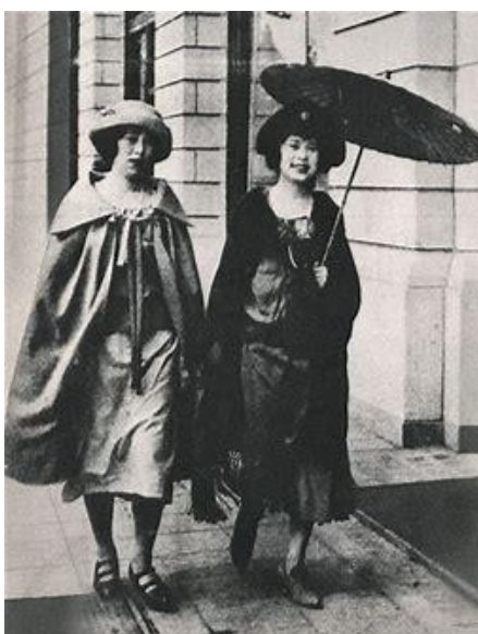
(ภาพที่11:การแต่งกายของญี่ปุ่นช่วงได้รับอิทธิพลจากตะวันตก)

ญี่ปุ่นในอดีตหากมองจากสายตานานาประเทศญี่ปุ่นเป็นชนชาติที่มีภาพลักษณ์เป็นกลุ่มแยกตัวออกจากชนชาติอื่นและมีความเป็นพวกพ้องอย่างมาก ด้วยปัจจัยหลายๆด้านรวมถึงการที่ญี่ปุ่นเปิดประเทศนั้นทำให้ได้รับอิทธิพลจากชนชาติตะวันตกที่เข้ามา ญี่ปุ่นได้เห็นถึงศักยภาพของประเทศมหาอำนาจและความต่างชั้นจึงรู้ว่าตัวเองในขณะนั้นล้าหลังมากขนาดไหน สิ่งที่ทำให้สภาพทางสังคมและวัฒนธรรมญี่ปุ่นเปลี่ยนแปลงไปคือการที่ญี่ปุ่นต้องไล่ตามชนชาติตะวันตกจึงเร่งพัฒนาตัวเองให้ทันจึงเกิดคำว่า “Westernization” หรือ “การเปลี่ยนให้เป็นตะวันตก” ขึ้นมาโดยญี่ปุ่นเริ่มเปลี่ยนแปลงจากรากฐานการศึกษา มีการเชิญอาจารย์และช่างฝีมือในด้านต่างๆกว่า3000คนมาสอนในUniversity of Tokyoและยังมีการจัดตั้งมหาวิทยาลัยอีกหลายแห่ง การที่ญี่ปุ่นเริ่มจ้างครูจากตะวันตกเข้ามาก็มาพร้อมกับอิทธิพลตะวันตก เช่น การแต่งกาย อาหาร เป็นต้น