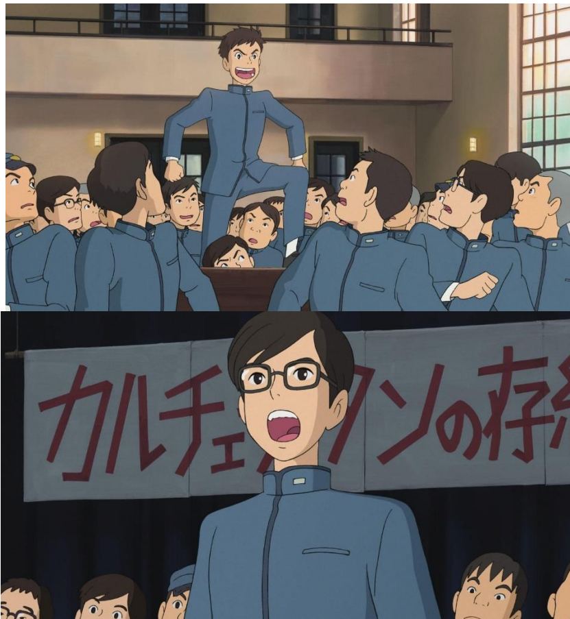
(ภาพในแอนิเมชันเรื่องปีปปี ฮิลล์ ร่ำร้องขอปาฏิหาริย์ ตอนที่กำลังประชุมเพื่อแสดงความคิดเห็น)

ส่วนในแอนิเมชันเองก็มีเหตุการณ์ที่พูดถึงการแสดงความคิดเห็นและออกมาเรียกร้องระหว่างสองฝ่าย โดยผ่านเนื้อหาความขัดแย้งระหว่างสองความคิดที่ต้องการเปลี่ยนแปลงใหม่กับพัฒนาสิ่งที่อยู่แต่เดิม