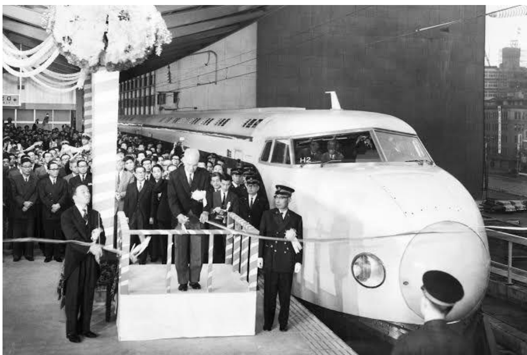
(ในพิธีเปิดบริการรถไฟชินคันเซ็นขบวนแรกในปีค.ศ1964)

โดยในปี1963มีประชากรในโตเกียวเพิ่มขึ้นถึง10ล้านคนและการเพิ่มขึ้นของประชากรทำให้โตเกียวเต็มไปด้วยมลภาวะและขยะ ขนาดที่ว่าญี่ปุ่นในสมัยนั้นการที่คนญี่ปุ่นทิ้งขยะไม่เป็นที่กลายเป็นภาพลักษณ์หนึ่งเลยที่เดียวสาเหตุดังกล่าวทำให้รัฐบาลต้องมาจัดการและลงงบประมาณเพื่อพัฒนาระบบสาธารณูปโภคและขนส่งมวลชนเพื่อรองรับการเข้ามาของนักท่องเที่ยวและนักกีฬาจากการจัดกีฬาโอลิมปิก โดยเริ่มจากรัฐออกนโยบาย “โอลิมปิกโตเกียวอันแสนสะอาด” และรณรงค์ให้ประชาชนร่วมกันถึงขยะให้ลงถัง หลังจากนั้นเพียงหนึ่งเดือนเมืองโตเกียวก็ไม่ใช่เมืองที่มีขยะล้นอีกต่อไป ส่วนด้านขนส่งมวลชนตั้งแต่ปีค.ศ1959รัฐบาลญี่ปุ่นได้อนุมัติโครงการรถไฟความเร็วสูง และในปีค.ศ1963นั่นเองที่ญี่ปุ่นประสบความสำเร็จสามารถสร้างรถไฟความเร็วสูงที่ตอนนั้นมีความเร็วกว่า 257กม./ชม.ซึ่งถือว่าเป็นการทำลายสถิติโลกส่งผลให้รัฐเริ่มสร้างโครงการรถไฟชินคันเซนสายโทโคโดเชื่อมระหว่างโตเกียวกับโอซากาที่เปิดตัวก่อนพิธีเปิดโอลิมปิกในปีค.ศ1964เพียง9วันเท่านั้น ทั้งยังทุ่มงบประมาณกว่า282ล้านดอลลาร์เพื่อสร้างสนามกีฬา หมู่บ้านนักกีฬา ทั้งสนามบิโนฮานะตะที่ถูกปรับแต่งให้ทันสมัย การพัฒนาทั้งในด้านต่างๆที่กล่าวมานี้แสดงให้เห็นถึงศักยภาพเศรษฐกิจและพัฒนาเทคโนโลยีของประเทศญี่ปุ่นผ่านการจัดงานกีฬาโอลิมปิกได้อย่างชัดเจน