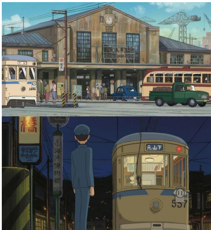
(ภาพ9-10: ฉากในแอนิเมชันที่แสดงให้เห็นถึงการคมนาคมในญี่ปุ่น)

ในด้านเศรษฐกิจและด้านคมนาคมจากที่เห็นในแอนิเมชันนั้นสอดแทรกอยู่ในหลายๆฉากถึงญี่ปุ่นกำลังเปลี่ยนแปลงและพัฒนา ทั้งการใช้ทรัพยากรณะสภาพเมืองที่กำลังเปลี่ยนแปลงแล้วอยู่ในช่วงก่อสร้างต่อเติมตามนโยบายของรัฐและเอกชนเพื่อเป็นการช่วยยกระดับญี่ปุ่นที่กำลังพัฒนาเพื่อรองรับการมาของชาวต่างชาติ ในการแข่งขันโอลิมปิกที่จะถูกจัดขึ้นในปีถัดมาจะสามารถเห็นได้ชัดเจนที่ตัวเอกเดินทางมาโตเกียวจะเห็นอุตสาหกรรมต่างๆที่กำลังพัฒนา มีการก่อสร้างต่อเติมมาตลอดทาง ทั้งการแออัดของผู้คนที่รวมตัวมาทำงานที่เมืองหลวงรวมถึงการคมนาคมที่กำลังสร้างในหลายชิ้นที่ได้เห็นจากที่ตัวเองเดินทางมาหาบริษัทที่โตเกียวซึ่งเห็นได้ถึงความเปลี่ยนแปลงที่ชัดเจน และที่สำคัญการทุบตี Quartier Latin ก็แสดงให้เห็นถึงการเปลี่ยนแปลงที่ชัดเจนที่รัฐและเอกชนต้องการเปลี่ยนสิ่งเดิมที่มีอยู่แล้วให้เป็นสิ่งใหม่ที่ดีขึ้นซึ่งก็อาจจะเป็นส่วนหนึ่งในนโยบายที่วางแผนเอาไว้ แม้สุดท้ายเพราะเหล่าตัวเอกในเรื่องนั้นปรับปรุงซ่อมแซมตึกให้มีภาพลักษณ์ที่ดีและเต็มไปด้วยความทรงจำทำให้สุดท้ายตึกโมโตริอูทิงก็ตาม ความเปลี่ยนแปลงที่เกิดเหล่านี้ก็เป็นรากฐานสำคัญสำหรับการพัฒนาเศรษฐกิจในอุตสาหกรรมหนักจนญี่ปุ่นกลายเป็นประเทศมหาอำนาจและการคมนาคมที่สะดวกสบายในญี่ปุ่นปัจจุบันเช่นกัน