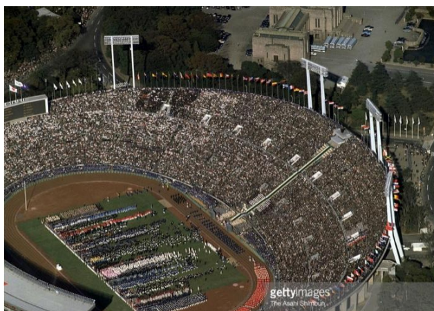
(รูปภาพสนามกีฬาแห่งชาติในช่วงพิธีเปิดโอลิมปิกปี1964)

กีฬาโอลิมปิกเกมส์เป็นการแข่งขันระหว่างประเทศที่มีทั้งฤดูร้อนและฤดูหนาวจัดขึ้นทุกๆ4ปีซึ่งรวบรวมนักกีฬาที่มีความสามารถหลายพันคนเข้าร่วมแข่งขันในกีฬาหลายประเภท ซึ่งกีฬาโอลิมปิกในปี1964ที่ถูกจัดโดยประเทศญี่ปุ่นเป็นครั้งแรก โดยการจัดโอลิมปิกในครั้งนี้สร้างความเปลี่ยนแปลงครั้งยิ่งใหญ่ให้กับญี่ปุ่นประเทศที่มีภาพลักษณ์อยู่ในสภาวะแพ้สงครามในขณะนั้น การที่ญี่ปุ่นได้รับมอบหมายในการจัดพิธีเปิดโอลิมปิกในครั้งนี้ถือว่าเป็นโอกาสครั้งยิ่งใหญ่จนสำนักข่าวJapan Timesรายงานข่าวที่ญี่ปุ่นสามารถเป็นประเทศที่ได้รับเลือกให้จัดโอลิมปิกว่า “คลื่นแห่งความยินดีของชาติส่งตรงมาจากมิวนิคว่าโตเกียวได้เป็นเจ้าภาพจัดโอลิมปิก 1964 เหยี่ยุ่ท่าแห่งสัญลักษณ์ของโอลิมปิกในที่สุดก็ได้เติมเต็มสมบูรณ์ในที่สุดโอลิมปิกเกมส์ก็มาถึงเอเชียเสียที” เพื่อแสดงให้เห็นถึงความสำคัญที่ญี่ปุ่นได้จัดโอลิมปิกในปี1964นั้นเป็นครั้งแรกของทวีปเอเชียซึ่งเป็นโอกาสพลิกโฉมประเทศกลายเป็นหนึ่งในประเทศที่มีอำนาจต่อรองหรือมหาอำนาจหนึ่งของโลกในปัจจุบัน