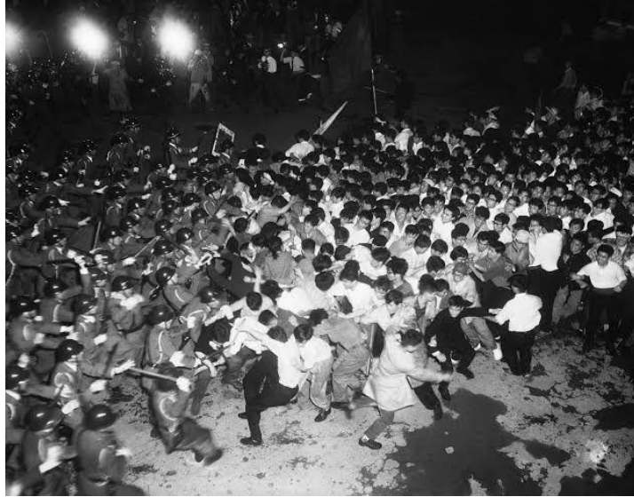
(ภาพการปะทะกันของนักศึกษาและหน่วยปราบจลาจล)

ส่วนในแอนิเมชันเองก็มีเหตุการณ์ที่พูดถึงการแสดงความคิดเห็นและออกมาเรียกร้องระหว่างสองฝ่าย โดยผ่านเนื้อหาความขัดแย้งระหว่างสองความคิดที่ต้องการเปลี่ยนแปลงใหม่กับพัฒนาสิ่งที่อยู่แต่เดิม