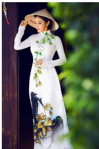
รูปที่ 72 ชุดอ่าวหญ่ยแบบดั้งเดิม