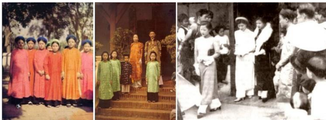
Áo dài 1915 : H1: đồng phục đánh cờ người, H2: một gia đình quan lại H3: một đám cưới vào năm 1936

รูปที่ 38 ชุดอ่าวหญ่ายในช่วงปี ค.ศ. 1915 ลวดลายหลากรุ้ก , ครอบคร้วชาวจีน , งานแต่งงานในปี ค.ศ. 1936