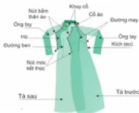
Hình mẫu một kiểu áo dài