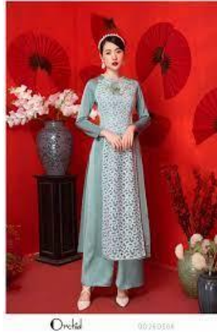
รูปที่ 75 ชุดอ่าวหญ่ายผ้าไหม