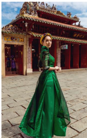
รูปที่ 85 ชุดอ่าวหญ่ายที่เหมาะสมกับสถานที่และได้ตัดเย็บอย่างสวยงาม