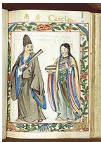
รูปที่ 6 ชุมนางเวียดนามและภรรยาจาก Quảng Nam ในปี ค.ศ. 1595