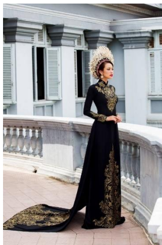
รูปที่ 55 ชุดอ้าหญ่ายสีด้า (2)