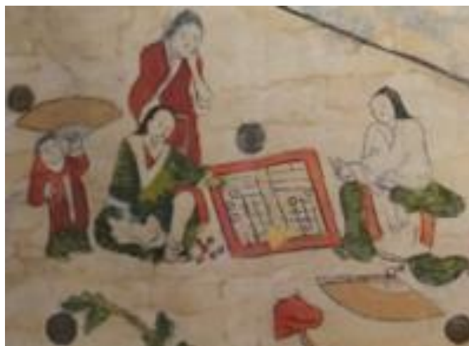
รูปที่ 13 "Giảng học đồ" (講學圖 - การเรียนการสอน): Đàng Ngoài ในศตวรรษที่ 18 พิพิธภัณฑ ประวัติศาสตร์แห่งชาติฮานอย ที่มา : sawadee , 2565