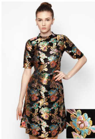
รูปที่ 83 การเลือกผ้าที่เหมาะสมนั้นเป็นสิ่งสำคัญในการตัดเย็บชุดอ่าวหญ่ย