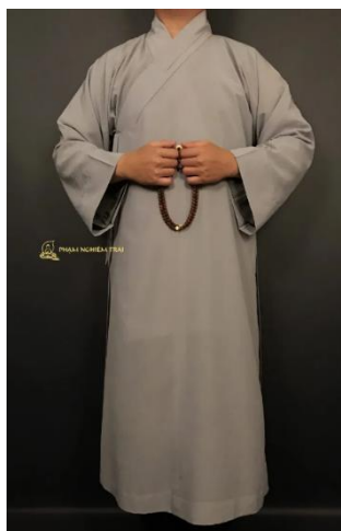
รูปที่ 31 ชุด Áo tràng Phật tử

Áo tràng Phật tử - โดยทั่วไปเรียกสั้น ๆ ว่า "áo tràng" เป็นเสื้อคลุมที่สวมใส่โดยUpāsaka และUpāsikā ในวัดพุทธของเวียดนาม