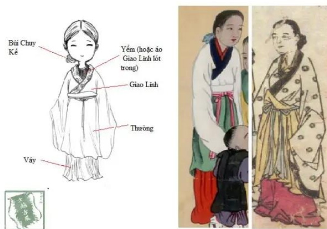
รูปที่ 25 ชุด Áo giao lĩnh

Áo giao lĩnh - เสื้อคลุมแบบไขว้เป็นที่นิยมในราชวงศ์ Lê และราชวงศ์ก่อนหน้านี