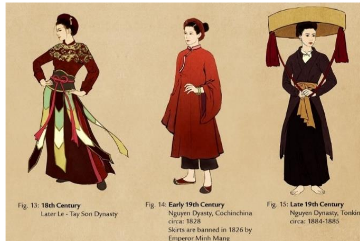
รูปที่ 67 พัฒนาการของชุดอ่าวหญ่าย ช่วง 18 – late 19th Century ที่มา : vietnameseprivatetours , 2022