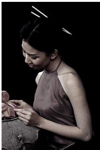
รูปที่ 27 Yếm

Áo gấm – เสื้อคลุมผ้าอย่างเป็นทางการสำหรับงานราชการหรือสำหรับผู้ชายในงานแต่งงาน