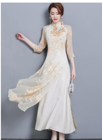
รูปที่ 77 ผ้าชีฟอง (1)