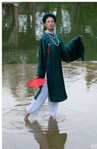
รูปที่ 36 ชุด Áo giao lãn