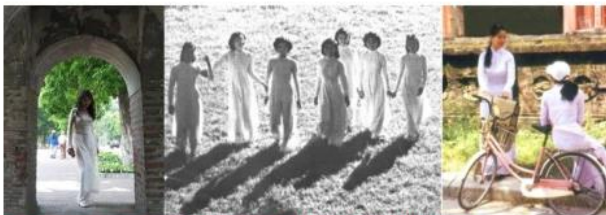
Nét đẹp dịu dàng, uyển chuyển của các cô nữ sinh trung học

เกือบถึงเช้าและมีรอยกรีดทั้งสองข้างตั้งแต่สะโพกลงมา ในช่วงทศวรรษที่ 1930 เมื่อเสื้อเซ็ทของผู้หญิงกับกระโปรงยาว 2 ตัวปรากฏขึ้น ได้มีการเปลี่ยนแปลงเล็กน้อยเพื่อให้ใกล้ชิดกับชุดอ่าวหญ่ายของผู้หญิงมากยิ่งขึ้น