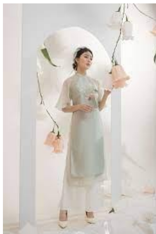
รูปที่ 73 ชุดอ่าวหญ่ายแบบสมัยใหม่