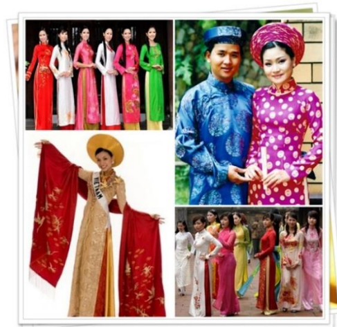
รูปที่ 76 ชุดอ่าวหญ่ายในแบบต่าง ๆ