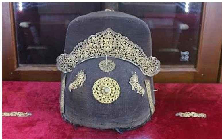
รูปที่ 20 หมวกPhốc Đầuในศตวรรษที่ 19 ประดับด้วยทอง Kim Bác Sơn