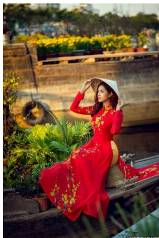
รูปที่ 53 ชุดอ่าวหญ่ายสีแดงนิยมใส่ไปงานเทศกาลเต็ด ที่มา : eightvisualwedding , 2565