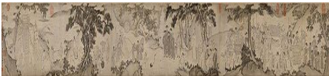
รูปที่ 2 พระมหาโพธิสัตว์ Trúc Lâm ออกมาจากภูเขา – ราชวงศ์ Trần