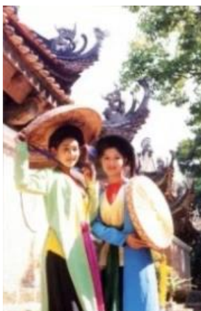
Áo dài tứ thân

รูปที่ 40 ชุดอ่าวหญ่ายแบบสี่ส่วนหรือสี่ชิ้น