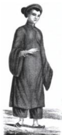
Một phụ nữ miền Nam với chiếc áo dài 1859

นักประวัติศาสตร์ Đào Duy Anh ได้เขียนเกี่ยวกับชุดอ่าวหญ่ายไว้ว่า “ตามหนังสือประวัติศาสตร์ชาว Văn Lang โบราณนั้น กล่าวว่า บรรพบุรุษของพวกเขาสวมชุดอ่าวหญ่ายดังรูปด้านล่างนี้