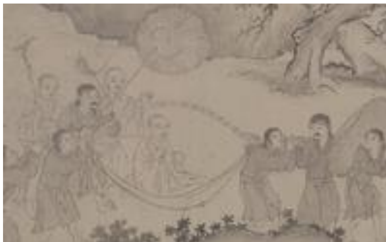
รูปที่ 4 เสื้อผ้าของราชวงศ์Trầnตามภาพใน “The Mahasarakham Truc Lâm Coming Out of the Mountains”