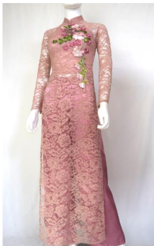
รูปที่ 81 ผ้าลูกไม้