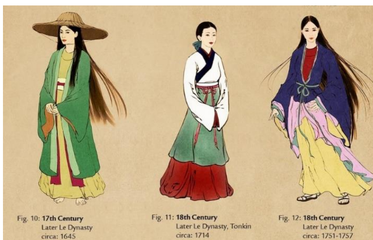
รูปที่ 66 พัฒนาของชุดอ่าวหญ่าย ช่วง 17 – 18th Century