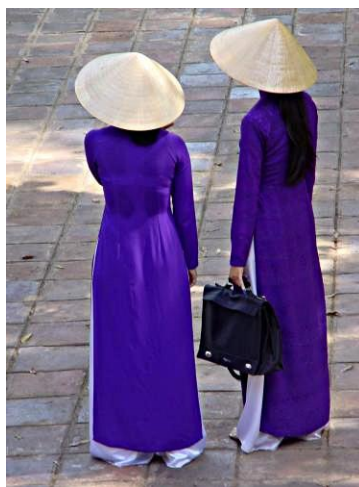
รูปที่ 88 ชุดอ่าวหญ่ายหญุงสีม่วงเข้มของผู้หญิงชาวเมืองเว้