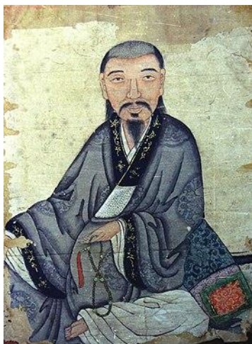
รูปที่ 10 ภาพเหมือนของเจ้าชายTôn Thất Hiệp (Nguyễn Phúc Thuần) แห่งĐàng Trongจากศตวรรษที่ 17 เขาสวมเสื้อคลุมแบบไขว้ ( áo giao lĩnh )