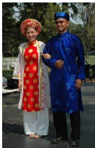
รูปที่ 59 ชุดอ่าวหญ่ายของชาวเวียดนาม