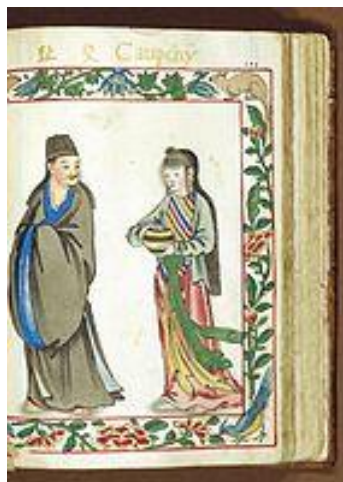
รูปที่ 7 ชุมนางเวียดนามและภรรยาจากท่าเรือ Hải Môn ในปี ค.ศ. 1595