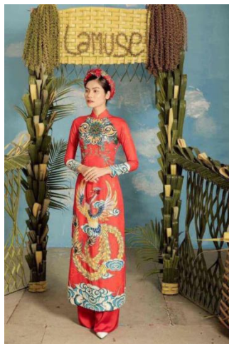
รูปที่ 80 ผ้าโบรเคด