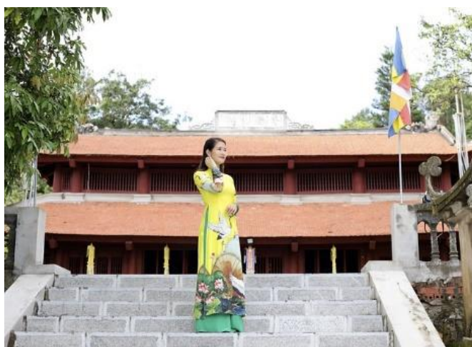
รูปที่ 58 การสวมใส่ชุดอ่าวหญ่ายในพิธีต่าง ๆ

นอกจากนี้ ผู้หญิงเวียดนามยังเลือกสีของชุดอ่าวหญ่ายตามธาตุที่นำมาจากปีเกิด คือ โลหะ ไม้ น้ำ ไฟ หรือ ดิน และในยุคปัจจุบันนี้ไม่ค่อยมีใครปฏิบัติตามและคนที่ต้องสวมใส่ชุดอ่าวหญ่ายเป็นประจำเนื่องจากต้องประกอบอาชีพ ซึ่งมักจะสวมใส่ชุดสีเดียวกับพนักงานคนอื่น ๆ ตัวอย่างเช่น พนักงานต้อนรับบนสายการบิน เวียดนามสวมใส่เสื้อคลุมสีเขียวพาสเทลและกางเกงขาวสีขาว โดยไม่คำนึงถึงอายุหรือสถานภาพการสมรส