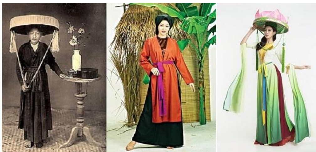
รูปที่ 26 ชุด Áo tứ thân

Áo tứ thân - ชุดเดรสผู้หญิง 4 ชั้น áo ngũ thânในรูปแบบ 5 ชั้น