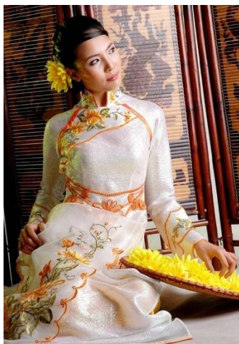
รูปที่ 86 ชุดอ่าวหญ่ยของผู้หญิงเมืองเว้

ตนเอง ดังนั้นการวัดตัวตัดเย็บชุดอ่าวหญ่ยของชาวเว้จะละเอียดมาก โดยเฉพาะส่วนเอวเพื่อตัดชุดให้เหมาะสมกับรูปร่างของแต่ละคน