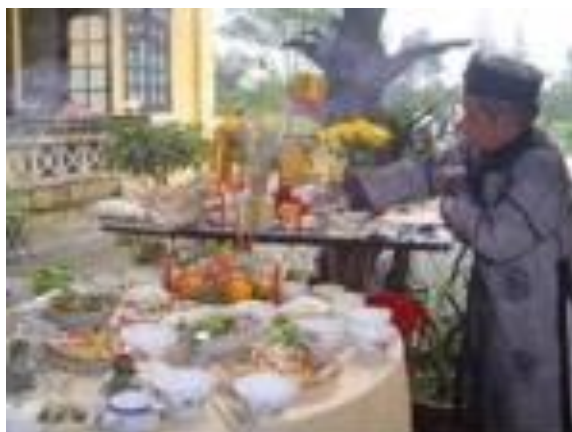
Ao dài nam giới

รูปที่ 44 การสวมใส่ชุดอ่าวหญ่ยของผู้ชายชาวเวียดนาม