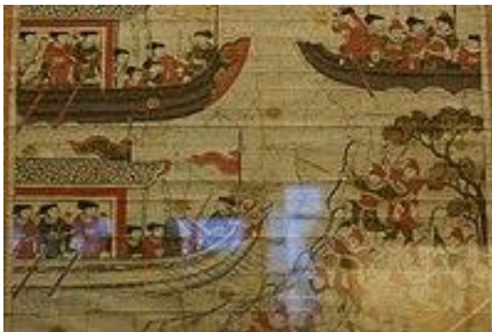
รูปที่ 12 Đàng Ngoi ในการฟื้นฟูภายหลังกษัตริย์ Lê Later : ผู้ชายสวมหมวก Đinh Tụ บนคีรีชะ