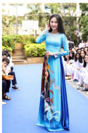
รูปที่ 62 ชุดอ่าวหญ่ายที่ผสมผสานนวัตกรรมที่ทันสมัย

ชุดอ่าวหญ่ายได้ถูกพัฒนาต่อมาตามนวัตกรรมใหม่ของยุคสมัย หากพูดถึงรูปแบบดั้งเดิมที่เป็นที่นิยมของคนหนุ่มสาว ซึ่งในนวัตกรรมใหม่ของชุดอ่าวหญ่ายได้ถูกเย็บให้กว้างขึ้นเล็กน้อย ไม่ได้โอบรัดรูปร่างกายแบบเดิม แต่ยังคงแสดงความงามของร่างกายผู้หญิงได้อย่างละเอียด เมื่อเวลาผ่านไปและเกิดการเปลี่ยนแปลง ชุดอ่าวหญ่ายจึงมีรูปแบบต่าง ๆ ด้วยนวัตกรรมที่แตกต่างกันมากมาย แต่ยังคงรักษาความงามที่ละเอียดอ่อนไว้ด้วย ภายใต้อะไหล่ของชุดอ่าวหญ่ายแบบดั้งเดิมและแบบสมัยใหม่ ชุดอ่าวหญ่ายมีการเปลี่ยนแปลงไปไม่มาก ซึ่งไม่เพียงแค่ว่าคอปกสูงเท่านั้น แต่ชุดอ่าวหญ่ายยังคงแบบคอปาด คอกลม ฯลฯ มิให้เลือกสรรมากขึ้นสำหรับผู้หญิง อีกทั้งวัสดุที่ใช้ทำชุดอ่าวหญ่ายส่วนใหญ่มักทำมาจากผ้ากำมะหยี่ แต่ในปัจจุบันนี้ ผ้าไหมได้นำมาทำชุดอ่าวหญ่ายได้รับความสนใจมากที่สุด เพราะมีความนุ่มและมีความยืดหยุ่นสูง ทำให้ผู้สวมใส่ดูมีเสน่ห์มากยิ่งขึ้น