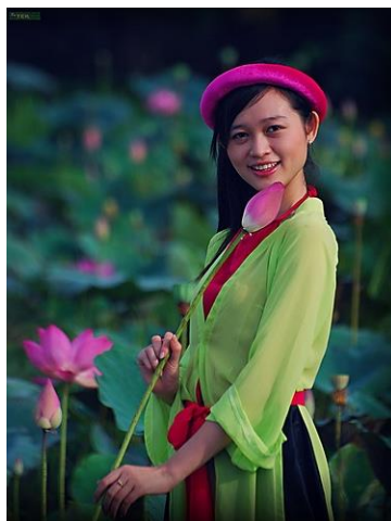
รูปที่ 42 ภาพผู้หญิงใส่ชุดอ่าวหญ่ายที่ทำจากผ้าไหมฮาดง