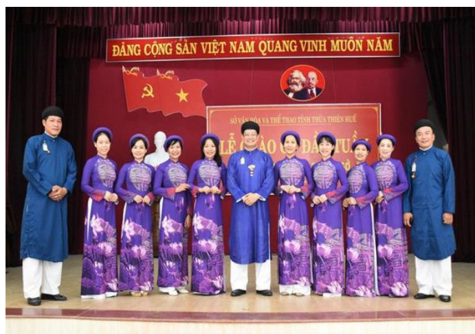
รูปที่ 87 ข้าราชการในจังหวัดเถื่อเทียนเว้ใส่ชุดอ่าวหญ่ายहुเทินไปทำงาน

ข้าราชการในสำนักงานวัฒนธรรมและการกีฬาของจังหวัดเถื่อเทียนเว้เป็นสำนักงานบริหารภาครัฐแห่งแรกในจังหวัดเถื่อเทียนเว้ที่ออกข้อบังคับให้ข้าราชการใส่ชุดอ่าวหญ่ายไปทำงาน