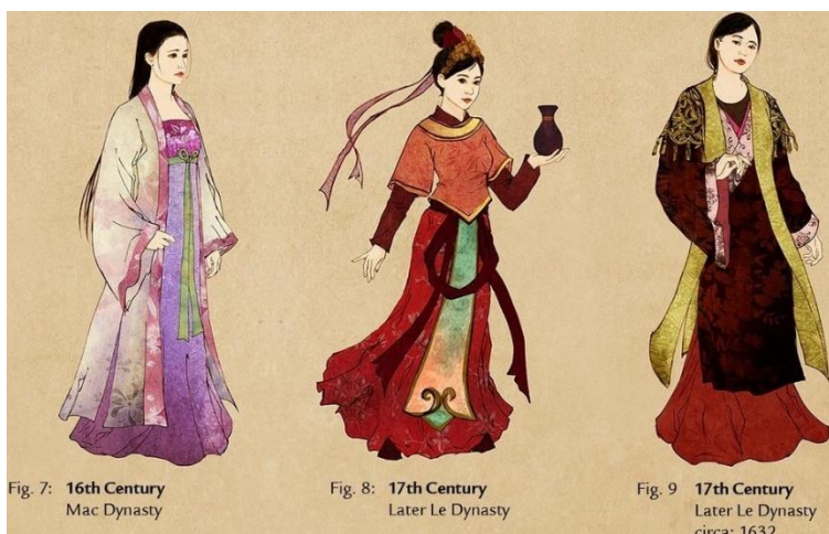
รูปที่ 65 พัฒนาของชุดอ่าวหญ่าย ช่วง 16 – 17th Century