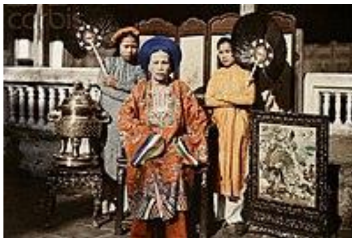
รูปที่ 19 เจ้าหญิง Mỹ Lươngสวมเสื้อแดงáo Nhật Binhและสีน้ำเงินเข้มชาน Vanh วัน

ชุดอ่าวหญ่ยถูกสร้างขึ้นเมื่อ tucks ซึ่งอยู่ใกล้ที่เหมาะสมและมีขนาดกะทัดรัดที่เพิ่มขึ้นในปี ค.ศ. 1920 เพื่อสตรีจีนนี้ เครื่องแต่งกายของจีนในรูปแบบกางเกงขายาวและเสื้อคลุมได้รับคำสั่งจากรัฐบาลเหงียนของเวียดนาม ราชวงศ์หมิงของจีนราชวงศ์ถังและเครื่องแต่งกายของราชวงศ์ฮั่นถูกอ้างถึงโดยทหารและข้าราชการของเวียดนามโดย Nguyen Lord Nguyễn Phúc Khoát (Nguyen The Tong) ตั้งแต่ปี ค.ศ. 1744