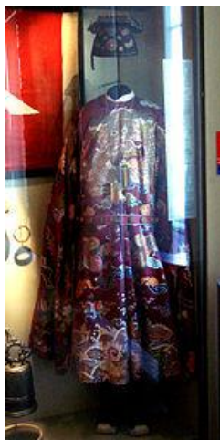
รูปที่ 24 ชุดพิธีการของ Marshall Nguyễn Tri Phương