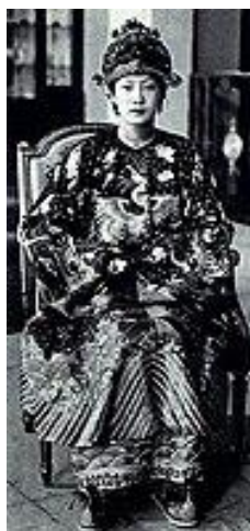
รูปที่ 17 จักรพรรดินีนามผึ้งในวันอภิเษกสมรส ค.ศ.1934