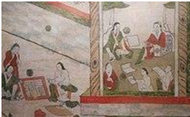
รูปที่ 14 "Giảng học đồ" (講學圖 - การเรียนการสอน): นักวิชาการและนักเรียนสวมเสื้อคลุมแบบไขว้กัน (áo giao lĩnh)