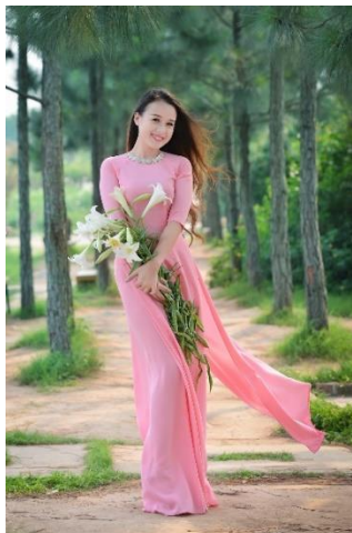
รูปที่ 78 ผ้าชีฟอง (2)