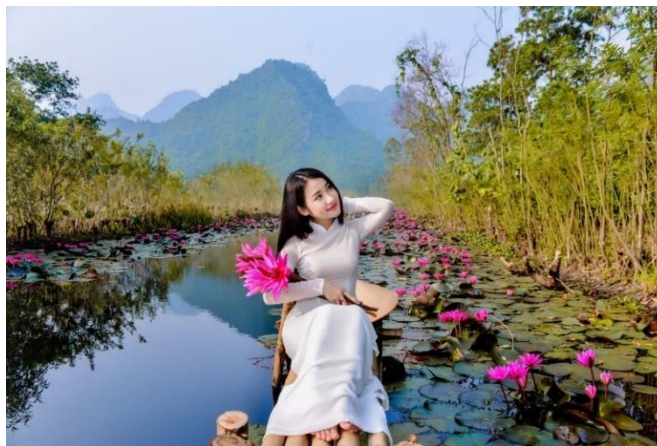
รูปที่ 61 ชุดอ่าวหญ่ายของผู้หญิงชาวเวียดนาม