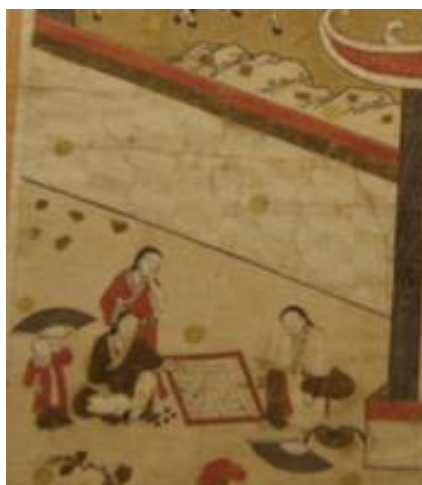
รูปที่ 15 "Giảng học đồ" (講學圖 - การเรียนการสอน): ผู้ใหญ่ไว้ผมยาว

Phan Huy Chúเขียนไว้ในบันทึกการจัดหมวดหมู่ของสถาบันแห่งราชวงศ์ที่สืบต่อกันมา (Lịch triều hiến chương loại chí) “ตั้งแต่ยุคที่ได้รับการบูรณะในภายหลัง – Lê สำหรับโอกาสที่ยิ่งใหญ่และเป็นทางการ (จักรพรรดิ) มักสวมหมวก Xung ThiènและHoàng Bào เสื้อคลุม” ผ่านภาพบุคคลและภาพของผู้ปกครองมากมายในสมัยมิงโชซอนและเมื่อไม่นานมานี้เขียนแห่งเวียดนามเราจะเห็นได้ว่ามาตรฐานนี้มีมาช้านานภายในภูมิภาคที่ใหญ่มาก