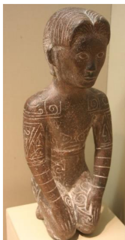
รูปที่ 1 รูปปั้นชายผมสั้นสไตล์เยวและรอยสักบนร่างกายของชนเผ่าจากรัฐเยวในหมู่ชนเผ่าBai yue ที่ไม่ใช่คนจีนทางตอนใต้ของจีนและเวียดนามเหนือ