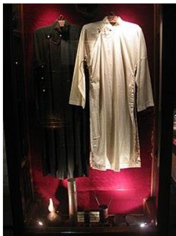
รูปที่ 22 เครื่องแบบนักเรียนของสถาบันอิมพีเรียล