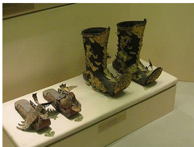
รูปที่ 21 รองเท้าบุทและรองเท้าแมนดารีนิ โลหะปิดทองราชวงศ์เหงียนศตวรรษที่ 19 - ต้นศตวรรษที่ 20