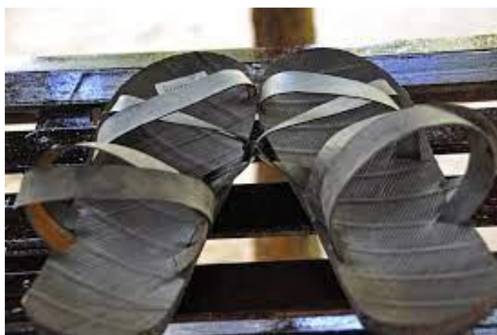
รูปที่ 34 รองเท้า dép lỏp