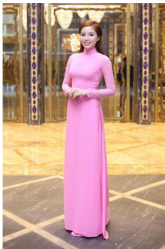
รูปที่ 60 ชุดอ่าวหญ่ายแบบดั้งเดิม