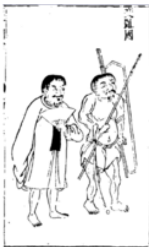
รูปที่ 3 ภาษาเวียดนามในSan cai Tu hui : ผมสั้นสวมáo tú diên (ชาย) และโจงกระเบน (ขวา)

ถูกปกครองอย่างเป็นทางการโดยชาวเวียดนาม อย่างไรก็ตามรูปแบบของเสื้อผ้าสามัญชนมีความแตกต่างจากเสื้อผ้าที่ชนชั้นสูงสวมใส่ ผู้ชายที่เป็นสามัญชนชาวคี่ห์นและชนกลุ่มน้อยชาติพันธุ์เกือบทั้งหมดเริ่มสวมกางเกงขายาวและเสื้อเชิ้ตแบบจีน ซึ่งเวียดนามสวมเครื่องแต่งกายคอกลมซึ่งทำจาก 4 ส่วนผ้าที่เรียกว่า áo tú diên ทั้งผู้ชายและผู้หญิง นอกจากนี้ยังมีประเภทอื่น ๆ เช่น áo giao lĩnh (เสื้อคลุมไขว้หน้า) เสื้อผ้า "áo" นั้นมีความหมายว่า วัสดุสำหรับสวมใส่ส่วนบนของร่างกาย มีความยาวต่ำกว่าเข่าและเสื้อผ้าคอกลมมีกระดุมเมื่อเสื้อคลุมไขว้ผูกไว้ทางด้านขวา และยังมีทรงผมที่เป็นที่นิยม คือ ผมสั้นหรือโกนหัวมาตั้งแต่สมัยโบราณของเวียดนาม ผู้ชายชาวเวียดนามโกนศีรษะหรือไว้ผมสั้นในสมัยราชวงศ์ Trn สิ่งนี้สามารถเห็นได้ในภาพวาด "The Mahasarakham Trúc Lâm Coming Out of the Mountains" ซึ่งแสดงภาพTrần Nhân Tôngและผู้ชายในราชวงศ์ Trần รวมทั้งสารานุกรมจีน " San cai Tu hui " จากศตวรรษที่ 17 การประชุมได้รับความนิยมนจนการปกครองที่สี่ของจีน - เวียดนาม