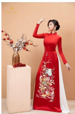
รูปที่ 32 ชุด Áo dài ที่มา : eoviet , 2017