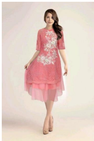
รูปที่ 82 นวัตกรรมชุดอ่าวหญ่ายที่ผสมผสานความงามของแบบดั้งเดิมและแบบทันสมัย

นวัตกรรมใหม่ของชุดอ่าวหญ่ายในปัจจุบันได้มีการออกแบบตั้งแต่สีจนถึงสไตล์ ซึ่งมีเคล็ดลับการตัดเย็บชุดอ่าวหญ่ายที่สวยงามและสร้างสรรค์เพื่อเพิ่มรูปร่างของผู้สวมใส่และดึงดูดความสนใจกัน