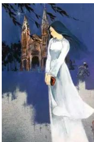
รูปที่ 43 ภาพผู้หญิงใส่ชุดอ่าวหญ่ายที่ทำจากผ้าไหมฮาดง