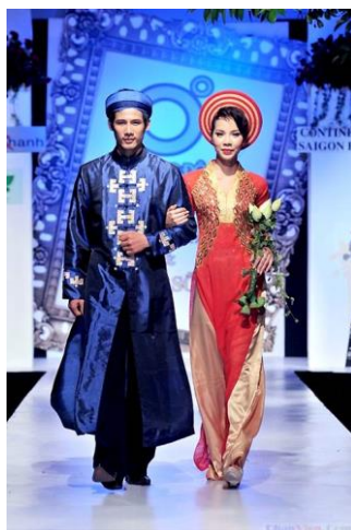
รูปที่ 57 ชุดอ่าวหญ่ายสีเข้ม

เป็นสีที่นิยมสำหรับผู้หญิงที่แต่งงานแล้ว