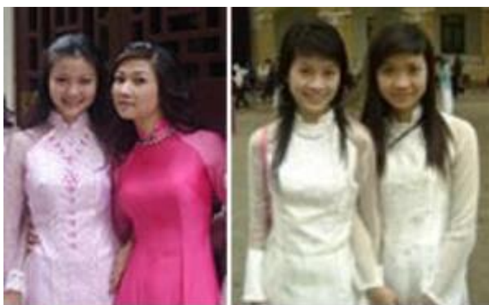
Áo dài tay raglan

รูปที่ 41 ภาพชุดอ่าวหญ่ยที่เป็นแบบแขนเสื้อเร็กแลน