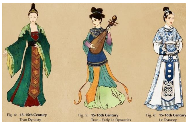
รูปที่ 64 พัฒนาการของชุดอ่าวหญ่าย ช่วง 13 – 15th Century / 15 – 16th Century