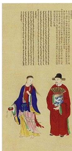
รูปที่ 8 หญิงรับใช้และแมนดารินแห่งราชวงศ์ Lê

ก่อนปี ค.ศ. 1744 ผู้คนทั้ง Đàng Ngoi (ทางเหนือ) และ Đàng Trong (ทางใต้) สวม áo giao lĩnh กับ thướt ซึ่ง เป็น กระโปรงยาวชนิดหนึ่ง โดยการแต่งกายของ Giao Lĩnh ปรากฏในช่วงแรก ๆ ในประวัติศาสตร์เวียดนามซึ่งอาจเป็นในช่วงแรกของการปกครองของจีนโดย Eastern Han หลังจากที่ Mã Yuán สามารถปราบกบฏของ Trung Sisters ได้ในที่สุด ชนชั้นล่างจะชอบแขนเสื้อที่มีความกว้าง พอสวมควรหรือแขนเสื้อรัดรูปและมีสีเขียว ๆ สิ่งนี้เกิดจากความยืดหยุ่นในการทำงานทำให้ผู้คนสามารถเคลื่อนย้ายไปมาได้อย่างสะดวก ทั้งผู้ชายและผู้หญิงมีผมยาว