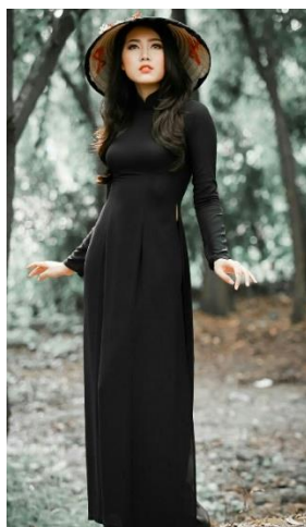
รูปที่ 54 ชุดอ่าวหญ่ายสีดำ (1)

มักจะสวมใส่ในงานศพ ผู้ที่ไว้อาลัยในงานศพจะใส่สีขาวหรือดำก็ได้