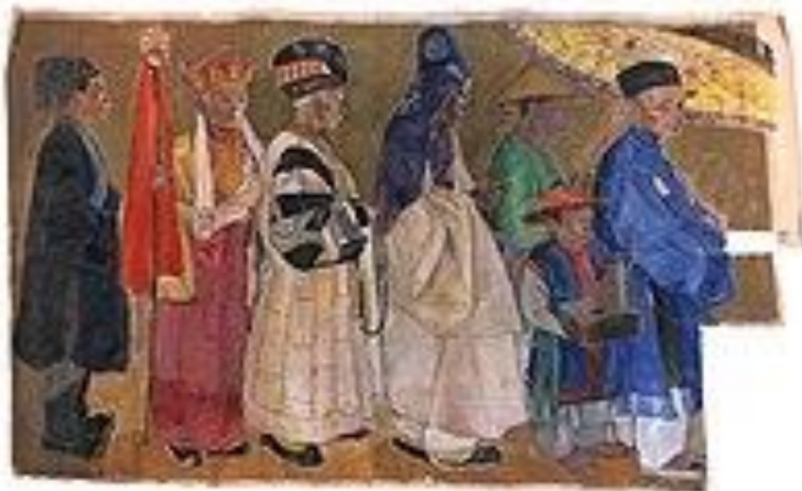
รูปที่ 16 ผู้ชายNguyỄNราชวงศ์ในเครื่องแต่งกายอย่างเป็นทางการ