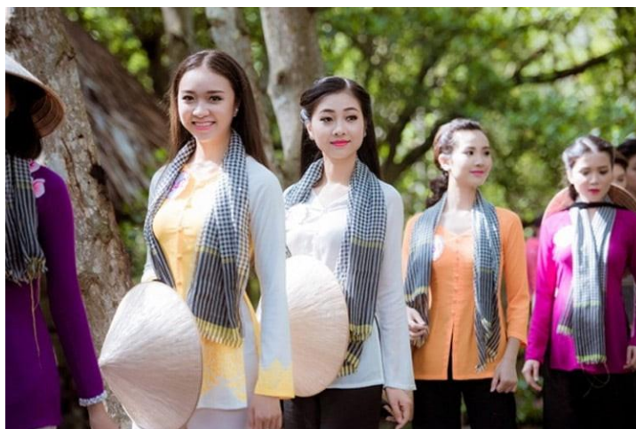
รูปที่ 33 ชุด Áo bà ba

Áo bà ba – ชุดลำลองสำหรับผู้ชายและผู้หญิง