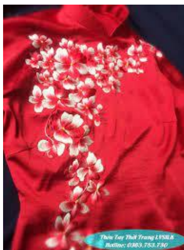
รูปที่ 74 ชุดอ่าวหญ่ายแบบลายปัก