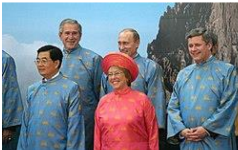
รูปที่ 28 Áo gấm

Áo gấm – เสื้อคลุมผ้าอย่างเป็นทางการสำหรับงานราชการหรือสำหรับผู้ชายในงานแต่งงาน