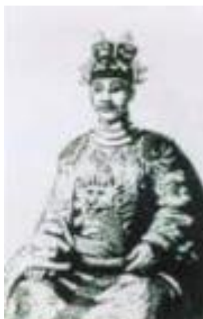
Vua Minh Mạng