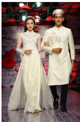
รูปที่ 49 ชุดแต่งงานที่มีการประยุกต์มาจากชุดอ่าวหญ่ายของชาวเวียดนาม

สีขาวเป็นสัญลักษณ์ของความบริสุทธิ์และความไร้เดียงสา เป็นสีสำหรับเด็กผู้หญิงที่นิยมสวมใส่ มักพบเห็นได้จากการใส่เป็นเครื่องแบบไปโรงเรียน มักพบเห็นได้จากนักเรียนมัธยมปลาย หากเป็นชุดอ่าวหญ่ายที่ผู้หญิงจะใช้ในพิธีแต่งงาน จะแสดงให้เห็นถึงความเช่กซึ่ในสไตล์ซีทรูเนื้อผ้าโปร่งบาง นอกจากนี้ ในอดีตสีขาวถือเป็นสีดั้งเดิมของการไว้ทุกข์ในประเทศเวียดนาม ซึ่งที่ใส่ไปงานแต่งงานนั้น มีการปกคลุมลายบนเสื้อ เพิ่มความสดใสทำให้อูสวยงาม เป็นสีที่แสดงถึงความรักที่บริสุทธิ์ผุดผ่องเสมือนกับดอกไม้ที่สวยงาม สะอาด