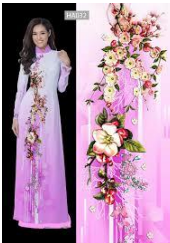
รูปที่ 79 ผ้าไหม