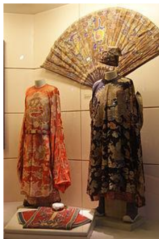
รูปที่ 23 เครื่องแต่งกายของศาลราชวงศ์เหิงยวน