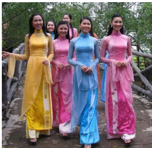
รูปที่ 56 ชุดอ้าหญ่ายสีพาสเทล

ใช้สำหรับผู้หญิงที่มีอายุมากกว่าแต่ยังไม่แต่งงาน