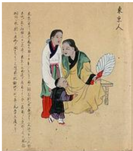
รูปที่ 5 ผู้หญิงสองคนและเด็กในตังเกี๋ยประมาณปี ค.ศ. 1700