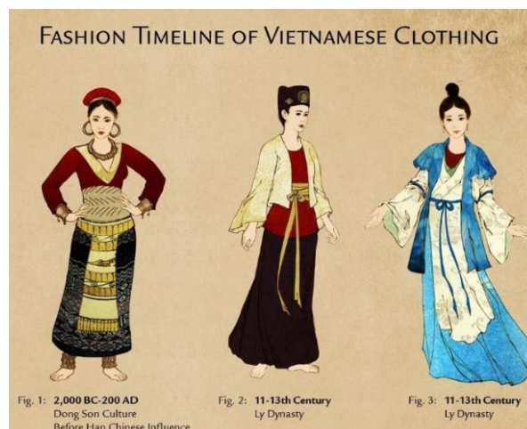
รูปที่ 63 พัฒนาการของชุดอ่าวหญ่าย ตั้งแต่ 2,000 BC – 200 AD / 11 – 13th Century ที่มา : vietnameseprivatetours , 2022