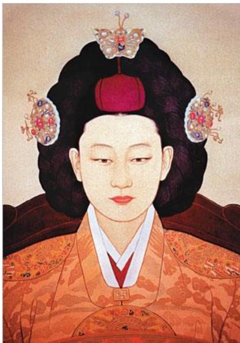
ภาพที่ 6 จักรพรรดิเมืองชอง