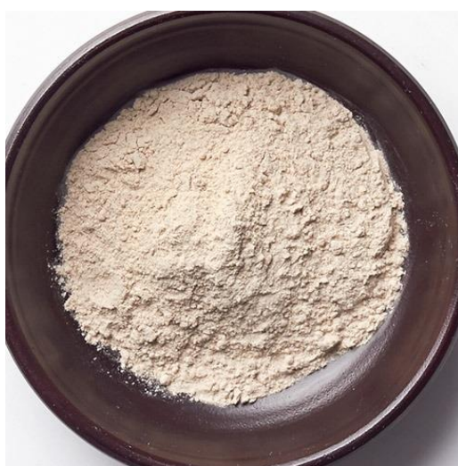
ภาพที่ 2 สบูโซดู

ในสมัยโซซอนนั้นการล้างหน้าเป็นสิ่งสำคัญ ผลิตภัณฑ์ที่ใช้ในการล้างหน้าสำหรับ สตรีชั้นสูงในสมัยโซซอนมีชื่อเรียกว่า โซดู โซดูนั้นทำมาจากพืชจำพวกถั่ว โดยถั่วที่นิยมนำมาใช้มากที่สุดคือถั่วเขียวอะซูกิหรือถั่วเหลืองนำมาบดบนเครื่องโม่ให้แล้วร่อนให้ละเอียด โดยคุณสมบัติของสบู่ชนิดนี้คือการผลัดเซลล์ผิวที่ตายแล้วบนใบหน้าและยังช่วยให้ใบหน้ามีความชุ่มชื้น แต่ในสมัยนั้นถั่วมีราคาสูงสำหรับสตรีที่อยู่ในชนชั้นแรงงานจะนิยมใช้ ธัญพืช เช่น ข้าว หรือรำข้าวสาลีนำมาห่อด้วยผ้าฝ้ายสลิแล้วใช้ขัดถูใบหน้าจนสะอาด นักวิชาการกล่าวว่านมายังเป็นของที่นิยมใช้เช่นกัน