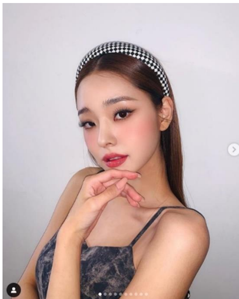
ภาพที่ 10 ชงจืออา