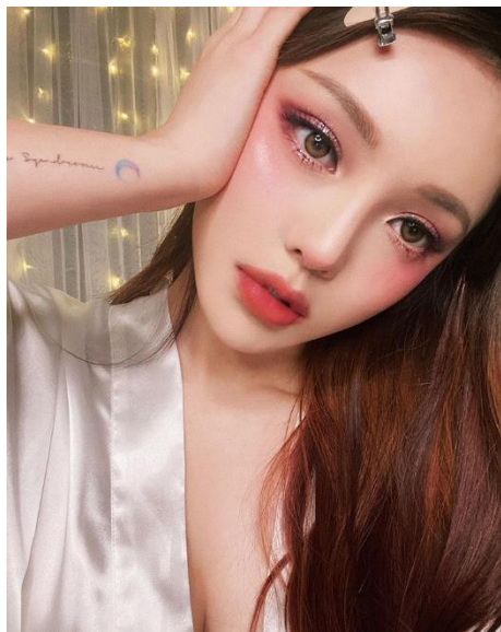
ภาพที่ 9 Pony Makeup