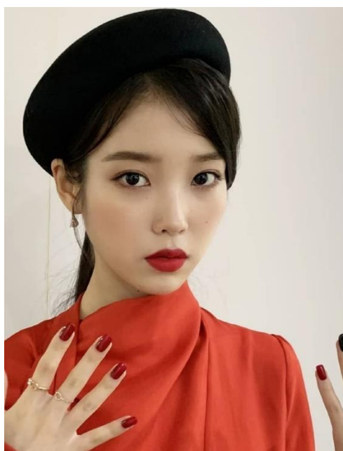
ภาพที่ 7 อีจีอิน

ปากดูเล็กและมีรูปทรงเป็นกระชับ การจับข้อขนตาที่ทำให้ดวงตาดูกลมโตมากขึ้น การสร้างถุงใต้ตาที่ทำให้ดวงตาดูน่ารัก นอกจากนี้ยังมีการผสมผสานเทคนิคอื่น ๆ เพื่อให้ได้ลักษณะการแต่งหน้าตามค่านิยมของสังคม ในประเทศเกาหลีที่นำเอาศิลปะเข้ามามีบทบาทกับชีวิตประจำวันอย่างมาก ทำให้การใช้สีในการแต่งหน้าเป็นเรื่องสำคัญ ผู้หญิงเกาหลีให้ความสำคัญกับการเลือกสี ทั้งในด้านการแต่งตัวและการแต่งหน้า เชื่อว่าการใช้สีที่เหมาะสมกับบุคลิกและโทนสีผิวจะทำให้ดูดียิ่งขึ้น จากการที่อัตลักษณ์การแต่งหน้าสไตล์เกาหลีมีความนิยมจากการสอดแทรกวัฒนธรรมผ่านทางสื่อจึงทำให้ปัจจุบันมีบุคคลที่เป็นต้นแบบในการแต่งหน้าฉบับเกาหลีมากมาย ทั้งนักแสดง ไอดอล หรือแม้กระทั่งบิวตีบล็อกเกอร์ (Beauty Blogger) ที่เป็นผู้มีความรู้ด้านการแต่งหน้าและสอนเทคนิคการแต่งหน้าแบบต่าง ๆ ที่โด่งดังในประเทศเกาหลี โดยไอดอลที่เป็นกระแสนิยมในเรื่องของเทคนิคการแต่งหน้าที่เสริมบุคลิกให้ดูสวยยิ่งขึ้นในตอนนี้ ยกตัวอย่างเช่น