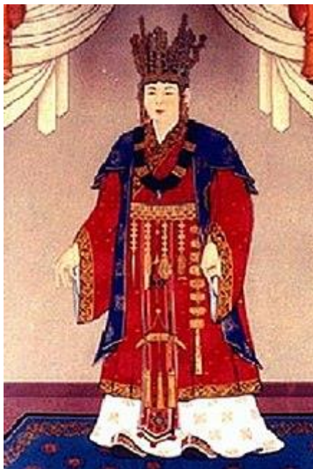
ภาพที่ 4 พระราชินีซอนด็อก