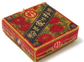
ภาพที่ 3 แป้งพัคกาบุน