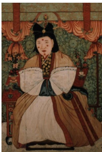
ภาพที่ 5 พระนางฮายอน

ในแผ่นดินโครยอได้มีการเปลี่ยนแปลงทางความคิดเกิดขึ้น มาตรฐานความงามของหญิงสาวกลายเป็นตัววัดความสง่างาม สตรีในชนชั้นสูงยังคงมาตรฐานค่านิยมความงามคือการแต่งหน้าที่เน้นความเป็นธรรมชาติ ซึ่งทำให้ต้องเน้นไปที่การบำรุงผิวพรรณให้ดูสุขภาพดีอยู่ตลอดเวลา ด้วยค่านิยมของยุคสมัยนี้ที่นิยมความกระฉ่างใส สตรีชนชั้นสูงจะทาแป้งแบบคูนที่สกัดจากแป้งข้าวเจ้าหรือลูกเดือยผสมน้ำและทายอนจีซึ่งเป็นชาดสีแดงที่ริมฝีปากเพื่อเสริมความขาวกระฉ่างใสของใบหน้าเท่านั้น แต่อย่างไรก็ตาม มีบันทึกไว้ว่า ในงานสำคัญ เช่น งานแต่งงาน สตรีชั้นสูงในยุคนี้จะใช้ยอนจีทาที่หน้าผากเช่นกัน ต่อมาสิ่งนี้ถูกพัฒนาเรียกว่ากอนจี และเขียนคิ้วเป็นทรงโค้งและความหนาตามค่านิยม โดยจะวาดคิ้วให้เข้ากับเส้นผ่านศูนย์กลางของดวงตา ในแผ่นดินโครยอนั้น ผู้หญิงจะมีอิสระทางความคิดและการใช้ชีวิตมากกว่าในโชซอนและซิลลาที่ผู้หญิงถูกกดทับจากแนวคิดของลัทธิขงจื้อที่มีการลดบทบาทผู้หญิงลง ผู้หญิงในแผ่นดินโครยอจึงมีอิสระในการแต่งหน้าและแต่งกายเพื่อเผยความสง่างามในแบบของตนเองมากกว่า (Korea Society,2565)