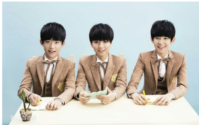
ภาพที่ 19 TFBoys ใน ค.ศ. 2014

เมื่อวันที่ 6 สิงหาคม ค.ศ.2013 TFBoys ได้เปิดตัวที่เซอร์ที่ชื่อว่า 十年 และเปิดตัวอย่างเป็นทางการในเดือนตุลาคมได้เปิดตัวมินิอัลบั้มแรก ชื่อว่า “Heart 梦·出发 (Heart Dream&Start)” เดือนมีนาคม ค.ศ.2014 ได้เปิดตัวซิงเกิล “魔法城堡 (Magic Castle)” ในเดือนเมษายนเขาได้รับรางวัล Yinyue V Chart Annual Festival Yinyue Live Popular Singer และนักร้องยอดนิยมอันดับ 2 ในแผ่นดินใหญ่ ในเดือนกันยายน พวกเขาได้รับเชิญเป็นแขกรับเชิญในโครงการสวัสดิการสาธารณะของ CCTV "First Class of School" ในเดือนตุลาคม พวกเขาออกมินิอัลบั้ม "青春修炼手册 (Practice Book For Youth)" ในเดือนมีนาคม ค.ศ.2015 เขาปล่อยซิงเกิล "宠爱 (Pamper)" และในเดือนธันวาคมพวกเขาปล่อยมินิอัลบั้ม "大梦想家 (Big Dreamer)" ไปทั่วเอเชีย