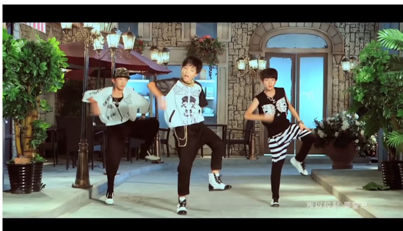
ภาพที่ 55 วง TFBoys ในชุดแนวสตรีทสีชาวดำ