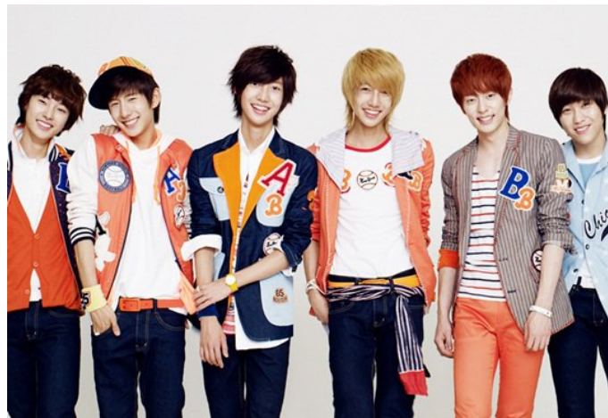
ภาพที่ 3 วง Boyfriend (บอยเฟรนด์)

นอกจากนี้ บริษัทต้นสังกัดได้สร้างภาพลักษณ์เด็กผู้ชายที่มีจิตใจที่มุ่งมั่นในความฝันของตน และเด็กผู้ชายที่สดใสตามวัยให้กับวงผ่านมิวสิกวิดีโอ รวมถึงความรักในวัยหนุ่มสาวด้วย ภาพลักษณ์ดังกล่าวได้เคยผลิตซ้ำในกลุ่มไอดอล K-pop เช่นกัน ตัวอย่างวงไอดอลเกาหลีที่เคยใช้ภาพลักษณ์ดังกล่าวในมิวสิกวิดีโอ เช่น วง Boyfriend และ Infinite