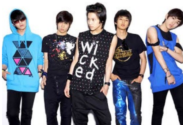
ภาพที่ 46 วงไอดอลเกาหลี SHINee ใน ค.ศ. 2008