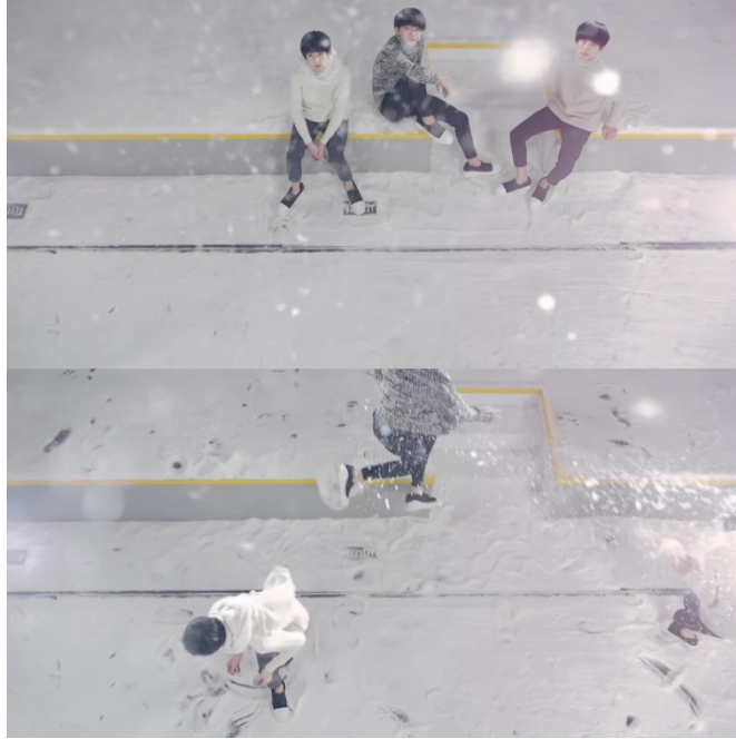
ภาพที่ 62 ฉากที่วง TFBoys เล่นหิมะด้วยกัน