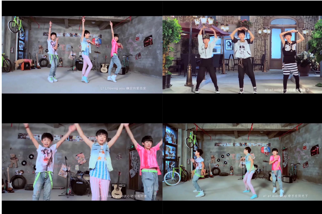
ภาพที่ 58 วง TFBoys เดินท่าทำแขนและมือเป็นรูปตัว L O V และ E

นอกจากนี้ ยังมีการเปลี่ยนตำแหน่งระหว่างเดินในช่วงท่อนแรกของเพลง เมื่อถึงท่อนของหวังหยวน หวังหยวนได้อยู่ตรงกลาง เมื่อถึงท่อนของอี้หยางเขียนสี่ สมาชิกในวงก็เปลี่ยนตำแหน่งเพื่อให้อี้หยางเขียนสี่อยู่ตรงกลาง และเมื่อถึงท่อนของหวังจวินข่าย สมาชิกในวงก็เปลี่ยนตำแหน่งเพื่อให้หวังจวินข่ายอยู่ตรงกลางจบเพลง