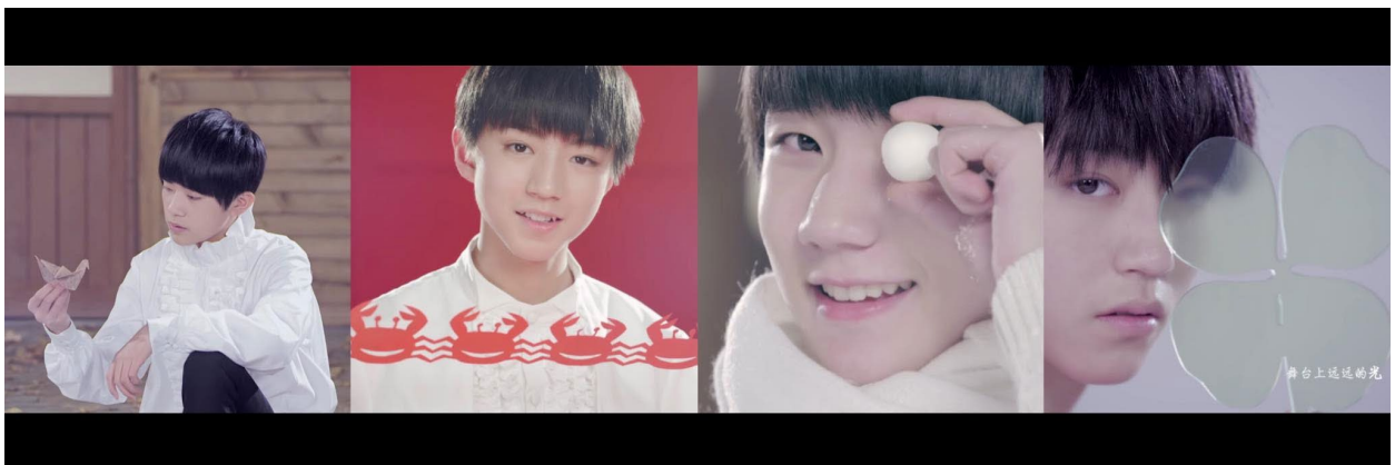
ภาพที่ 61 ฉากที่พูดถึงแฟนคลับของแต่ละสมาชิกและแฟนคลับของวง