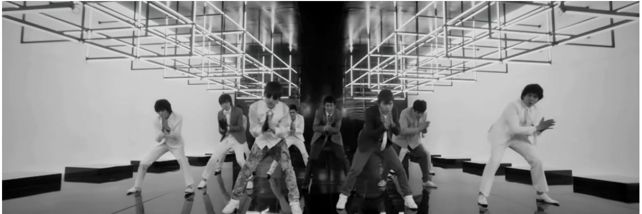
ภาพที่ 16 วง Super Junior กำลังเต้นท่าเต้นหลักของเพลง Sorry Sorry ในมิวสิกวิดีโอ