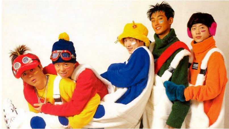
ภาพที่ 5 วง H.O.T

ต่อมาในช่วงปลายทศวรรษที่ 1990 ซึ่งเป็นช่วงที่เริ่มมีวงไอดอลวัยรุ่นเกิดขึ้น แฟชั่นฮิปฮอปเริ่มเป็นที่นิยมมากขึ้น มีการเพิ่มเครื่องประดับต่าง ๆ เช่น แว่นตาสกี หูฟัง ถุงมือขนาดใหญ่ กระเป๋าเป้ เป็นต้น ในขณะที่ไอดอลชายได้สวมเครื่องแต่งกายที่แตกต่างกันในวงเพื่อบ่งบอกความเป็นตัวเอง ไอดอลหญิงในช่วงนี้ได้สวมเครื่องแต่งกายที่เหมือนกันทั้งวง เน้นภาพลักษณ์ที่ไร้เดียงสาและอ่อนเยาว์ อย่างไรก็ตามก็มีการพัฒนาแฟชั่นของไอดอลหญิงขึ้น โดยเริ่มใส่กางเกงขาบาน กระโปรงสั้น เสื้อเอวลอยมากขึ้น