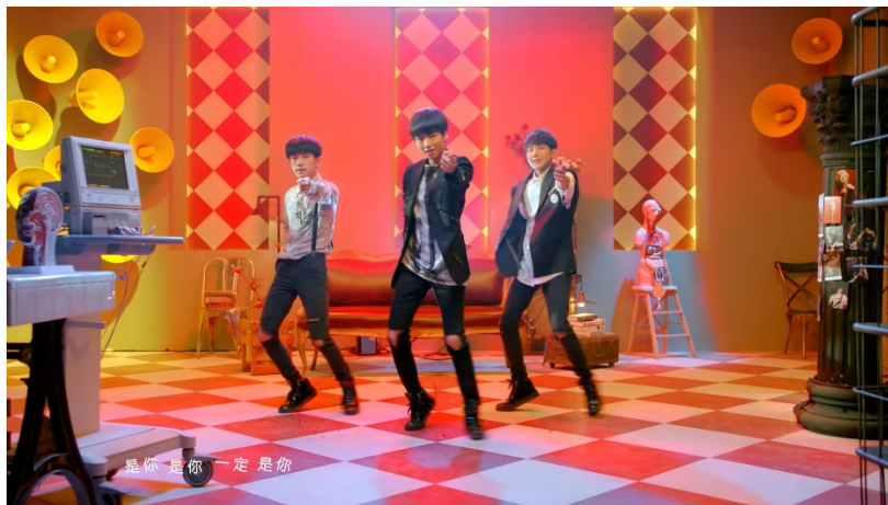
ภาพที่ 66 ฉากเต้นในมิวสิกวิดีโอเพลง 是你 (It's You) ที่มา https://www.youtube.com/watch?v=K10sn6lomFM

ในฉากเต้น สมาชิกได้แต่งกายด้วยชุดที่คล้ายคลึงกับชุดสูท หากเปรียบเทียบรูปแบบเสื้อผ้าของไอดอล K-pop ชุดดังกล่าวมีลักษณะคล้ายกับเสื้อผ้ารูปแบบแบล็กแอนด์ไวท์ที่เน้นความสง่างามของชุดทางการ