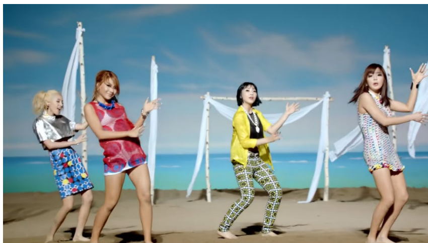
ภาพที่ 44 มิวสิกวิดีโอเพลง Falling in Love ของ 2ne1