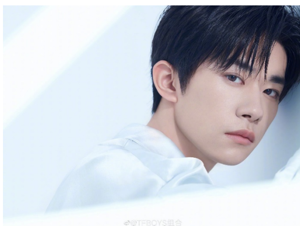
ภาพที่ 25 อี้หยางเซียนสี่ ใน ค.ศ. 2020