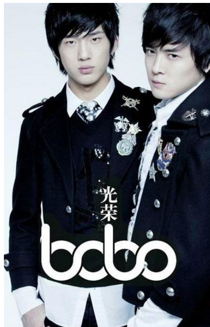
ภาพที่ 49 วงบอยกรุ๊ปจีน Bobo