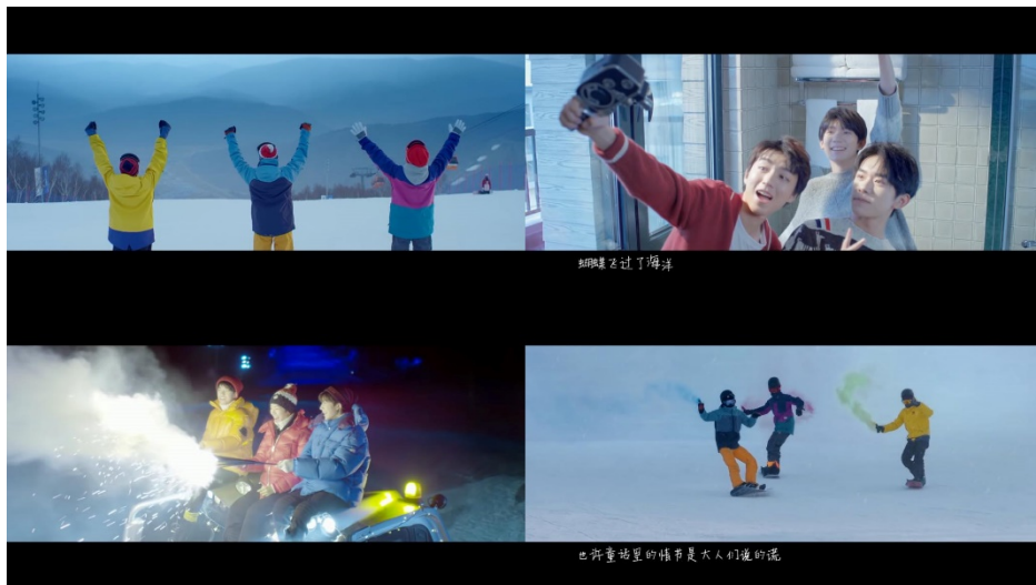
ภาพที่ 71 ภาพจากมิวสิกวิดีโอเพลง 我们的时光 (Our Time)

หลังจากที่งานแถลงข่าวจบลง จึงตกลงไปเที่ยวกัน เดิมทีจะไปชายหาด แต่สุดท้ายได้ไป สกีรีสอร์ทแทน ทั้ง 3 คนจึงใช้ช่วงเวลานี้อยู่ด้วยกันอย่างมีความสุข