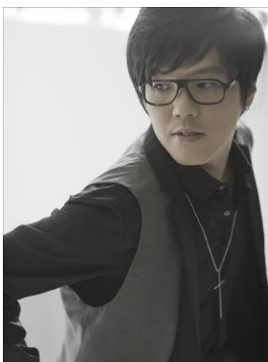
ภาพที่ 37 แทมู