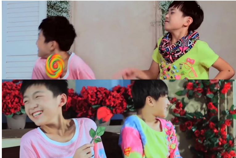
ภาพที่ 51 ฉากที่นางเอกมิวสิกวิดีโอกลายเป็นเด็กผู้ชายคนอื่น จนทำให้หวังจวินข่ายกับอี้หยางเขียนสื่หัวเราะอย่างเขินอาย

มิวสิกวิดีโอนี้ ซึ่งหลังจากที่ทั้ง 2 คนรู้ว่าไม่ใช่เฮอเหมย์ฉีก็หัวเราะออกมาด้วยความอาย ทั้งหมดนี้ทำให้เห็นว่า สังคมจีนยังเชื่อคำสอนของลัทธิขงจื้อว่า ความรักมีแค่ชายกับหญิงเท่านั้น ทำให้คนจีนเชื่อว่า การเป็น LGBTQ+ เป็นเรื่องที่ผิด (อรปวีณ์ วงศ์สว่าง, 2563)