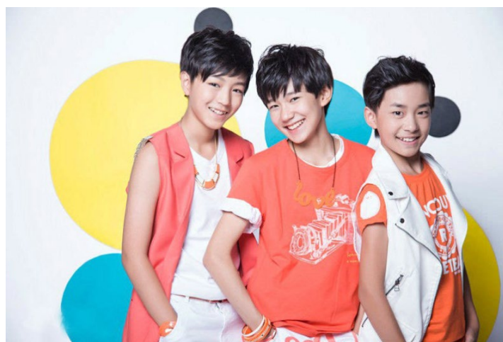
ภาพที่ 1 TFBoys ใน ค.ศ. 2013

ในมิวสิกวิดีโอของ TFBoys ใน ค.ศ. 2013-2014 การแต่งกายของสมาชิกค่อนข้างแปลกตาและมีสีสันสดใส ซึ่งคล้ายกับเครื่องแต่งกายที่ไอดอล K-pop ใส่ในมิวสิกวิดีโอและรายการเพลง นอกจากนี้เครื่องแต่งกายแล้ว การเต้นในมิวสิกวิดีโอของ TFBoys ยังคล้ายกับท่าเต้นในมิวสิกวิดีโอของไอดอล K-pop เช่นกัน