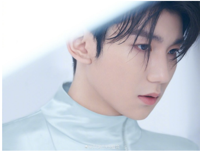
ภาพที่ 23 หวังหยวน ใน ค.ศ. 2020