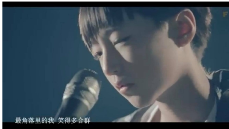
ภาพที่ 22 รูปของหวังจวินข่ายจากคลิปคัฟเวอร์เพลง 洋葱 (Onion)

กับหวังหยวนและอี้หยางเขียนสี่ จากการเป็นหัวหน้าวงของ TFBoys หวังจวินข่ายได้แสดงออกบนเวที แสดงความเป็นหัวหน้าในทุกละเวลา หวังจวินข่ายเล่นกีตาร์เก่ง และการร้องเพลงของเขาเป็นที่น่าจดจำ