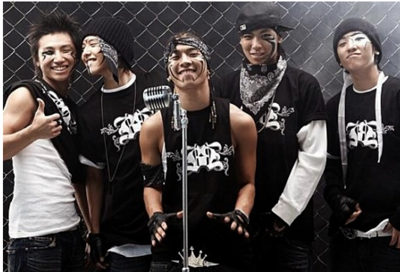
ภาพที่ 57 วง Bigbang ใน ค.ศ. 2006