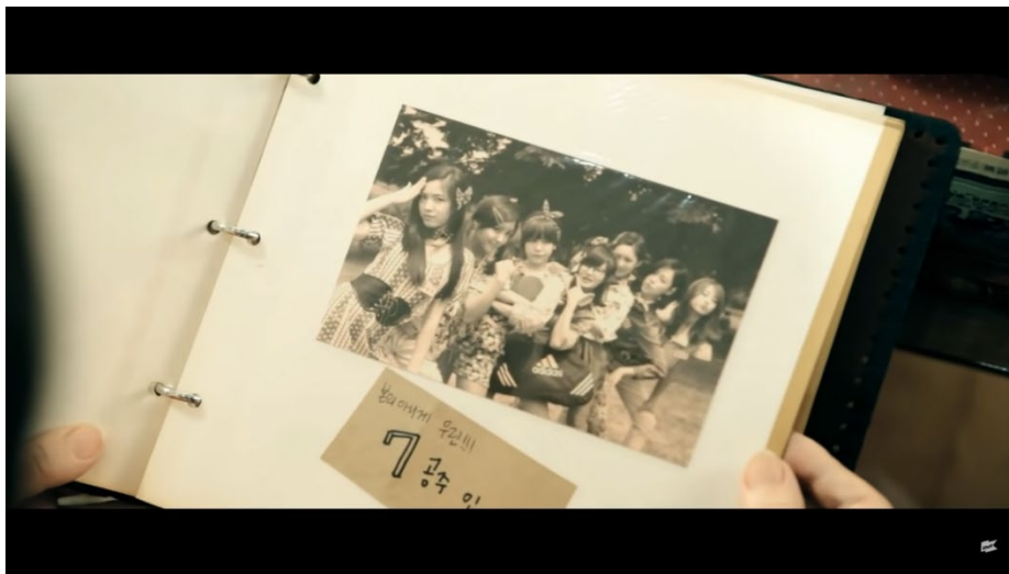
ภาพที่ 73 ภาพจากมิวสิกวิดีโอเพลง Roly Poly ของ T-ara