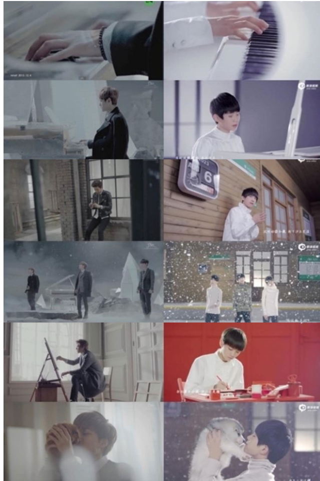
ภาพที่ 64 ฉากในมิวสิกวิดีโอเพลง Young ที่เป็นประเด็นถกเถียงว่าลอกเลียนมิวสิกวิดีโอเพลง Miracles in December ของ EXO