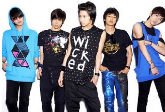
ภาพที่ 8 วงไอดอลเกาหลี SHINee ใน ค.ศ. 2008