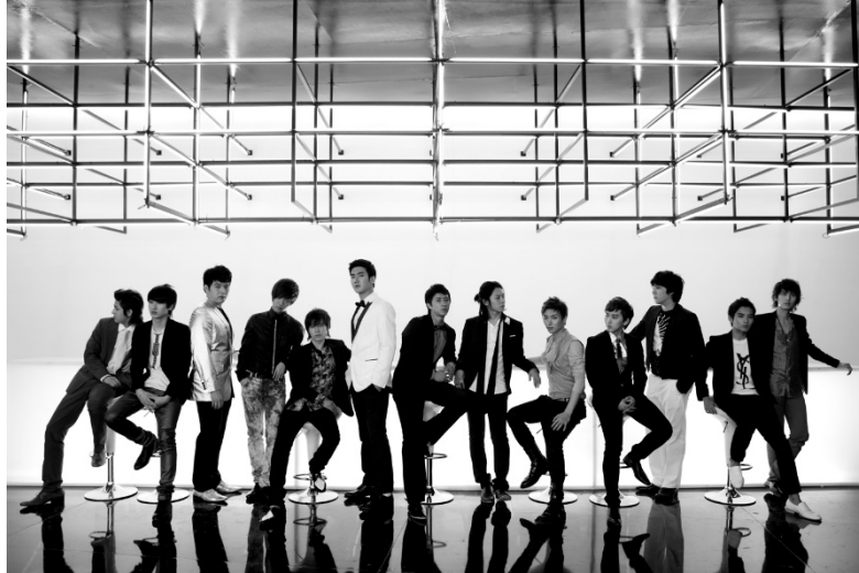
ภาพที่ 67 วง Super Junior ใน ค.ศ. 2009 ที่มา https://pantip.com/topic/32127532