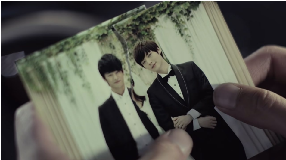
ภาพที่ 52 ภาพจากมิวสิกวิดีโอเพลง Please Don't ของ K.will

(1) รูปแบบที่มีตอนจบหักมุม เช่น มิวสิกวิดีโอเพลง Please Don't ของ K.will