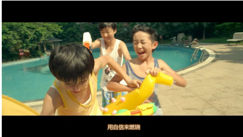
ภาพที่ 42 ฉากที่สมาชิกในวงฉีตน้ำกันอย่างสนุกสนาน