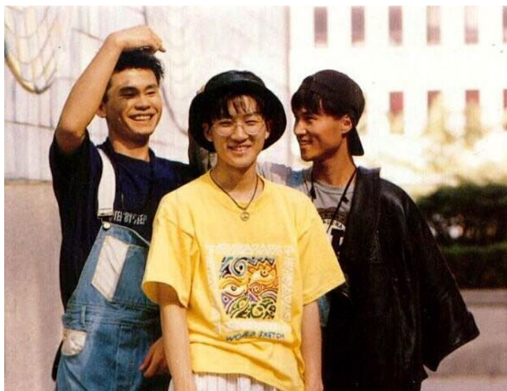
ภาพที่ 4 Seo Taiji and Boys

เว็บไซต์วิกิพีเดีย (K-pop, 2021) ได้กล่าวถึงวิวัฒนาการของเครื่องแต่งกายของไอดอลเกาหลีว่าการเกิดขึ้นของ Seo Taiji and Boys ใน ค.ศ. 1992 นอกจากการใช้แนวเพลงของตะวันตกในเพลงเกาหลี ยังได้นำแฟชั่นของตะวันตกมาใช้ด้วย ช่วงโปรโมตเพลง I Know สมาชิกได้สวมเครื่องแต่งกายแนวสตรีทที่มีสีสันสดใส เช่น เสื้อยืดขนาดใหญ่ เสื้อกันลม ชุดเอี๊ยม เสื้อทีมกีฬา เป็นต้น