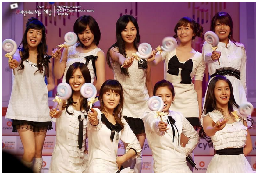
ภาพที่ 6 วง Girls' Generation แสดงเพลง Kissing You