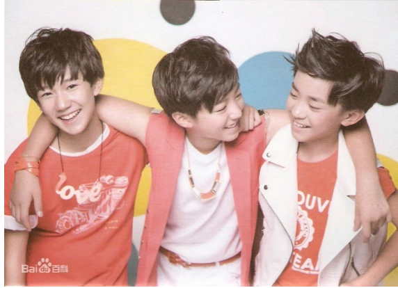
ภาพที่ 18 TFBoys ใน ค.ศ. 2013