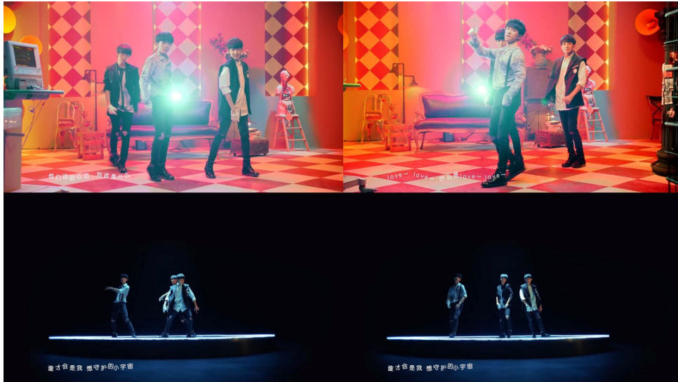
ภาพที่ 69 ฉากเปลี่ยนตำแหน่งระหว่างเต้นในมิวสิกวิดีโอเพลง 是你 (It's You)