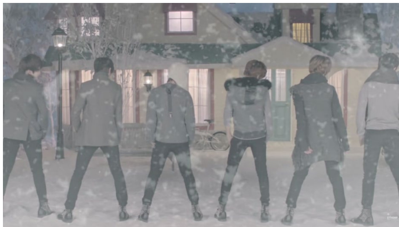
ภาพที่ 63 มิวสิกวิดีโอเพลง I'll be there ของ Boyfriend

มิวสิกวิดีโอที่มีฉากฤดูหนาวเคยถูกผลิตซ้ำในมิวสิกวิดีโอเพลง K-pop เช่นกัน มิวสิกวิดีโอที่มีฉากฤดูหนาวของเพลง K-pop ส่วนใหญ่มักปล่อยในช่วงฤดูหนาวของประเทศเกาหลีใต้ ซึ่งอยู่ในช่วงเดือนพฤศจิกายนถึงเดือนกุมภาพันธ์ ตัวอย่างมิวสิกวิดีโอที่มีฉากฤดูหนาว เช่น มิวสิกวิดีโอเพลง Miracles in December ของ EXO มิวสิกวิดีโอเพลง I'll be there ของ Boyfriend เป็นต้น