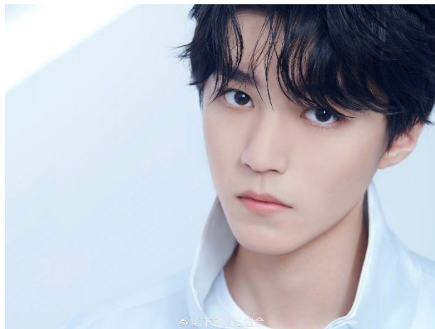
ภาพที่ 21 หวังจวินข่าย ใน ค.ศ. 2020