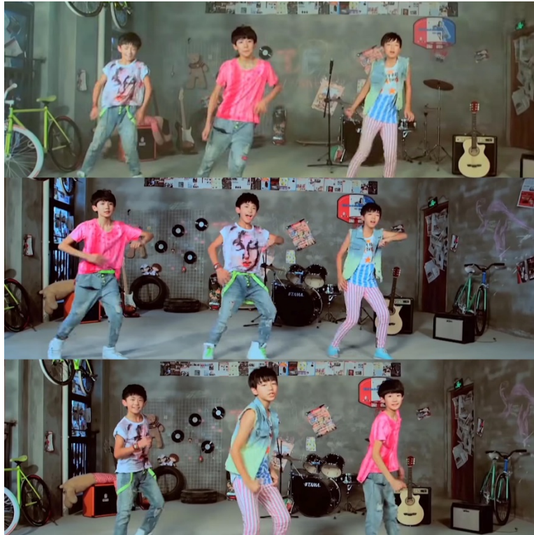
ภาพที่ 59 ภาพการเปลี่ยนตำแหน่งระหว่างเต้นในเพลง 爱出发 (Love Start) ที่มา https://www.youtube.com/watch?v=K6M364hyES8