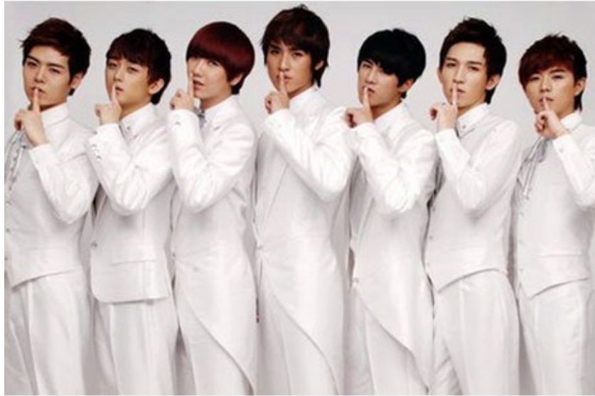
ภาพที่ 48 วงบอยกรุ๊ปจีน 8090