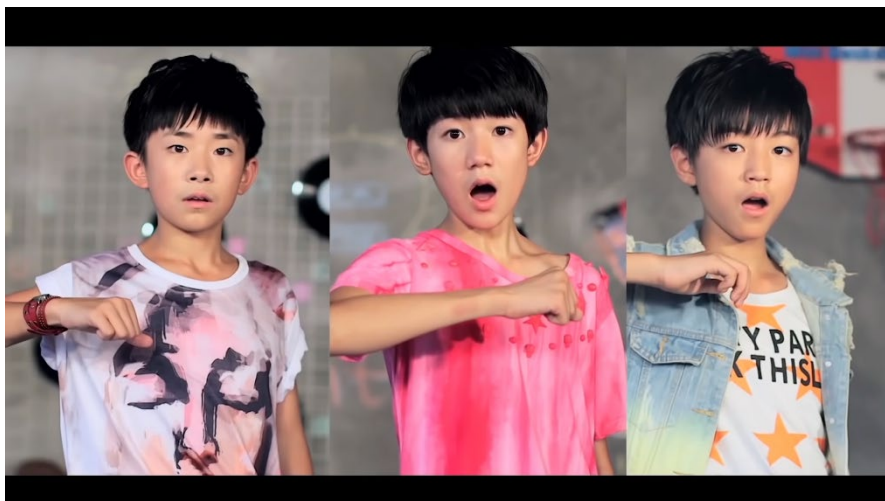
ภาพที่ 54 ในชุดแนวสตรีทที่เน้นสีชมพูเป็นหลัก

เสื้อผ้าในฉากเต้น สามารถแบ่งเป็น 2 ชุด ได้แก่ ชุดแนวสตรีทที่เน้นสีชมพูเป็นหลัก และชุดแนวสตรีทสีชาวดำที่ได้รับอิทธิพลจากศิลปินดนตรีฮิปฮอป เสื้อผ้าที่สมาชิกใส่ในเอ็มวีคล้ายคลึงกับเสื้อผ้าแนวสตรีทที่ไอดอลเกาหลีใส่ โดยเฉพาะชุดสีชาวดำ เนื่องจากเพลง K-pop ได้รับอิทธิพลจากแนวเพลงฮิปฮอปด้วย ทำให้ไอดอลหลายวงใส่เสื้อผ้าฮิปฮอปที่เน้นชุดวอร์ม หมวก โซ้และสร้อยคอ