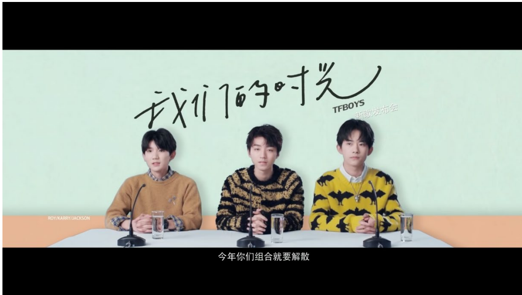
ภาพที่ 70 ฉากงานแถลงข่าวในมิวสิกวิดีโอเพลง 我们的时光 (Our Time)