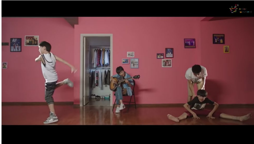
ภาพที่ 39 วิดีโอเปิดตัววง TFBoys “十年”

มิวสิกวิดีโอเพลง Heart กำกับโดย หวง ทุ่น (黄暉) ซึ่งเคยกำกับมิวสิกวิดีโอหลายตัวของสมาชิกในวง ขณะที่ยังเป็นเด็กฝึกหัดอยู่ และยังคงกำกับวิดีโอเปิดตัววง TFBoys ที่ชื่อว่า “十年 (10 ปี)” เช่นกัน