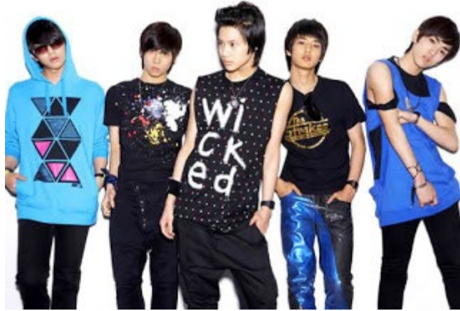
ภาพที่ 2 วงไอดอลเกาหลี SHINee ใน ค.ศ. 2008