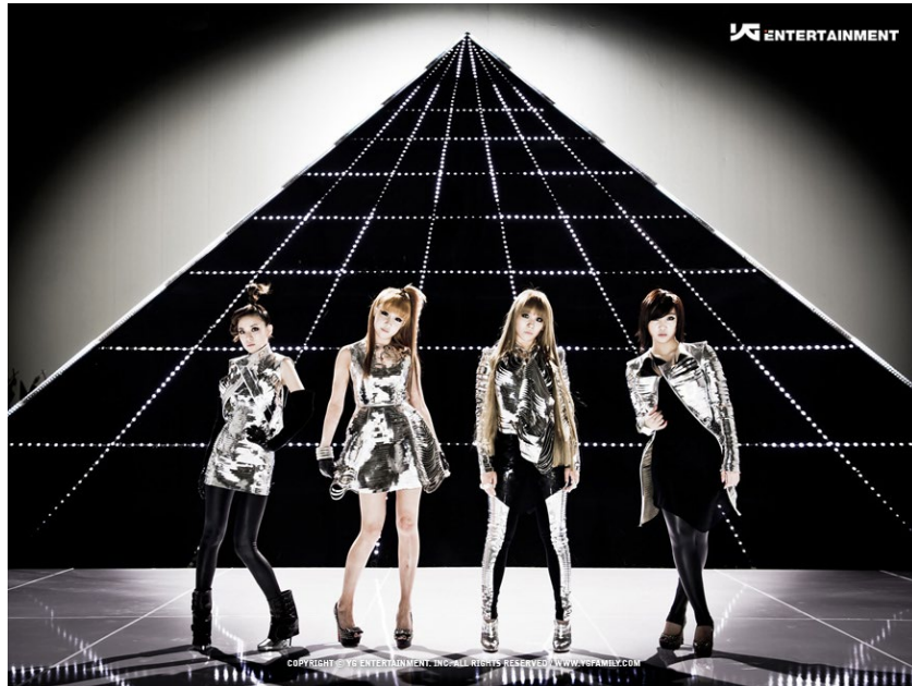
ภาพที่ 15 วง 2NE1 ใน ค.ศ. 2011