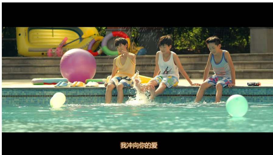
ภาพที่ 41 ฉากที่สมาชิกในวงเล่นน้ำในสระน้ำ

และในฉากที่วง TFBoys ทำกิจกรรมต่าง ๆ ร่วมกัน เช่น ปั่นจักรยาน เล่นสเกตบอร์ด โดยเฉพาะอย่างยิ่ง ฉากที่สมาชิกในวงเล่นน้ำในสระน้ำ และฉีบน้ำกันอย่างสนุกสนาน ทำให้เห็นว่า มิวสิกวิดีโอเน้นความเป็นฤดูร้อน อีกทั้งวงเดบิวต์ในเดือนสิงหาคม ซึ่งอยู่ในฤดูร้อนของจีน ทำให้ผู้ชมได้สัมผัสถึงความสนุกสนานท่ามกลางฤดูร้อน ทั้งหมดนี้เคยถูกผลิตซ้ำในมิวสิกวิดีโอของไอดอลเกาหลีหลายวง เช่น มิวสิกวิดีโอเพลง She's back ของ Infinite มิวสิกวิดีโอเพลง Falling in Love ของ 2ne1 เป็นต้น