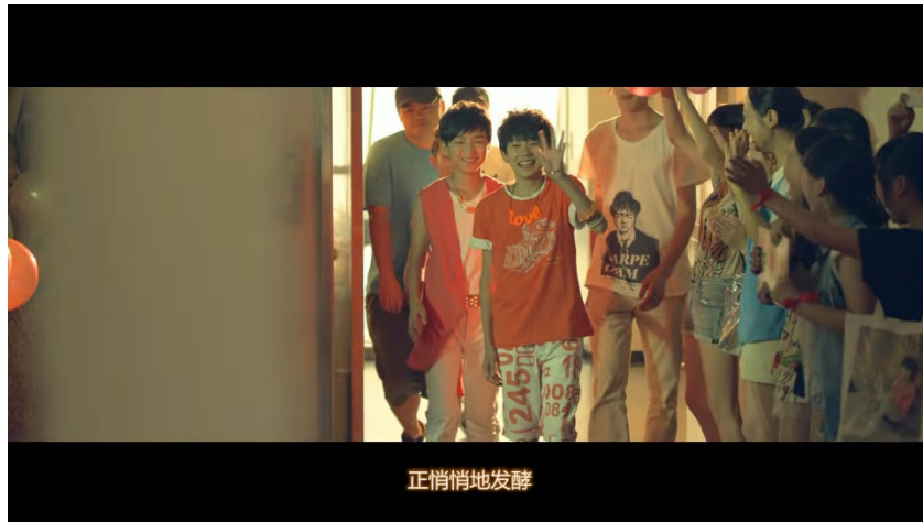
ภาพที่ 40 ฉากที่วง TFBoys เริ่มขึ้นเวทีแสดง โดยได้รับการต้อนรับที่ดีของแฟนคลับ

และในฉากที่วง TFBoys ทำกิจกรรมต่าง ๆ ร่วมกัน เช่น ปั่นจักรยาน เล่นสเกตบอร์ด โดยเฉพาะอย่างยิ่ง ฉากที่สมาชิกในวงเล่นน้ำในสระน้ำ และฉีบน้ำกันอย่างสนุกสนาน ทำให้เห็นว่า มิวสิกวิดีโอเน้นความเป็นฤดูร้อน อีกทั้งวงเดบิวต์ในเดือนสิงหาคม ซึ่งอยู่ในฤดูร้อนของจีน ทำให้ผู้ชมได้สัมผัสถึงความสนุกสนานท่ามกลางฤดูร้อน ทั้งหมดนี้เคยถูกผลิตซ้ำในมิวสิกวิดีโอของไอดอลเกาหลีหลายวง เช่น มิวสิกวิดีโอเพลง She's back ของ Infinite มิวสิกวิดีโอเพลง Falling in Love ของ 2ne1 เป็นต้น