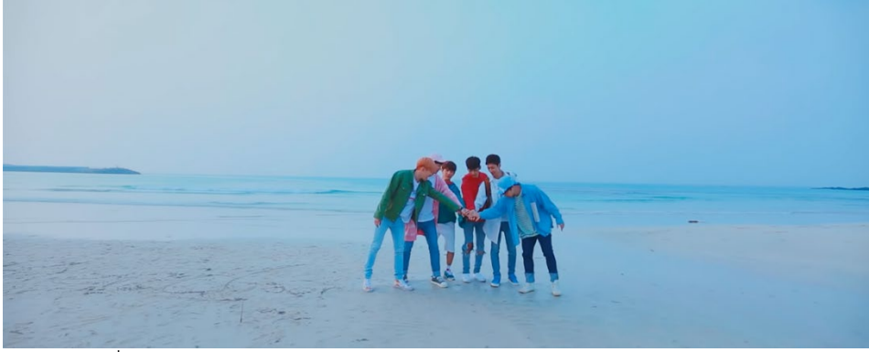
ภาพที่ 72 ภาพจากมิวสิกวิดีโอเพลง To My Bestfriend ของวง Boyfriend