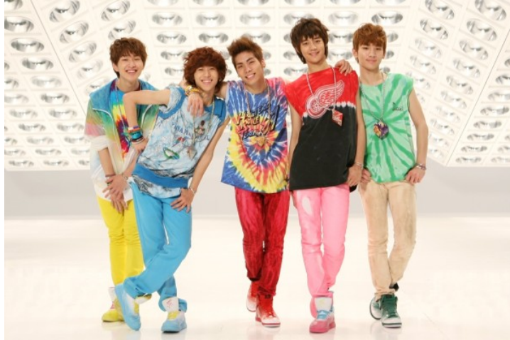
ภาพที่ 56 วง SHINee ในภาพแจ็กเก็ตเพลง Juliette