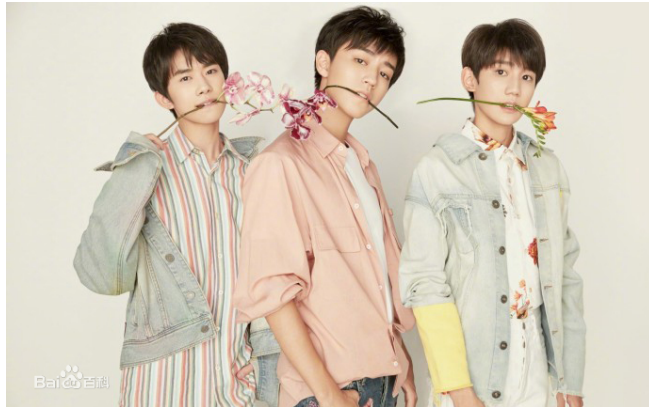
ภาพที่ 20 TFBoys ใน ค.ศ. 2017

อัลบั้มแรกอย่างเป็นทางการที่มีชื่อว่า " 我们的时光 (Our Time)" ใน ค.ศ. 2018 พวกเขาได้แสดงในภาพยนตร์แอ็คชั่นแฟนตาซีเรื่อง “爵迹 2: 冷血狂宴 (L.O.R.D.: Legend of Ravaging Dynasties 2)” เมื่อวันที่ 11 มกราคม ค.ศ.2020 พวกเขาได้รับรางวัล 2019 Weibo Night Weibo 10-year Influential Combination Award