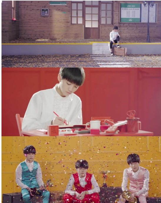
ภาพที่ 60 ภาพจากมิวสิกวิดีโอเพลง 样 (Young)