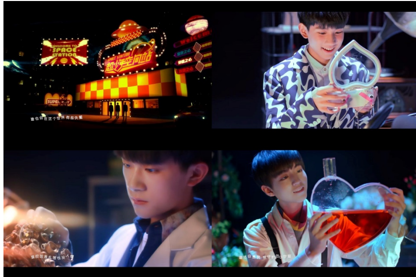
ภาพที่ 65 ภาพจากมิวสิกวิดีโอเพลง 是你 (It's You)