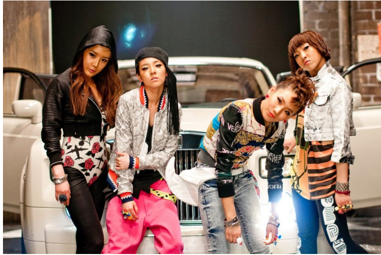
ภาพที่ 7 วง 2NE1 ใน ค.ศ. 2009