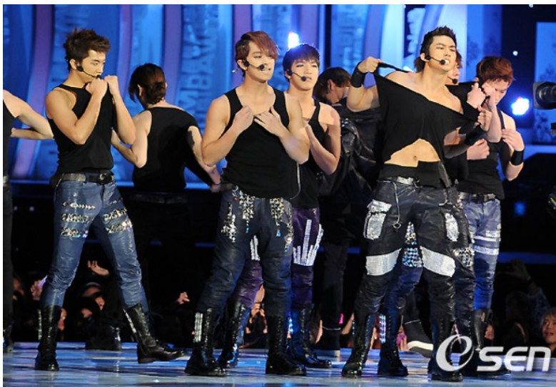
ภาพที่ 12 วง 2pm ใน ค.ศ. 2010 กำลังแสดงในงาน 2010 Mnet Asian Music Awards