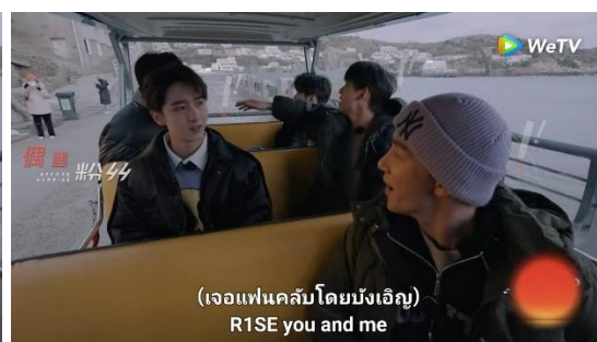
(เจอแฟนคลับโดยบังเอิญ) R1SE you and me