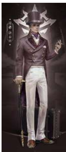
ภาพที่17 Dwayne Dantès เศรษฐีปริศนา

สกปรก เขาจึงได้เดินทางมาบัคแลนด์เพื่อที่จะทำให้มันโปร่งใสและไร้คดี โดยเขาได้ไต่เต้าฐานะในสังคมและธุรกิจผ่านจากการเข้าสมาคมที่เพื่อนบ้านใหม่ของเขาได้แนะนำ ได้เข้าร่วมองค์กรการกุศล เพื่อที่จะเส้นสายและสร้างความสัมพันธ์กับขุนนางและเศรษฐีคนอื่นๆเพื่อที่จะยึดหยัดในบัคแลนด์ในฐานะผู้ร่ำรวยและใจดีที่คอยบริจาคเงินเพื่อการกุศลให้อยู่เสมอ หากตรวจสอบให้ลึกลงไปกว่านี้ จะทราบว่า ความจริงแล้ว ดเวย์น ดานตันั้น เป็นพวกต้มตุ๋นที่ปลอมตัวมาเป็นคนรวยเพื่อหลอกให้คนมาร่วมลงทุน