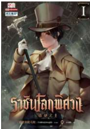
ภาพที่ 2 ภาพปกนิยายเรื่อง Lord of the mysteries (ราชันย์แห่งลึกลับ) ฉบับแปลไทย เล่ม ตีพิมพ์โดย สำนักพิมพ์ สยามอินเตอร์บุ๊ค (Siam Inter-Book)