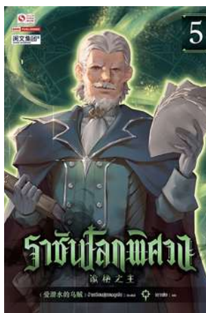
ภาพที่16 ดยุกเนแกน ขุนนางที่มีอำนาจมากที่สุด

การตายของเขาสร้างความแตกแยกในหมู่ขุนนางทั้งหลาย โดยมีขุนนางหลายสิบคนในสภาขุนนางได้มีการเสนอให้ ผู้ที่ได้ตำแหน่งขุนนางใหม่ ก็สามารถที่จะลงชิงตำแหน่งสมาชิกผู้แทนราษฎรได้ และนี่เองก็ได้สร้างความวุ่นวาย