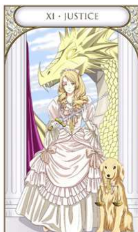
ภาพที่6 Audrey Hall สมาชิกของกลุ่ม Tarot Club

Audrey Hall เป็นผู้เหนือมนุษย์ที่อยู่ในเส้นทาง “ผู้ช่างคิด (Visionary Pathway) เธอเป็นหนึ่งในสมาชิกของกลุ่ม tarot club มีฐานะที่ร่ำรวยและมีรากฐานเป็นขุนนาง มีความเชื่อในแนวความคิดเรื่อง ความเท่าเทียมกันในหมู่ผู้คน มีนิสัยที่ยึดติดกับความยุติธรรมและอ่อนต่อโลก มีความเห็นใจต่อความยากลำบากของผู้คนในประเทศบ้านเกิดของเธอ