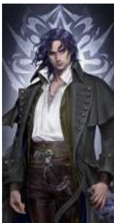
ภาพที่ 7 Alger Wilson สมาชิกของกลุ่ม Tarot Club

Alger Wilson เป็นผู้เหนือมนุษย์ที่อยู่ในเส้นทางของ “ทรวาซย์” (Tyrant Pathway) เป็นกัปตันเรือผู้ล้างแค้นสี่คราม (Blue Avenger) ที่เคยขึ้นตรงกับ โปสต์แห่งวายุ เป็นหนึ่งในสมาชิกรุ่นแรกของ tarot club มีชื่อเล่นในกลุ่มว่า “คนห้อยหัว” (Hanged Man) ในปัจจุบันเป็นสังหารของโปสต์แห่งเทพแห่งมหาสมุทร