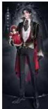
ภาพที่10 Emlyn White สมาชิกของกลุ่ม Tarot Club

Emlyn White เป็นแวมไพร์ที่อยู่ในเส้นทางของ “ดวงจันทร์” (Moon Pathway) เป็นสังฆานุกรระดับสูงของ โบสถ์แห่งการเก็บเกี่ยว ได้เข้ากลุ่ม tarot club ผ่านการทำนายของบรรพบุรุษของแวมไพร์ ลิลิตมีงานอดิเรก คือการสะสมตุ๊กตา