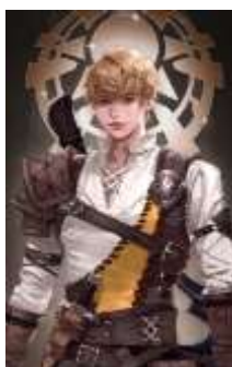
ภาพที่ 8 Derrick Berg สมาชิกของกลุ่ม Tarot Club

Derrick Berg เป็นผู้เหนือมนุษย์ที่อยู่ในเส้นทางของ “ดวงอาทิตย์” (The Sun Pathway) เป็นเด็กหนุ่มที่อยู่ในทวีปที่ถูกปิดผนึกเอาไว้ มีอีกชื่อหนึ่งว่า ดินแดนที่พระเจ้าทอดทิ้ง (Forsaken Land of Gods) ต่อมาได้ติดต่อกับผู้เฒ่าด้วยความบังเอิญและได้เข้าร่วมกลุ่ม Tarot Club โดยมีเป้าหมายที่จะปลดปล่อยผู้คนของเขาและดินแดนบ้านเกิดของเขาให้พ้นจากความมืดมิดนี้