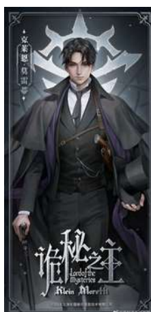
ภาพที่ 5 Klein Moretti หัวหน้าของกลุ่ม Tarot Club

‘ไคลน์ โมเรตตี (Klein Moretti) เป็นพระเอกในเรื่องราชนย์โลกพิศวง เขาเป็นผู้เหนือมนุษย์ และ เทพแห่งเส้นทางของผู้โง่เขลา (Fool Pathway) เป็นผู้นำปริศนาขององค์กรลับที่มีชื่อว่า The tarot club โดยทราบกันในฐานะ “ผู้โง่เขลา” (The Fool) และผู้ข้ามโลกที่มาจากยุคปัจจุบัน