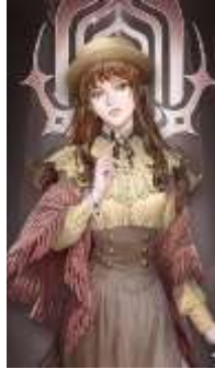
ภาพที่9 Fors Wall สมาชิกของกลุ่ม Tarot Club

Fors Wall เป็นผู้เหนือมนุษย์ที่อยู่ในเส้นทางของ “ประตู” (Door Pathway) นักเขียนนวนิยายชื่อดัง เป็นลูกศิษย์ของตระกูลอับราฮัม และสมาชิกของกลุ่ม Tarot club