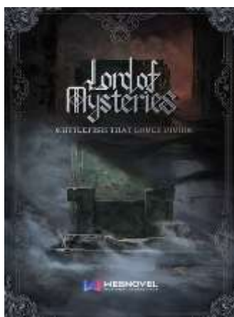
ภาพที่ 3 ภาพปกนวนิยาย เรื่อง Lord of the mysteries (ราชันย์แห่งลึกลับ) ฉบับภาษาอังกฤษ เผยแพร่โดย web novel