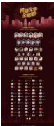
ภาพที่ 15 网络文字全明星