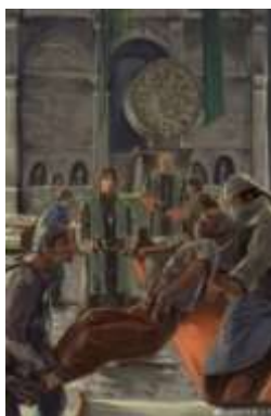
ภาพที่ 14 The Great Smog of Buckland

ความจริงมากแต่ไหนก็ตาม นอกจากนี้ชื่อเรื่องของเล่มนี้เป็นเหมือนตัวบอกการใช้ชีวิตความเป็นอยู่และการตายของบุคคลที่ด้อยตําน้อยค่าในสังคมปัจจุบันที่พระเอกอาศัยอยู่