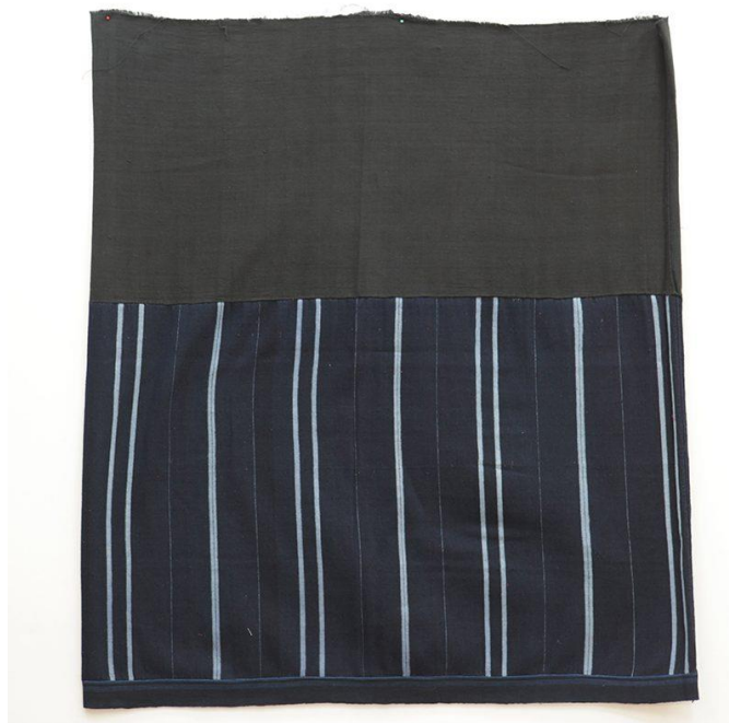
ผ้าชิ้นแดงโม (ไทดำ) จากจังหวัดเพชรบุรี ประเทศไทย