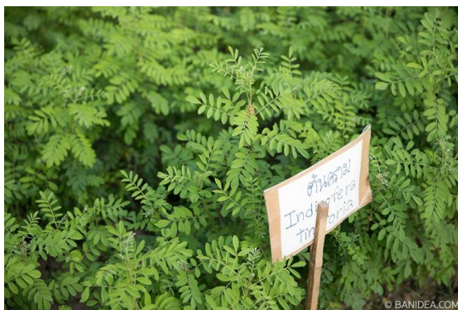
ต้นคราม ใช้สำหรับย้อมผ้า

สุमित ปิติพัฒน์ ,อนุชา ทิรคานนท์ และเทียมจิตร พ่วงสมจิตร (2553) ได้อธิบายไว้ดังนี้ : ชาวไทดำ หรือ ชาวลาวโซ่ง เป็นกลุ่มชาวไทยกลุ่มหนึ่ง ที่มีถิ่นฐานดั้งเดิมอยู่ในเขตสิบสองจุไทยเดิม หรือ บริเวณลุ่มแม่น้ำดำ และแม่น้ำแดงในเวียดนามเหนือ ซึ่งเป็นถิ่นที่อยู่ดั้งเดิมของชาวไทยมี ชาวไทดำ ชาวไทแดง และชาวไทขาว ช่วงสมัยที่ฝรั่งเศสเข้ามาปกครองเวียดนาม และลาว พวกเขาได้เรียกชนเผ่าที่อยู่บริเวณลุ่มแม่น้ำดำว่า ไทดำ ที่เรียกว่าไทดำ เพราะในกลุ่มชนเผ่าไทดังกล่าวนิยมสวมเสื้อผ้าสีดำอันเป็นเอกลักษณ์ ซึ่งย้อมด้วยต้นหอมหรือต้นคราม