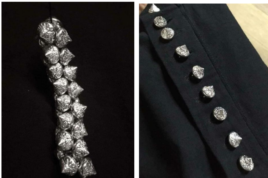
กระดุม เอกลักษณ์ที่โดดเด่นของชาวไทดำ