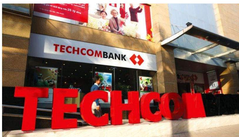
ภาพที่ 2 ธนาคาร Techcombank

Techcombank (TCB) ก่อตั้งเมื่อปี ค.ศ. 1993 โดยชาวเวียดนามโพ้นทะเลจากประเทศรัสเซียที่กลับเข้ามาลงทุนในประเทศเวียดนาม