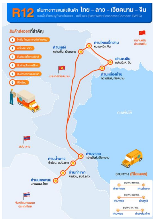
ภาพที่ 8 เส้นทางขนส่งสินค้า R12