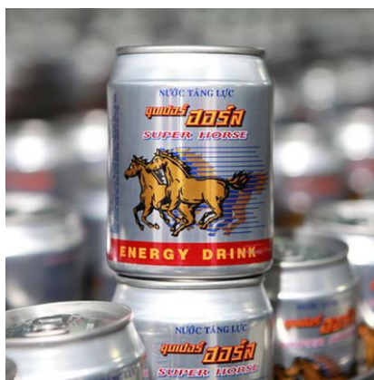
ภาพที่ 9 เครื่องดื่มชูกำลัง Super Horse Energy Drink