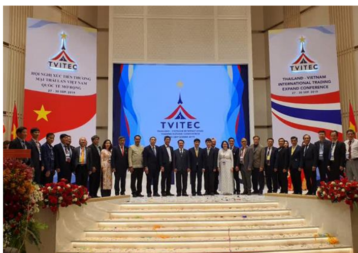
ภาพที่ 11 การประชุมใหญ่สมานพันธ์นักธุรกิจเวียดนามโพ้นทะเลประจำปี ค.ศ. 2019

ด้วยศักยภาพทางเศรษฐกิจและธุรกิจของชาวไทยเชื้อสายเวียดนามยังนำไปสู่การจัดตั้งสมาคมนักธุรกิจไทยเวียดนามแห่งประเทศไทย (Business Association of Thai Vietnam – BAOTV) เมื่อปี ค.ศ. 2009 และได้รับใบอนุญาตอย่างเป็นทางการในปี ค.ศ. 2014 เพื่อทำหน้าที่ประสานความร่วมมือระหว่างสมาชิก และระหว่างสมาคมกับองค์กรธุรกิจของไทยและเวียดนาม อีกทั้งสมาคมนี้ยังเป็นที่ยอมรับในหมู่นักธุรกิจเวียดนามโพ้นทะเลในประเทศต่าง ๆ โดยได้เข้าร่วมสมานพันธ์นักธุรกิจเวียดนามโพ้นทะเล (Business Association of Overseas Vietnamese – BAOTV) นอกจากนี้ สมาคมฯ ยังได้รับเลือกให้เป็นเจ้าภาพการจัดประชุมใหญ่สมานพันธ์นักธุรกิจเวียดนามโพ้นทะเลประจำปี ค.ศ. 2019 ระหว่างวันที่ 27 – 30 กันยายน ค.ศ. 2019 ที่จังหวัดอุดรธานี โดยมีผู้เข้าร่วมกว่า 500 คน จาก 28 ประเทศ และมีนายเหวียน ก๊วก เกื่อง (Nguyễn Quốc Cường) รัฐมนตรีช่วยว่าการกระทรวงการต่างประเทศเวียดนามที่ดำรงตำแหน่งประธานคณะกรรมการกิจการชาวเวียดนามโพ้นทะเลแห่งชาติเวียดนามเดินทางมาเป็นประธานในพิธีเปิด (ณัฐพล ณ สงขลา, 2563)