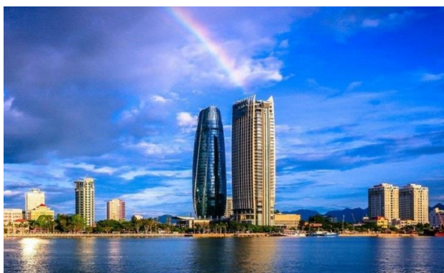
ภาพที่ 3 Novotel Danang Premier Han River

ที่มา : https://sayhellovietnam.com/novotel-danang-premier-han-river-detailed-reviews/