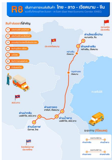
ภาพที่ 7 เส้นทางขนส่งสินค้า R8