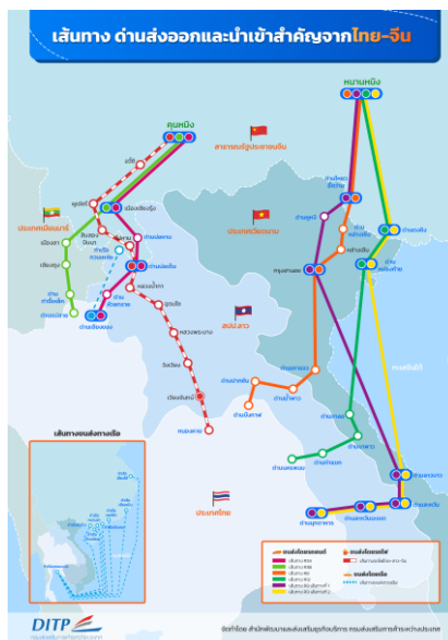
ภาพที่ 6 แผนที่แสดงเส้นทางด้านส่งออกและนำเข้าสำคัญไทย-จีน

นอกจากนี้ ชาวไทยเชื้อสายเวียดนามยังมีส่วนร่วมในการกระชับความร่วมมือในระดับพหุภาคีกับจังหวัดต่าง ๆ ของเวียดนาม เช่น เหงะอาน ท่าติ่ง และกว๋างบิ่ง เป็นต้น