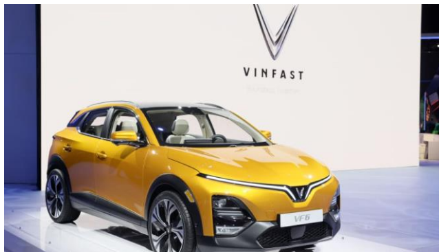
ภาพที่ 5 รถยนต์แบรนด์ Vinfast