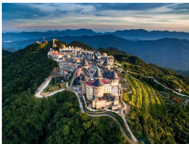
ภาพที่ 4 Ba Na Hills Mountain Resort