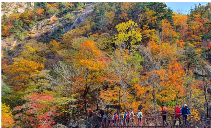
ภาพที่ 8 อุทยานแห่งชาติซอร์คซาน