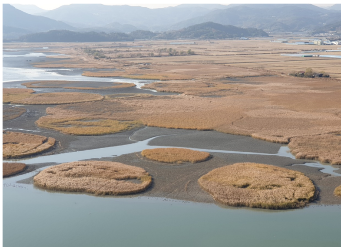
ภาพที่ 9 เขตอนุรักษ์พื้นที่ชุ่มน้ำอ่าวซุนซอน