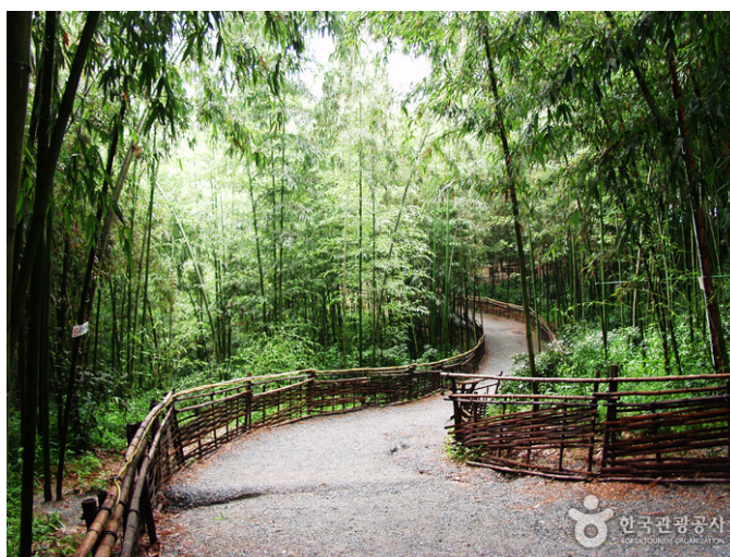
ภาพที่ 4 สวนป่าไผ่จุนกวอน