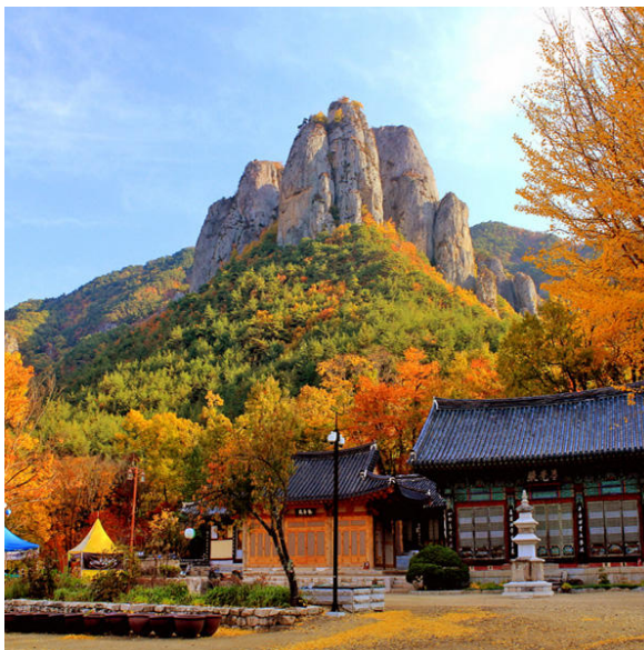
ภาพที่ 10 วัดแทจอนที่อุทยานแห่งชาติจูวังซาน