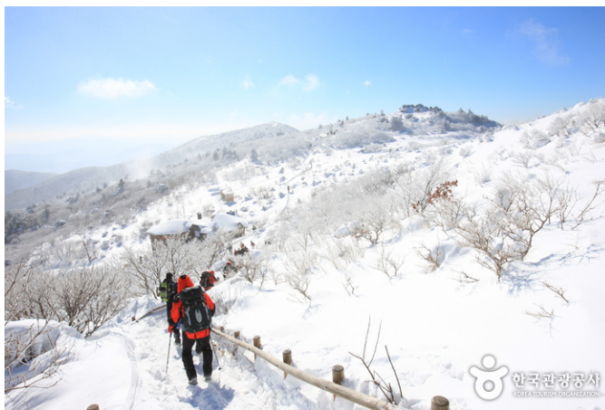
ภาพที่ 12 อุทยานแห่งชาติดอกยูซาน