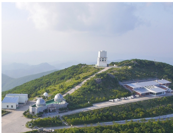
ภาพที่ 3 หอสังเกตการณ์ทางดาราศาสตร์โซแบคซาน