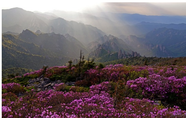
ภาพที่ 2 อุทยานแห่งชาติซอร์คซาน