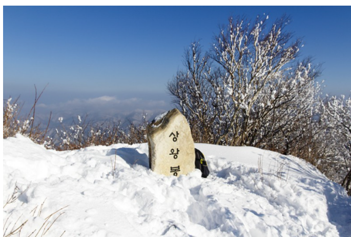
ภาพที่ 13 ยอดเขาซังวังบง อุทยานแห่งชาติโอแดซาน