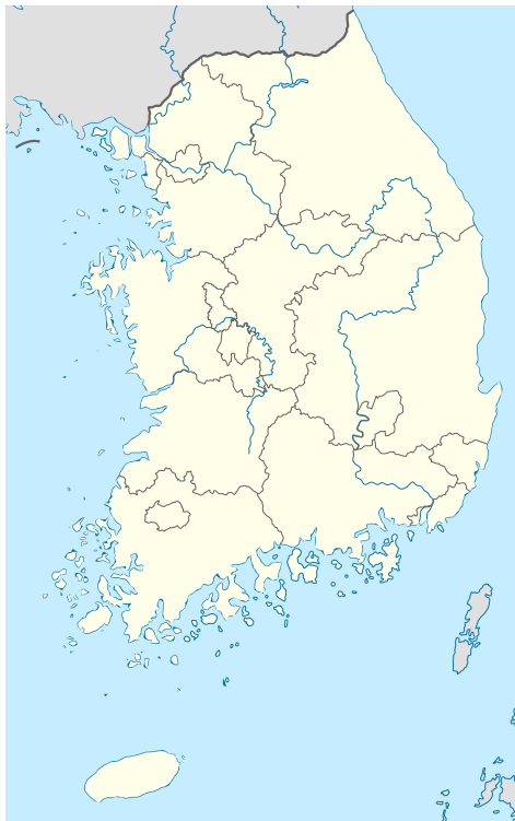
ภาพที่ 1 แผนที่ประเทศเกาหลีใต้