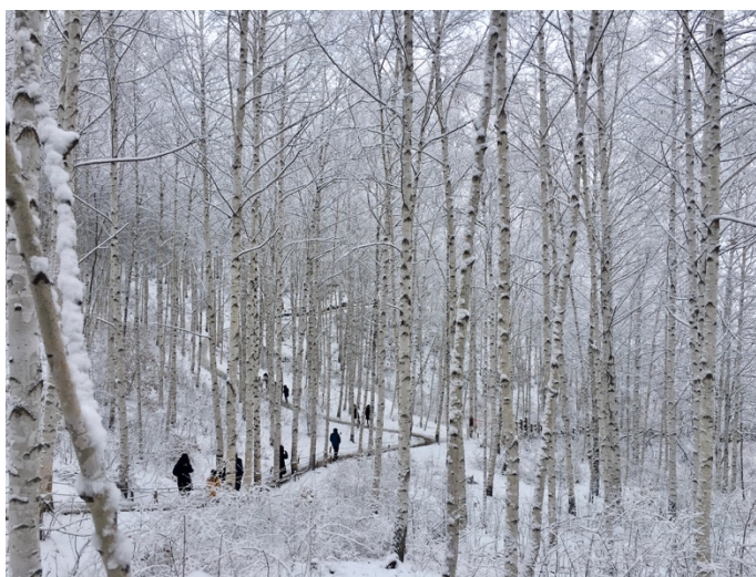
ภาพที่ 11 ป่าต้นเบิร์ชวอนแดรี