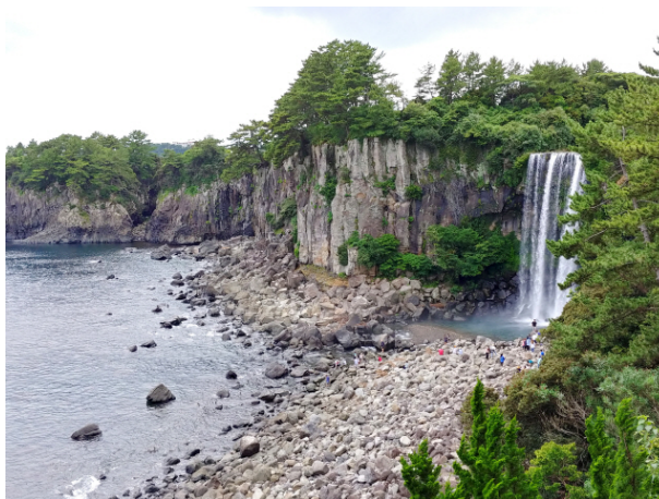
รูปที่ 7 น้ำตกจองบัง