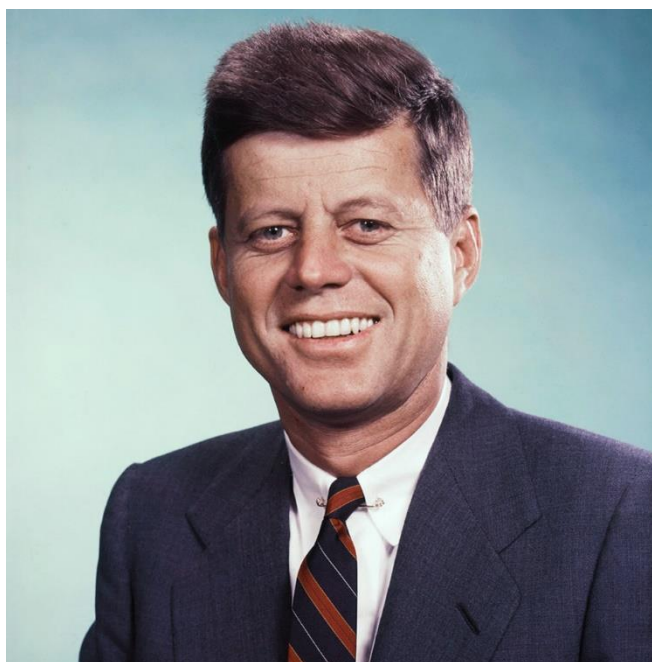
ภาพที่ 3 John F. Kennedy: การเมืองของประธานาธิบดีคนที่ 35 แห่งสหรัฐอเมริกา