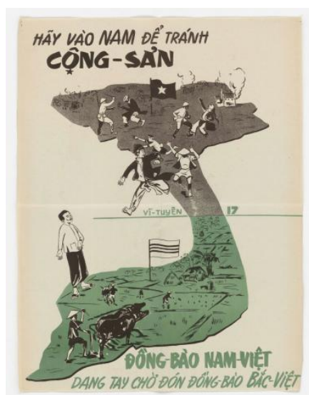
ภาพที่ 4 การโฆษณาชวนเชื่อของสหรัฐอเมริกาในสงครามเวียดนาม