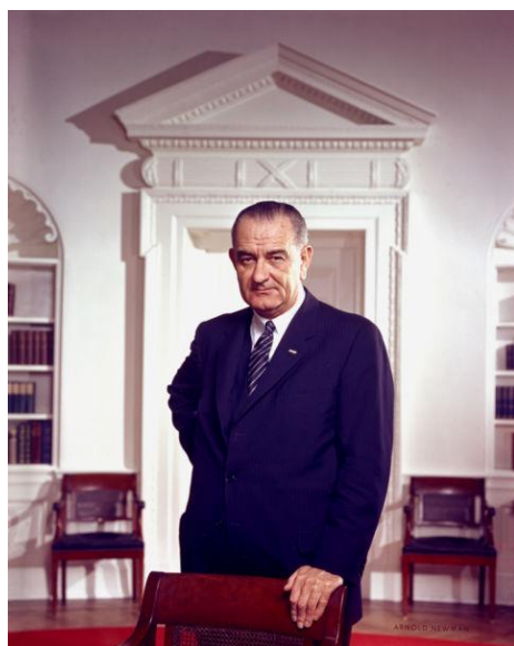
ภาพที่ 8 ประธานาธิบดีสหรัฐ ลินดอน เบนส์ จอห์นสัน

เมื่อลินดอน บี จอห์นสัน (Lyndon B. Johnson) ขึ้นมาดำรงตำแหน่งเป็นประธานาธิบดี ของสหรัฐอเมริกาแทนที่ประธานาธิบดีเคนเนดีที่ถูกลอบสังหาร การขึ้นมาดำรงตำแหน่งของ จอห์นสัน ได้ส่งผลให้ สงครามเวียดนามทวีความรุนแรงมากขึ้น เพราะประธานาธิบดีจอห์นสัน ประกาศเพิ่มความช่วยเหลือแก่รัฐบาล เวียดนามใต้และเพิ่มปฏิบัติการทางทหารเพื่อต่อต้าน ระบอบคอมมิวนิสต์เพราะตามทัศนคติของจอห์นสัน เวียดนามใต้ คือ จุดศูนย์กลางสำคัญที่จะไม่ให้คอมมิวนิสต์เข้าไปประเทศอื่นในภูมิภาคเอเชียตะวันออกเฉียง ใต้ เมื่อ สหรัฐฯ แสดงตนว่าเป็นผู้นำในการต่อต้านลัทธิคอมมิวนิสต์สหรัฐฯ ได้พยายามอย่างเต็มที่เพื่อ ป้องกันไม่ให้เวียดนามใต้กลายเป็นคอมมิวนิสต์ (นิชฐนาถ 2555 : 130)