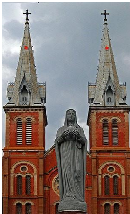
ภาพที่ 5 รูปปั้นพระแม่มารี ณ วิหาร นอเทรอดัม ใจกลางกรุงฮานอย