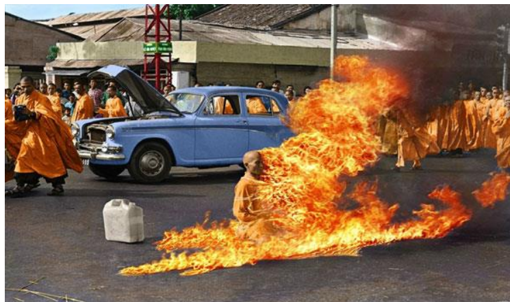
ภาพที่ 4 พระโพธิสัตว์ ตึก กว่าง คือ สละชีวิตจุดไฟเผาตัวเอง