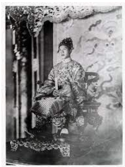
ภาพที่ 2 จักรพรรดินีบัวด้าย

ต้นปี ค.ศ. 1950 มีความหวั่นเกรงการขยายตัวของลัทธิคอมมิวนิสต์เข้ามายังเอเชีย โดยเฉพาะเอเชียตะวันออกเฉียงใต้ในหมู่ผู้นำสหรัฐอเมริกาที่สูงขึ้น โดยเฉพาะหลังจากที่ เหมาเจ๋อตง 3 นำพรรคคอมมิวนิสต์ยึดอำนาจจากฝ่ายจีนคณะชาติในเดือนตุลาคม ค.ศ.1949 และ เหตุการณ์เกาหลีเหนือบุกเกาหลีใต้จนเกิดเป็นสงครามเกาหลีในกลางปี ค.ศ.1950 ทศนะของสหรัฐอเมริกาการมี รัฐบาลภายใต้ระบอบคอมมิวนิสต์ปกครองอยู่ในเวียดนามเหนือ นับเป็นภัยคุกคามฝ่ายเสรีประชาธิปไตย ในเอเชียตะวันออกเฉียงใต้เป็นอย่างมาก และนี่เป็นเหตุชักจูงใจให้สหรัฐอเมริกาหันมาสนใจเวียดนามใต้ มากขึ้นในฐานะเป็นด่านสกัดกั้น มิให้คอมมิวนิสต์จากทางเหนือ มิใช่เฉพาะเวียดนามเหนือ แต่หมายถึง จากจีนและสหภาพโซเวียต สามารถขยายตัวลง ไปยังประเทศอื่น ๆ ในเอเชียตะวันออกเฉียงใต้ ตามความเชื่อใน ทฤษฎีโดมิโนที่ว่าหากประเทศใดประเทศหนึ่งเป็นคอมมิวนิสต์ ประเทศที่อยู่ใกล้เคียงก็พลอยเป็น คอมมิวนิสต์ไปด้วย ( กรกข 2556 : 48 )