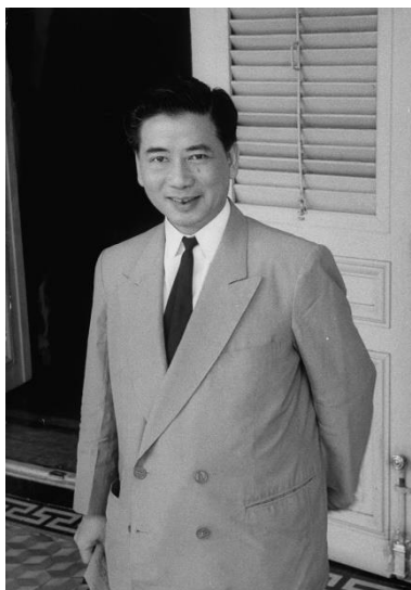
ภาพที่ 1 ประธานาธิบดี โง ดินห์ เดียม