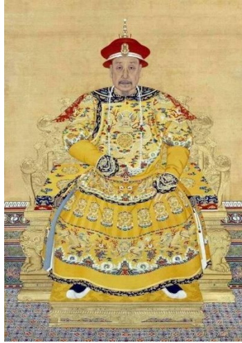
ภาพที่ 2 : พระบรมสาทิสลักษณ์ของจักรพรรดิเฉียนหลง