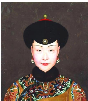
ภาพที่ 1 : พระสาทิสลักษณ์ของจักรพรรดินีน่าลา