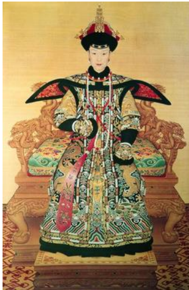
ภาพที่ 3 : พระสาทิสลักษณ์ของจักรพรรดินีฟูฉา