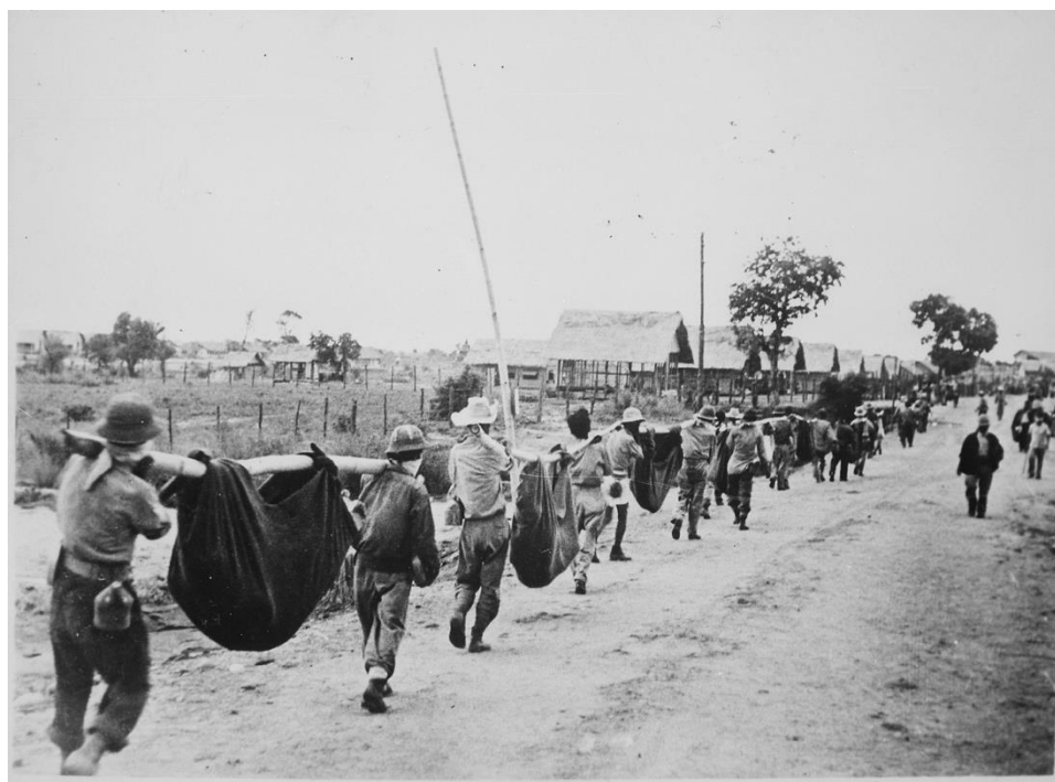
ภาพที่ 2 : เชลยศึกชาวอเมริกันและฟิลิปปินส์ใช้แคร่ชั่วคราวหามเพื่อน ๆ ของพวกเขาที่เสียชีวิตในค่ายโอ ดอน เนลล์ ไปฝัง

ลักษณะคับแคบและไม่ถูกสุขอนามัย มุ่งไปทางเหนือจนถึงเมืองคาปาส และจากที่นั่นพวกเขาต้องเดินต่อไปอีก 11 กิโลเมตรไปยังค่ายโอ ดอน เนลล์ อดีตศูนย์ฝึกทหารฟิลิปปินส์ซึ่งกองทัพญี่ปุ่นใช้ฝึกเชลยศึกชาวฟิลิปปินส์และอเมริกันระหว่างการเดินขบวนใหญ่ ซึ่งกินเวลายาวนานกว่า 5 ถึง 10 วัน ขึ้นอยู่กับว่านักโทษคนนั้น ๆ เข้าร่วมขบวนตอนที่พวกเขาอยู่ที่ไหน นักโทษเหล่านั้นมักถูกทุบตี, ถูกยิง, ถูกเขี่ย, อย่างโหดร้ายและในบางกรณีถูกตัดศีรษะ และคนส่วนใหญ่ที่รอดไปจนถึงค่ายก็จะเสียชีวิตในภายหลังเนื่องจากความอดอยากและอาการเจ็บป่วย โดยมีนักโทษเพียง 54,000 คนเท่านั้นที่มาถึงค่าย แม้จะไม่ทราบจำนวนตัวเลขที่แน่นอนแต่น่าจะเป็นชาวฟิลิปปินส์ประมาณ 2,500 คนและชาวอเมริกัน 500 และคนที่เสียชีวิตระหว่างการเดินขบวนอีกกว่า 26,000 คน ซึ่งมีชาวฟิลิปปินส์และชาวอเมริกัน 1,500 คนเสียชีวิตที่ค่ายโอ ดอน เนลล์