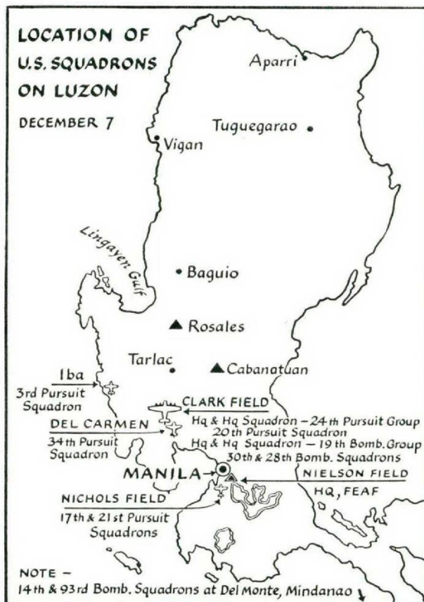
ภาพที่ 1 : ตำแหน่งที่ตั้งฐานทัพอากาศ Clark บนเกาะลูซอน