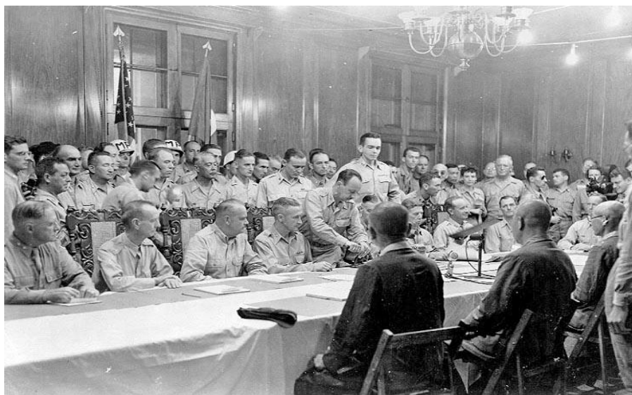
ภาพที่ 6 : พิธีลงนามต่อการยอมจำนนอย่างเป็นทางการของกองทัพจักรวรรดิญี่ปุ่นต่อหน้าเหล่านายพลของกองทัพสหรัฐ ภายในที่แคมป์จอห์น เฮย์

โดยนายพลแห่งกองทัพจักรวรรดิญี่ปุ่น โทโมยุกิ ยามาซิตะ ได้ลงนามในตราสารยอมจำนนอย่างเป็นทางการในเมืองบาเกียวบนเกาะลูซอน เหตุการณ์นี้เกิดขึ้นภายในที่พักของคณะกรรมการอเมริกันที่แคมป์จอห์น เฮย์ ที่ตั้งอยู่ในเมืองบาเกียวต่อหน้านายพลอาเธอร์ เพอร์ซิลวาลและนายพล โจนาธาน เวน ไรท์