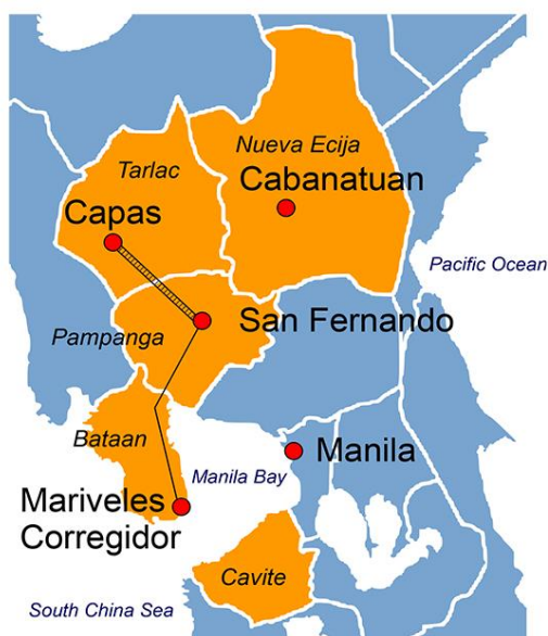
ภาพที่ 3 : แผนที่แสดงเส้นทางการเดินทางขบวนมรณะแห่งบาตาอัน

ไม่มีรายงานถึงจำนวนที่แน่นอนของผู้เสียชีวิตทั้งหมดที่เกิดขึ้นระหว่างการเดินทางและการกักขังในค่ายกักกัน จากข้อมูลระบุว่า มีชาวอเมริกันกว่า 500 คนและทหารฟิลิปปินส์ 2,500 คนถูกฆ่าในค่ายโอ ดอน เนลล์ และมีทหารชาวฟิลิปปินส์กว่า 26,000 จาก 50,000 นายและชาวอเมริกันประมาณ 1,500 นายต้องจบชีวิตลงเพราะความอดอยากและโรคร้ายไข้เจ็บในค่ายนรกแห่งนี้ โดยในภาพรวม มีชาวอเมริกันประมาณ 22,000 คน (ทหาร, กะลาสี, ทหารอากาศ, นาวิกโยธิน) ที่ถูกกองกำลังญี่ปุ่นจับเป็นเชลยศึกในคาบสมุทรบาตาอันและมีเพียง 15,000 คนเท่านั้นที่กลับมายังสหรัฐอเมริกาได้อย่างปลอดภัยคิดเป็นสองในสามของนักโทษชาวอเมริกันได้เสียชีวิตภายใต้การคุมครองของญี่ปุ่น