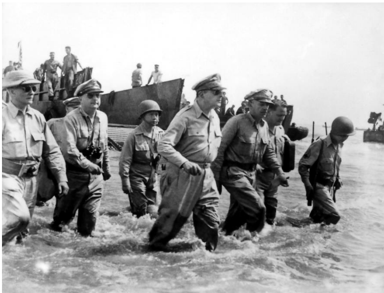
ภาพที่ 5 : การกลับมาของนายพลแมคอาเธอร์