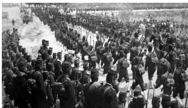
ภาพที่ 6, 7 บันทึกภาพถ่ายเมื่อครั้งประเทศญี่ปุ่นบุกเข้ายึดประเทศเกาหลี