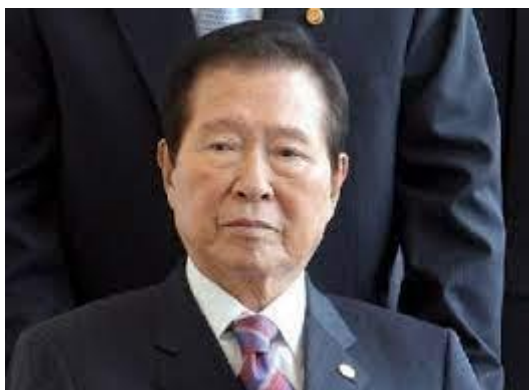
ภาพที่ 11 คิมแดจุง ประธานาธิบดีแห่งประเทศ เกาหลีใต้ปีคริสต์ศักราช 1998 – 2003

การจัดการประชุมสุดยอดผู้นำเกาหลีเกิดขึ้นครั้งแรกเมื่อวันที่ 13 เดือนมิถุนายน ปีคริสต์ศักราช 2000 เป็นการพบกันระหว่างผู้นำจากประเทศเกาหลีเหนือ คิมจอง-อิล และประธานาธิบดีจากประเทศเกาหลีใต้ คิมแด-จุง ที่เมืองเปียงยาง ประเทศเกาหลีเหนือ