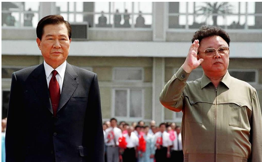
ภาพที่ 13 คิมแดจุง(ซ้าย) และคิมจองอิล(ขวา)

ณ เมืองเปียงยาง ประเทศเกาหลีเหนือ เพื่อเข้าร่วมการประชุมสุดยอดผู้นำเกาหลี