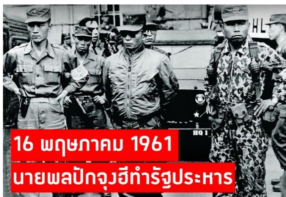
ภาพที่ 10 นายพลปักจุงฮีนำทัพเข้ายึดอำนาจรัฐสภา

คิมแด-จุงเริ่มเข้าสู่เส้นทางทางการเมืองครั้งแรกในปีคริสต์ศักราช 1954 ในฐานะของผู้ที่ไม่ประสบความสำเร็จในการเลือกตั้งแห่งชาติของประเทศเกาหลีใต้