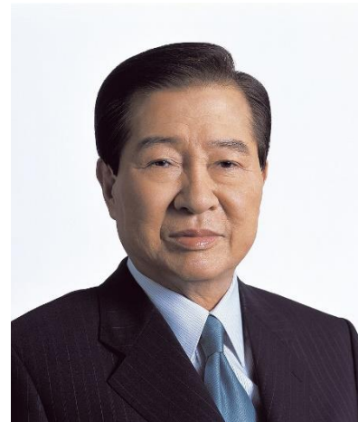
ภาพที่ 9 คิมแดจุง

คิมแด-จุง (อังกฤษ : Kim Daejung เกาหลี : 김대중) เกิดเมื่อวันที่ 6 มกราคม ปีคริสต์ศักราช 1924 (แต่ได้เปลี่ยนแปลงวันเกิดเป็น 3 ธันวาคม ปีคริสต์ศักราช 1925 เพื่อหลีกเลี่ยงการเข้าการเกณฑ์ทหารในระหว่างที่ประเทศเกาหลีใต้ถูกปกครองโดยประเทศญี่ปุ่น 14 ) ที่เกาะฮาอึย เมืองชินอัน จังหวัดซ็อลลา (ซ็อลลาใต้ ปัจจุบัน) ประเทศเกาหลีใต้ สำเร็จการศึกษาจากโรงเรียนพณิชยมีกโพในปีคริสต์ศักราช 1943 ด้วยคะแนนสูงสุดของชั้นเรียน จากนั้นเข้าทำงานในตำแหน่งเสมียน บริษัทขนส่งทางเรือของประเทศญี่ปุ่นในช่วงที่ถูกปกครองโดยประเทศญี่ปุ่น ต่อมาได้กลายเป็นเจ้าของธุรกิจและร่ำรวยขึ้นอย่างมากในปีคริสต์ศักราช 1948 จึงต้องหนีการจับกุมของกลุ่มคอมมิวนิสต์ในช่วงที่เกิดสงครามเกาหลีขึ้น