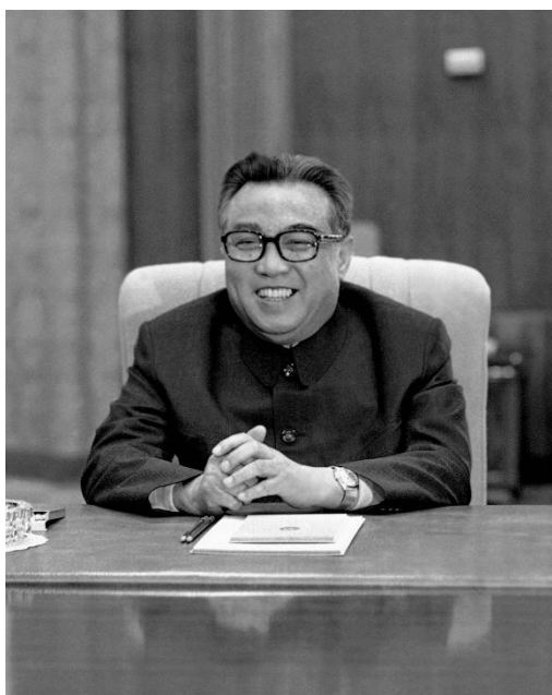
ภาพที่ 8 คิมอิลซอง ผู้นำคนแรกแห่งประเทศเกาหลีเหนือ ที่มา:

ว่า โรมานเโก (Romanenko) ที่ได้แนะนำคิมอิล-ซองต่อกลุ่มผู้นำชาตินิยมและกลุ่มคอมมิวนิสต์ พร้อมกับสรรเสริญถึงความกล้าหาญในการต่อสู้กับจักรวรรดิญี่ปุ่น หลังจากนั้นในวันที่ 14 ตุลาคม มีการจัดการชุมนุมขึ้นที่สนามกีฬาในกรุงเปียงยาง เพื่อแนะนำคิมอิล-ซองต่อประชาชน ซึ่งการที่สภาพโซเวียตนำคิมอิล-ซองต่อสาธารณชน ถือเป็นการเปิดท่าทีว่าทางโซเวียตต้องการสนับสนุนให้คิมอิล-ซองเป็นผู้นำในประเทศเกาหลีทางตอนเหนือ