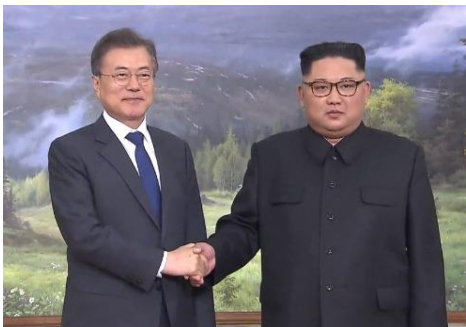
ภาพที่ 19 การจับมือกันของผู้นำ 2 ประเทศเกาหลีในการประชุมสุดยอดผู้นำเกาหลี 2018 ครั้งที่ 2

ถัดมาการประชุมสุดยอดผู้นำเกาหลีครั้งที่ 2 ได้เริ่มขึ้นในวันที่ 26 พฤษภาคม ปีคริสต์ศักราช 2018 โดยไม่มีการประกาศล่วงหน้า ความสำคัญของการประชุมในครั้งการยืนยันในเจตนารมณ์ของผู้นำจากประเทศเกาหลีเหนืออย่างคิมจอง-อินในการเจรจากับประธานาธิบดีจากประเทศสหรัฐอเมริกาในเรื่องของการจัดการด้านอาวุธนิวเคลียร์ เนื่องจากความกังวลเกี่ยวกับความผูกมัดของผู้นำประเทศเกาหลีเหนือในการทิ้งการพัฒนาอาวุธนิวเคลียร์ และการสร้างความกระจ่างถึงกระบวนการปลดอาวุธนิวเคลียร์ นอกจากนี้ผู้นำประเทศเกาหลีทั้ง 2 ฝ่าย เห็นต้องกันในเรื่องของการนำสาระสำคัญของแถลงการณ์ปันมุนจอมไปปฏิบัติโดยเร็ว โดยเฉพาะการเจรจากับเจ้าหน้าที่ระดับสูง ปัญหาความตึงเครียดด้านการทหารและการพบเจอกันของผู้ที่พลัดพรากจากครอบครัว (J.E. Kim, 2018)