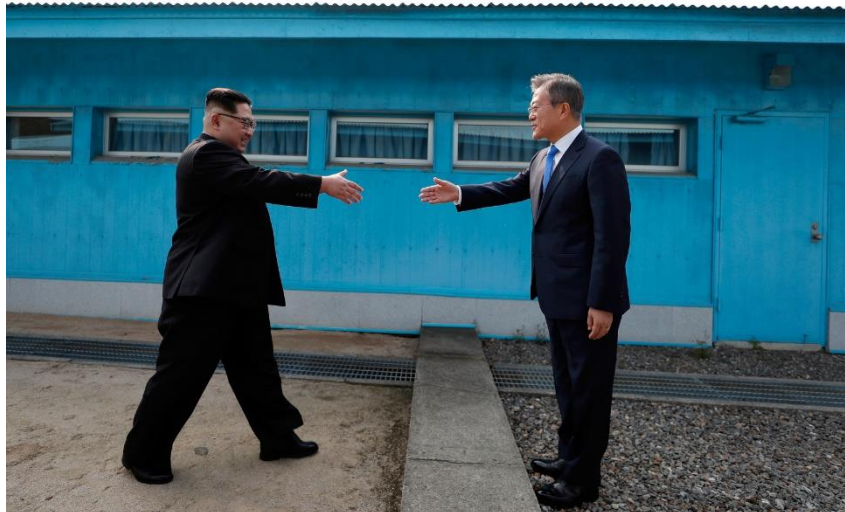
ภาพที่ 17 ประธานาธิบดีมุนแจอิน(ขวา) รอจับมือกับผู้นำคิมจองอึน(ซ้าย) บริเวณเส้นแบ่งพรมแดน ณ เขตปลอดทหาร ปันมุนจอม

โดยเพิ่มประเทศจีน) เพื่อตกลงสันติภาพแทนการตกลงสงบศึก และยืนยันเป้าหมายร่วมกันในการทำ ให้คาบสมุทรเกาหลีปลอดอาวุธนิวเคลียร์อย่างแท้จริง