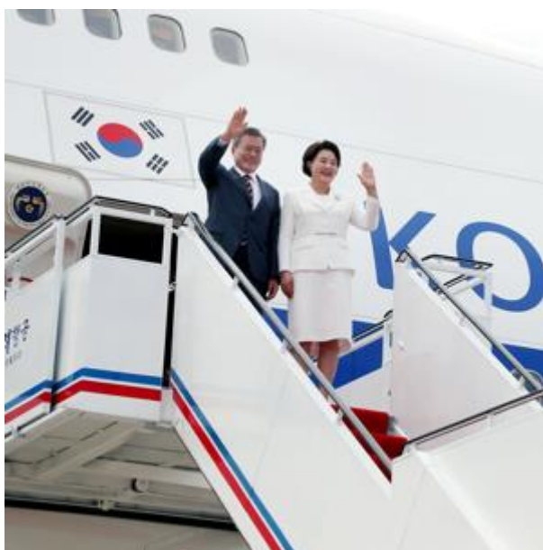
ภาพที่ 20 ประธานาธิบดีมุนแจอิน(ซ้าย) และสตรีหมายเลข 1 (ภริยา ขวา) โบกม็อรัลลา เตรียมกลับประเทศเกาหลีใต้หลังเสร็จสิ้นการประชุมสุดยอดผู้นำเกาหลี 2018

ในการประชุมสุดยอดผู้นำเกาหลีที่เมืองเปียงยาง ทั้ง 2 ฝ่ายเห็นว่าหลังจากการประชุมที่ป็นมุนจอม ความร่วมมือ การแลกเปลี่ยน และการลดความตึงเครียดทางการทหารระหว่างประเทศเกาหลีเหนือและประเทศเกาหลีใต้เป็นไปได้เป็นไปในทิศทางที่ดีขึ้น และทั้ง 2 ฝ่ายได้ลงนามร่วมกันในแถลงการณ์ร่วมกรุงเปียงยาง กันยายน 2018 (Pyongyang Joint Declaration of September 2018) ซึ่งย้ำถึงการยึดมั่นในเอกราชและการกำหนดอนาคตของประเทศเกาหลี การพัฒนาความสัมพันธ์ระหว่างกันอย่างต่อเนื่อง เพื่อความปรองดองและความร่วมมือ ความมั่งคั่งและสันติภาพที่มั่นคง โดยผ่านมาตรการต่าง ๆ ที่จะรวมประเทศเกาหลีเข้าด้วยกัน