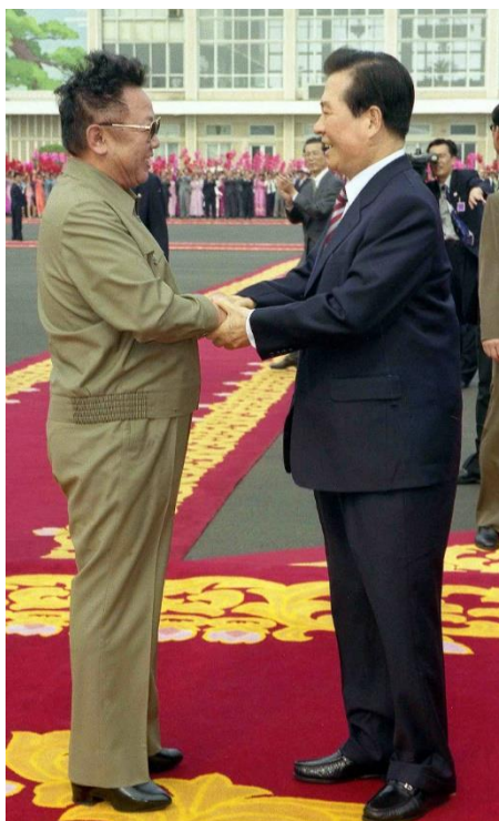
ภาพที่ 14 คิมแดจุง(ขวา) จับมือบอกลาคิมจองอิล(ซ้าย) หลังเสร็จ สิ้นการประชุมสุดยอดผู้นำเกาหลีและจะเดินทางกลับ เมืองโซล ประเทศเกาหลีใต้

ณ เมืองเปียงยาง ประเทศเกาหลีเหนือ เพื่อเข้าร่วมการประชุมสุดยอดผู้นำเกาหลี