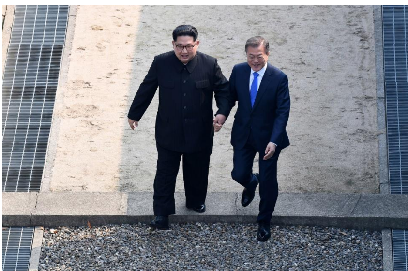
ภาพที่ 18 ประธานาธิบดีมุนแจอิน(ขวา) จับมือกับผู้นำคิมจองอึน(ขวา) พาก้าวผ่านเขตพรมแดนเข้าสู่ประเทศเกาหลีใต้ ที่มา: https://edition.cnn.com/interactive/2018/04/world/korea-summit-cnnphotos/

ที่มา: https://edition.cnn.com/interactive/2018/04/world/korea-summit-cnnphotos/