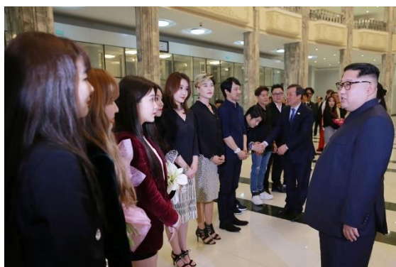
ภาพที่ 16 ศิลปินจากประเทศเกาหลีใต้ วง ‘Red Velvet’ ร่วมแสดงที่เมืองเปียงยาง ประเทศเกาหลีเหนือ

คณะศิลปินจากประเทศเกาหลีใต้ได้จัดการแสดง 2 ครั้งในเมืองเปียงยางภายใต้ชื่องานว่า ‘Spring Comes’