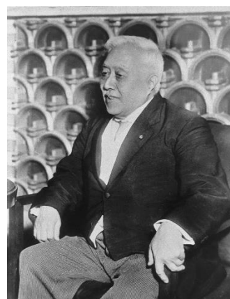
ภาพที่ 5 ซาอิตะ มาโกโตะ ผู้สำเร็จราชการญี่ปุ่น

การควบคุมเศรษฐกิจ เป้าหมายเศรษฐกิจจากนโยบายของทางฝ่ายประเทศญี่ปุ่นคือ การเป็นแหล่งสนับสนุนอุตสาหกรรมของญี่ปุ่นเอง เป็นพื้นที่ตลาดระบายสินค้า และเป็นแหล่งสนับสนุนด้านวัตถุดิบและอาหารแก่ประชากรญี่ปุ่นที่เพิ่มขึ้น มีมาตรการควบคุมที่ชื่อว่า ‘กฎหมายการประกอบธุรกิจ’ (Company Law) บังคับใช้ในปีคริสต์ศักราช 1911 เพื่อกำหนดแผนธุรกิจ กล่าวคือ หากจะประกอบการธุรกิจใดต้องผ่านการยอมรับจากทางรัฐบาลเสียก่อนที่จะเริ่มประกอบการ หรือเปิดสาขา โดยมาตรการนี้ส่งผลให้ผู้ประกอบการรายย่อยชาวเกาหลีโดนขจัด และเปิดโอกาสให้นายทุนจากญี่ปุ่นเข้ามาประกอบธุรกิจในเกาหลี ต่อมาในช่วงที่ซาอิตะ มาโกโตะ (Saito Makoto) ผู้สำเร็จราชการญี่ปุ่นได้ผ่อนคลายการควบคุมด้านเศรษฐกิจในช่วงหลังปีคริสต์ศักราช 1919 โดยกำหนดหลักการขึ้น 2 ประการ