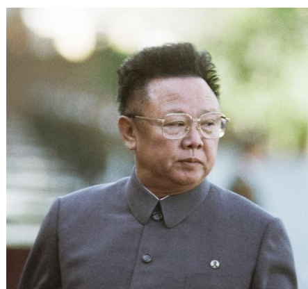
ภาพที่ 12 คิมจองอิล ผู้นำแห่งประเทศเกาหลีเหนือปี คริสต์ศักราช 1994 - 2011

http://www.nobelpeacesummit.com/project/kim-dae-jung/