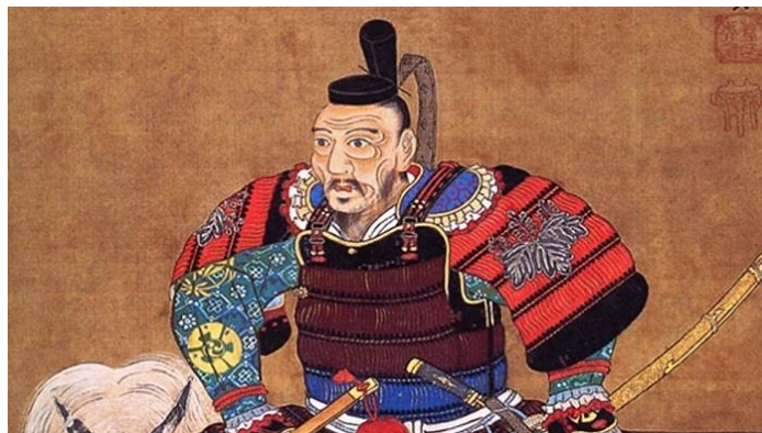
ภาพที่ 2 นายพลโตโยโตมิ อีเดโยชิ

ปีคริสต์ศักราช 1590 โดยยื่นข้อเรียกร้องให้เปิดประเทศเพื่อทำการค้าขายและยอมให้กองทัพของประเทศญี่ปุ่นผ่านเกาหลีเพื่อไปโจมตีประเทศจีน แต่ทางเกาหลีปฏิเสธ ทำให้นายพลอียูชิส่งกองทัพเข้าตีประเทศเกาหลีในเดือนเมษายน ปีคริสต์ศักราช 1592 ชื่อว่า ‘สงครามอิมจิน’ (Imjin War) ซึ่งประเทศญี่ปุ่นได้พ่ายแพ้ต่อสงครามในครั้งนี้ ต่อมาเดือนกันยายน ปีคริสต์ศักราช 1598 นายพลอียูชิได้เสียชีวิตลง ส่งผลให้ประเทศญี่ปุ่นถอนกำลังออก