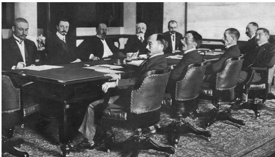
ภาพที่ 3 การประชุมเจรจาสงบศึกระหว่างประเทศรัสเซียและประเทศญี่ปุ่น

แต่การเมืองภายในราชวงศ์โชซอนตอนปลายมีความเข้มข้นมากขึ้นจากการแข่งขันกันเพื่อแย่งอำนาจระหว่างฝ่ายนิยมประเทศญี่ปุ่นและฝ่ายนิยมประเทศรัสเซีย กล่าวคือ ในเดือนกุมภาพันธ์ปีคริสต์ศักราช 1896 ฝ่ายนิยมประเทศรัสเซียลักพาตัวพระเจ้าโกจงและอุปราชไปประทับที่ทำการคณะทูตรัสเซีย บุคคลสำคัญฝ่ายนิยมญี่ปุ่นถูกลอบสังหาร บางส่วนก็ลี้ภัยไปประเทศญี่ปุ่น ทำให้ฝ่ายนิยมรัสเซียขึ้นตำแหน่งแทน ประเทศญี่ปุ่นและประเทศรัสเซียสู้รบกันที่เมืองท่าอาร์เทอร์ในเดือนกุมภาพันธ์ ปีคริสต์ศักราช 1904 เนื่องจากประเทศรัสเซียไม่ตอบสนองแก่ข้อเรียกร้องของฝ่ายญี่ปุ่น และประเทศรัสเซียได้เป็นฝ่ายที่พ่ายแพ้แก่สงครามในครั้งนั้น ส่งผลให้ทั้ง 2 ฝ่ายลงนามสนธิสัญญาพอร์ตสมัท (Treaty of Portsmouth) โดยรัสเซียรับรองผลประโยชน์ของประเทศญี่ปุ่นในดินแดนประเทศเกาหลีและไม่ขัดขวางญี่ปุ่นในการดำเนินมาตรการเพื่อควบคุมและคุ้มครองต่อ รัฐบาลเกาหลี