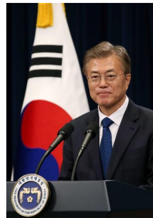
ภาพที่ 15 มุนแจอิน ประธานาธิบดีแห่งเกาหลีใต้คนที่ 12

มุนแจอิน (อังกฤษ : Moon Jae-in เกาหลี : 문재인) เกิดวันที่ 24 มกราคม คริสต์ศักราช 1953 ที่ศูนย์อพยพเมืองคองเจ จังหวัดปูซาน ประเทศเกาหลีใต้ โดยพ่อแม่ของมุนแจ-อินเป็นผู้ที่ลี้ภัยมาจากประเทศเกาหลีเหนือก่อนการรุกรานจากประเทศจีน ในช่วงฤดูหนาวของปีคริสตศักราช 1950 ซึ่งเป็น 1 ใน 100,000 พลเรือนที่อพยพในช่วงสงครามเกาหลีจากเมืองฮึงนัม ประเทศเกาหลีเหนือ ผ่านทาง ‘Christmas Cargo’ (ยาน sealift ขนาดใหญ่) ได้เข้าศึกษาระดับมัธยมที่ โรงเรียนมัธยมคยองนัม และเข้าศึกษาระดับมหาวิทยาลัยที่ มหาวิทยาลัยคยองฮี ทางด้านกฎหมาย ในปีคริสตศักราช 1972 ซึ่งช่วงที่กำลังศึกษาอยู่เขาถูกจับกุมและขับไล่ออกจากมหาวิทยาลัยในข้อหา ‘ดำรงตำแหน่งผู้จัดการนักศึกษาเพื่อประท้วงต่อต้านรัฐธรรมนูญชิน’ ต่อมาในปีคริสตศักราช 1975 ได้ถูกบังคับให้เข้าร่วมกองทัพและถูกเกณฑ์ไปร่วมกับหน่วยรบพิเศษ หลังปลดประจำการในปีคริสตศักราช 1978 ก็ได้สำเร็จการศึกษาเป็นเนติบัณฑิต และได้รับการตอบรับเข้าสถาบันวิจัยตุลาการ แต่ไม่สามารถทำงานในฐานะผู้พิพากษาได้ เนื่องจากกรณีที่มุนแจ-อินได้โดนขับไล่ออกจากมหาวิทยาลัยในข้อหาการเป็นผู้นำประท้วงของกลุ่มนักศึกษานั้นเอง