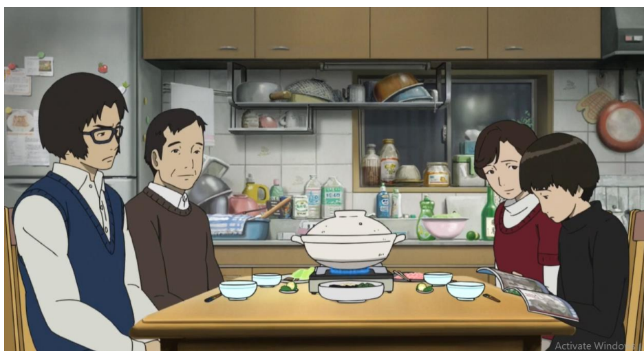
ภาพที่ 6 การพูดคุยระหว่างกินข้าวร่วมกันในครอบครัว

จากฉากในภาพยนตร์เรื่องนี้ ที่ตัวละครแม่ได้พูดว่า “ปกติพ่อจะกลับมาไม่ทันกินข้าวด้วยกัน แต่เดี๋ยวนี้พ่อกลับมาทันตลอด” และพี่ชายได้พูดว่า “ปกติแม่จะกินอาหารแบบสำเร็จรูปตลอด แต่หลังจากเกิดเหตุการณ์นั้น แม่ก็ทำอาหารมาตลอด” แสดงให้เห็นถึงการใช้ชีวิตที่ขาดการอยู่กันอย่างเป็นครอบครัวก่อนหน้านี้ ซึ่งอาจเป็นส่วนหนึ่งที่มาโคโตะนั้นตัดสินใจฆ่าตัวตาย