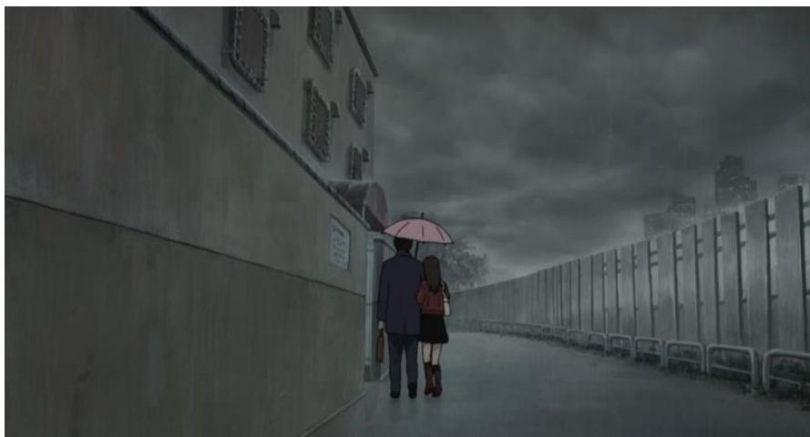
ภาพที่ 3 อิโรกะเดินเข้าโรงแรมกับชายวัยกลางคน

จากฉากในภาพยนตร์ที่อิโรกะขายบริการให้ชายวัยกลางคนเพื่อแลกกับเงินหรือวัตถุนิยม