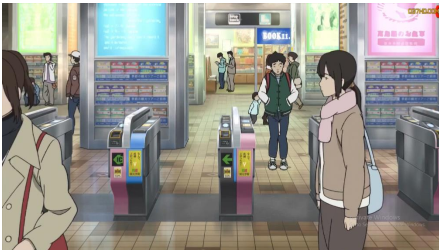
ภาพที่ 1 ประเทศญี่ปุ่นในปัจจุบัน

จากฉากในภาพยนตร์ฉากนี้ แสดงให้เห็นถึงการใช้ชีวิตของคนญี่ปุ่นที่ส่วนใหญ่ต่างคนต่างอยู่ ขาดการมีปฏิสัมพันธ์กัน