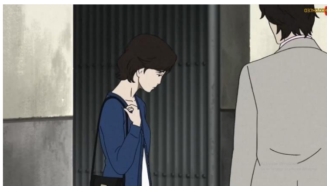
ภาพที่ 7 แม่ของมาโคโตะเดินออกจากโรงแรมมากับครูสอนเต้น

จากฉากที่มาโคโตะบังเอิญเห็นแม่ของเขาเดินออกมาจากโรงแรมกับครูสอนเต้นฟลามิงโก้ ทำให้เขาเกิดความผิดหวัง ซึ่งเป็นความเจ็บปวดทางอารมณ์ที่เกิดจากรู้สึกสูญเสีย ความสิ้นหวัง การไร้ความช่วยเหลือ ความหมดหวัง และความเสียใจ เหมือนโลกทั้งใบของเขานั้นพังทลายและเขานั้นกลายเป็นคนเงียบหรือเซื่องซึมเก็บตัวจากผู้อื่น