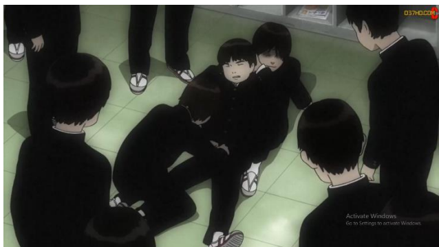
ภาพที่ 4 มาโคโตะถูกเพื่อนในห้องแกล้ง

เห็นได้จากตัวละครมาโคโตะที่มีนิสัยเงียบขรึมและรักสงบ จึงทำให้ไม่มีเพื่อนและมีคนคอยกลั่นแกล้งจนได้รับบาดเจ็บและอับอายอยู่บ่อยครั้ง